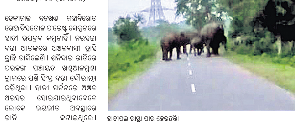
ହାତୀପଲ ରାସ୍ତା ପାର ହେଉଛି।