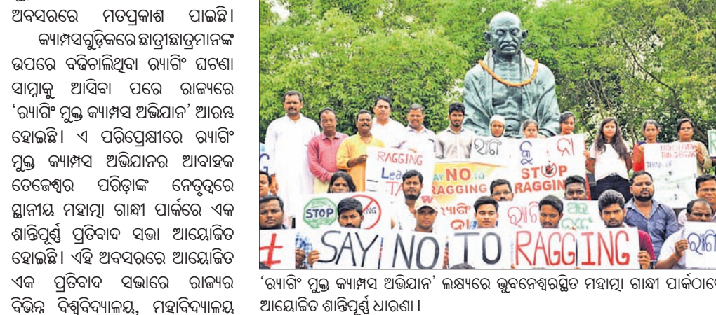
'ରା୍ୟାଗିଂ' ମୁକ୍ତ କ୍ୟାମ୍ପସ ଅଭିଯାନ' ଲକ୍ଷ୍ୟରେ ଭୁବନେଶ୍ୱରସ୍ଥିତ ମହାତ୍ମା ଗାନ୍ଧୀ ପାର୍କରେ ଆୟୋଜିତ ଶାନ୍ତିପୂର୍ଣ୍ଣ ଧାରଣା।

ଭୁବନେଶ୍ୱର, ୨୫। (ବ୍ୟୁରୋ) ରା୍ୟାଗିଂ ଘଟଣା ନିରନ୍ତର ଆସିଲେ ମୁଁ ବନ୍ଦ ନ ରଖି ଏହା ବିରୋଧରେ ସ୍ତର ଉତ୍ତୋଳନ କର। ଉକ୍ତ ଶିକ୍ଷାନୁଷ୍ଠାନ ସହ ଜଡ଼ିତ କର୍ମୀମାନଙ୍କୁ ଏ ବିଷୟରେ ଅବଗତ କର, ଆବଶ୍ୟକ ପଦକ୍ଷେପ ଗ୍ରହଣ କରିବା ପାଇଁ ଅଭିଯୋଗ କର।