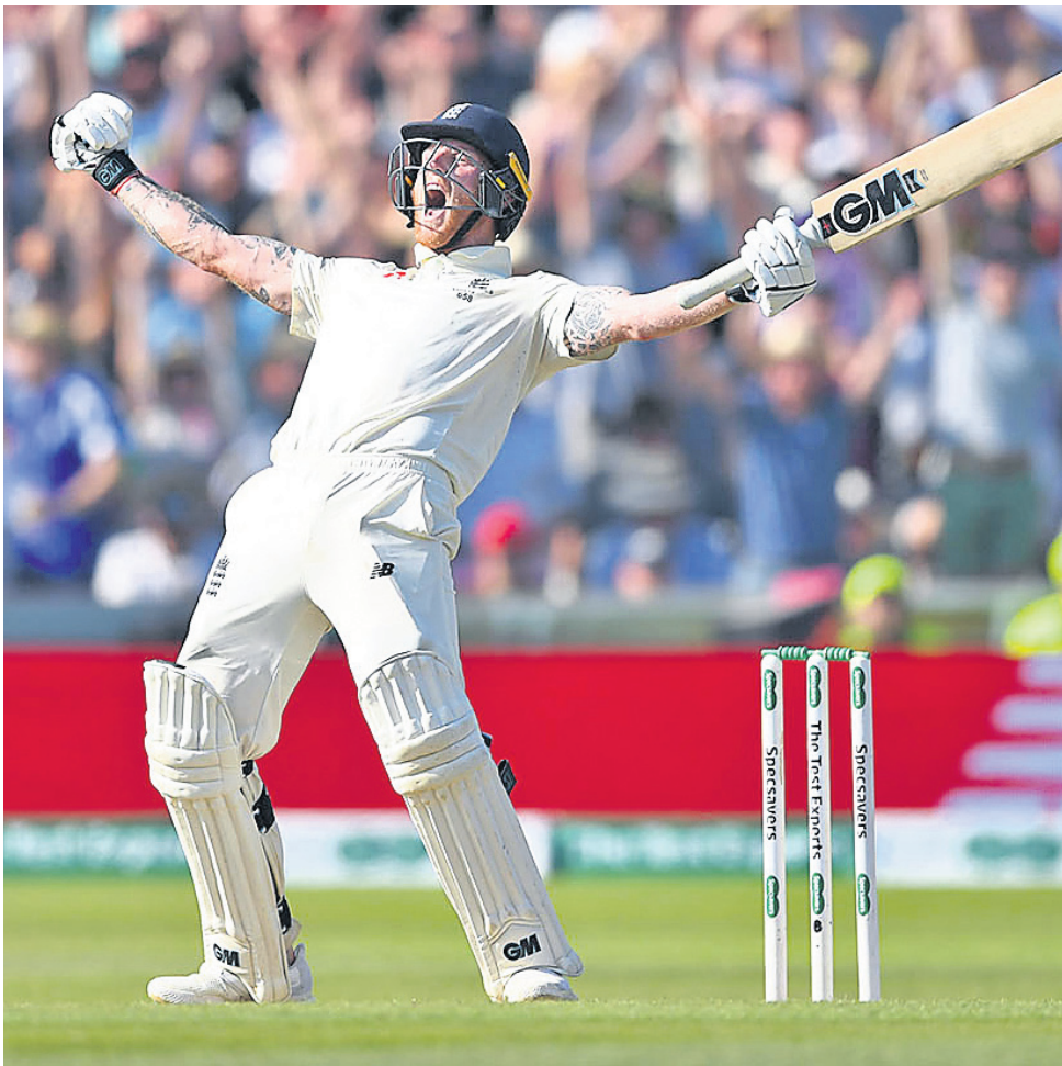
ଅପରାଜିତ ଶତକୀୟ ଇନିଂସ ଖେଳ ଇଂଲଣ୍ଡକୁ ଜିତାଇ ଥିବା ବେନ୍ ଷ୍ଟୋକ୍ସ ।

ସ୍ଥାନୀୟ ହେଡିଂଲାଇନରେ ଅନୁଷ୍ଠିତ ତୃତୀୟ ଆଶେସ ଟ୍ରେନିଂ ଟେଷ୍ଟ ମ୍ୟାଚରେ ରୋମାଞ୍ଚକ ପରିସମାପ୍ତ ହୋଇଛି। ବେନ୍ ଷ୍ଟୋକ୍ସଙ୍କ ଲଢୁଆ ଅପରାଜିତ ଶତକ (୧୩୫*) ଯୋଗୁ ଇଂଲଣ୍ଡ ୧ ଉଇକେଟରେ ଅଷ୍ଟ୍ରେଲିଆକୁ ପରାସ୍ତ କରିଛି। ଫଳରେ ଦୁଇ ଦଳ ମଧ୍ୟରେ ଚାଲିଥିବା ୫ ମ୍ୟାଚ ବିଶିଷ୍ଟ ସିରିଜ ୧-୧ ସ୍ତରକୁ ଚାଲିଯାଇଛି। ଇଂଲଣ୍ଡ ୩୫୯ରନର କଷ୍ଟସାଧ୍ୟ ବିଜୟ ଲକ୍ଷ୍ୟ ପଛା କରିଥିବା ବେଳେ ବେକେଟ୍ ଷ୍ଟୋକ୍ସ ଓ ଜର୍ଜ ବେୟାରଣ୍ଟୋ (୩୬)ଙ୍କ ମଧ୍ୟରେ ୫ମ ଉଇକେଟରେ ମହତ୍ତ୍ୱପୂର୍ଣ୍ଣ ୮୬ ରନର ପାର୍ଟନରଶିପ୍ ହୋଇଥିଲା। ମାତ୍ର ଏହି ଯୋଡ଼ିକୁ କୋର୍ଟ୍ ହାକେଲଭେଟ୍ ଭାଙ୍ଗି ଦେଇଥିଲେ। ସେ ବେୟାରଣ୍ଟୋଙ୍କୁ ମାର୍ନିସ ଲବୁସେନ୍ଙ୍କ ଦ୍ୱାରା କ୍ୟାଚ ଆଉଟ କରିଦେଇଥିଲେ। ଷ୍ଟୋକ୍ସ ଗୋଟିଏ ପାର୍ଟିରେ କ୍ରିକେଟ ଜମି ରହିଥିବାବେଳେ ଅନ୍ୟପକ୍ଷେ ଜମି ପରେ ଜଣେ ଶୀଘ୍ର ଆଉଟ ହୋଇ ପ୍ୟାଭିଲିୟନକୁ ଫେରିବାରେ ଲାଗିଥିଲେ। ପରେ ବ୍ୟାଟିଂ କରିବାକୁ ଆସିଥିବା କୋର୍ଟ୍ ବଟଲର ଏବଂ କ୍ରିସ୍ ଓକ୍ସ ମାତ୍ର ୧ ରନ ଲେଖାଏ କରିଥିଲେ। କୋର୍ଟ୍ ଆର୍ଟର ୧୫ରନ କରିଥିବାବେଳେ ଷ୍ଟୁଆର୍ଟ ବ୍ରୁକ୍ ବିନା କୌଣସି ରନରେ କେମ୍ପୁ ପ୍ୟାଟିନସନଙ୍କ ଦ୍ୱାରା ଏଲବିଡବ୍ଲ୍ୟୁ ହୋଇଥିଲେ। ତେବେ ଷ୍ଟୋକ୍ସ ଏବଂ ଜ୍ୟାକ ଲିଟ୍ (୧୯)ଙ୍କ ମଧ୍ୟରେ ଅଧିକ ଉଇକେଟରେ ୯୬ ରନର ଅପରାଜିତ ପାର୍ଟନରଶିପ୍ ହୋଇଥିଲା। ଷ୍ଟୋକ୍ସ ତାଙ୍କ ଅପରାଜିତ ଲଢୁଆ ଇନିଂସରେ ୨୧୯ ବଲ୍ ସମ୍ମୁଖୀ କରିଥିଲେ। ସେ ୧୧ ଟେନିସ ଓ ୮ ଛକା ଲଗାଇଥିଲେ। ଇଂଲଣ୍ଡ ଏହାର ଦ୍ୱିତୀୟ ଇନିଂସରେ