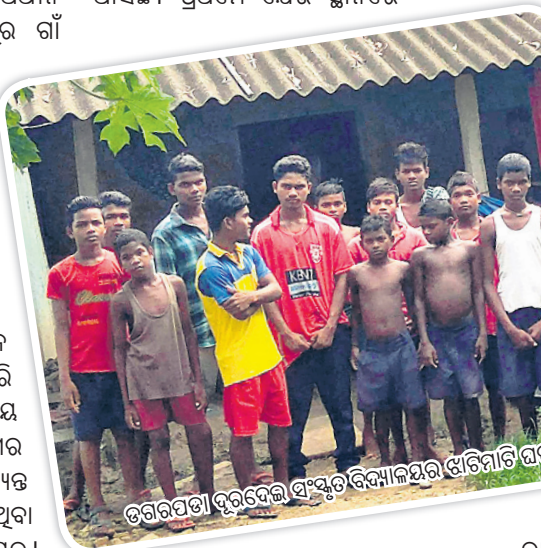
ତରବରପଡ଼ା ଦୂରଦେଇ ସଂସ୍କୃତ ବିଦ୍ୟାଳୟର ଝାଡ଼ିମାଟି ଘର।

ଭଦ୍ରକବନ୍ଧୁ ପଣ୍ଡା ଖରା, ୨୫।୮ ୧୯୮୮ରେ ପ୍ରତିଷ୍ଠା ଲାଭ କରିଥିବା ଦୂରଦେଇ ସଂସ୍କୃତ ବିଦ୍ୟାଳୟ ଆରମ୍ଭରୁ ଅନେକ ସଂଘର୍ଷ ପଥ ଦେଇ ଗତି କରି ଆସିଛି। ପ୍ରଥମେ ଯେଉଁ ସ୍ଥାନରେ ବାଲେଶ୍ୱର ଜିଲ୍ଲା ଖଇରା ବୁକ ଅଧୀନ ତରବରପଡ଼ା ପଞ୍ଚାୟତ ପରୁଷୋତ୍ତମପୁର ଗାଁ ଶେଷମୁଣ୍ଡରେ ରହିଛି ଦୂରଦେଇ ସଂସ୍କୃତ ବିଦ୍ୟାଳୟ। ୩୧ବର୍ଷ ତଳେ ସଂସ୍କୃତ ଶିକ୍ଷାର ପ୍ରଚାର ପ୍ରସାର ଲାଗି ଗଠି ଉଠିଥିଲା ଏହି ଶିକ୍ଷାନୁଷ୍ଠାନ। ଗାଁ ମୁଣ୍ଡରେ ଥିବା ଏକ ୩ କୋଠରି ବିଶିଷ୍ଟ ଚାକ ଘରେ ପିଲାଙ୍କୁ ପାଠପଢ଼ା ଯାଉଛି। ସେହି କୋଠରିକୁ ମଧ୍ୟ ଛାତ୍ରାବାସ ଭାବେ ବ୍ୟବହାର କରାଯାଉଛି। ବର୍ତ୍ତମାନ ୧୧୯ ଅନ୍ତେବାସୀ ଅଧ୍ୟୟନ କରୁଛନ୍ତି। ଝାଡ଼ିମାଟିରେ ତିଆରି ଆକସେସ୍‌ସ୍ ଛପର ତଳେ ବିଦ୍ୟାଳୟ ଚାଲିଥିଲେ ମଧ୍ୟ ଏଥିପ୍ରତି ଶିକ୍ଷା ବିଭାଗର ନଜର ନାହିଁ। ୬ଷ୍ଠରୁ ୧୦ମ ପର୍ଯ୍ୟନ୍ତ ଶ୍ରେଣୀ ମଧ୍ୟରେ ଏଠାରେ ପାଠ ପଢ଼ୁଥିବା ପିଲାମାନେ ସମସ୍ତେ ଜନଜାତି ସମ୍ପ୍ରଦାୟର। ସୁଦୂର ମୟୂରଭଞ୍ଜ ଜିଲ୍ଲାକୁ ଏଠାକୁ ପାଠ ପଢ଼ିବାକୁ ଆସି ଦୁର୍ଦ୍ଦଶାମୟ ଜୀବନ ବିତାଉଛନ୍ତି। ସେହି ଜାଗାକୁ ନେଇ ବିବାଦ ଉପୁଜିବାରୁ ପରେ