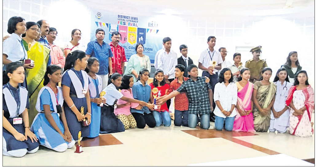
ଅତିଥି ଓ କର୍ମକର୍ତ୍ତାଙ୍କ ସହ ପୁରସ୍କୃତ ଛାତ୍ରାଛାତ୍ରୀ।

ଅନୁଗୋଳ ଅଫିସ, ୨୫। ଛାତ୍ରାଛାତ୍ରୀମାନଙ୍କ ମଧ୍ୟରେ ଆଇନ ସଚେତନତା ସୃଷ୍ଟି ଉଦ୍ଦେଶ୍ୟରେ ବିଦ୍ୟାଳୟଗୁଡ଼ିକରେ ଗଢ଼ାଯାଇଥିବା ଲିଗାଲ୍ ଲିଟ୍ରେସି କୁଳମାନଙ୍କ ମଧ୍ୟରେ ନାଟକ ପ୍ରତିଯୋଗିତା ଅନୁଷ୍ଠିତ ହୋଇଯାଇଛି। ଜିଲ୍ଲା ଆଇନସେବା ପ୍ରାଧିକରଣ ପକ୍ଷରୁ ଅନୁଗୋଳ ଜିଲ୍ଲା ପରିଷଦ ସମ୍ମିଳନୀ କକ୍ଷରେ ଏହାର ଆୟୋଜନ କରାଯାଇଥିଲା। ଏଥିରେ