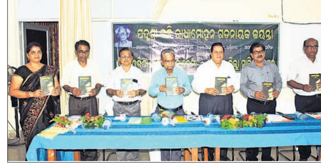
ଅନୁଗୋଳ ଅଫିସ, ୨୫।