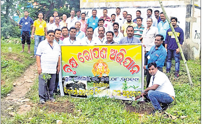
ଅନୁଗୋଳ ଅଫିସ, ୨୫।

ପରିବେଶ ପ୍ରଦୂଷଣ ମୁକ୍ତ ଅଭିଯାନ ପାଇଁ ବିଶ୍ୱକର୍ମା ଘରୋଇ ଠିକାଦାର ସଂଘ ପକ୍ଷରୁ ରବିବାର ଚାରାଚୋପଣ କାର୍ଯ୍ୟକ୍ରମ ଅନୁଷ୍ଠିତ ହୋଇଯାଇଛି। ଶିକ୍ଷକପତ୍ନୀ ଛକଠାରୁ ରେକର୍ଡ଼େଶନ ପର୍ଯ୍ୟନ୍ତ ୨୦୦ ଚାରା ସଂଘ ପକ୍ଷରୁ ଲଗାଯାଇଛି। ମୁଖ୍ୟଅତିଥି ଭାବେ