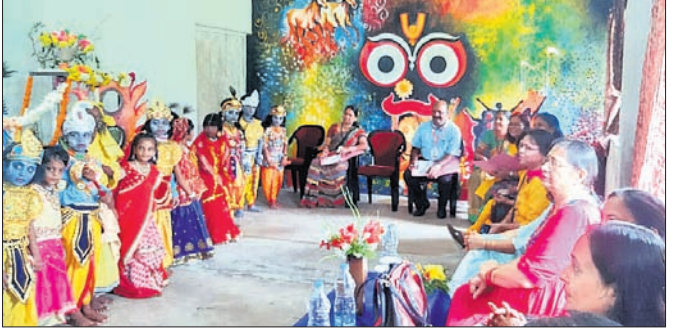
ଛାତ୍ରାଛାତ୍ରୀମାନେ ରାଧାକୃଷ୍ଣ ବେଶରେ ସଜେଇ ହୋଇଛନ୍ତି।

ଛାତ୍ରାଛାତ୍ରୀ ଶ୍ରୀକୃଷ୍ଣ ଓ ରାଧାଙ୍କ ବେଶ ହୋଇ ନୃତ୍ୟ ଓ ଶ୍ଳୋକ ଗାନ କରିଥିଲେ। ପରେ ୮୦ ଜଣ କୃତୀ ଛାତ୍ରାଛାତ୍ରୀଙ୍କୁ