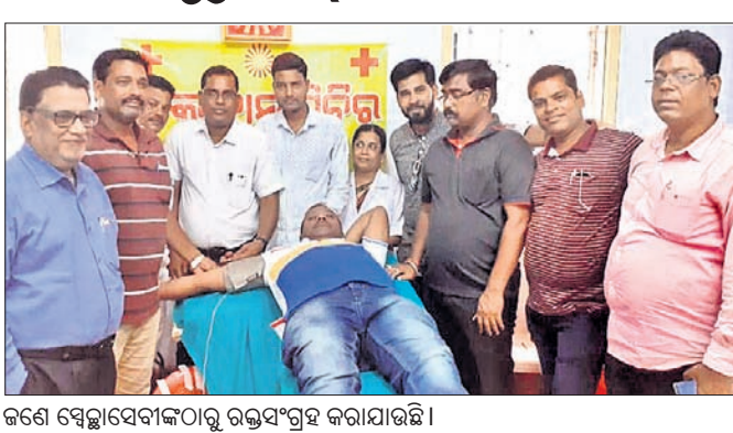
ଜଣେ ସ୍ୱେଚ୍ଛାସେବୀଙ୍କଠାରୁ ରକ୍ତସଂଗ୍ରହ କରାଯାଇଛି।