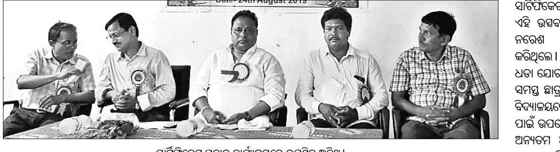
ସାର୍ବିଫିକେଟ ପ୍ରଦାନ କାର୍ଯ୍ୟକ୍ରମରେ ଉପସ୍ଥିତ ଅତିଥି।

ବାହାନଗା ବ୍ଲକ୍ ଗୋପାଳପୁର ମହାବିଦ୍ୟାଳୟ ପରିସରରେ ରାଷ୍ଟ୍ରୀୟ ମୁକ୍ତ ବିଦ୍ୟାଳୟର ଶିକ୍ଷା ସଂସ୍ଥାନ (ଏନଆଇଓଏସ) ପରୀକ୍ଷାରେ କୃତ୍ରିମ ଲାଭ କରିଥିବା ଛାତ୍ରାଛାତ୍ରୀ ଓ ଶିକ୍ଷୟିତ୍ରୀ ଶିକ୍ଷକମାନଙ୍କୁ ସାର୍ବିଫିକେଟ ପ୍ରଦାନ କରାଯାଇଛି। ନ୍ୟାଶନାଲ୍ ଜନଶ୍ରେଣୀ ଅଫ୍ ଓପନ୍ ସ୍କୁଲ୍ (ଏନ୍‌ଆଇଓଏସ) ଅଧୀନରେ ୮୫ ଜଣ ଛାତ୍ରାଛାତ୍ରୀ ଓ ଶିକ୍ଷୟିତ୍ରୀ ଶିକ୍ଷକ ପ୍ରମୁଖ ନାମ ଲେଖାଇ ପରୀକ୍ଷା ଦେଇଥିଲେ। ଗୋପାଳପୁର ମହାବିଦ୍ୟାଳୟରୁ ସରକାର ଷ୍ଟୁଡିଏଣ୍ଟସ୍