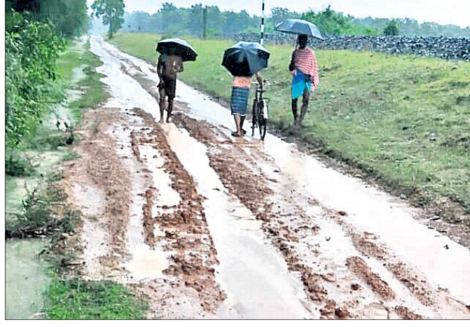
ପାଣିକାପୁଅରେ ଭର୍ତ୍ତି ଭଗବାନପୁର-ବାମଡ଼ା ଲିଙ୍କ ରୋଡ଼।