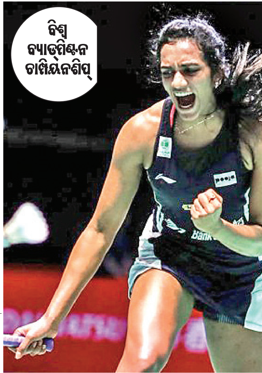
ବିଶ୍ୱ ବ୍ୟାଡମିଣ୍ଟନ ଚାମ୍ପିୟନଶିପ୍