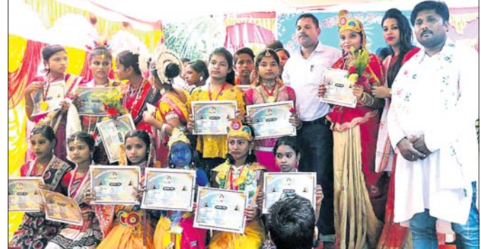
କୃତୀ ପ୍ରତିଯୋଗୀଙ୍କୁ ପୁରସ୍କୃତ କରାଯାଇଛି।