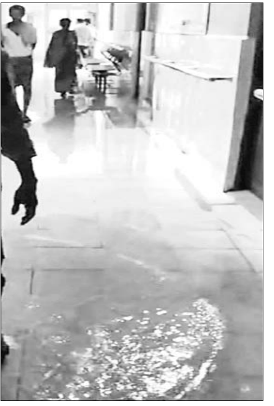
ନର୍ଦ୍ଦମା ପାଣିରେ ପଶି ରୋଗୀ ଆସୁଛନ୍ତି।

ପରିବେଶ ସୃଷ୍ଟି ହୋଇଥିଲା। ଖବରପାଇ ହସ୍ପିଟାଲର ସଫେଇ କର୍ମଚାରୀ ପହଞ୍ଚି ସଫେଇ କାର୍ଯ୍ୟ କରିଥିଲେ। ହସ୍ପିଟାଲ ଭିତରେ ସ୍ୱଚ୍ଛତା ପାଇଁ ଅର୍ଥବ୍ୟୟ ହେଉଥିବା ବେଳେ ଏହା ମଧ୍ୟ ଠିକ୍ ଭାବେ କାର୍ଯ୍ୟକାରୀ ହେଉନାହିଁ କିମ୍ବା ବିଭାଗୀୟ ଅଧିକାରୀମାନେ ଏହାକୁ ଆଖି ବୁଜି ଦେଉଥିବା ଜଣାଯାଇଛି। ପାଖରେ ଥିବା ଡ୍ରେନ୍‌କୁ ନିୟମିତ ସଫେଇ କରାଯାଉନାହିଁ। ଏହି ଦୃଷ୍ଟି ପାଣିରେ ପଶି ଲୋକେ ଯାତାୟାତ କରିଥିଲେ। ଏଭଳି ଦୁର୍ଗନ୍ଧ ମଧ୍ୟରେ ରହିବା କାଠିକର ବୋଲି ଚିକିତ୍ସାଧୀନ ରୋଗୀମାନେ ଅଭିଯୋଗ କରିଛନ୍ତି। ଏସବୁ ସମସ୍ୟା ପ୍ରତି ସ୍ୱାସ୍ଥ୍ୟ ବିଭାଗର ଅଧିକାରୀ ଦୂରତ ଦୃଷ୍ଟି ଦେବାକୁ ସାଧାରଣରେ ଦାବି ହୋଇଛି।