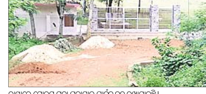
ରାସ୍ତାରେ ମୋରମ ଗଦା ପକାଯାଇ ପାର୍କକୁ ବନ୍ଦ ରଖାଯାଇଛି।