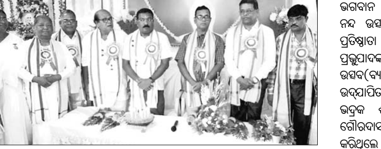
ବନ୍ଧୁତ୍ୱ ଦିବସ ଅବସରରେ ଉପସ୍ଥିତ ଅତିଥି।