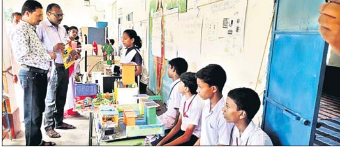
ଛାତ୍ରୀଛାତ୍ର ପ୍ରକଳ୍ପ ପ୍ରଦର୍ଶନ କରୁଛନ୍ତି ।