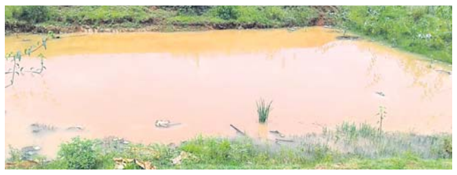
ପୋଖରୀରେ ମୂର୍ତ୍ତି ଛାଡ଼ି ଭାସୁଛି ।

ଆହୁରି ପାର୍ବଣ ରତ୍ନ ଆଗକୁ ବିଭିନ୍ନ ପୂଜା ପରେ ମୁଖ୍ୟ ମୂର୍ତ୍ତି ବିସର୍ଜନ କରାଯିବ । ସେଥିପାଇଁ ପ୍ରଶାସନ ପୂର୍ବରୁ ସଜାଗ ରହିବା ଦରକାର । କିନ୍ତୁ ଚମ୍ପୁଆ ଏନଏସିରେ ଏହାର ବ୍ୟତିକ୍ରମ ଦେଖିବାକୁ ମିଳିଛି ।