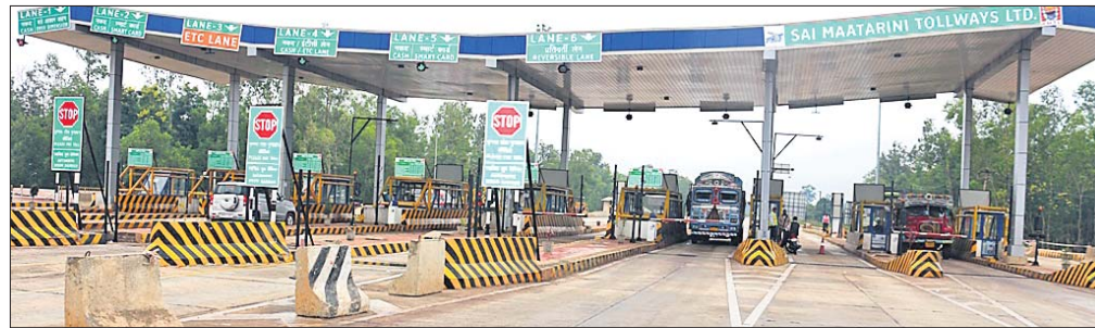
ବନାଯୋଡ଼ି ଟୋଲଗେଟ୍ ।

ଜାତୀୟ ରାଜପଥ ୨୦ ସମ୍ପ୍ରଦାୟର କାର୍ଯ୍ୟ ଏକ ଠିକା କମ୍ପାନୀକୁ ଜାତୀୟ ରାଜପଥ ପ୍ରାଧିକରଣ ପକ୍ଷରୁ ରୁକ୍ତିନାମା କରାଯାଇ ନୂତନ ଭାବେ ନିର୍ମାଣ ପାଇଁ ଦିଆଯାଇଥିଲା । ପାଣିକୋଇଲିଠାରୁ ରିପୁଲି ପର୍ଯ୍ୟନ୍ତ ୧୬୬.୧୭୩ କି.ମି. ରାସ୍ତା ବୋଲି ଜଣାଯାଇଛି । ତେବେ ରାସ୍ତା ସମ୍ପୂର୍ଣ୍ଣ ହୋଇ ନ ଥିବାବେଳେ ୨୦୧୭ ଅଗଷ୍ଟରେ କେନ୍ଦୁଝର ଜିଲ୍ଲାରେ ତିନୋଟି ସ୍ଥାନ ଆନନ୍ଦପୁର ଉପକଣ୍ଠ ସମ୍ବନ୍ଧରେ, କେନ୍ଦୁଝର ଉପକଣ୍ଠ ଡେକୋରଟ ନିକଟସ୍ଥ ଖଣ୍ଡପୁର ଓ ବନାଯୋଡ଼ିଠାରେ ତିନୋଟି ଟୋଲଗେଟ ସ୍ଥାପନ କରାଯାଇ ଟୋଲ ଆଦାୟ ଆରମ୍ଭ କରାଯାଇଥିଲା । ଏହି ଟୋଲ ଆଦାୟ ପାଇଁ ସାଇ ମା' ଚାରିଶା ଟୋଲସ୍ଟେଜ ଲିମିଟେଡ୍ ନାମକ କମ୍ପାନୀ ୨୪ବର୍ଷ ପର୍ଯ୍ୟନ୍ତ ଟୋଲ ଆଦାୟ କରିବାର ରୁକ୍ତିନାମା କରିଛି । ତିନୋଟି ଯାକ ଟୋଲଗେଟରେ ବିଭିନ୍ନ ଗାଡ଼ି ନିମନ୍ତେ ଭିନ୍ନ ଭିନ୍ନ ଦରରେ ଟୋଲ ଆଦାୟ କରାଯାଉଛି । ତେବେ ରାସ୍ତା ସମ୍ପୂର୍ଣ୍ଣ କରା ନ ଯାଇ ଟୋଲ ଆଦାୟ କରାଯାଉଥିବାରୁ ଜିଲ୍ଲାର ଜନସାଧାରଣଙ୍କ ମଧ୍ୟରେ ଅସନ୍ତୋଷ ବଢ଼ିବାକୁ ଲାଗିଛି । ଏହାରୁ ନେଇ ଅନେକ ଫୋରମରେ ଆଲୋଚନା,