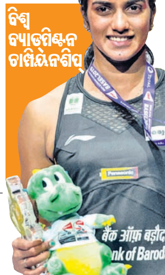
ବିଶ୍ଵ ବ୍ୟାଡ୍ମିନିଷ୍ଟ୍ରନ୍ ଚାକ୍ଷୁଷ୍ୟମାନରେ ସିନ୍ଧୁଙ୍କୁ ସ୍ଵର୍ଣ୍ଣ ପଦକ

ଭାରତର ଚାରକା ମହିଳା ବ୍ୟାଡ୍ମିନିଷ୍ଟ୍ରନ୍ ଖେଳାଳି ପି.ଭି. ସିନ୍ଧୁ ରବିବାର ତାଙ୍କ ଚାକ୍ଷୁଷ୍ୟମାନ କ୍ୟାରିୟରରେ ଆଉ ଏକ ସ୍ଵର୍ଣ୍ଣ ପଦକ ପାଇବା ଯୋଡ଼ିଛନ୍ତି। ସୁଇଜରଲ୍ୟାଣ୍ଡର ବାସେଲଠାରେ ଅନୁଷ୍ଠିତ ବ୍ୟାଡ୍ମିନିଷ୍ଟ୍ରନ୍ ସର୍ବୋଚ୍ଚ ପ୍ରତିଯୋଗିତା ବିତ୍‌ବ୍ୟୁଏର୍ଟ୍ ବିଶ୍ଵ ଚାକ୍ଷୁଷ୍ୟମାନରେ ୨୪ ବର୍ଷୀୟା ସିନ୍ଧୁ ମହିଳା ସିଙ୍ଗଲ୍ ସ୍ଵର୍ଣ୍ଣ ପଦକ ଅର୍ଜନ କରିଛନ୍ତି।