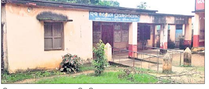
ବିପଦସଙ୍କୁଳ ବ୍ଲକ କଲୋନା ପ୍ରାଥମିକ ବିଦ୍ୟାଳୟ ।

ଡେକୋରଟ ମୁଖ୍ୟାଳୟର ବ୍ଲକ କଲୋନା ପ୍ରାଥମିକ ବିଦ୍ୟାଳୟକୁ ବିପଦସଙ୍କୁଳ ଯୋଗଣ କରାଯାଇଛି । ନୂତନ ଗୃହ ନିର୍ମାଣ ହୋଇ ନ ଥିବା ଯୋଗୁଁ ଉକ୍ତ ବିପଦସଙ୍କୁଳ ଗୃହରେ ପାଠପଢ଼ା ଚାଲିଛି । ଉକ୍ତ ପ୍ରାଥମିକ ବିଦ୍ୟାଳୟର ୫୦ମିଟର ଦୂରରେ ରହିଛି ଶିକ୍ଷା ବିଭାଗର କାର୍ଯ୍ୟାଳୟ । ସେହିପରି ବିଦ୍ୟାଳୟର ସମସ୍ତ ଗୃହରେ ସାମାନ୍ୟ ବର୍ଷା ହେଲେ ପାଣି ଜମି ରହୁଥିବା ଯୋଗୁଁ ଗୋଟିଏ କୋଠାରେ ୫ଟି ଶ୍ରେଣୀରେ ଶିକ୍ଷାଦାନ କରାଯାଉଛି । ଏହି ବିଦ୍ୟାଳୟରେ ପ୍ରଥମ ଶ୍ରେଣୀଠାରୁ ପଞ୍ଚମ ଶ୍ରେଣୀ ପର୍ଯ୍ୟନ୍ତ ୪୧ ଛାତ୍ରୀଛାତ୍ର ଅଧ୍ୟୟନ କରନ୍ତି । ବିପଦ ସଙ୍କୁଳ ଗୃହ ଓ ଶ୍ରେଣୀ ଗୃହର ଅଭାବକୁ ନେଇ ଉକ୍ତ ବିଦ୍ୟାଳୟର ପ୍ରଧାନ ଶିକ୍ଷକ