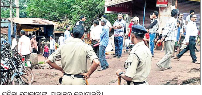
ପରିବା ଦୋକାନୀଙ୍କୁ ସ୍ଥାନାନ୍ତର କରାଯାଇଛି।

କେନ୍ଦୁଝର ଜିଲ୍ଲା ଯୋଡ଼ା ପୌରପାଳିକା ପକ୍ଷରୁ ସହରର ପୁଖ୍ୟ ରାସ୍ତା କଡ଼ରେ ଥିବା ପରିବା ଦୋକାନୀଙ୍କୁ ସ୍ଥାନାନ୍ତର ପ୍ରକ୍ରିୟା ରବିବାର ଆରମ୍ଭ କରାଯାଇଥିଲା। ରବିବାର ସକାଳ ୮ ଘଟିକାଠାରୁ ପୂର୍ବାହ୍ନ ୧୧ ଘଟିକା ପର୍ଯ୍ୟନ୍ତ ପୌରପାଳିକା ଓ ପୋଲିସ ପ୍ରଶାସନର ମିଳିତ ସହଯୋଗରେ ଏହି ସ୍ଥାନାନ୍ତର କାର୍ଯ୍ୟ କରାଯାଇଥିଲା।