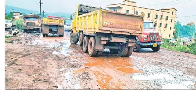
ବାମେବାରୀ - ବାଂଶପାଣି ରାସ୍ତା ଶୋଚନୀୟ।

କେନ୍ଦୁଝର ଜିଲ୍ଲା ଯୋଡ଼ା ଖଣି ମଣ୍ଡଳର ରାଜ୍ୟ ରାଜପଥ ନଂ ୨ କୁଚୁଡ଼ି ବାଂଶପାଣି ରାସ୍ତା ମରଣଯତ୍ନୀ ପାଇଛି। ଦିନକୁ ଦିନ ଏହି ରାସ୍ତାଟି ଅଧିକ ଶୋଚନୀୟ ହେବାରେ ଲାଗିଛି। ସ୍ଥାନୀୟ ଖଣି କମ୍ପାନୀ କିମ୍ବା ପ୍ରଶାସନ ଏ ଦିନରେ ଦୃଷ୍ଟି ଦେଇ ନ ଥିବାରୁ ଅଞ୍ଚଳରେ ଜନଅବହେଷ ଦେଖାଦେଇଛି। ଅଞ୍ଚଳବାସୀ ବାରମ୍ବାର ଜିଲ୍ଲାପ୍ରଶାସନର ଏବଂ ପରିବହନକାରୀ ଖଣି କମ୍ପାନୀ, ଖଣି ଠିକାଦାର, ପରିବହନ ଠିକାଦାରଙ୍କ ଦୃଷ୍ଟି ଆକର୍ଷଣ କରିଥିଲେ ହେଁ ଏଥିପ୍ରତି ଦୃଷ୍ଟି ଦିଆଯାଇ ନ ଥିବା ଅଭିଯୋଗ ହୋଇଛି।