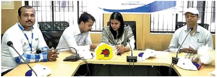
କାର୍ଯ୍ୟକ୍ରମରେ ଅତିରିକ୍ତ ଜିଲ୍ଲାପାଳ ଓ ଅନ୍ୟ ଅଧିକାରୀମାନେ ।

ଅତିରିକ୍ତ ଜିଲ୍ଲାପାଳଙ୍କ ପରିସଂଖ୍ୟାନ ଓ କାର୍ଯ୍ୟ ସମ୍ପାଦନ କାର୍ଯ୍ୟକ୍ରମ ମନୁଷ୍ୟାଳୟ ଆନୁକୂଲ୍ୟରେ ଜନସେବା କେନ୍ଦ୍ରର ଇ-ଗଣନା ସହାୟକ ଲିମିଟେଡ୍ ସହଯୋଗରେ ସୋମବାର ଜିଲ୍ଲାପାଳଙ୍କ ଆର୍ଥିକ ଜନଗଣନା ୨୦୧୯ର ଶୁଭାରମ୍ଭ ହୋଇଛି। ଗୁମ୍ଫା ଜିଲ୍ଲାପାଳଙ୍କ କାର୍ଯ୍ୟାଳୟ ସମ୍ମିଳନୀ କକ୍ଷରେ ଅନୁଷ୍ଠିତ କାର୍ଯ୍ୟକ୍ରମରେ ଅତିରିକ୍ତ ଜିଲ୍ଲାପାଳ ସ୍ୱାଧୀନେ ବି. ଯୋଗ ଦେଇ ଏହାର ଶୁଭାରମ୍ଭ କରିଥିଲେ। ଭାରତ ଦେଶର ସମସ୍ତ ଜିଲ୍ଲାରେ ଏହି କାର୍ଯ୍ୟକ୍ରମ ଚଳାଯିବାବେଳେ ଜିଲ୍ଲାରେ ଆର୍ଥିକ ଜନଗଣନା କିପରି କରାଯିବ ସେ ସମ୍ବନ୍ଧରେ ସୁପରଭାଇଜର୍ ଓ ଏନୁମେରେଟର୍ ମାନଙ୍କୁ ଏକ ନୂତନ ମୋବାଇଲ୍ ଆପ୍ ମାଧ୍ୟମରେ ଡାଲିନ ଦିଆଯାଇଥିଲା। ଏଥିରେ ପ୍ରତ୍ୟେକ ପରିବାରରେ ବିଭିନ୍ନ କ୍ଷେତ୍ରରୁ ଆୟ ଓ ବ୍ୟୟ ତଥ୍ୟ ସଂଗ୍ରହ କରାଯିବ। କାର୍ଯ୍ୟକ୍ରମରେ ଜିଲ୍ଲା ପରିସଂଖ୍ୟାନ ତଥା ଯୋଜନା ଓ