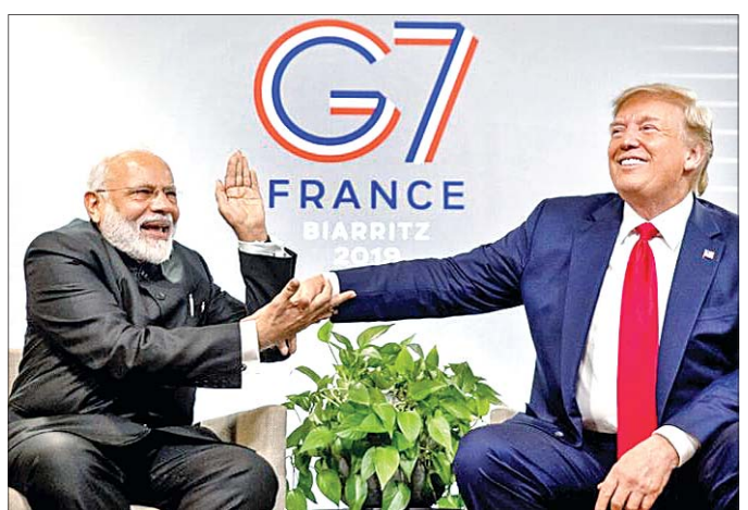
ଫ୍ରାନ୍ସର ବାରିଟ୍‌ରେ ଆୟୋଜିତ ଜି-୭ ସମ୍ମିଳନୀରେ ଭାରତ ପ୍ରଧାନମନ୍ତ୍ରୀ ନରେନ୍ଦ୍ର ମୋଦି ।

■ କଶ୍ମୀର ଦ୍ୱିପାକ୍ଷିକ ପ୍ରସଙ୍ଗ ■ ଆମେରିକା ରାଷ୍ଟ୍ରପତିଙ୍କ ସ୍ୱ-ଚର୍ଚ୍ଚ ■ ଭାରତର କୃତଚେତନ ବିକୟ କଶ୍ମୀର ପ୍ରସଙ୍ଗରେ ତୃତୀୟ ପକ୍ଷର ମଧ୍ୟସ୍ଥତାକୁ ପ୍ରଧାନମନ୍ତ୍ରୀ ନରେନ୍ଦ୍ର ମୋଦି ରୋକିବାକୁ ଚାହୁଁଛନ୍ତି। ଏହା ଭାରତ ଓ ପାକିସ୍ତାନ ମଧ୍ୟରେ ଦ୍ୱିପାକ୍ଷିକ ପ୍ରସଙ୍ଗ ଓ ଏକେଇ ତୃତୀୟ ପକ୍ଷକୁ ବ୍ୟସ୍ତ କରି ଆମେ କଷ୍ଟ ଦେବାକୁ ଚାହୁଁଛନ୍ତି ବୋଲି ମୋଦି କହିଛନ୍ତି। ୧୯୪୭ ପୂର୍ବରୁ ଭାରତ ଓ ପାକିସ୍ତାନ ଏକାଠି ଥିଲେ। ତେଣୁ ଯେକୌଣସି ସମସ୍ୟାର ସମାଧାନ ଆମେ ଆପୋଷ ଆଲୋଚନା ଦ୍ୱାରା କରିପାରିବୁ ବୋଲି ମୋଦି କହିଥିଲେ। ମୋଦିଙ୍କ କଥାକୁ ବୁଝାଇବାକୁ କରିବା ସହ ଟ୍ରମ୍ କଶ୍ମୀର ଦ୍ୱିପାକ୍ଷିକ ପ୍ରସଙ୍ଗ ବୋଲି ସ୍ୱୀକାର କରିଛନ୍ତି। ଏହାକୁ ଭାରତର କୃତଚେତନ ବିକୟ ବୋଲି କୁହାଯାଉଛି। ଦୁଇ ରାଷ୍ଟ୍ରପୁଞ୍ଜାଙ୍କ ମଧ୍ୟରେ