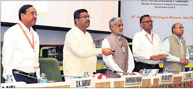
ସିଜିଡି ବିଟି ରାଉଣ୍ଡର କାମ ପ୍ରାରମ୍ଭ କରୁଛନ୍ତି କେନ୍ଦ୍ରମନ୍ତ୍ରୀ ଧର୍ମେନ୍ଦ୍ର ପ୍ରଧାନ ।