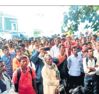
ବିଚ୍ଛିନ୍ନାଞ୍ଚଳ ଅଧିବାସୀ । ସୋମବାର ସହ ଉପଜିଲ୍ଲାପାଳ ଆଲୋଚନା କରୁଛନ୍ତି।

ଚିତ୍ରକୋଣ୍ଡା/ମାଲକାନଗିରି, ୨୬ ଅଗଷ୍ଟ (ଡି.ଏନ.ଏ.)-