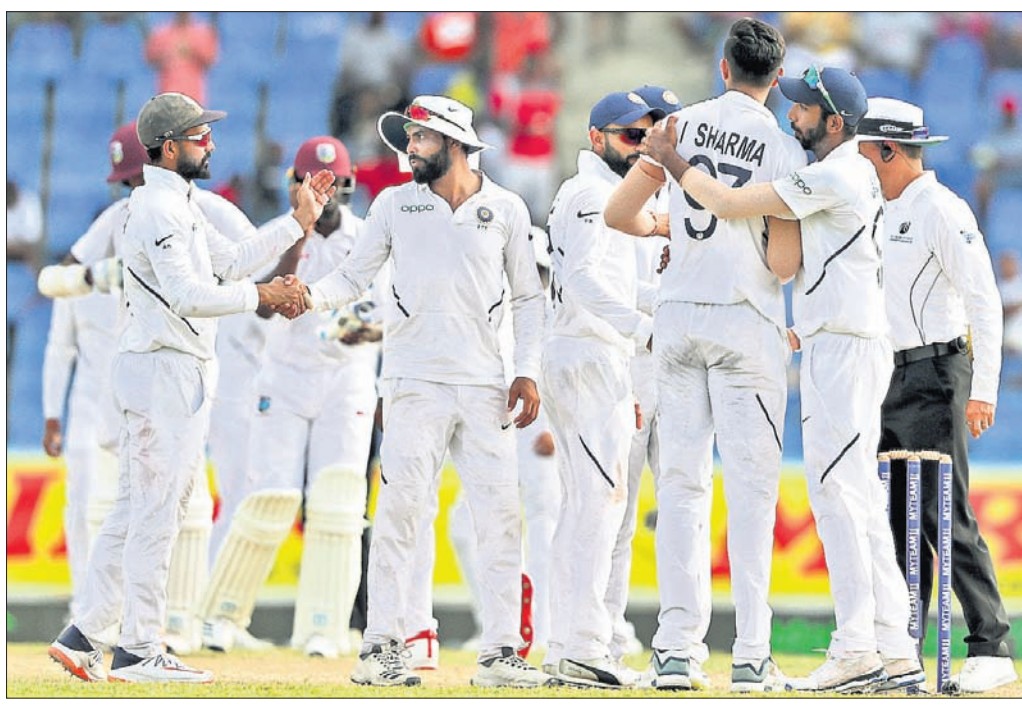
ବିଜୟ ହାସଲ ପରେ ଉଲ୍ଲସିତ ଭାରତୀୟ ଦଳ।

ଏଠାରେ ରବିବାର ଶେଷ ହୋଇଥିବା ପ୍ରଥମ କ୍ରିକେଟ ଟେଷ୍ଟରେ ଭାରତ ୩୧୮ ରନରେ ଫ୍ରେଣ୍ଡ୍‌ସ୍ ଫିଲ୍ଡ ଟିମ୍ ପରାସ୍ତ କରିଛି। ଏଥିସହ ୨ ମ୍ୟାଚ୍ ବିଶିଷ୍ଟ ବିଜୟରେ ଭାରତ ୧-୦ରେ ଅଗ୍ରଣୀ ଲାଭ କରିଛି। ରନ ଦୃଷ୍ଟିରୁ ୩୧୮ ବିଦେଶ ମାଟିରେ ଭାରତର ସର୍ବବୃହତ୍ ବିଜୟ। ୨୦୧୭ରେ ଗାଲୋଠାରେ ଶ୍ରୀଲଙ୍କା ବିପକ୍ଷରେ ଭାରତ ୩୦୪ ରନରେ ବିଜୟ ହୋଇଥିଲା। ତାହା ଏପର୍ଯ୍ୟନ୍ତ ବିଦେଶ ମାଟିରେ ଭାରତର ସର୍ବବୃହତ୍ ବିଜୟ ହୋଇ ରହିଥିଲା। ୧୯୮୬ରେ ଲିଟ୍ଟୋଠାରେ ଲଙ୍କା ବିପକ୍ଷରେ ଭାରତ ୨୭୯, ୨୦୧୫ରେ କଲମ୍ବୋରେ ଶ୍ରୀଲଙ୍କା ବିପକ୍ଷରେ ୨୭୮, ୧୯୬୭-୬୮ରେ ଅକଲାଣ୍ଡଠାରେ ନ୍ୟୁଜିଲାଣ୍ଡ ବିପକ୍ଷରେ ୨୭୨ ରନରେ ବିଜୟ ହୋଇଥିଲା। ତେବେ ଟେଷ୍ଟ କ୍ରିକେଟରେ ରନ ଦୃଷ୍ଟିରୁ ଭାରତର ସର୍ବାଧିକ ବିଜୟ ବ୍ୟବଧାନ ହେଉଛି ୩୩୬। ତେବେ ଏହାକୁ ଭାରତ ଯତ୍ନରେ ୧୨ବର୍ଷରେ ନୂଆଦିଲ୍ଲୀରେ ୨୦୧୫-୧୬ରେ ଶ୍ରୀଲଙ୍କା ବିପକ୍ଷରେ ହାସଲ କରିଥିଲା। ଭାରତର ପରବର୍ତ୍ତୀ ୨ଟି ବୃହତ୍ ବିଜୟ ବ୍ୟବଧାନ ହେଉଛି ୩୨୧ ବନାମ ନ୍ୟୁଜିଲାଣ୍ଡ (୨୦୧୬-୧୭, ଲୟୋର୍ଡ୍) ଏବଂ ୩୨୦ ବନାମ ଅଷ୍ଟ୍ରେଲିଆ (୨୦୦୮-୦୯, ମୋହାଲି)। ଫ୍ରେଣ୍ଡ୍‌ସ୍ ଫିଲ୍ଡ ଟିମ୍ ବିପକ୍ଷରେ ଭାରତର ବିଜୟ ସହ ବିରାଟ କୋହଲି ଭାରତୀୟ ଅଧିନାୟକ ଭାବେ ବିଦେଶ ମାଟିରେ ସର୍ବାଧିକ ସଫଳ ହେବାର ଚୈତ୍ୟାଗ୍ୟ ପାଇଛନ୍ତି। ବିରାଟଙ୍କ ନେତୃତ୍ୱରେ ଭାରତ