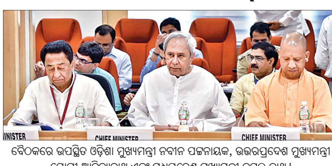
ବୈଠକରେ ଉପସ୍ଥିତ ଓଡ଼ିଶା ମୁଖ୍ୟମନ୍ତ୍ରୀ ନବୀନ ପଟ୍ଟନାୟକ, ଉତ୍ତରପ୍ରଦେଶ ମୁଖ୍ୟମନ୍ତ୍ରୀ ଯୋଗୀ ଆଦିତ୍ୟନାଥ ଏବଂ ମଧ୍ୟପ୍ରଦେଶ ମୁଖ୍ୟମନ୍ତ୍ରୀ କମଳ ନାଥ ।

ରାଜ୍ୟର ମାଓବାଦୀ ପ୍ରଭାବିତ ଜିଲ୍ଲାଗୁଡ଼ିକରେ ପର୍ଯ୍ୟାପ୍ତ ରେଳ, ଟେଲି ଯୋଗାଯୋଗ ଏବଂ ବ୍ୟାଙ୍କ ସୁବିଧା ଯୋଗାଇ ଦିଆଯାଉ। ସୋମବାର ନୂଆଦିଲ୍ଲୀରେ ସ୍ୱାସ୍ଥ୍ୟ ମନ୍ତ୍ରୀ ଅମିତ ଶାହଙ୍କ ଅଧ୍ୟକ୍ଷତାରେ ମାଓବାଦୀପ୍ରବଣ ରାଜ୍ୟଗୁଡ଼ିକ ନେଇ ଅନୁଷ୍ଠିତ ଆନ୍ତର୍ରାଜ୍ୟ ପରିଷଦ ବୈଠକରେ ମୁଖ୍ୟମନ୍ତ୍ରୀ ନବୀନ ପଟ୍ଟନାୟକ ଏହି ଦାବି କରିଛନ୍ତି। ମାଓବାଦୀପ୍ରବଣ ଅଞ୍ଚଳରେ ଭୁବନେଶ୍ୱର ଗଞ୍ଜାମ ଗୋବୀନ୍ଦ ବସାଜବା