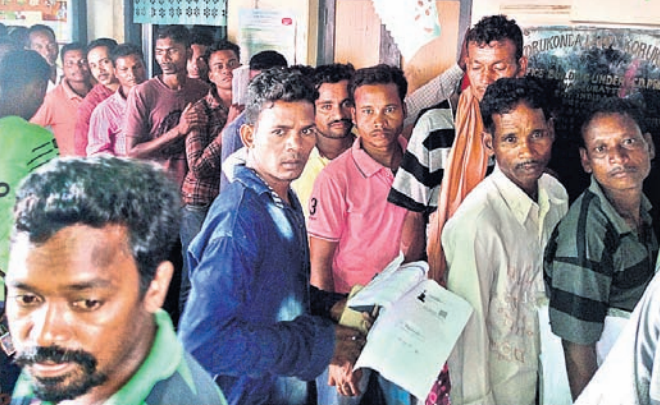
ଲ୍ୟାମ୍ପ କାର୍ଯ୍ୟକ୍ରମରେ ପଞ୍ଜୀକରଣ ପାଇଁ ଚାଷୀଙ୍କ ଭିଡ୍।

ମାଲକାନଗିରି ଜିଲ୍ଲା କୋରୁକୋଣ୍ଡା ଲ୍ୟାମ୍ପରେ ମଣ୍ଡି କାର୍ଡ ପାଇଁ ଆବେଦନ କରିବାକୁ ଚାଷୀଙ୍କ ଭିଡ୍ ଜମୁଛି। ସୋମବାର ଏଥିପାଇଁ ପ୍ରବଳ ଗହଳି ହୋଇଥିଲା। ଲ୍ୟାମ୍ପ ପରିସର ଭିତରୁ ମାଲକାନଗିରି-ବାଲିମେଳା ମୁଖ୍ୟ ରାସ୍ତା ଯାଏ ଯାଏ ଲାଗିଥିଲା। ଏଥିପାଇଁ ଦିନ ତମାମ ଯାତାୟତରେ ପାଧ୍ୟାୟିକ ହୋଇଥିଲା। ଚାଷୀମାନେ ମଣ୍ଡି କାର୍ଡ ଲାଗି ଆବେଦନର ସମୟସୀମା ବୃଦ୍ଧି କରିବାକୁ ଦାବି କରିଛନ୍ତି। କୋରୁକୋଣ୍ଡା ଲ୍ୟାମ୍ପରେ ତଳିତଦର୍ଶ ଅଗଷ୍ଟ ୨୫ ସୁଦ୍ଧା ମାତ୍ର ୨୨୨୩ ଚାଷୀ ମଣ୍ଡିରେ ଧାନ ବିକ୍ରି ପାଇଁ ଆବେଦନ ପତ୍ର ଦାଖଲ କରିଛନ୍ତି। ଆବେଦନ ସମୟ ସୀମା ୩୦ ଅଗଷ୍ଟ ରହିଛି। ବର୍ତ୍ତମାନ