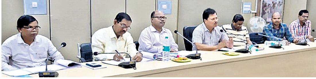
ବୈଠକରେ ଉପସ୍ଥିତ ଜିଲ୍ଲାପାଳ ଓ ଅନ୍ୟ ଅଧିକାରୀମାନେ ।