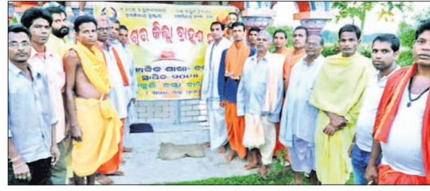
ସାଙ୍ଗଠିକ ବୈଠକରେ ବ୍ରାହ୍ମଣ ସମାଜର କର୍ମକର୍ମୀ।

ବାଲେଶ୍ୱର ଜିଲ୍ଲା ନାଳଗିରିରେ ପୁଣି ଏକ ଚୋରା ପିକଅପ୍ ଗାଡ଼ିକୁ ନାଳଗିରି ପୋଲିସ୍ ଜବତ କରିଛି।