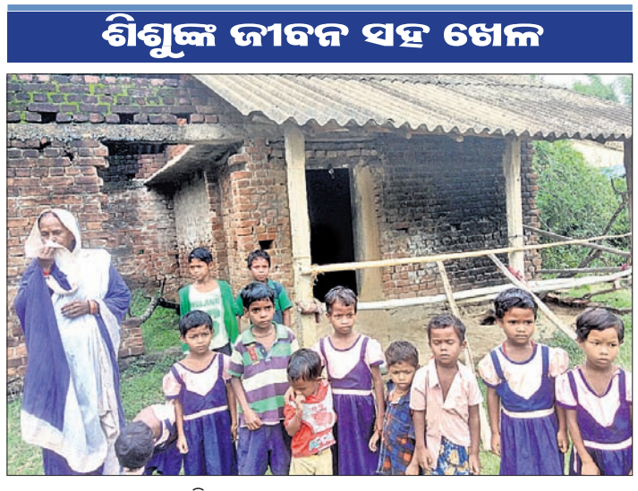
ଶିଶୁଙ୍କ ଜୀବନ ସହ ଖେଳ ବଇଞ୍ଚା ନରଗପୁର ଅଙ୍ଗନୱାଡି କେନ୍ଦ୍ର।

ସକଳନାଟ, ୨୭୮୮(ଡି.ଏନ.ଏ.) ଶିଶୁଙ୍କ ମୂଳଦୁଆ ସୁରକ୍ଷିତ ଭାବେ ରଖିବା ଲାଗି ସରକାର ଅଙ୍ଗନୱାଡି କେନ୍ଦ୍ର ମାଧ୍ୟମରେ ବିଭିନ୍ନ ଯୋଜନାରେ ଅର୍ଥ ଖର୍ଚ୍ଚ କରୁଛନ୍ତି।