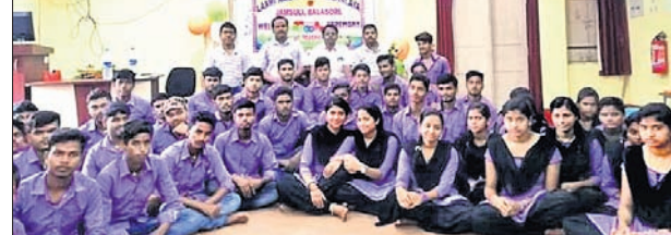
ସ୍ୱାଗତ ଉତ୍ସବରେ ଉପସ୍ଥିତ ଛାତ୍ରାଛାତ୍ରୀ।