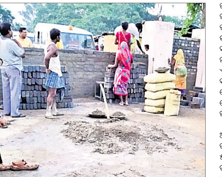
ରାସ୍ତା ଉପରେ ପାଟେରି ନିର୍ମାଣ କରାଯାଇଛି।

ବାଲେଶ୍ୱର ସହରର ଉତ୍ତର-ପୂର୍ବ ଦିଗରେ ଥିବା ଓଡ଼ିରୋଡ଼ର ସରକାରୀ ଆଇଟିଆଇ ପରିସର ଦେଇ ଯାଇଥିବା ଏକ ଗୁମାସ୍ତା ପକ୍ଷୀ ରାସ୍ତା କରଖିଆ ଗ୍ରାମକୁ ସଂଲଗ୍ନ କରିଛି।