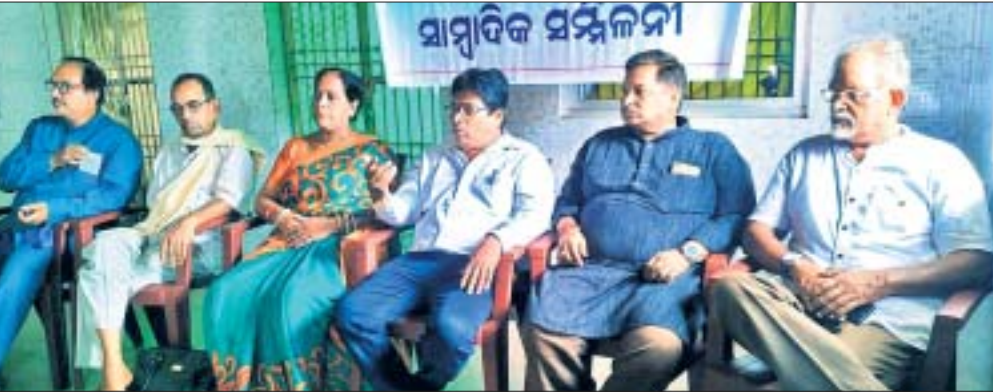
ଖବରଦାତା ସମ୍ମିଳନୀରେ ସଂଗଠନ କର୍ମକର୍ତ୍ତାମାନେ।

ନିମନ୍ତେ ୧୬ଜଣ ଆରମ୍ଭ କରାଯାଇଥିବା ବୈଠକରେ ଉପସ୍ଥିତ ଥିଲେ। କୋର୍ଟରେ ଗୋଟିଏ ତଦନ୍ତ କମିଶନ ଗଠନ କରାଯାଇଛି।