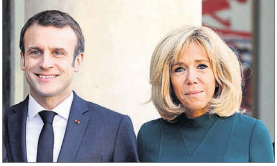
ଇମାଦେଲ ମାକର୍ ଓ ସ୍ତ୍ରୀ ବ୍ରଜିଲ୍