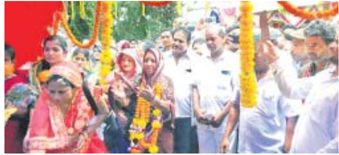
ଭିଡିପ୍ରସ୍ତର କାର୍ଯ୍ୟକ୍ରମରେ ଭାଗନେଇ ଏମ୍ପି ଓ ଅନ୍ୟମାନେ ।