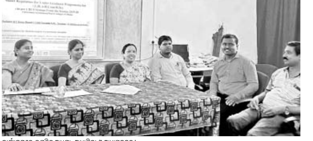
କାର୍ଯ୍ୟକ୍ରମରେ ଉପସ୍ଥିତ ଅଧ୍ୟକ୍ଷ, ଅଧ୍ୟାପିକା ଓ ଅଧ୍ୟାପକବୃନ୍ଦ ।