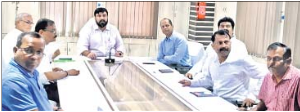
ବୈଠକରେ ବିତିଏ ଉପାଧ୍ୟକ୍ଷ, ଏମ୍ପି, ବିଧାୟକ ଓ ଅନ୍ୟମାନେ।

ବ୍ରହ୍ମପୁର ବସ୍ତ୍ରାଣ୍ଡର ଗୁଣାଗର ନେଇ ରହିଥିବା ସମସ୍ୟାର ଏବେ ଅନ୍ତ ଘଟିବ। ଅକ୍ଟୋବର ୨ ତାରିଖରେ ହଳଦିଆପଦର ବସ୍ତ୍ରାଣ୍ଡକୁ ବ୍ରହ୍ମପୁର ବସ୍ତ୍ରାଣ୍ଡ ଭାବେ ଘୋଷଣା କରାଯିବ।