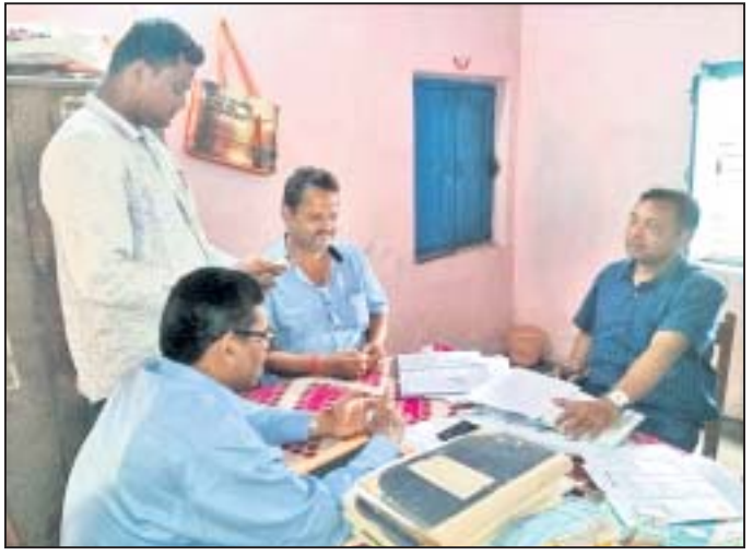
କୋଦଳା ସମବାୟ ସମିତିରେ ଯାତ୍ରା ରାଜିଛି ।

ଆଦିକା ସମବାୟ କେନ୍ଦ୍ର ବ୍ୟାଙ୍କର କୋଦଳା ଶାଖା ଅଧୀନରେ ଥିବା ଏ ସେବା ସମବାୟ ସମିତିରେ ଧାନମଣ୍ଡି ନିମନ୍ତେ ଗଞ୍ଜାମ ସମ୍ପୂର୍ଣ୍ଣ ବିବରଣୀ ପଞ୍ଜୀକରଣ ମନ୍ତ୍ରଣାଳୟରେ ଚାଲିଥିଲା ।