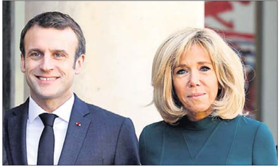
ଇମାନ୍ୟୁଏଲ ମାକ୍‌ର ଓ ବ୍ରୀଜିତ୍ କେର୍