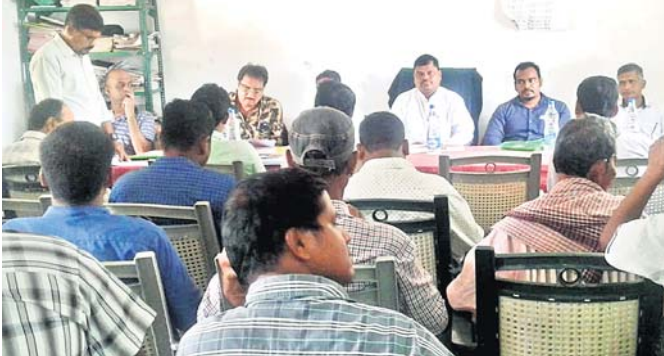
ବୈଠକରେ ବିଧାୟକଙ୍କ ସମେତ ଅନ୍ୟ ଅତିଥିମାନେ।

ସିକ୍ସମାଲ କଲ୍ୟାଣୀ ଗାନ୍ଧୀ ଉଚ୍ଚ ବାଳିକା ବିଦ୍ୟାଳୟ ପରିବର୍ତ୍ତନରେ ଆସିଥିଲେ। ବିଦ୍ୟାଳୟ ପରିବର୍ତ୍ତନରେ ଆସିଥିଲେ। ବିଦ୍ୟାଳୟର କିଛି ନଥିପତ୍ର ଦେଖିବା ପାଇଁ ଆଦର୍ଶ ଶିକ୍ଷୟିତ୍ରୀ ଭାବେ ଜଣାଶୁଣା। ସେ ଅନେକ ଥର ରାଜ୍ୟସ୍ତରୀୟ ପୁରସ୍କାର ଭକ୍ତ ନଥିପତ୍ର ଅଧକ୍ଷଙ୍କୁ ଦେଇ ନ ଥିଲେ। ଏଥିସହ ବିଦ୍ୟାଳୟର ସମସ୍ତ ଆର୍ଥିକ ହିସାବପତ୍ର ଠିକ୍ ଭାବେ ପରିଚାଳନା କରି ନ ଥିବା ବେଳେ ହିସାବ ନିକାଶ ଖର୍ଚ୍ଚର ତ୍ରୁଟିରୁ ଅନେକ ଅବ୍ୟବସ୍ଥା ଯୋଗୁଁ ବିଭିନ୍ନ ଶିକ୍ଷୟିତ୍ରୀ ନିଲମ୍ବିତ ହୋଇଥିଲେ। ପ୍ରତିଯୋଗୀ ଦେଲ୍ୟାପରେ ଏହି ବିଦ୍ୟାଳୟର ସମସ୍ତ ଛାତ୍ରୀଛାତ୍ରୀଙ୍କ ଦାୟିତ୍ୱ ନେଇ ଶିକ୍ଷା, ପରିବେଶ, ସାଧାରଣ ଜ୍ଞାନ, ନଗ୍ରପା,