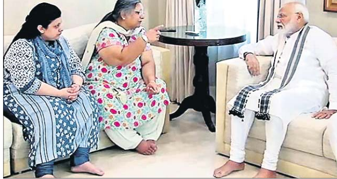
ଅଭିଶପ୍ତ କେନ୍ଦ୍ରୀୟ ନିଧନ ହେବାବେଳେ ମୋଦି ବାହାରିନରେ ରହି ଗଭୀର ଶୋକ ବ୍ୟକ୍ତ କରିଥିଲେ। ମଙ୍ଗଳବାର