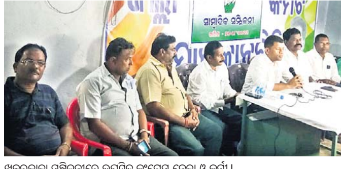
ଖବରଦାତା ସମ୍ମିଳନୀରେ ଉପସ୍ଥିତ କଂଗ୍ରେସ ନେତା ଓ କର୍ମୀ।