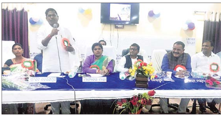
ପଞ୍ଚାୟତ ସମିତି ବୈଠକରେ ଉପସ୍ଥିତ ନେତା ଓ ଅଧିକାରୀ ।

ଏବଂଏମ୍ପାନେ ରହୁ ନ ଥିବା, ସମ୍ବନ୍ଧିତ ଶିଶୁ ବିକାଶ ବିଭାଗ ଅଧୀନ ଅଙ୍ଗନୱାଡ଼ି କେନ୍ଦ୍ରକୁ ଯାଉଥିବା ଛତୁଆ ନିମ୍ନମାନର ଅଭିଯୋଗ ହୋଇଥିଲା । ସ୍ୱୟଂ ସହାୟକ ଗୋଷ୍ଠୀ ଦ୍ୱାରା ଧ୍ୟାନକିଶା ପାଇଁ ନିଷ୍ପତ୍ତି ହୋଇଥିବା ବେଳେ ମାତ୍ର ୪ଟି ଗୋଷ୍ଠୀକୁ ହିଁ ଏହି କାର୍ଯ୍ୟ ପାଇଁ ନିମନ୍ତ୍ରିତ କରାଯିବା ସହ ଅନ୍ୟମାନଙ୍କୁ ଚାଳକ୍ଷେପ ନାତି ଅବଲମ୍ବନ କରାଯାଇଥିବା ଅଭିଯୋଗ ଉଠିଥିଲା । ଆବାସ ଯୋଜନା ସମେତ ଖାଉଟି କାର୍ତ୍ତ, ବିଭିନ୍ନ ଯୋଜନାରେ ସଠିକ୍ ହିସାବଖାତା