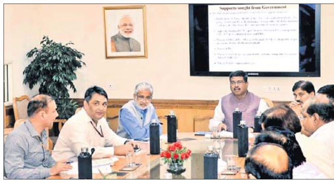
କେନ୍ଦ୍ରମନ୍ତ୍ରୀ ଧର୍ମେନ୍ଦ୍ର ପ୍ରଧାନ ବିଭାଗୀୟ ଅଧିକାରୀମାନଙ୍କ ସହ ଆଲୋଚନା କରୁଛନ୍ତି ।

ଏବଂ ଖେମ୍ବୋ ୨୮ଟି କୋଣସି ଫିଡର କାର୍ଯ୍ୟ ଶେଷ କରିନାହିଁ । ସେହି ୧୨, ନେତୃତ୍ୱାଧୀନ ୪୪, ସାଉଥକୋ ୨୩ ଏବଂ ଖେମ୍ବୋ ୨୮ ଫିଡର କାର୍ଯ୍ୟ ଚାଲୁ ରହିଛି । ଏହିପରି ଭାବେ ମୋଟ ୧୧୭ଟି ଫିଡର କାର୍ଯ୍ୟ ଚାଲୁ ରହିଛି । ଏହାପରି ୫୭ଟି ଫିଡର କାର୍ଯ୍ୟ ଅସମ୍ପୂର୍ଣ୍ଣ ରହିଛି ।