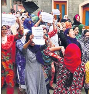
ସାମ୍ବିଧାନିକ ସ୍ୱାଧୀନତା ପ୍ରତ୍ୟାହାର କରିବା ପରେ ୧୮ ବର୍ଷୀୟା ଚଳୁଥିବା ଯୁଦ୍ଧର ପ୍ରତୀକ୍ଷା ଦେଖାଯାଇଛି।

ପ୍ରବେଶପତ୍ର ଚିରାକି କାଠଗଣ୍ଡି, କେତେ ଖଣ୍ଡ ତିନି ଓ ଭଙ୍ଗାଧାରୀ ସହ ଏଭଳି ଅନେକ ପ୍ରତିବନ୍ଧକରେ ଅବରୋଧ କରାଯାଇଛି, ଯାହାକି ପୋଲିସ୍ ଗାଡ଼ିଗୁଡ଼ିକୁ ଅଟକାଇଦେବା ଉପତ୍ୟକାରେ କର୍ତ୍ତା ସାମରିକ କର୍ମୀ ଓ ଯୋଗାଯୋଗ ମାଧ୍ୟମ ଉପରେ କଟକଣା ହେଉଛି।