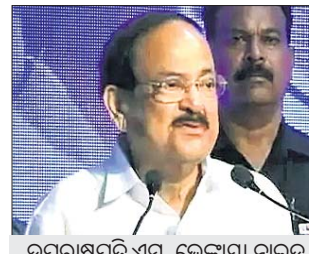
ଉପରାଷ୍ଟ୍ରପତି ଏ.ପି. ଜେକାଭା ନାଲନ୍ଦୁ

ପାକିସ୍ତାନ ସହ କ୍ଷମାର ପ୍ରସ୍ତାବ ଉପରେ ଆଲୋଚନା ହେବାର ଆଶା କରାଯାଇଛି।