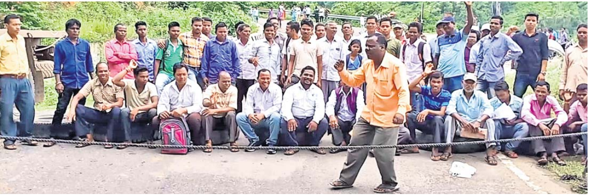
ଅଞ୍ଚଳବାସୀଙ୍କ ଦ୍ୱାରା ରାସ୍ତାରେକୋ କରାଯାଇଛି ।