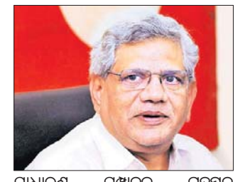
କୋର୍ଟଙ୍କୁ ଜଣାଇବାକୁ ଖଣ୍ଡପୀଠ ନିର୍ଦ୍ଦେଶ ଦେଇଛନ୍ତି।

କ୍ଷମାର ଯିବା ଲାଗି ଯେତେବେଳେ, ଜାମିଆ କ୍ଷାତ୍ରୀଙ୍କୁ ଅନୁମତି ଦିଆଯାଇଛି।