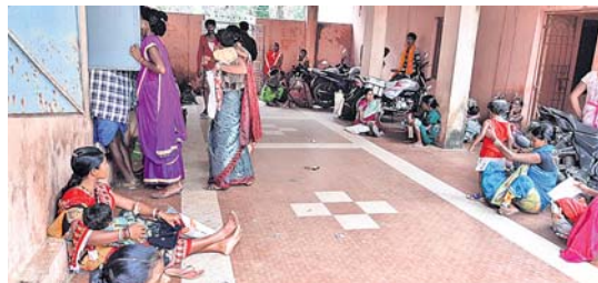
ଆଧାର କେନ୍ଦ୍ର ଆଗରେ ଅପେକ୍ଷାରତ ହିତାଧିକାରୀ।

ଖାରଡ଼ି କାର୍ଡଧାରୀଙ୍କୁ ଆଧାର ସଂଯୋଗ କରିବା ଦ୍ଵାରା ଚାଉଳ ବନ୍ଧନ କ୍ଷେତ୍ରରେ ସ୍ଵଚ୍ଛତା ଆସିବ ବୋଲି କେନ୍ଦ୍ର ସରକାର କହିଛନ୍ତି। ଏଥିପାଇଁ ରାଶନ କାର୍ଡ ସହ ଆଧାର ସଂଯୋଗ କରୁଥିବା ସହ ଏହାର ଶେଷ ତାରିଖ ଅଗଷ୍ଟ ୩୧ ତାରିଖ ଥିବ ବୋଲି ପଞ୍ଚାୟତ ପ୍ରସାରୀ ଅଧିକାରୀ ତାଙ୍କୁ ଧରି ଅର୍ଘ୍ୟ ଆଗରେ ଅପେକ୍ଷାରତ କରିବା ପରେ ଆରମ୍ଭ ହୋଇଛି ଗହଳି। କନ୍ୟାପୁର ରୁକ୍ମ ଅଧୀନରେ ରହିଥିବା ୧୬ଟି ପଞ୍ଚାୟତରେ ପ୍ରାୟ ୮୦ରୁ ୯୦ ପ୍ରତିଶତ ରାଶନ କାର୍ଡରେ ଆଧାର ସଂଯୋଗ ହୋଇଥିବା ବେଳେ ଆଉ ୧୦ ପ୍ରତିଶତକୁ ୩୧ ତାରିଖ