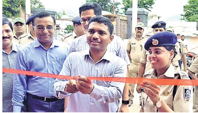
ଜିଲ୍ଲାପାଳ ଏସ୍ପି ଓ ଅନ୍ୟ ଅଧିକାରୀଙ୍କ ଉପସ୍ଥିତିରେ କାର୍ଯ୍ୟକ୍ରମର ଶୁଭାରମ୍ଭ କରୁଛନ୍ତି ।