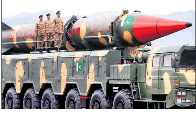
ଅଲୋକାଭିଷେକ ପାଇଁ ଯୋଜନା କରୁଥିବା ପାକିସ୍ତାନର ନେତାମାନେ।

କ୍ଷେପଣାସ୍ତ୍ର ପରୀକ୍ଷା ପାଇଁ ଯୋଜନା କରୁଛି ପାକିସ୍ତାନ। ଯୁଦ୍ଧାବସ୍ଥାରେ ଏହା ଭାରତର ସମ୍ମୁଖୀନ ହେବ।