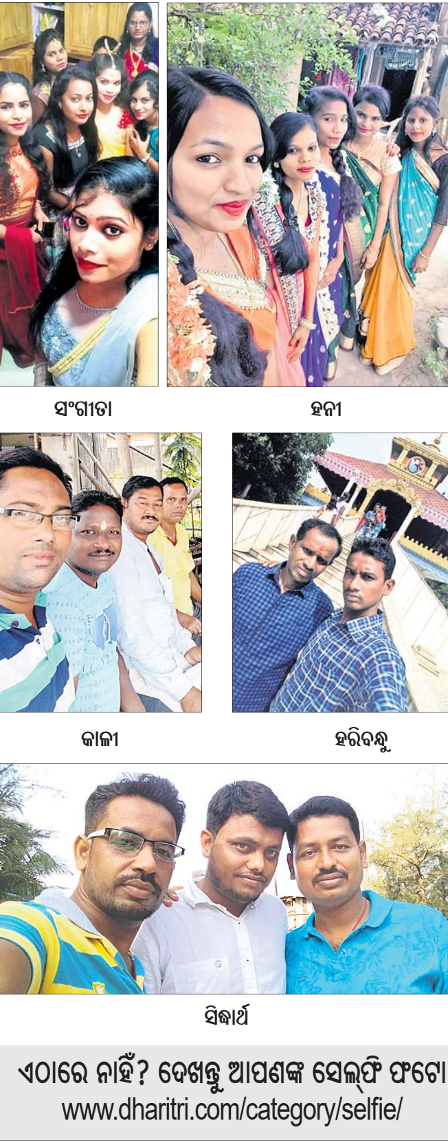
ସଂଗୀତା ହନା କାଳୀ ହରିବନ୍ଧୁ ସିଦ୍ଧାର୍ଥ

ଏଠାରେ ନାହିଁ? ଦେଖନ୍ତୁ ଆପଣଙ୍କ ସେଲ୍ଫି ଫଟୋ www.dharitri.com/category/selfie/