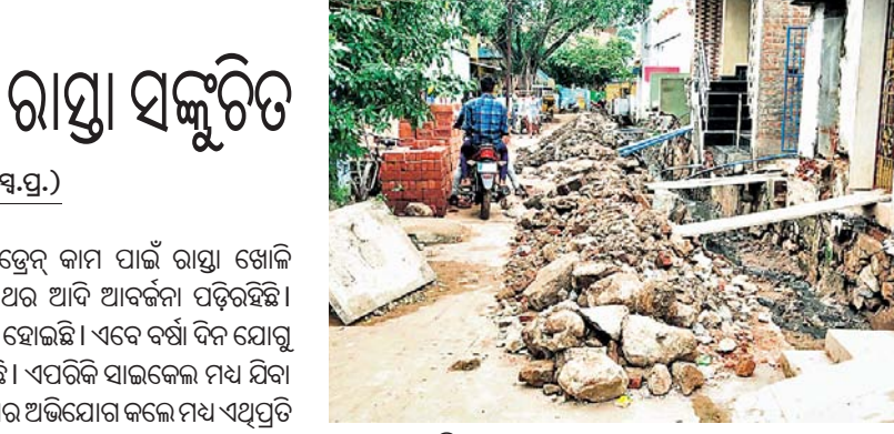
ରାସ୍ତାରେ ମାଟି ପଥର ଗଦା ଯୋଗୁ ଯାତାୟତ ବାଧାପ୍ରାପ୍ତ ।