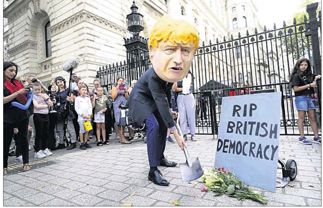
ବ୍ରିଟିଶ୍ ପାର୍ଲିାମେଣ୍ଟର ଦ୍ୱିତୀୟ ପର୍ଯ୍ୟାୟ ଅଧିବେଶନ ସେପ୍ଟେମ୍ବର ୯ରେ ଆରମ୍ଭ ହେବାକୁ ଥିବାବେଳେ ପ୍ରଧାନମନ୍ତ୍ରୀ ବୋରିସ୍ ଜନ୍ସନଙ୍କୁ ସମର୍ଥନ ଦେବା ପାଇଁ ପ୍ରତିବାଦୀମାନେ ଏକ ପ୍ରତିବାଦ ପ୍ରଦର୍ଶନ କରିଛନ୍ତି।

ରୁଷିଆ, ୨୮୮୮ (ପି.ଟି.): କମ୍ୟୁନିଷ୍ଟ ଦଳର ସମର୍ଥନ ପାଇଁ ଭାରତର ସରକାରୀ ସମ୍ପର୍କରେ ବିବାଦ ସମାଧାନ ପାଇଁ ରୁଷିଆ ଓ ଭାରତର ସମ୍ପର୍କକୁ ଆଲୋଚନା କରିବା ପାଇଁ ଏକ ଆଣବିକ ଓ କେତେକ ପାରମ୍ପରିକ କ୍ଷେପଣାସ୍ତ୍ର ପରୀକ୍ଷା ପାଇଁ ଭାରତ ପଦକ୍ଷେପ ଗ୍ରହଣ କରିଛି।