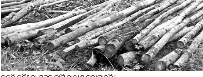
ଉପୁଡ଼ି ପଡ଼ିଥିବା ଗଛକୁ କାଟି ଚାଲାଇ କରାଯାଇଛି ।

ଖୋର୍ଦ୍ଧା ଅଫିସ୍, ୨୯।୮ ଖୋର୍ଦ୍ଧା ରେଞ୍ଜି ତରଫରୁ ଜଙ୍ଗଲର ପାଲକଟିରିଆ ଅଞ୍ଚଳରେ ଫମା ବାଦ୍ୟରେ ଉପୁଡ଼ି ପଡ଼ିଥିବା ଗଛକୁ କାଟି ପଟାଏ, ଆକାଶିଆ ଗଛଗୁଡ଼ିକୁ କେତେଜଣ ଲୋକ ବେଆଇନ ଭାବେ ବିକ୍ରି କରୁଛନ୍ତି । ବନ ବିଭାଗ ନିକଟରେ ଅଭିଯୋଗ କଲେ ପୁଫଳ ମିଳୁଛି । ବର୍ଷ ଜଙ୍ଗଲର ଖାତା ନଂ. ଓ ଫୁଟ ନଂ. ଆଣ ତଦନ୍ତ କରିବା ବୋଲି ସଂପର୍କ ଦିଆଯାଇଛି । ପ୍ରାପ୍ତ ସୂଚନା ଅନୁସାରେ, ୨୦୧୦ରେ ଏଠାରେ ଥିବା