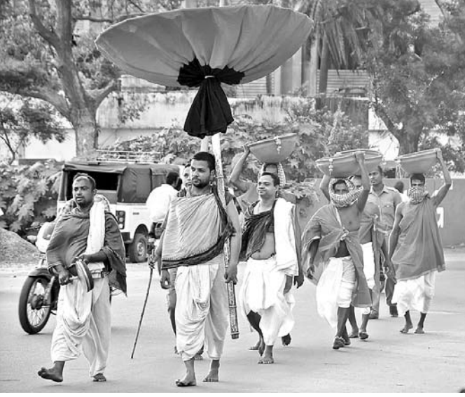
ଆଲାମଚଣ୍ଡୀ ଠାକୁରାଣୀଙ୍କ ପୀଠକୁ ଶ୍ରୀମନ୍ଦିରକୁ ଡାଡ଼ ବିଜେ କରାଯାଇଛି।

କରିଥିଲେ। ଏହାପରେ ଦକ୍ଷିଣକାଳୀଙ୍କ ସେବକମାନେ ଏକ ଆଜ୍ଞାମାଳ ଆଣି ଶ୍ରୀମନ୍ଦିରକୁ ଆସି ରୋଷଦ୍ୱାର ପାଖରେ ରୋଷ ପାଇକଙ୍କୁ ଅର୍ପଣ କରିଥିଲେ। ଆଜ୍ଞାମାଳ ରୋଷଘରେ ବିଜେ ହେବା ପରେ ଅନାମ୍ୟ ନୀତି ବଢ଼ିଥିଲା। ଶୁକ୍ରବାର ସାତପୁରି ରୋଷରେ ଏହି ଡାଡ଼ରେ ସାତପୁରୀ ପିଠା ତିଆରି ହେବ। ସକାଳ ଧୂପରେ ମହାପ୍ରଭୁଙ୍କୁ ସାତପୁରି ପିଠା ଲାଗି କରାଯିବ। ମାଟିରେ ନିର୍ମିତ ସାତପୁରି ଡାଡ଼ରେ ସାତପୁରି ପିଠା ପ୍ରସ୍ତୁତ ହୁଏ। କୁଞ୍ଜର ବିଶୋଇ ସେବକମାନେ ଏହାକୁ ତିଆରି କରିଥାନ୍ତି। ୪ଟି ସାତପୁରି ଡାଡ଼ ଶ୍ରୀମନ୍ଦିରକୁ ଆସିଥାଏ। ତିନୋଟିରେ ପିଠା ତିଆରି ହୁଏ। ଏହା ମାଟିରେ ନିର୍ମିତ ହୋଇଥିବାରୁ କାଳେ ଭାଙ୍ଗିଯିବ ସେଥିପାଇଁ ଗୋଟିଏ ଅଧିକ ଡାଡ଼ ଆସିଥାଏ।