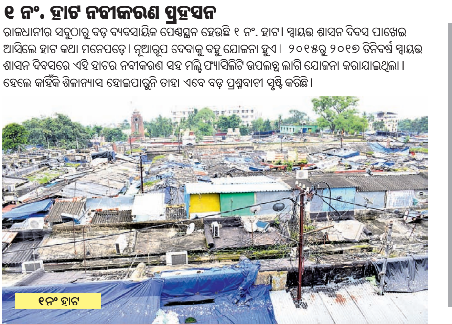
୧୯ ନଂ ହାଟ

ନାମକୁ ମାତ୍ର ପ୍ଲାଷ୍ଟିକ୍ ବ୍ୟାନ ଗତବର୍ଷ ଗଣ୍ଡା ଜରଡ଼ାରୁ ସହରରେ ପ୍ଲାଷ୍ଟିକ୍ ବ୍ୟାନ କରାଯାଇଥିଲା। କିଛିଦିନ ଧରି ବ୍ୟାପକ ଚଢ଼ାଉ ଓ ପଦକ୍ଷେପ ନିଆଗଲା। ତା'ରେ ସବୁକିଛି ପୂର୍ବଭଳି ଚାଲିଲା। ମନେ ପଡ଼ିଯିବା ପରେ ଗତ ଋତୁ ଓ ଭୁଲାଇ ମାସରେ ପୁଣି ଚଢ଼ାଉ କରାଯାଇଥିଲେ ମଧ୍ୟ ଏହାର କିଛି ବି ଫଳକ ପଡ଼ିନାହିଁ। ଏବେ ବି ବେଧଡ଼କ ନିଷେଧ ପଲିଥିନ ବ୍ୟବହାର ହେଉଛି। ଏଥିଯୋଗୁ ସହରରେ ଆବର୍ଜନା ସମସ୍ୟା ବଢ଼ିବା ସହ ପରିବେଶ ପ୍ରଦୂଷିତ ହେଉଛି।