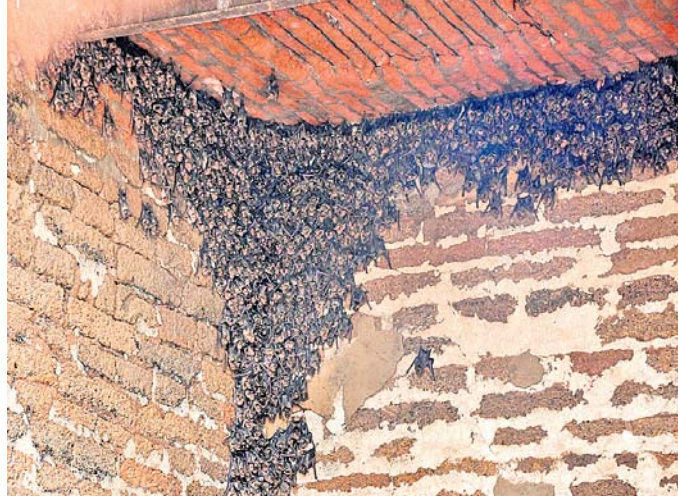
ମଠର ବହୁ ପୁରାତନ କୋଠିଘର ଭଙ୍ଗାଯିବା ପରେ ବାହାରିଥିବା ହଜାର ହଜାର ଚେନେଣି ।