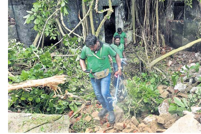
ମଠ ପରିସରରେ ସ୍ନେହ ହେଲେଇ ଲାଲେଇ ସଦସ୍ୟମାନେ ସାପ ଖୋଲୁଛନ୍ତି ।