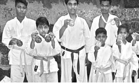
ପଦକ ପ୍ରାପ୍ତ କରିଥିବା କୃତୀ ପ୍ରତିଯୋଗୀ ।