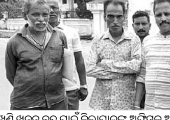
ଖଣି ଖନନ ବନ୍ଦ ପାଇଁ ଜିଲ୍ଲାପାଳଙ୍କୁ ଅଭିଯୋଗ କରିବାକୁ ଆସିଥିବା ଲୋକମାନେ ।

ଖୋର୍ଦ୍ଧା ଅଫିସ୍, ୨୯।୮:- ଖୋର୍ଦ୍ଧା ତହସିଲ ଧରଲିପୁର ପଞ୍ଚାୟତ ଅଧୀନ ନରସିଂହପ୍ରସାଦ ଟୋଳାରେ ପ୍ରଶାସନ କରିଥିବା ମାଙ୍କଡ଼ା ଖଣି ନିଲାମର ପ୍ରତିବାଦ ଉଠିଛି । ପୁଣି ଆଉ କିଛି ଅଞ୍ଚଳ ନିଲାମ ଦିଆଯିବାର ରହିଛି ତେବେ ନିଲାମ ପୂର୍ଣ୍ଣ ସର୍ବାଧିକାର ଗ୍ରହଣରେ ନେତୃତ୍ୱ