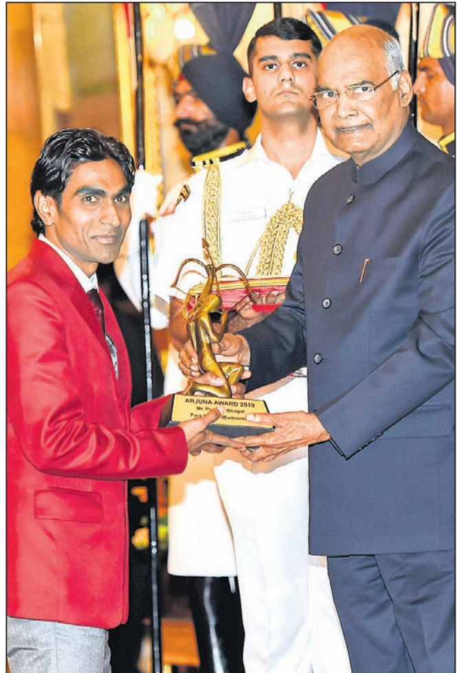
ନୂଆଦିଲ୍ଲୀରେ ଜାତୀୟ କ୍ରୀଡ଼ା ପୁରସ୍କାର ପ୍ରଦାନ ଅବସରରେ ରାଷ୍ଟ୍ରପତି ରାମନାଥ କୋବିନ୍ଦ ଗୁରୁବାର ଓଡ଼ିଶାର ପାରା ବ୍ୟାଡ୍ମିଣ୍ଟନ ଖେଳାଳି ପ୍ରମୋଦ ଭଗତଙ୍କୁ ଅର୍ଜୁନ ପୁରସ୍କାରରେ ସମ୍ମାନିତ କରୁଛନ୍ତି। (ରିପୋର୍ଟ ଖେଳ ପୃଷ୍ଠାରେ)

ଅବସ୍ଥାରେ ଥିବାରୁ ଏହା ମଧ୍ୟରେ ମାଙ୍କଡ଼, ଚେମ୍ପୈଆ, ମୁଷା ଏବଂ ବିଭିନ୍ନ ପ୍ରକାର ପକ୍ଷୀ ବାସ କରୁଥିଲେ। ବିଷଧର ସାପ ଥିବା ଆଖିକାରେ ଏହି କୋଠି ଘର ଭଙ୍ଗାଯିବା ପୂର୍ବରୁ ସ୍ୱେଚ୍ଛା ଲାଭନର ସହାୟତା ନିଆଯାଇଥିଲା। ସ୍ୱେଚ୍ଛା ଲାଭନର ସହଯୋଗରେ ଏହି ଘର ଭିତରକୁ ପଶି ସାପ ଖୋଜିଥିଲେ। ତେବେ ଘରଟି ବିପଦସଙ୍କୁଳ ଅବସ୍ଥାରେ ଥିବାରୁ ଏହା ଭିତରେ ଅଧିକ ସମୟ ରହିବା ନିରାପଦ ନ ମଣି ସେମାନେ ଫେରି ଆସିଥିଲେ। କୋଠି ଘର ଭଙ୍ଗାଯିବା ପରେ ଏକ ସୁଡ଼ଙ୍ଗ ଥିବା ଜଣାପଡ଼ିଛି। ଉଚ୍ଚ ସୁଡ଼ଙ୍ଗରୁ ରୂପ କୋଠରୀକୁ ବାଟ ରହିଛି ଓ ରୂପ କୋଠରୀରେ ସୁନା, ପୃଷ୍ଠା-୪