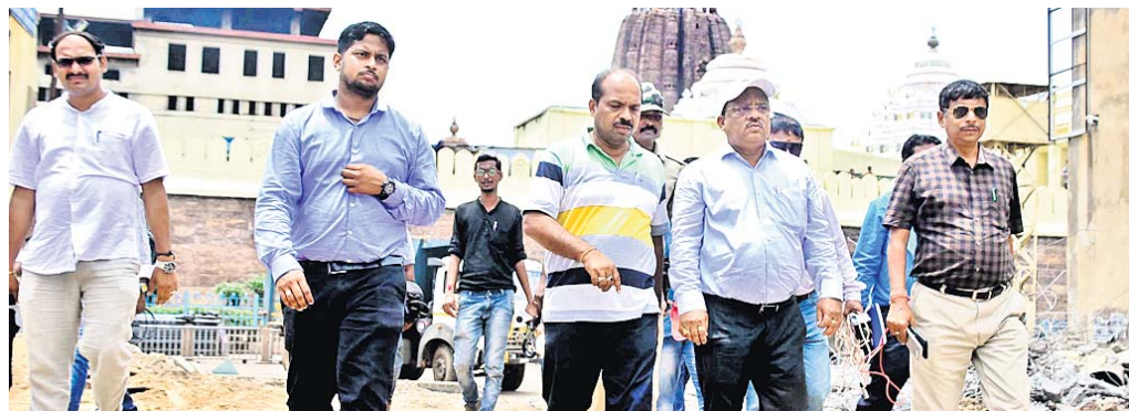
ଉଚ୍ଛେଦ କାର୍ଯ୍ୟ ତଦାରଖ କରୁଛନ୍ତି ଆର୍ତ୍ତସି ଏବଂ ଅନ୍ୟ ଅଧିକାରୀମାନେ ।