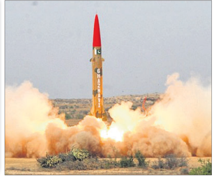
ଫୈଜଲ୍ କେପ୍‌ଟ୍-୧୭ ମୁକ୍ତାସ୍ତ୍ରରୁ ସଫଳତା ଖାନକୋଶଳରେ ନିର୍ମିତ ‘ସ୍ମାର୍ଟ ଫ୍ରିପର୍’ କେପ୍‌ଟ୍-୧୭ ମୁକ୍ତାସ୍ତ୍ରରୁ ପରୀକ୍ଷା କରିଥିଲା ।

ଜମ୍ମୁ-କଶ୍ମୀର ସମ୍ପର୍କିତ କେନ୍ଦ୍ର ସରକାରଙ୍କ ନିଷ୍ପତ୍ତି ପରେ ଭାରତକୁ ବାରମ୍ବାର ଆଣବିକ ଅସ୍ତ୍ର ପ୍ରୟୋଗର ଧମକ ଦେଇ ଯୁଦ୍ଧ ଭୟ ଦେଖାଉଥିବା ପାକିସ୍ତାନ ଶେଷରେ ଏକ ସେପଟାସ୍ତ୍ର ପରୀକ୍ଷା କରିଛି । ଗଜ୍ଜନବା ନାମକ ଏହି ସ୍ତ୍ରୁ ପୁରଗାମା ମିଆଇଲ୍‌ରେ ପରୀକ୍ଷାକୁ ଭାରତ କିମ୍ପା ଅନ୍ତର୍ଜାତୀୟ ସମୁଦାୟ ଗୁରୁତ୍ଵ ଦେଇ ନ ଥିବାବେଳେ ପାକିସ୍ତାନୀ ସେନା ଓ ଶାନ୍ତି ନେତୃତ୍ଵ ଏହାକୁ ଏକ ବଡ଼ ସଫଳତା ବୋଲି ବିବେଚନା କରି ଆତ୍ମସନ୍ତୋଷ ଲାଭ କରିଛନ୍ତି । ଭାରତ ବିରୋଧୀ ଅପପ୍ରଚାରରେ ସବୁ ମାଞ୍ଚରେ ବିଫଳ ହୋଇଥିବା ଇସ୍ଲାମାବାଦର ଏହି ପଦକ୍ଷେପ ପାକିସ୍ତାନୀମାନଙ୍କୁ ଖୁସି କରିବା ପାଇଁ ଉଦ୍ଦିଷ୍ଟ ବୋଲି କୁହାଯାଉଛି ।