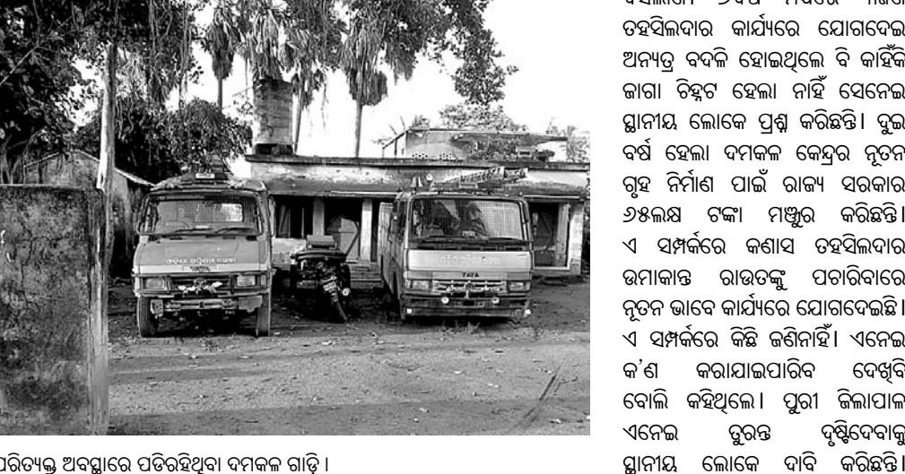
ପରିତ୍ୟକ୍ତ ଅବସ୍ଥାରେ ପଡ଼ିରହିଥିବା ଦମକଳ ଗାଡ଼ି।

ପୁରୀ ଜିଲ୍ଲା କଣାସ ବ୍ଲକରେ ଦୀର୍ଘଦିନରୁ ଏକ ଦମକଳ କେନ୍ଦ୍ର ପାଇଁ ଦାବି ହେଉଥିବାବେଳେ ୨୦୧୩ରେ ରାଜ୍ୟ ସରକାର ଏଥିପାଇଁ ଅର୍ଥ ମଞ୍ଜୁର କରିଥିଲେ। ଅପ୍ରାୟ ଭାବେ କଣାସ ପଞ୍ଚାୟତ ସମିତି କାର୍ଯ୍ୟାଳୟ ନିକଟରେ ଏକ ବରଗଛ ତଳେ ୨ଟି ଦମକଳ ରଖାଯାଇ ପୁଞ୍ଜମନୁ ନବୀନ ପଟ୍ଟନାୟକଙ୍କ ଦ୍ୱାରା ଉଦ୍‌ଘାଟନ କରାଯାଇଥିଲା। ମାତ୍ର ଏହା ପରେ ୨ବର୍ଷ ବିତିଯାଇଥିଲେ ବି ସ୍ଥାୟୀ ଦମକଳ କେନ୍ଦ୍ର ନିର୍ମାଣ ପାଇଁ ତହସିଲଦାର ଜାଗା ଚିହ୍ନିତ କରିପାରି ନ ଥିବାରୁ ବରଗଛ ତଳେ ଥିବା ଦୁଇଟି ନୂଆ ଦମକଳ ଗାଡ଼ିଖତ ଖାଇବାକୁ