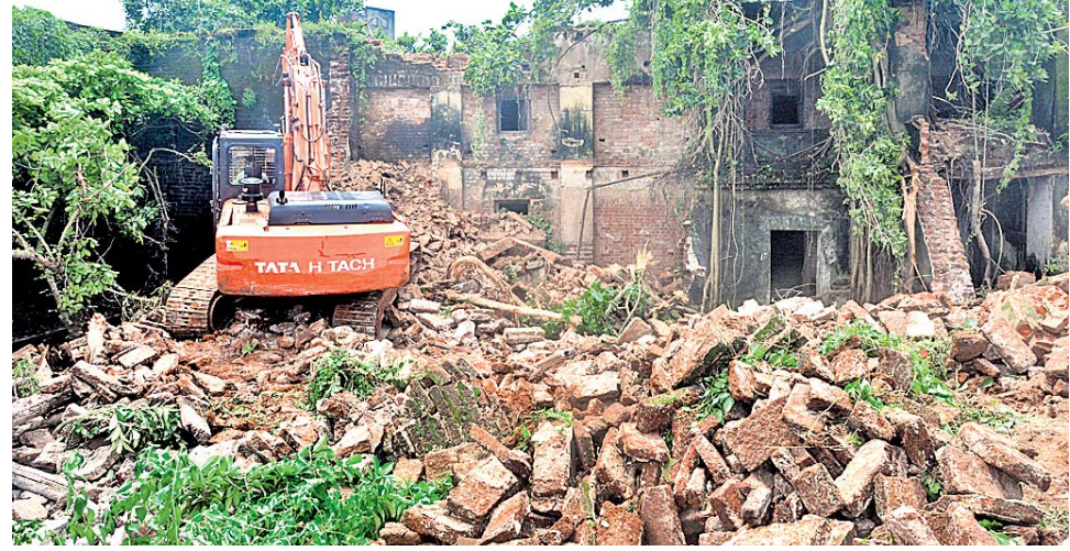
ଏମାର ମଠର ଖମାର ଘରକୁ ବୁଲିବେଳେ ସାହାଯ୍ୟରେ ଭଙ୍ଗାଯାଇଛି ।

ସେଇମାନେ ଗୁଡ଼ାଏ କଥା କୁହନ୍ତି, ସେମାନେ ଖୁବ୍ କମ୍ ଦିଶା କରନ୍ତି। -ଜନ ପ୍ରାଣଚେତନ