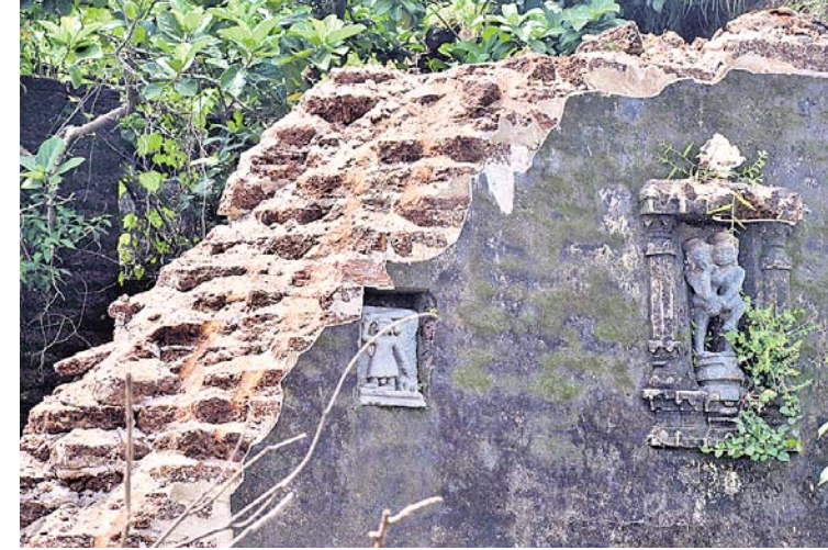
ମଠ କାନ୍ଧରେ ଥିବା ପୁରାତନ ମୂର୍ତ୍ତି ।