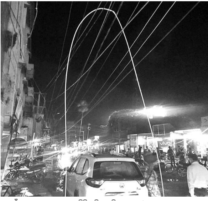
ବାଲୁଗା ବଜାର ଉପର ରାସ୍ତାରେ ଛିଡ଼ି ପଡ଼ିଥିବା ବିଦ୍ୟୁତ୍ ତାର ।