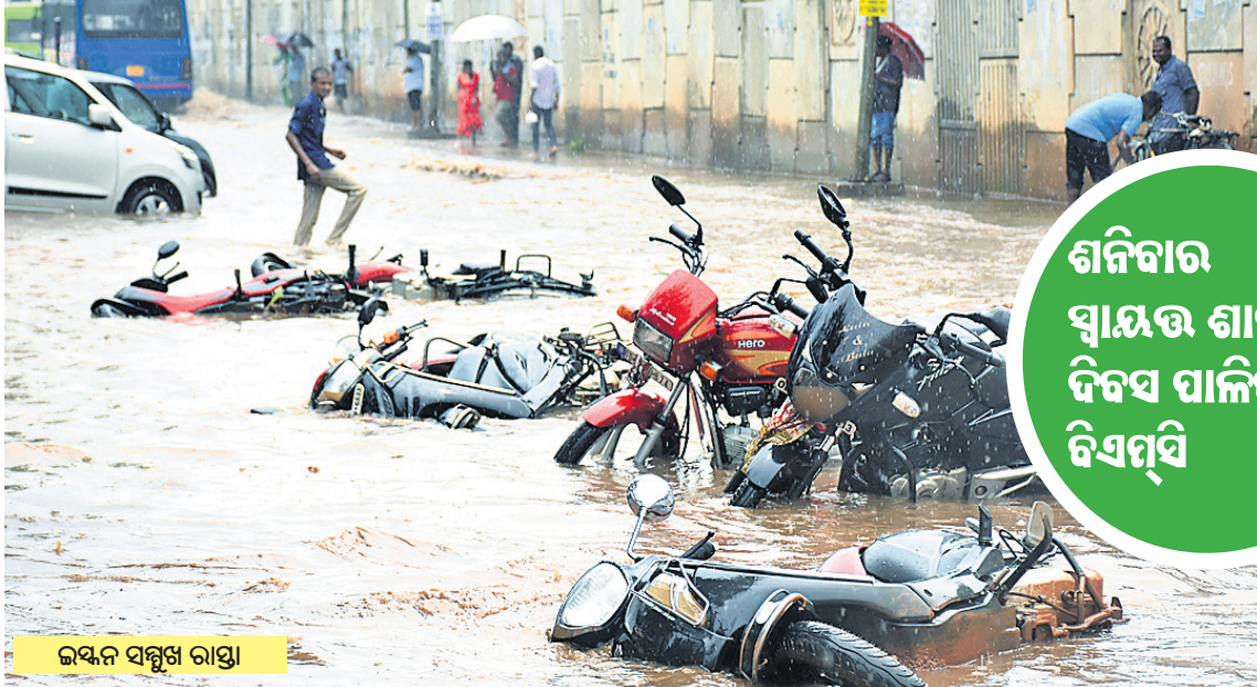
ଜୟନ ସମ୍ପୂର୍ଣ୍ଣ ରାସ୍ତା

ଶନିବାର ସ୍ୱାୟତ୍ତ ଶାସନ ଦିବସ ପାଳିବ ବିଏମ୍‌ସି