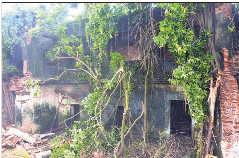
ଏମାର ଘରର ଭୂତଳ କୋଠରୀ।