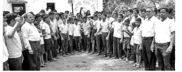
କାର୍ଯ୍ୟକ୍ରମରେ ଅତିଥି ଏବଂ ଛାତ୍ରୀଛାତ୍ରମାନେ।

ସତ୍ୟବାଦୀ ଉଚ୍ଚ ବିଦ୍ୟାଳୟରେ ଜାତୀୟ କ୍ରୀଡ଼ା ଦିବସ ଗୁରୁବାର ପାଳିତ ହୋଇଯାଇଛି। ହକି ଖେଳର ଯାଦୁଗର ଧ୍ୟାନଚାନ୍ଦଙ୍କ କବ୍ଚିତ୍ୱ ଅଗଷ୍ଟ ୨୯କୁ ଜାତୀୟ କ୍ରୀଡ଼ା ଦିବସ ଭାବେ ପାଳନ କରାଯାଇଛି। ପୁରୁ ଜୀବନ ପାଇଁ କ୍ରୀଡ଼ାର ଆବଶ୍ୟକତା ସହିତ ନିୟମିତ ଅଭ୍ୟାସରେ ଜଣେ ସଫଳ କ୍ରୀଡ଼ାବିତ୍ ଭାବରେ ନିଜକୁ ବଢ଼ିତୋଳିବାକୁ ଉପସ୍ଥିତ ଛାତ୍ରୀଛାତ୍ରୀଙ୍କୁ ଶିକ୍ଷକମାନେ ପରାମର୍ଶ ଦେଇଥିଲେ। ବ୍ୟାନର ଓ ପ୍ଲାକାର୍ଡ ଧରି ପିଲାମାନେ ବିଦ୍ୟାଳୟରୁ ଏକ ଶୋଭାଯାତ୍ରାରେ ବାହାରି ସାକ୍ଷୀଗୋପାଳ