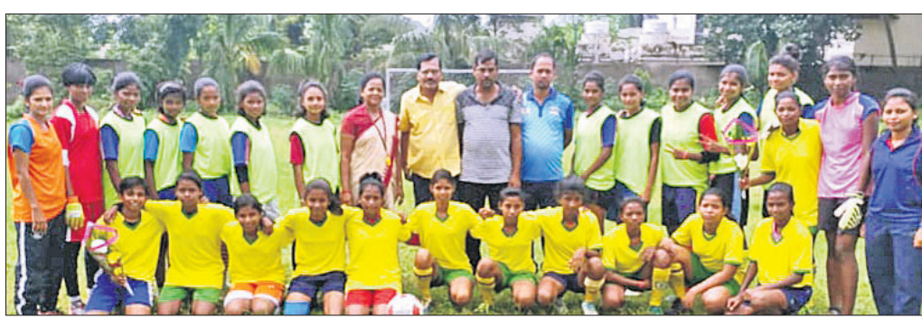
ଜାତୀୟ କ୍ରୀଡ଼ା ଦିବସ ଉପଲକ୍ଷେ ଅନୁଷ୍ଠିତ ଫୁଟ୍‌ବଲ, କବାଡ଼ି ଓ ଖୋ ଖୋ ପ୍ରତିଯୋଗିତାରେ ଭାଗ ନେଇଥିବା ଖେଳାଳିଙ୍କ ସହ ଅତିଥିଙ୍କୁ।

ଭୁବନେଶ୍ୱର, ୨୯।୮ (କ୍ରୀଡ଼ା ପ୍ରତିନିଧି) ଜାତୀୟ କ୍ରୀଡ଼ା ଦିବସ ଅବସରରେ ଗୁରୁବାର ଭୁବନେଶ୍ୱର-୯ ସରକାରୀ ବାଳିକା ଉଚ୍ଚ ବିଦ୍ୟାଳୟ ଖେଳପଡ଼ିଆରେ ଫୁଟ୍‌ବଲ, କବାଡ଼ି, ଖୋ ଖୋ ପ୍ରତିଯୋଗିତା ଆୟୋଜିତ ହୋଇଛି। ଏଥିରେ ୮ଟି ଦଳ ଅଂଶଗ୍ରହଣ କରିଥିଲେ। ଭୁବନେଶ୍ୱର-୯ ଓ ଘାଟିକିଆ