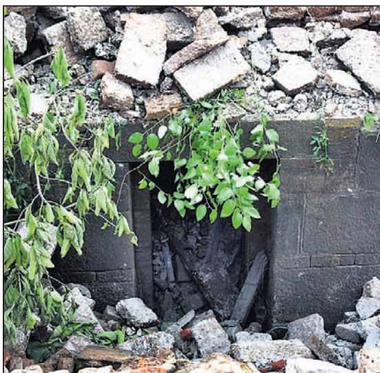
ଏମାର ମଠ ପରିସରରେ ଥିବା ସୁଡ଼ଙ୍ଗ।

ପୁରୀ ଅଫିସ, ୨୯/୮ ଭଙ୍ଗାଯାଇଛି ବହୁତକିଛି ଏମାର ମଠ। ଚାଲିଛି ଉଦ୍ଧେଦ ପ୍ରକ୍ରିୟା। ଆଉ କିଛିଦିନ ପରେ ସମ୍ପୂର୍ଣ୍ଣ ଭାବେ ମାଟିରେ ମିଶିଯିବ ଏହି ମଠ। ତେବେ ଏହି ପ୍ରାଚୀନ ମଠ ଭଙ୍ଗାଯିବା ପରେ ମିଳିଥିବା ଭୂତଳ