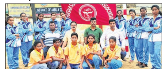
କର୍ମକର୍ତ୍ତାଙ୍କ ସହ ଓଡ଼ିଶା ଥ୍ରୋ ବଲ୍ ଦଳର ଖେଳାଳିମାନେ।