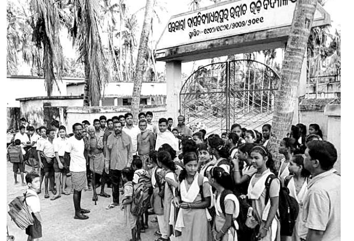
ବିଦ୍ୟାଳୟରେ ତାଲା ପକାଇ ଅଭିଭାବକ ଓ ଛାତ୍ରୀଛାତ୍ରମାନେ ବାହାରେ ଠିଆ ହୋଇଛନ୍ତି।