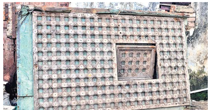
ଏମାର ମଠ ସମ୍ପୂର୍ଣ୍ଣ ସ୍ତରରେ ଭାଙ୍ଗିଥିବା ପୁରାତନ କବାଟ ।

ଲୋଡ଼ିଥିବା ବେଳେ ଏଥିପାଇଁ କଷ୍ଟ ହେବ । କିନ୍ତୁ ଯେଉଁମାନଙ୍କର କ୍ଷତି ହେବ ସେମାନଙ୍କୁ ଉପଯୁକ୍ତ ଅଭିଯାନ କରାଯିବ ବୋଲି ମୁଖ୍ୟମନ୍ତ୍ରୀ ଆଶ୍ୱାସନା ଦେଇଛନ୍ତି । ତେଣୁ କ୍ଷତିଗ୍ରସ୍ତ ଥିବା କରାଯିବା ସହିତ ସେମାନଙ୍କ କ୍ଷତିର ଭରଣା ଉପରେ ଗୁରୁତ୍ୱ ମୁଖ୍ୟମନ୍ତ୍ରୀ ପୁରୀବାସୀଙ୍କ ସହଯୋଗ ଦେଇଛନ୍ତି ଜଗଦ୍‌ଗୁରୁ ଶଙ୍କରାଚାର୍ଯ୍ୟ ।