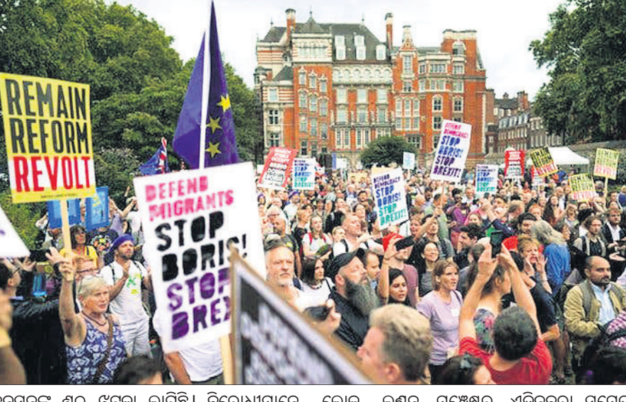
ଜନସନଙ୍କୁ ଶକ୍ତ ଝଟକା ଲାଗିଛି । ବିରୋଧୀମାନେ ତାଙ୍କ ନିଷ୍ପତ୍ତିକୁ ବିଦ୍ରୋହ ଏବଂ ସମ୍ପ୍ରଦାୟର ଉଲ୍‌ଘନ କହିଛନ୍ତି । ଏହା ଉପରେ ରହିତାଦେଶ ଲାଗି ପାଇଁ ଲଣ୍ଡନ, ଏଡିନବରା ଓ ବେଲଫାଷ୍ଟ କୋର୍ଟରେ ଆବେଦନ କରିଛନ୍ତି । ଗୁରୁବାର ହଜାର ହଜାର

ୟୁରୋପୀୟ ସଂଘ (ଇୟୁ)ରୁ ବ୍ରିଟେନର ପ୍ରସ୍ଥାନ ଲାଗି ଆଉ ମାତ୍ର କେଇ ସପ୍ତାହ ବାକି ଥିବାବେଳେ ପ୍ରଧାନମନ୍ତ୍ରୀ ବୋରିସ୍ ଜନସନ ପାର୍ଲୀମେଣ୍ଟ ଅଧିବେଶନକୁ ସ୍ଥଗିତ ରଖିବା ପାଇଁ ନିଷ୍ପତ୍ତି ନେଇଥିବାରୁ ଏହାକୁ କୋର୍ଟରେ ଚ୍ୟାଲେଞ୍ଜ କରାଯାଇଛି । ୟୁରୋପୀୟ ସମର୍ଥକ ତଥା ବିନା ବୁକ୍ସିନାମା ଟ୍ରେକ୍‌ଟିଟ୍‌କୁ ବିରୋଧ କରୁଥିବା ଏମ୍‌ପିମାନେ ପ୍ରଧାନମନ୍ତ୍ରୀଙ୍କ ନିଷ୍ପତ୍ତିକୁ କଡ଼ା