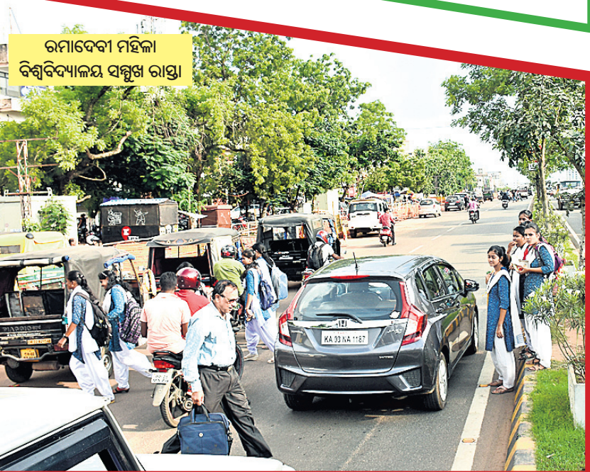
ରମାଦେବୀ ମହିଳା ବିଶ୍ୱବିଦ୍ୟାଳୟ ସମ୍ପୂର୍ଣ୍ଣ ରାସ୍ତା

କ୍ୟୁଆଡ଼େ ଗଲା ରମାଦେବୀ ବିଶ୍ୱବିଦ୍ୟାଳୟ ସମ୍ପୂର୍ଣ୍ଣ ପୁର୍ବ ଓଉରଡ୍ରିଜ୍ ପ୍ରତିଦିନ ରମାଦେବୀ ମହିଳା ବିଶ୍ୱବିଦ୍ୟାଳୟ ସମ୍ପୂର୍ଣ୍ଣରେ ଛାତ୍ରୀ, ଅଭିଭାବକ, ଅଧ୍ୟାପକ ଓ ସାଧାରଣ ଲୋକେ ରାସ୍ତା ଅତିକ୍ରମ କରିଥାନ୍ତି। ତେଣୁ ଏଠାରେ ପୁର୍ବ ଓଉରଡ୍ରିଜ୍ କରିବା ଲାଗି ୨୦୧୧ ସ୍ୱାୟତ୍ତ ଶାସନ ଦିବସରେ ତତ୍କାଳୀନ ମନ୍ତ୍ରୀ ଦେବୀ ପ୍ରସାଦ ମିଶ୍ର, ମନ୍ତ୍ରୀ ପ୍ରଫୁଲ୍ଲ ସାମଲ, ମନ୍ତ୍ରୀ ସୀତଲ ପ୍ରସାଦ ନାୟକ, ମନ୍ତ୍ରୀ ଅତରୁ ସବ୍ୟସାଚୀ ନାୟକ, ମନ୍ତ୍ରୀ ସଞ୍ଜୀବ ସାହୁ ଏମ୍‌ପି ପ୍ରସାର ପାଟଣାଶାଳ ଦ୍ୱାରା ଭିତ୍ତିପ୍ରସ୍ତର ପଡ଼ିଥିଲା। ୮ ବର୍ଷ ବିତିଯାଇଥିଲେ ମଧ୍ୟ କେବଳ ଫଳକରେ ସୀମିତ ରହିଛି ପୁର୍ବ ଓଉରଡ୍ରିଜ୍ ଓ ଏବେବି ଛାତ୍ରୀମାନେ ବିପଦପୂର୍ଣ୍ଣ ଭାବେ ରାସ୍ତା ଅତିକ୍ରମ କରୁଛନ୍ତି। ବିଏମ୍‌ସି ନୀରବତା ସୃଷ୍ଟି କରିଛି। ହୋଲ୍‌ଡିଂ ଟ୍ୟାକ୍ସ ଆଦାୟ କମୁଛି ଭୁବନେଶ୍ୱରରେ ହୋଲ୍‌ଡିଂ ଟ୍ୟାକ୍ସର ବ୍ୟାପକ ଘୋଟାଳା ଦେଖିବାକୁ ମିଳୁଛି। ଟ୍ୟାକ୍ସ ଫାଇବର ଅବା ବ୍ୟବସାୟିକ ପ୍ରତିଷ୍ଠାନକୁ ଘରୋଇ ବର୍ଗାଇ କମ୍ ଟ୍ୟାକ୍ସ ଦିଆଯାଉଛି। ଟ୍ୟାକ୍ସ କଲେକ୍ଟରମାନେ ମଧ୍ୟ ଏଥିପ୍ରତି କୌଣସି କାର୍ଯ୍ୟାନୁଷ୍ଠାନ ଗ୍ରହଣ କରୁ ନ ଥିବାରୁ ବିଏମ୍‌ସି କୋଟି କୋଟି ଟଙ୍କାର ରାଜସ୍ୱ ହରାଉଛି।