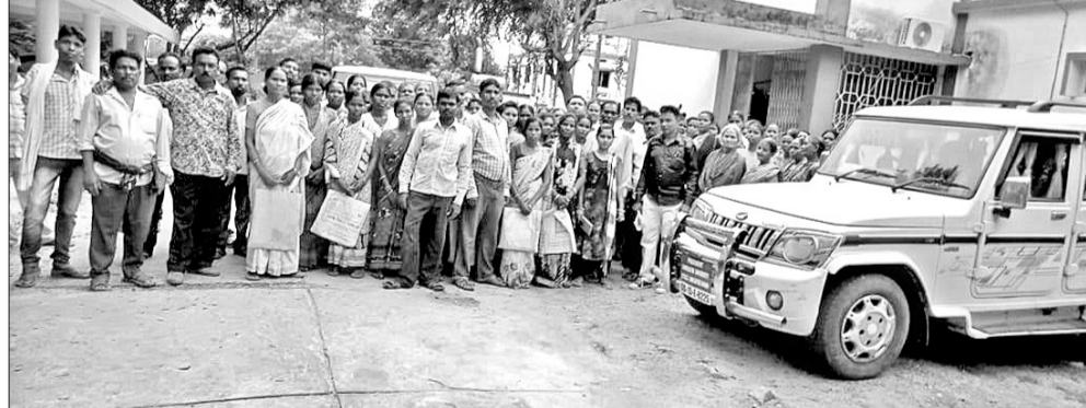
ଜିଲ୍ଲାପାଳଙ୍କୁ ଫେରାର ହୋଇଥିବା ଅସହାୟ ପରିବାର ଲୋକେ।