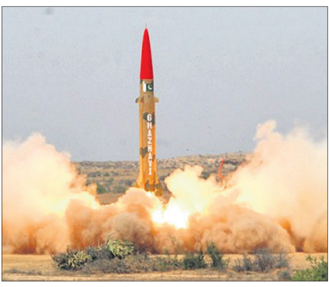
ଫିଏନ୍-୧୭ ମୂଳବିମାନରୁ ପରୀକ୍ଷା କରାଯାଇଥିବା 'ଗଜନବା' ପ୍ରକଳ୍ପରୁ ନିର୍ଗତ ହେଉଥିବା 'ଗଜନବା' ମିସାଇଲ୍

କମ୍ପ୍ୟୁଟର ସମ୍ପର୍କିତ କେନ୍ଦ୍ର ସରକାରଙ୍କ ନିଷ୍ପତ୍ତି ପରେ ଭାରତକୁ ବାରମ୍ବାର ଆଣବିକ ଦେଖାଉଥିବା ପାକିସ୍ତାନ ଶେଷରେ ଏକ ସେପଟାସ୍ତ୍ର ପରୀକ୍ଷା କରିଛି। ଗଜନବା ନାମକ ଏହି ସ୍ତ୍ର ବୃତ୍ତାମା ନିୟାନ୍ତ୍ରଣ ପରୀକ୍ଷାକୁ ଭାରତ କିମ୍ବା ଅନ୍ତର୍ଜାତୀୟ ସମୁଦାୟ ଗୁରୁତ୍ୱ ଦେଇ ନ ଥିବାବେଳେ ପାକିସ୍ତାନ ସେନା ଓ ଶାନ୍ତି ନେତୃତ୍ୱ ସହାୟ ଏକ ବଡ଼ ସଫଳତା ବୋଲି ବିବେଚନା କରି ଆତ୍ମସନ୍ତୋଷ ଲାଭ କରିଛନ୍ତି। ଭାରତ ବିରୋଧୀ ଅପପ୍ରଚାରରେ ସବୁ ମଞ୍ଚରେ ବିଫଳ ହୋଇଥିବା ଇସ୍ଲାମାବାଦର ଏହି ପଦକ୍ଷେପ ପାକିସ୍ତାନୀୟ ଖୁସି କରିବା ପାଇଁ ଉଦ୍ଦିଷ୍ଟ ବୋଲି କୁହାଯାଇଛି।