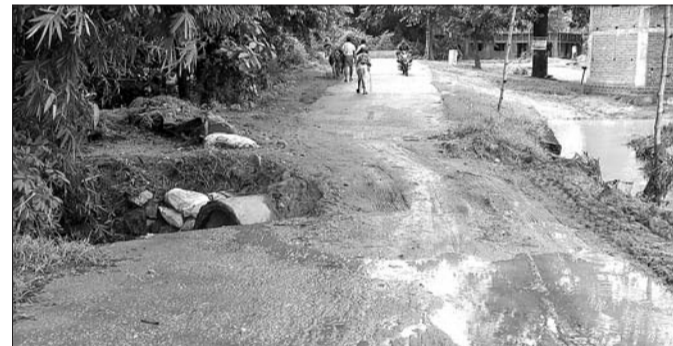
ସାଲେପାଲି ଗ୍ରାମକୁ ସଂଯୋଗ କରୁଥିବା କଲଭର୍ଟ।

ରହିଛି। ବର୍ଷା ଯୋଗୁ କଲଭର୍ଟର ଗୋଟିଏ ପାର୍ଶ୍ଵ ଖାଲ ଗଲୁଣ୍ଡି। ଫଳରେ ରାସ୍ତାରେ ଯିବା ଆସିବା ବିପଦ ହୋଇପଡ଼ିଛି।