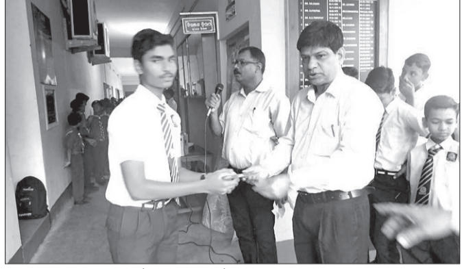
ଜାତୀୟ କ୍ରୀଡ଼ା ଦିବସ ପ୍ରଶଂସା କାର୍ଯ୍ୟକ୍ରମରେ କୃତୃ ଅର୍ଜନ କରିଥିବା ଛାତ୍ର ଛାତ୍ରୀଙ୍କୁ ପ୍ରଧାନ ଶିକ୍ଷକ ପୁରସ୍କୃତ କରୁଛନ୍ତି।