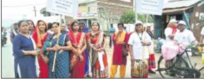
ସଫେଇରେ ସାମିଲ ହେବା ସେବା ।

ଦିଗପହଣ୍ଡି ଏନ୍‌ଏସି ପକ୍ଷରୁ ସ୍ୱାସ୍ଥ୍ୟ ଶାସନ ସମ୍ପ୍ରଦାୟ ପାଳନ ଅବସରରେ ବୁଧବାର ମିଳିତ ସଫେଇ ଅଭିଯାନ, ସଭା ଓ ଶୋଭାଯାତ୍ରା ହୋଇଯାଇଛି।