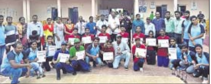
ସମ୍ବର୍ଦ୍ଧିତ ହୋଇଥିବା କୋଟ ଓ ଖେଳାଳିମାନେ ।