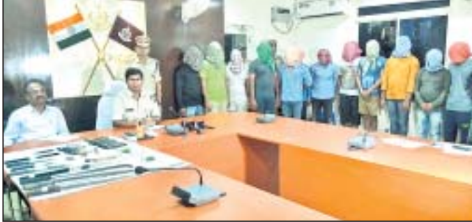
ଖବରଦାତା ସମ୍ମାନନାରେ ଏସପି ସୂଚନା ଦେଉଛନ୍ତି ।

ଛତ୍ରପୁର/ଆସିକା/ବ୍ରହ୍ମପୁର, ୨୯/୮ (ଡି.ଏନ.ଏ.)