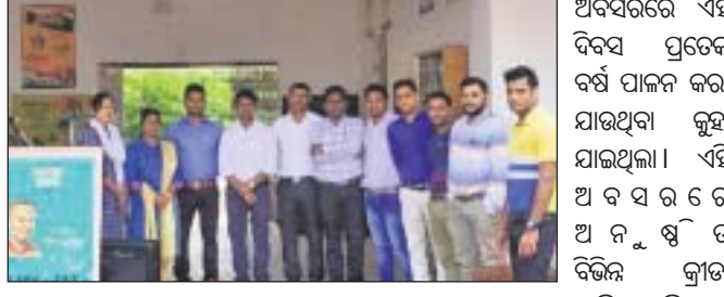
ଜାତୀୟ କ୍ରୀଡ଼ା ଦିବସ ଓ ସଂସ୍କୃତ ପକ୍ଷ ପାଳନ କରାଯାଇଛି।

ଦାରିଙ୍ଗବାଡ଼ି ବ୍ଲକ୍ ଓଡ଼ିଶା ଆଦର୍ଶ ବିଦ୍ୟାଳୟ ପରିସରରେ ଜାତୀୟ କ୍ରୀଡ଼ା ଦିବସ ଏବଂ ସଂସ୍କୃତ ପକ୍ଷ ପାଳନ ହୋଇଯାଇଛି।