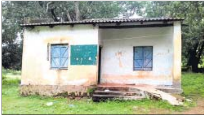
କାଣ୍ଡିବାଳି କୃଷି କାର୍ଯ୍ୟାଳୟ। ଆସୁଥିବା ଦେଖାଯାଇଛି। ୨୦୧୫ରେ ପଞ୍ଚାୟତରେ ଥିବା ତତ୍କାଳୀନ କୃଷି କର୍ମଚାରୀଙ୍କ ସହ ମିଶି କାର୍ଯ୍ୟାଳୟରେ ଶିକ୍ଷକଙ୍କୁ ରହୁଥିଲେ।

ପିରିଲିଆ ବ୍ଲକ୍ କାଣ୍ଡିବାଳି ପଞ୍ଚାୟତରେ ନିୟୁତ କୃଷି କର୍ମଚାରୀ କାର୍ଯ୍ୟାଳୟକୁ ଆସୁନାହାନ୍ତି। ଫଳରେ ପଞ୍ଚାୟତରେ ଚାଷୀମାନେ ଠିକ୍ ସମୟରେ ସରକାରଙ୍କ ସୁବିଧା ସୁଯୋଗର ଲାଭ ଉଠାଇ ପାରୁନାହାନ୍ତି।