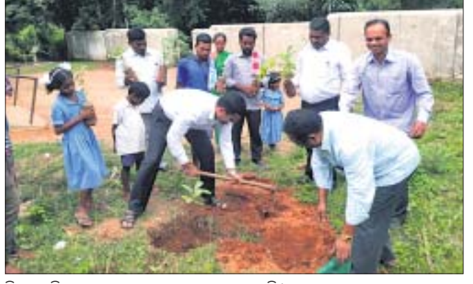
ବିଚାରପତି ଏବଂ ଅନ୍ୟମାନେ ଚାରାରୋପଣ କରୁଛନ୍ତି।

ଦାରିଙ୍ଗବାଡ଼ି, ୩୦।୮ (ଡି.ଏନ.ଏ.) 'ଗଛଟିଏ ତ ପିଲାଟିଏ' ଏକି ଉଦ୍ଦେଶ୍ୟରେ ବିଚାରପତି ଚାରା ରୋପଣ କରାଯାଇଛି।