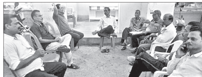
ବୈଠକରେ ପୂଜା କମିଟି କର୍ମକର୍ମୀମାନେ।