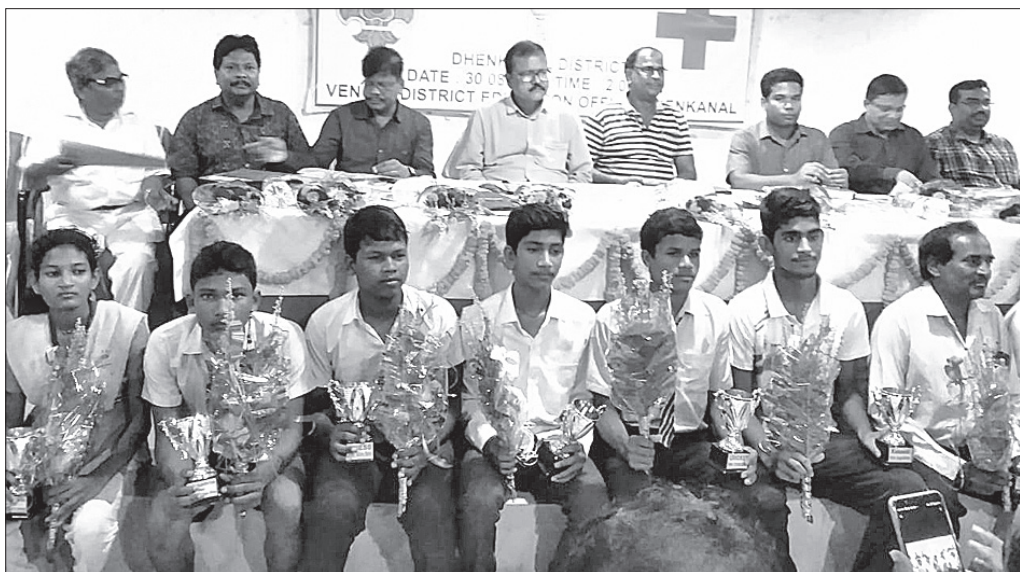
ବୈଠକରେ ଶିକ୍ଷା ବିଭାଗ ଅଧିକାରୀଙ୍କ ସମେତ ଅନ୍ୟମାନେ।

ଡେକାନାଲ ଜିଲ୍ଲା ଶିକ୍ଷାଧିକାରୀଙ୍କ କାର୍ଯ୍ୟକ୍ରମରେ ଶୁକ୍ରବାର ମିଳିତ ବାର୍ଷିକ ସାଧାରଣ ପରିଷଦ ବୈଠକ ଅନୁଷ୍ଠିତ ହୋଇଯାଇଛି।