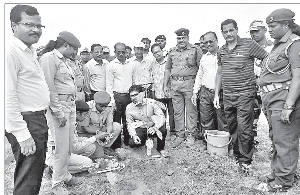
ଚାରାରୋପଣ କାର୍ଯ୍ୟକ୍ରମରେ ଅତିଥିଙ୍କ ସମେତ ଅନ୍ୟମାନେ।