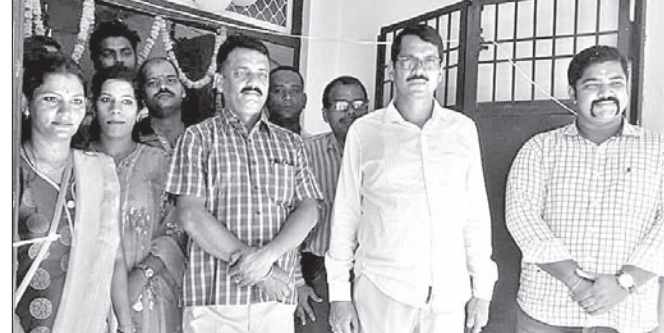
ଅବକାରୀ ଥାନା ଉଦ୍‌ଘାଟନା କାର୍ଯ୍ୟକ୍ରମରେ ଅତିଥିଙ୍କ ସମେତ ଅନ୍ୟମାନେ।