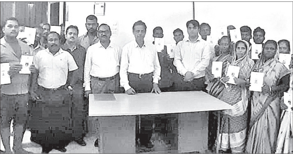
ଅତିଥିଙ୍କ ଗହଣରେ ପରିଚୟପତ୍ର ପାଇଥିବା ଶ୍ରମକର୍ମୀମାନେ।