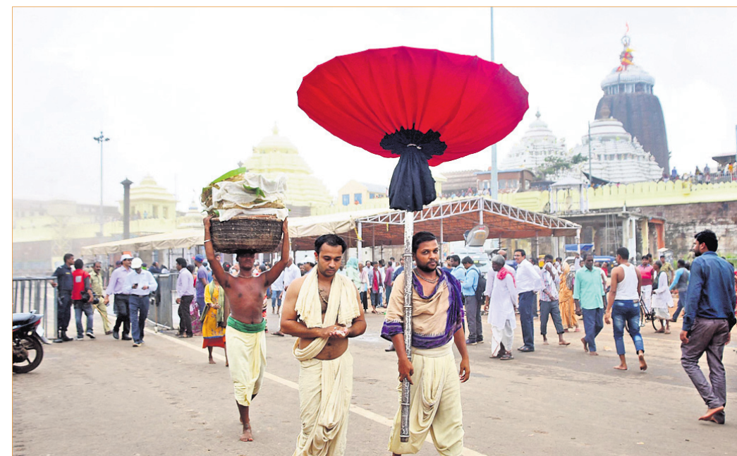
ଶ୍ରୀମନ୍ଦିରରୁ ଶ୍ରୀମନ୍ଦିରକୁ ସାତପୁରୀ ପିଠା ବିକେ କରାଯାଇଛି।

ସାତପୁରୀ ଅମାବାସ୍ୟାରେ ଶୁକ୍ରବାର ଶ୍ରୀମନ୍ଦିରରେ ମହାପ୍ରଭୁଙ୍କୁ ଲାଗି ହୋଇଛି ସାତପୁରୀ ପିଠା। ଅମାବାସ୍ୟା ହେତୁ ନାରାୟଣ ସାଗର ବିକେ କରିଛନ୍ତି। ଏଥିସହ ଶ୍ରୀମନ୍ଦିରରେ ଚାଲିଥିବା ଶ୍ରୀକୃଷ୍ଣ ଲୀଳାରେ ବସ୍ତ୍ର ହରଣ ନୀତି ମଧ୍ୟ ଅନୁଷ୍ଠିତ ହୋଇଛି। ଅବକାଶ ନୀତି ସମ୍ପନ୍ନ ପରେ ତିନିଦାଢ଼ରେ ବେଶ ବଜ୍ର ପୂର୍ଣ୍ଣ ଲୀଳାର ଲାଗି ହୋଇଥିଲା।