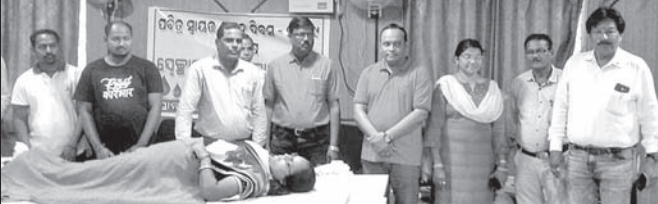
ପୌରସଂସ୍ଥା ପକ୍ଷରୁ ରକ୍ତଦାନ ଶିବିର।