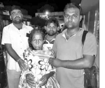
ଉଦ୍ଧାର ବୃଦ୍ଧାଙ୍କ ସହିତ ସ୍ୱେଚ୍ଛାସେବୀମାନେ। ଉପରୋକ୍ତ ସ୍ୱେଚ୍ଛାସେବୀମାନେ ବୃଦ୍ଧାଙ୍କୁ ଜିଲ୍ଲା ମୁଖ୍ୟ ଡାକ୍ତରଖାନାକୁ ଆଣିଥିଲେ ଏବଂ ଚିକିତ୍ସା ପରେ ତାଙ୍କ ପରିବାରବର୍ଗଙ୍କୁ ହସ୍ତାନ୍ତର କରିଥିଲେ।

ବରଗଡ଼ ସହର ଉପକଣ୍ଠ ବରଡ଼ୋଲ ନିକଟ ମୁଖ୍ୟ କେନାଲରେ ଭାସି ଯାଉଥିବା ଜଣେ ବୃଦ୍ଧାଙ୍କୁ ଗୁରୁବାର ଘାଟୀୟ ସ୍ୱେଚ୍ଛାସେବୀମାନେ ଉଦ୍ଧାର କରିଛନ୍ତି। ମହିଳା ଜଣକ ବରଗଡ଼ ସହରସ୍ଥିତ ଚୁଲସାନଗର ବାସିନୀ ବୁଲ୍ଡିଂ ଯାଏ (୧୦)।