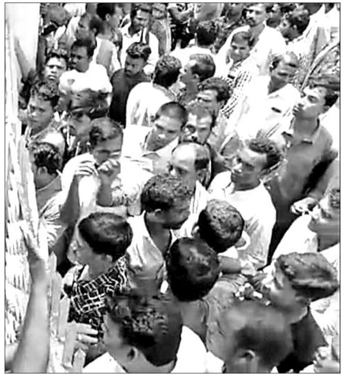
ବିନିକାରେ ଶୁକ୍ରବାର ବୁଦ୍ଧି ଚାଷୀଙ୍କ ବିକ୍ଷୋଭ।

ଓ ସହରର ବୁଦ୍ଧିଜୀବୀ ଉଦ୍ୟମ କରିବାକୁ ଦାବି ହେଉଛି। ଏ ସମ୍ପର୍କରେ ଦେବୋଇର ଅଧିକାରୀ ତଥା ଉପଜିଲ୍ଲାପାଳ ମଲ୍ଲିକ କୁହନ୍ତି କି ପାଇଥିବା ସେବାୟତ ଦେବାଙ୍କ ସେବା କାର୍ଯ୍ୟ କରିବାକୁ ବାଧ୍ୟ।