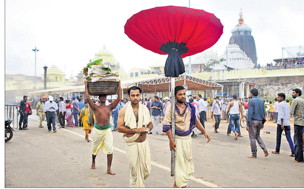
ଶ୍ରୀମନ୍ଦିରରୁ ଶ୍ରୀମନ୍ଦିର ସାତପୁରୀ ବିଜେ କରାଯାଇଛି।

ପୁରୀ ଅପିଏ, ୩୦/୮ ସାତପୁରୀ ଅମାବାସ୍ୟାରେ ଶୁକ୍ରବାର ଶ୍ରୀମନ୍ଦିରରେ ମହାପ୍ରଭୁଙ୍କୁ ଲାଗି ହୋଇଛି ସାତପୁରୀ ପିଠା। ଅମାବାସ୍ୟା ହେତୁ ନାରାୟଣ ସାଗର ବିଜେ କରିଛନ୍ତି। ଏଥିପାଇଁ ଶ୍ରୀମନ୍ଦିରରେ ଚାଲିଥିବା ଶ୍ରୀକୃଷ୍ଣ ଲୀଳାରେ ବସ୍ତ୍ର ହରଣ ନୀତି ମଧ୍ୟ ଅନୁଷ୍ଠିତ ହୋଇଛି। ଅବକାଶ ନୀତି ସମ୍ପନ୍ନ ପରେ ତିନିଦିନରେ ବେଶ୍ ବଜେ ୬ ମୂର୍ତ୍ତି ଅଙ୍କଳାର ଲାଗି ହୋଇଥିଲା। ସାତପୁରୀ ରୋଷରେ ରୋଷ ହୋଇ ସେଠାରେ ସାତପୁରୀ ପିଠା ପ୍ରସ୍ତୁତ ହୋଇଥିଲା। ସକାଳ ଧୂପରେ ସାତପୁରୀ ଭୋଗ ତାତ ରୋଷକୁ ମହାପ୍ରଭୁଙ୍କ ନିକଟକୁ ଆସିଥିଲା। ମୁଦିରସ ପ୍ରସାଦ ଲାଗି କରିବା ପରେ ପୂଜାପଠା ଶେଷରେ ଉପଚାରରେ ମଣୋହି କରିଥିଲେ। ଭିତର ଆକଡି ବଦିବା ପରେ ପୂଜାପଠା, ମୁଦିରସ ଏବଂ ପତି ମହାପାତ୍ର ୩ ବାହୁରେ ବସାପତା କରିଥିଲେ।