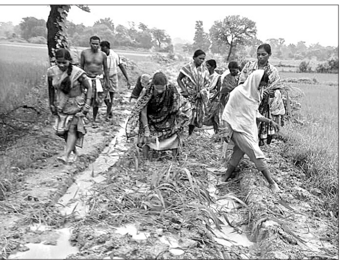
ଖଲିଆପାଲିରେ ଗାଁର ମହିଳାମାନେ ପଲ୍ଲୀ ରୁଇଛନ୍ତି।

ବିନିକା ବ୍ଲକ୍ ବାବୁପାଲି ପର୍ବତେ ଅଧୀନ କୁଡ଼ାପଡ଼ାକୁ ଖଲିଆପାଲି ତଳ୍ ୩ କି.ମି. ରାସ୍ତା ବନ୍ଦୁ ବନ୍ଧର ହେଲା ଅବହେଳିତ ଅବସ୍ଥାରେ ପଡ଼ି ରହିଛି।