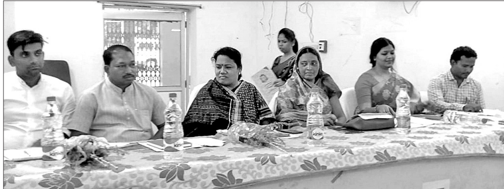
ଲେଫ୍ଟିପତା ପଞ୍ଚାୟତ ସମିତି ବୈଠକରେ ମହାସାଧନା ଅଧିକାରୀ, ଜନପ୍ରତିନିଧି।