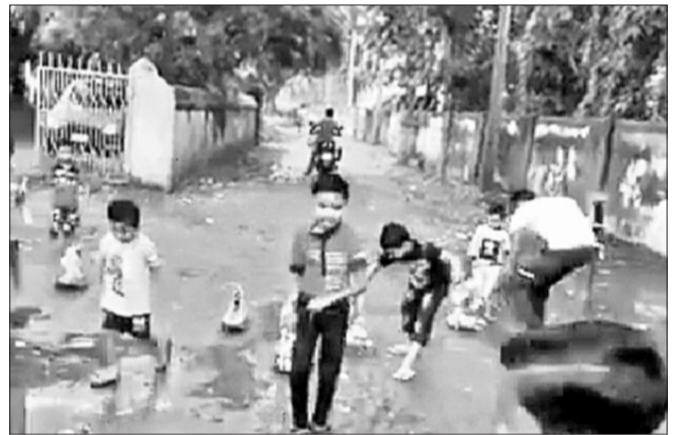
ବୀରମହାରାଜପୁରରେ ପୁରୁଣାଆଁସ ଖେଳ ।