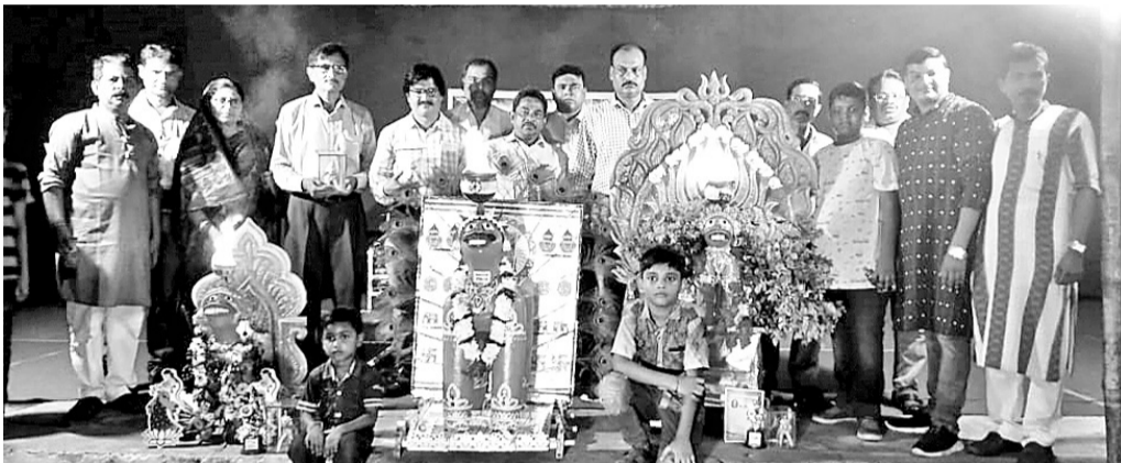
ଉତ୍ସବରେ ପ୍ରଦର୍ଶିତ ଚେରାକୋଟା ହନୁମାନ।

ବହଲପଦର ଓ ଦୁର୍ଗନିତେଇ ପଞ୍ଚାୟତରେ କିଡିନି ରୋଗୀ ଉଦ୍‌ବେଗଜନକ ବୋଲି କହିବା ସହିତ ଏହାର ପ୍ରତିକାର ଦାବି କରିଥିଲେ।