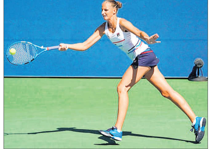
ସ୍ତୁତ୍ୟ ଓପନ୍ ଗ୍ରାଣ୍ଡସ୍ଲାମ ଟେନିସ୍ ମହିଳା ସିଙ୍ଗଲ୍ ଅବସରରେ ଶୁକ୍ରବାର ରିଟର୍ଣ୍ଣ ଶର୍ ଖେଳୁଛନ୍ତି କାରୋଲିନା ପୁସକୋଭା।

ଆମ ଦେଶରେ ଗୁରୁବାର ଜାତୀୟ କ୍ରୀଡ଼ା ଦିବସ ପାଳିତ ହୋଇଥିବାବେଳେ ଆଜ୍ଞା ପ୍ରଦେଶର ବିଶାଖାପାଟଣାଠାରେ ହୋଇଥିବା ଏକ ବଡ଼ ଟ୍ରଫି ସାମ୍ରାଜ୍ଞି ଆସିଛି। ଏଠାରେ କ୍ରୀଡ଼ା ଦିବସ ଅବସରରେ ଶୁଭେଚ୍ଛା ଜଣାଇବା ପାଇଁ ସାନିଆ ମିର୍ଜାଙ୍କ ଫଟୋ ଥିବା ଏକ ପୋଷ୍ଟର ଲଗାଇ କିମ୍ବଦନ୍ତୀ ଧାରିକା ପି. ଟି. ଉଷାଙ୍କ ନାମ ଲେଖାଯାଇଛି। ଏହି ପୋଷ୍ଟର ବି. ରୋହିତ୍‌ସିଂହ ସବମିନି ମ୍ୟୁଜିୟମରେ ଲାଗିଛି। ଏହାର ଫଟୋ ଏବେ ସୋସିଆଲ ମିଡିଆରେ ଭାଇରାଲ ହେଉଛି। କେତେକ ଏହାକୁ ସମାଲୋଚନା କରୁଥିବାବେଳେ କିଛି ଏହାକୁ କୋଫ୍ କରିଛନ୍ତି। କଣେ କଣେ କରିଛନ୍ତି, ଆମେ ଏପର୍ଯ୍ୟନ୍ତ ତାଙ୍କୁ ସାନିଆ ମିର୍ଜା ଭାବୁ ଥିଲୁ। ସେହିଭଳି ଆଉ କଣେ କିଛି କରି ପ୍ରଶ୍ନ କରିଛନ୍ତି, ସାନିଆ ମିର୍ଜାଙ୍କୁ ଆଜ୍ଞା ପ୍ରଦେଶରେ ପି. ଟି. ଉଷା କୁହାଯାଏ। ରାଜ୍ୟ ସରକାରଙ୍କ ଏହା କିଛି ଦାୟିତ୍ୱନିତା ?