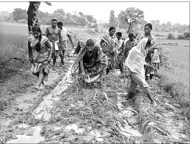
ଖଲିଆପାଲିରେ ଗାଁର ମହିଳାମାନେ ପଲ୍ଲୀରୁ ରୁଇଛନ୍ତି।

ବିନିକା ବ୍ଲକ୍ ବାବୁପାଲି ପର୍ବତେ ଅଧୀନ କୁଡ଼ାପଡ଼ା ଖଲିଆପାଲି ତଳ୍ ୩ କି.ମି. ରାସ୍ତା ବନ୍ଦୁତ ବନ୍ଧର ହେଲା ଅବହେଳିତ ଅବସ୍ଥାରେ ପଡ଼ି ରହିଛି।