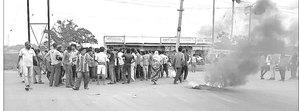
କ୍ଷତିପୂରଣ ଦାବିରେ ସ୍ଥାନୀୟ ଲୋକେ ଚାଲି ରାସ୍ତା ଅବରୋଧ କରିଛନ୍ତି।