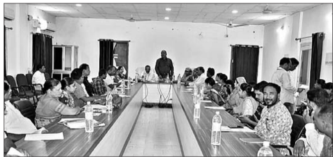
ବୀରମହାରାଜପୁର ପଞ୍ଚାୟତ ସମିତି ବୈଠକରେ ଉପସ୍ଥିତ ଅଧିକାରୀ ଓ ପ୍ରତିନିଧି ।