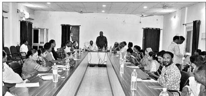
ବୀରମହାରାଜପୁର ପଞ୍ଚାୟତ ସମିତି ବୈଠକରେ ଉପସ୍ଥିତ ଅଧିକାରୀ ଓ ପ୍ରତିନିଧି ।