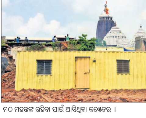
ମଠ ମହତ୍ତ୍ୱକୁ ରହିବା ପାଇଁ ଆସିଥିବା କଠେନର।