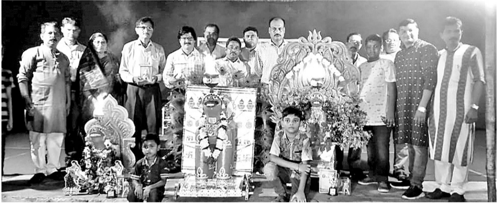
ଉତ୍ସବରେ ପ୍ରଦର୍ଶିତ ଚେରାକୋଟା ହନୁମାନ।

ବହଲପଦର ଓ ଦୁର୍ଗନିତେଇ ପଞ୍ଚାୟତରେ କିଡ଼ିନି ଗୋଟା ଉଦ୍‌ବେଗଜନକ ବୋଲି କହିବା ସହିତ ଏହାର ପ୍ରତିକାର ଦାବି କରିଥିଲେ।