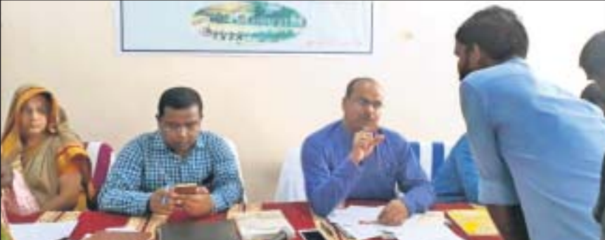
ଅଭିଯୋଗ ଶୁଣାଣିରେ ଯୋଗ ଦେଇଥିବା ଅତିଥି।