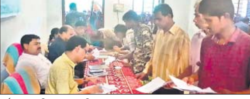
କାର୍ଯ୍ୟକ୍ରମରେ ଉପସ୍ଥିତ ଅଧିକାରୀ ଓ ଅଭିଯୋଗକାରୀ।