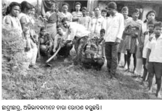
ଛାତ୍ରାଛାତ୍ର, ଅଭିଭାବକମାନେ ଚାରା ରୋପଣ କରୁଛନ୍ତି।