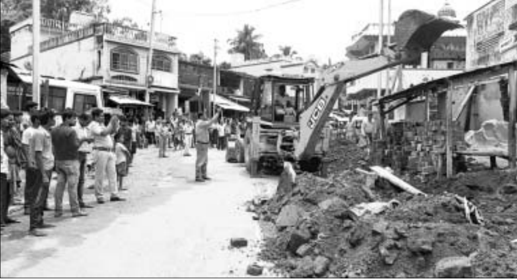
ଜବରଦଖଲ ଉଚ୍ଛେଦ କରାଯାଇଛି। ତହସିଲଦାରଙ୍କୁ ଉଚ୍ଛେଦ ପାଇଁ ହେବାରୁ ଅଙ୍ଗାରଗାଁରେ ରାସ୍ତା କାମ ଯାଇକୋର୍ଟ ନିର୍ଦ୍ଦେଶ ଦେଇଥିଲେ। ଓ ଜଳ ଯୋଗାଣ ଦୀର୍ଘ ୨ ବର୍ଷ ହେବ ଇତି ମଧ୍ୟରେ ଜବରଦଖଲ ଉଚ୍ଛେଦ ନ ହେବାରୁ ଅଙ୍ଗାରଗାଁରେ ରାସ୍ତା କାମ ଯାଇକୋର୍ଟ ନିର୍ଦ୍ଦେଶ ଦେଇଥିଲେ।

ଦୀର୍ଘଦିନ ପରେ ଅଙ୍ଗାରଗାଁ ପଞ୍ଚାୟତ କାର୍ଯ୍ୟାଳୟ ସମ୍ମୁଖରୁ ଜବରଦଖଲ ହଟିଲା। ପୋଲିସ୍ ଓ ପ୍ରଶାସନ ସହାୟତାରେ ଏହା ହଟାଯାଇଛି।