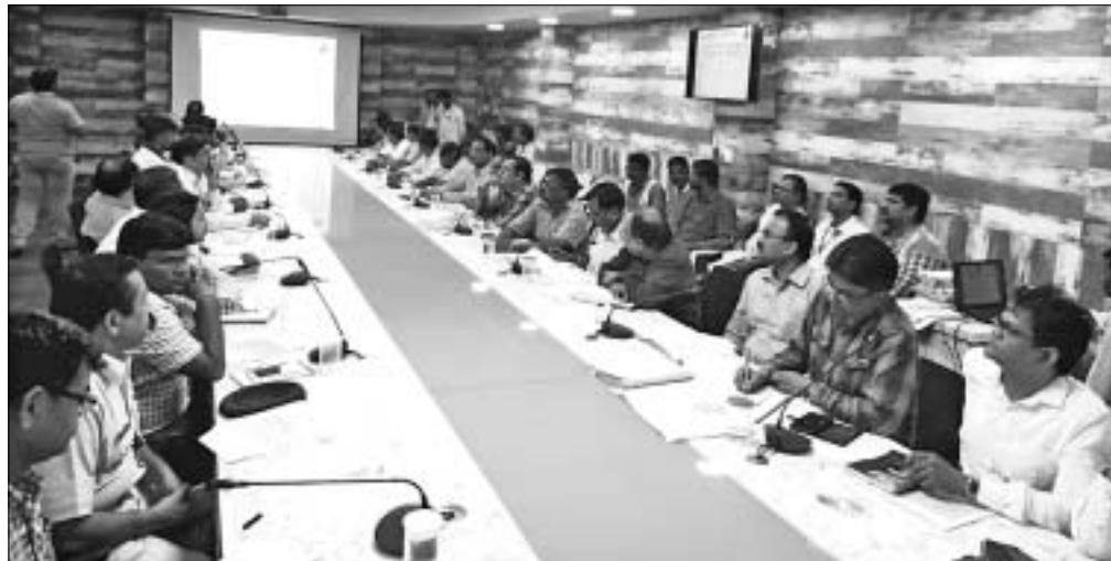
ବୈଠକରେ କମିଟି ସଭ୍ୟ ଉପସ୍ଥିତ ଅଛନ୍ତି ।