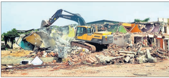
ବଣିଆପତିରେ ବୋକାଳ ଘରକୁ ଛେଦି ଦ୍ୱାରା ଭଙ୍ଗା ଯାଉଛି ।