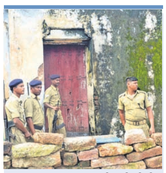
ଏମାର ମଠ ମହନ୍ତଙ୍କ ଘରକୁ ପୋଲିସ ଜରି ରହିଛି ।

ବୋଲି ସେ ପ୍ରକାଶ କରିଛନ୍ତି । ତାଙ୍କର ଏହି ମତକୁ ପରେ ଏମାର ମଠ ପୁଣ୍ୟ କୋଠା ଉଦ୍ଧେଦରେ ଆସିଛି ନୁହାଁ ମୋଡ଼ । ଗତ ୪ଦିନ ହେଲା ପ୍ରଶାସନିକ ଅଧିକାରୀମାନେ ମହନ୍ତଙ୍କୁ ମନାଇବାରେ ଲାଗିପଡ଼ିଛନ୍ତି । ଶୁକ୍ରବାର ରାତିରେ ବରିଷ୍ଠ ପୋଲିସ ଅଧିକାରୀ ମଠକୁ ଯାଇ ମହନ୍ତଙ୍କ ସହ ଆଲୋଚନା କରିଥିଲେ । କିନ୍ତୁ କୌଣସି ନିର୍ଣ୍ଣୟ ବାହାରି ପାରି ନ ଥିଲା । ସେହିପରି ମହନ୍ତ ରାତିରେ ଗୋବର୍ଦ୍ଧନ ମଠକୁ ଯାଇ ଶକ୍ତାଚାର୍ଯ୍ୟଙ୍କ ସହ ଉଦ୍ଧେଦ ସମ୍ପର୍କରେ ଆଲୋଚନା କରିବା ଲାଗି ସମୟ ସ୍ଥିର ହୋଇଥିଲା । କିନ୍ତୁ ମହନ୍ତ ମଠକୁ ବାହାରକୁ ବାହାରି ନ ଥିଲେ । ପରବର୍ତ୍ତୀ ଉଦ୍ଧେଦ ସମ୍ପର୍କରେ ଜିଲ୍ଲାପାଳ କହିଛନ୍ତି, ରବିବାର ଓ ସୋମବାର ଛୁଟିଦିନ ଥିବାରୁ ଶ୍ରୀମନ୍ଦିରକୁ ବନ୍ଦୁଖ୍ୟାକ ଶ୍ରୀକାଳୁ ଦର୍ଶନ ପାଇଁ ଆସିବେ ।