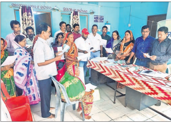
ସମାବେଶରେ ଉପସ୍ଥିତ ଅଧିକାରୀ ଓ ହିତାଧିକାରୀ।

ବାଲିକୁବା ବ୍ଲକ ଗରାମ ପଞ୍ଚାୟତ କାର୍ଯ୍ୟାଳୟ ପରିସରରେ ପ୍ରଧାନମନ୍ତ୍ରୀ ଆବାସ ଯୋଜନାରେ କାର୍ଯ୍ୟାଦେଶୀ ପାଇଥିବା ହିତାଧିକାରୀଙ୍କ ଏକ ସଚେତନତା ସମାବେଶ ଓ ଶପଥ ପାଠ ଉତ୍ସବ ଅନୁଷ୍ଠିତ ହୋଇଛି।