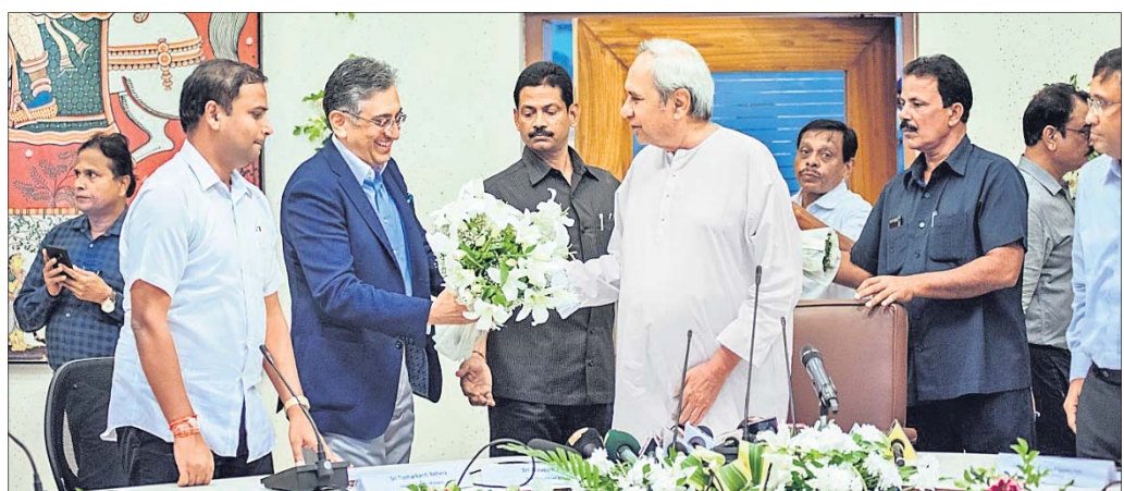
ପୁଖ୍ୟମନ୍ତ୍ରୀଙ୍କ ଉପସ୍ଥିତିରେ ଗ୍ରୀଡ଼ା ଓ ଯୁବସେବା ବିଭାଗ ଏବଂ ଦିଲ୍ଲୀ ସକର ପ୍ରାଇଭେଟ୍ ଲିମିଟେଡ୍ ମଧ୍ୟରେ ବୁଝାମଣା ।

ହାଇପ୍ରୋଫାଇଲ ପୁରୁଷ ଲିଗ୍ ଲକ୍ଷ୍ମିଆନ ପୁରୁଷ ଲିଗ୍ (ଆଇଏସ୍‌ଏଲ୍)ରେ ଓଡ଼ିଶା ଏଫ୍ସି ନିଜର କ୍ଲବ୍ ଖେଳାଇବ । ପକ୍ଷରେ ରାଜ୍ୟର ପୁରୁଷ ପ୍ରଶାସକଙ୍କ ପାଇଁ ଏହା ଏକ ଖୁସି ଖବର ସାବ୍ୟସ୍ତ ହୋଇଛି । ରାଜ୍ୟର ଏହି ପୁରୁଷ କ୍ଲବ୍ ନାମ 'ଓଡ଼ିଶା ଏଫ୍ସି' ରଖାଯାଇଛି । ଏ ସଂକ୍ରାନ୍ତିରେ ପୁଖ୍ୟମନ୍ତ୍ରୀ ନବୀନ ପଟ୍ଟନାୟକ, ଗ୍ରୀଡ଼ାମନ୍ତ୍ରୀ ବୃକ୍ଷାଚରଣ ବେହେରାଙ୍କ ଉପସ୍ଥିତିରେ ରାଜ୍ୟ ଗ୍ରୀଡ଼ା