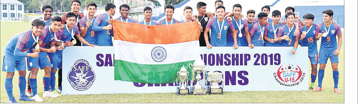
ସାଫ୍ କପ୍ ବିଜୟୀ ଭାରତୀୟ ଦଳର ଖେଳାଳିମାନେ ।