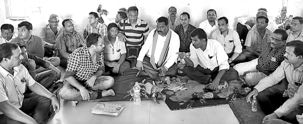
ସମ୍ବଲପୁର ସମଲେଖ ମନ୍ଦିର ପରିସରରେ ବୈଠକ ବସିଛି।