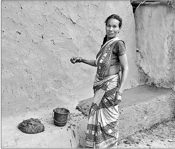
ପୁନାବେତାରେ ଜଣେ ମହିଳା ନିଜ ଘର ଅଗଣା ଲିପାପୋଛା କରୁଛନ୍ତି ।