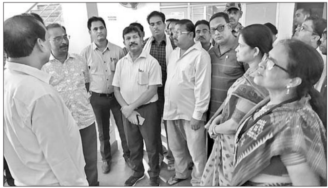
ଜିଲ୍ଲାପାଳ ଆୟୁର୍ବେଦ କଲେଜ ପରିଦର୍ଶନ କରୁଛନ୍ତି।