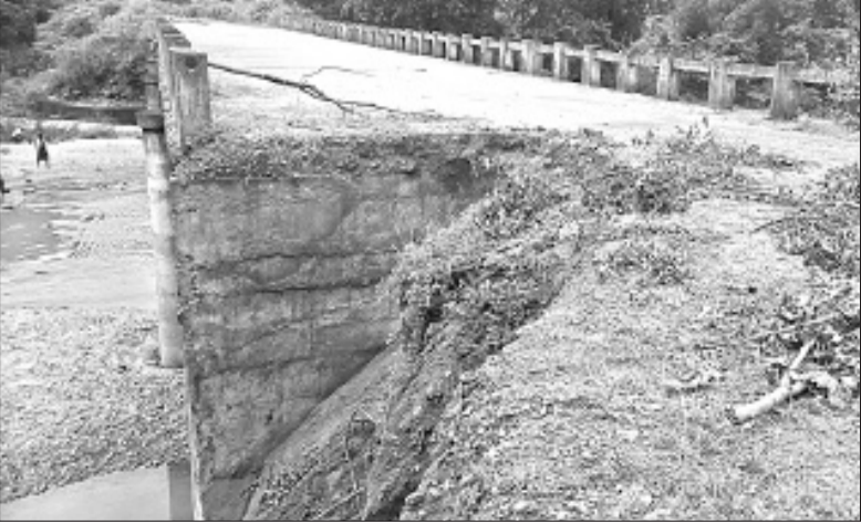
ସମ୍ବଲପୁର ଜିଲ୍ଲା ନାକବିଦେଇ ବୁକ୍ ଅର୍ଦ୍ଧତ ଯୋଷରାମାଳ-ଲାଣ୍ଡିମାଳ ଗାଁରେ ଯୋଷରାମାଳ ନିକଟସ୍ଥ ତମ୍ପାଳି ନଦୀ ପୋଲର ଗୋଟିଏ ପାର୍ଶ୍ୱ ବର୍ଷା ଯୋଗୁ ଧସି ଯାଇଛି (ବାମ)। ନୂଆଁଖାଇ ପର୍ବ ଲାଗି ସମ୍ବଲପୁର ସମଲେଖରୀ ମନ୍ଦିର ଭିତର ପାର୍ଶ୍ୱରେ ରଙ୍ଗ ଦିଆଯାଇଛି।