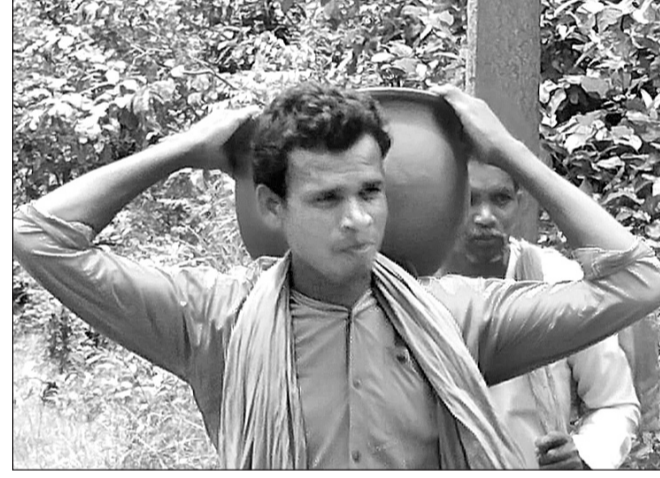
ଜଣେ କୁମ୍ଭକାର ମାଟିହାଣ୍ଡି ବିକ୍ରି ପାଇଁ ନେଉଛନ୍ତି।

ସଂଖ୍ୟାପତା, ୧୯ (ଡି.ଏନ.ଏ) ଗୋଟିଏ ଦିନ ପରେ ପାଳନ ହେବ ପଶ୍ଚିମ ଓଡ଼ିଶାର ମହାନ ଗଣପର୍ବ ନୂଆଖାଇ। ଏଥିପାଇଁ ସମସ୍ତ ପ୍ରକାର ପ୍ରସ୍ତୁତି ସରିଛି। ଗାଁରୁ ସହର ହୋଇ ଉଠିଛି ବକରଞ୍ଚକ। ନୂଆଖାଇ ପାଇଁ କୁମ୍ଭକାରମାନଙ୍କୁ ଆଉ ଦୂରସତ ନାହିଁ। ମାଟିହାଣ୍ଡି ବ୍ୟବହାର ଆଜିକାଲିର ରୁହେଁ, କେଉଁ ଆବହମାନ କାଳକୁ ଲୋକେ ଏବେକାଣ୍ଡିଆ, ବିବାହ, ଦଶାହ, ନୂଆଖାଇ ସମୟରେ ଏହାକୁ ବ୍ୟବହାର କରିଥାନ୍ତି। ମାଟିରେ ତିଆରି ସାମଗ୍ରୀର ଉପକାରୀ ଗୁଣ ଥିବାରୁ ନୂଆଖାଇରେ ନୂଆହାଣ୍ଡି, ମାଟିପାତ୍ର, ମାଟିଦାପ ଆଦି ବ୍ୟବହାର କରାଯାଏ। ନୂଆଖାଇରେ ଧନୀ ହେଉ କି ଗରିବ ସମସ୍ତେ ନୂଆହାଣ୍ଡିରେ ବ୍ୟଞ୍ଜନ ରାନ୍ଧିବାର ପରମ୍ପରା ଥିବାରୁ