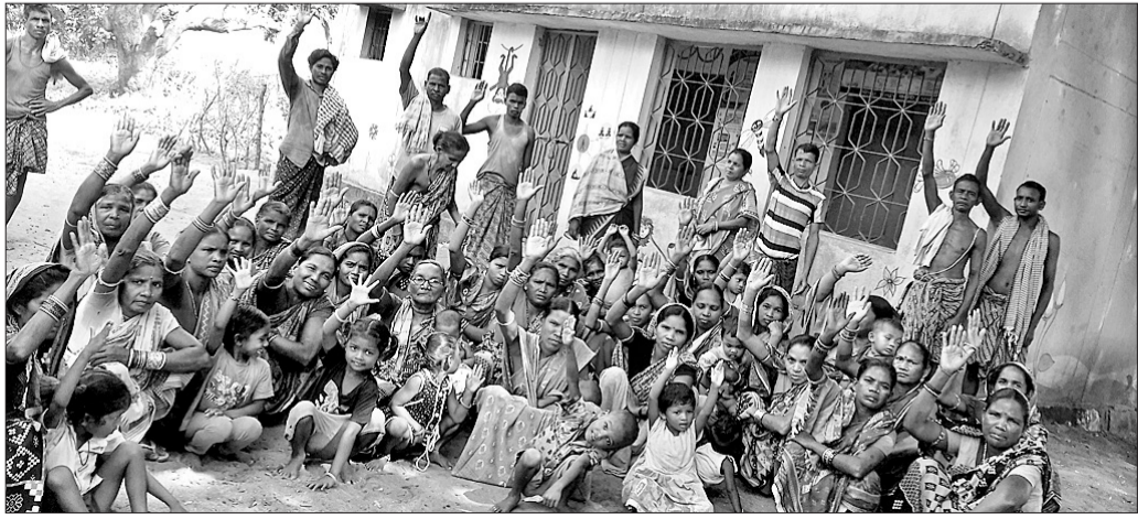
ବିକାମାଳ ଗ୍ରାମର ମହିଳାମାନେ ବେଆଇନ ମଦ ବିକ୍ରିକୁ ବିରୋଧ କରୁଛନ୍ତି ।

ବିରୋଧ କରି ଶନିବାର ଶତାଧିକ ମହିଳା ମୋହନଗିରି ପୋଲିସର ଦ୍ୱାରସ୍ଥ ହୋଇଛନ୍ତି । ମତୁଆଳ ଉପୁତରେ ସାଧାରଣ ଲୋକେ ନୂଆଁଖାଇ ଆସିଲେ ଖୁସି ମନାକରା ପରିବର୍ତ୍ତେ