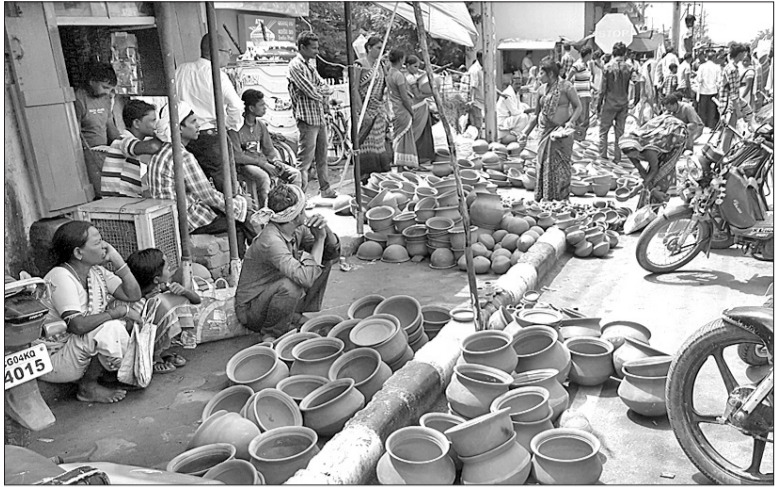
ନୂଆପତା ବଜାରରେ ମାଟି ପାତ୍ର କିଣାବିକା କରୁଛନ୍ତି ଲୋକେ ।