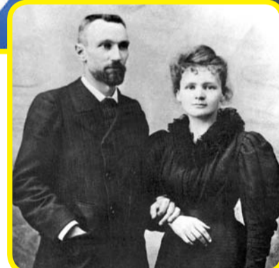
ପିୟରେ କ୍ୟୁରି -ମ୍ୟାରି କ୍ୟୁରି