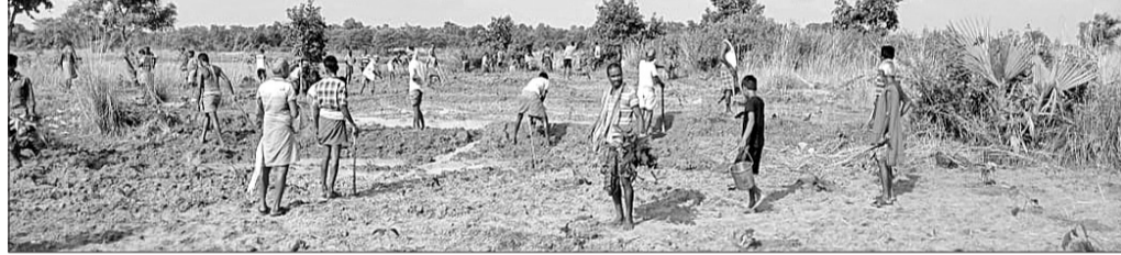
ରୁନିଆପାଲି ଗ୍ରାମବାସୀ ବୃକ୍ଷ ଚାଲାଇପାଣ କରୁଛନ୍ତି।

ଗଞ୍ଜପୁର, ୧୯ (ଡି.ଏନ.ଏ) ଭେଡେନ ବ୍ଲକ୍ ସୁନାଲରମ୍ଭା ପଞ୍ଚାୟତ ଅନ୍ତର୍ଗତ ରୁନିଆପାଲି ଗ୍ରାମବାସୀ ଉଦ୍ଦିଷ୍ଟ ଭାବେ ଅବଶିଷ୍ଟ ୩ ଏକର ଜମି ପଡ଼ିଆ ଜିରା ନଦୀ ଧାର ଘାଟ ନିକଟସ୍ଥ ଗ୍ରାମ ଜଙ୍ଗଲରେ ଥିବା ଗୋଟିଏ ଜମିରେ ବୃକ୍ଷ ରୋପଣ ଆରମ୍ଭ କରିଛନ୍ତି।