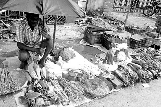
ବରଗଡ଼ ଆନାନ୍ଦ ଆଗରେ ନୂଆଖାଇ ସହିତ ବିଭିନ୍ନ ବୃକ୍ଷର ପତ୍ର ବିକ୍ରି କରୁଛନ୍ତି।

ପ୍ରେମାନନ୍ଦ ଖମରୀ ବରଗଡ଼ ଅଧିକ, ୧୯ ନୂଆଖାଇ ତିହାର, ପଶ୍ଚିମ ଓଡ଼ିଶାବାସୀଙ୍କ ମୁଖ୍ୟ ଗଣପର୍ବ। ଏହି ପର୍ବକୁ ଆଉ ମାତ୍ର ୨ ଦିନ ବାକି। ଏହାକୁ ପାଳନ କରିବା ପାଇଁ ସର୍ବଜନ ମନରେ ଆନନ୍ଦ ଭରଣ ସେଖାଯାଇଛି। ଏଥିପାଇଁ ପ୍ରାୟତଃ ପ୍ରତି ଘରେ ପ୍ରସ୍ତୁତ ପର୍ବ ସଜାଯାଇଛି। କେବଳ ଶୁଭଲଗ୍ନକୁ ସମସ୍ତେ ଅପେକ୍ଷା କରିଛନ୍ତି। ହେଲେ ଅନେକ ଲୋକ ଏହି ଗଣପର୍ବ ବେଳେ କିଛି ରୋଜଗାର ପାଇଁ ମନରେ ଆଶା ମଧ୍ୟ ବାନ୍ଧିଥାନ୍ତି। ଖରାଡ଼ାତି, ଗୁଲୁଗୁଲି ସହ୍ୟ କରି କିଏ ନୂଆଖାଇ ବିକିବାକୁ ତ ଆଉ କେହି ବିଭିନ୍ନ ବୃକ୍ଷର ପତ୍ରବିକ୍ରି କରିବା ପାଇଁ ପସରା ମୋଲାଲ ବସିଥାନ୍ତି। ବରଗଡ଼ ସହର ଆନାନ୍ଦ ଛକରେ ଏଭଳି ଦୃଶ୍ୟ ଦେଖିବାକୁ ମିଳିଛି। ନୂଆଖାଇରେ କେବଳ ନୂଆଖାଇ ଅଧିକ କିସମର ବୃକ୍ଷର ପତ୍ରର ଚାହିଦା ମଧ୍ୟ ରହିଛି। ବିଭିନ୍ନ ଲାଗିର ଲୋକେ ପୃଥକ ଗଛର ପତ୍ରରେ ନବାନ ଭକ୍ଷଣ କରିବାର ପରମ୍ପରା ରହି ଆସିଛି। ଏହି କ୍ରମରେ କୁଟୁମ୍ବ, ଭେଲୁଆଁ, ମହୁଲ, ରେଙ୍ଗାଲ(ସର୍ବି) ଆଦି ପତ୍ର ରହିଛି। ମାତ୍ର ଏହି ପରମ୍ପରା ଦିନକୁ ଦିନ ହଜିବାରେ ବସିଛି। ଖୁବ୍ ଅଳ୍ପ ଲୋକ ଏଭଳି ପତ୍ରରେ ନବାନ ଭକ୍ଷଣର ପରମ୍ପରା ରଖୁଥିବାବେଳେ ସାଧାରଣତଃ ଆଜିକାଲି ମେଶିନ ଖଲିଦନାର ଚାହିଦା ମଧ୍ୟ ବଢ଼ି ଚାଲିଛି। ହେଲେ ପୂର୍ବପୁରୁଷଙ୍କ ସେହି ପରମ୍ପରାକୁ ଏବେ ମଧ୍ୟ ଜଙ୍ଗଲ ପାଖଲୋକେ ଉତ୍ସାହିତ କରି ରଖୁଛନ୍ତି। ନୂଆଖାଇ ପର୍ବ ପୂର୍ବରୁ ସେଭଳି ପତ୍ର ଜଙ୍ଗଲରୁ ସଂଗ୍ରହ କରି ତିହାର ହାଟକୁ ବିକ୍ରି କରିବାକୁ ଆସୁଛନ୍ତି ଏବଂ ତାହା ସେମାନଙ୍କୁ ରୋଜଗାର ମଧ୍ୟ ଯୋଗାଇ ଦେଇଛି।