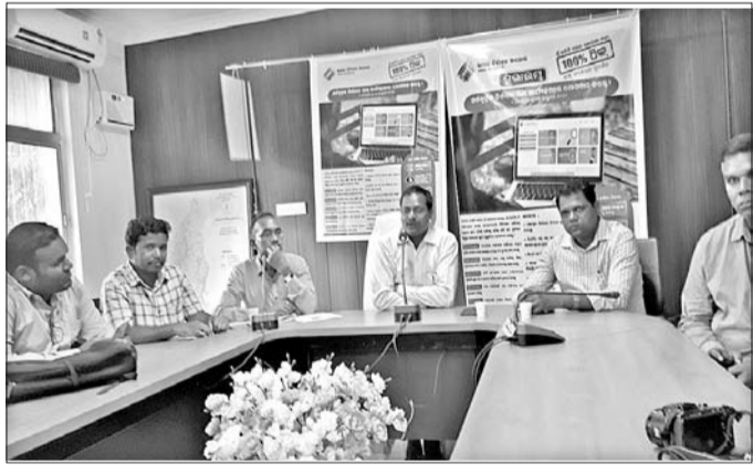
ଭୋଟର ଯାଞ୍ଚ ପ୍ରକ୍ରିୟା ଉଦ୍ଘାଟନା କାର୍ଯ୍ୟକ୍ରମରେ ଯୋଗଦେଇଥିବା ଅତିଥିବୃନ୍ଦ ।

ଜିଲ୍ଲା ନିର୍ବାଚନ ବିଭାଗ ସମସ୍ତ କର୍ମଚାରୀ, ଏନଏସି କର୍ମଚାରୀମାନେ ଯୋଗଦେଇଥିବାବେଳେ କେତେକ ନୂତନ ଭୋଟର ଯୋଗଦେଇଥିଲେ । କାର୍ଯ୍ୟକ୍ରମ ପରିଚାଳନାରେ ବିଭୁବନ୍ଦ ମିଶ୍ର, ଅଶୋକ ମିଶ୍ର ପ୍ରମୁଖ ସହଯୋଗ କରିଥିଲେ ।