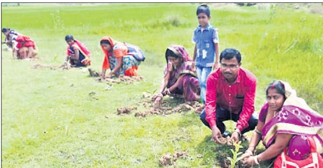
ନହଙ୍ଗ ପଡିଆରେ ଚାରାରୋପଣ କରାଯାଇଛି।