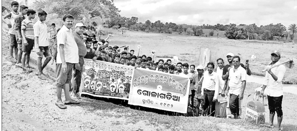
ମିଶନ ତାଳ କାର୍ଯ୍ୟକ୍ରମରେ ଉପସ୍ଥିତ ଛାତ୍ରାଛାତ୍ରୀ ଓ ଅତିଥିମାନେ।

ବେଶୀ ସମ୍ଭାଳିଥାଏ। ତାହା ଆଉ ଗାଁ ମାନଙ୍କରେ ଦେଖିବାକୁ ମିଳୁ ନାହିଁ। ଯେ କି ବଜ୍ରାଘାତରୁ ସୁରକ୍ଷା ଦେଉଥିଲା। ତେଣୁ ଗୋବାଳ ଖାର୍ଦ୍ଦି ନେଇ ଦିନକୁ ଦିନ ବଜ୍ରାଘାତ ବଢ଼ିବାରେ ଲାଗିଛି।