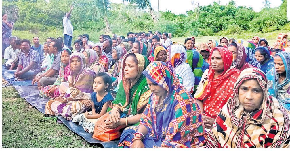
ତାଳସାରୀଠାରେ ମହିଳା ଓ ପୁରୁଷମାନେ ମେଳି କରିଛନ୍ତି ।