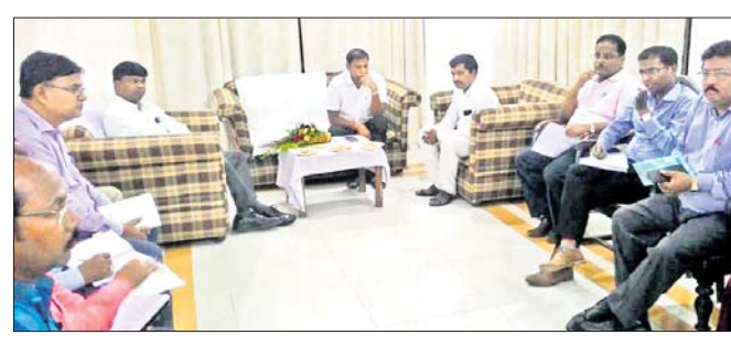
ରାଜ୍ୟ ଇଲେକ୍ଟ୍ରୋନିକ୍ସ ଓ ସୂଚନା ପ୍ରଯୁକ୍ତି, କ୍ରୀଡ଼ା ଏବଂ ଯୁବ ସେବା ମନ୍ତ୍ରୀଙ୍କ ସମୀକ୍ଷା।