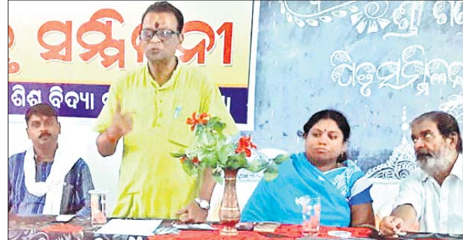
ସମ୍ମିଳନୀରେ ମହାସାଧନ ଅତିଥି।