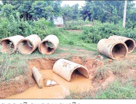
ପାଇପ୍ ପଡ଼ି ମଧ୍ୟ ଅବହା ପୁଧୁଡ଼ିନ।