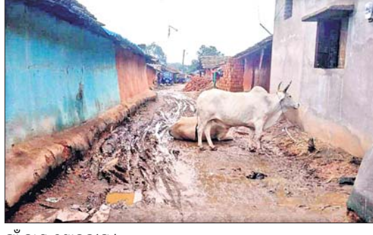
ଗାଁ ବାଡ଼ ଶୋକନାୟ।

ଚମ୍ପୁଆ ଏନଏସି ଅନ୍ତର୍ଗତ ୧ ନଂ ଖାର୍ଡ଼ ମାନ୍ୟତା ପାଇଥିବା ଗୋଧୂଳି ଗାଁ ଆଜି ଅବହେଳିତ। ରାସ୍ତା ଘାଟ ଠାରୁ ଆରମ୍ଭ କରି କମ୍ୟୁନିଟି ପାଇଖାନା ଓ ସ୍ଵଚ୍ଛତା କ୍ଷେତ୍ରରେ ଏହାର ଉନ୍ନତି ଖୁବ୍ ପଛରେ ପଡ଼ିଛି। ଚମ୍ପୁଆ ପଞ୍ଚାୟତ ସମୟରେ ତିନି ତିନି ଜଣ ସରପଞ୍ଚ ଓ ଏନଏସି ଆରମ୍ଭର ପ୍ରଥମ ଚେୟାରମ୍ୟାନ ଏହି ଗ୍ରାମକୁ ନିର୍ବାଚିତ ହୋଇଥିବାବେଳେ ଏହାର ଉନ୍ନତି ହୋଇ ନ ପାରିବା ଅତ୍ୟନ୍ତ ଦୁଃଖର ବିଷୟ ପାଲଟିଛି। ସରପଞ୍ଚ, ଚେୟାରମ୍ୟାନ ଆଇ ମଧ୍ୟ ଏହି ଗ୍ରାମ ଅଣବେଖାର ଶିକାର ହେଉଛନ୍ତି।