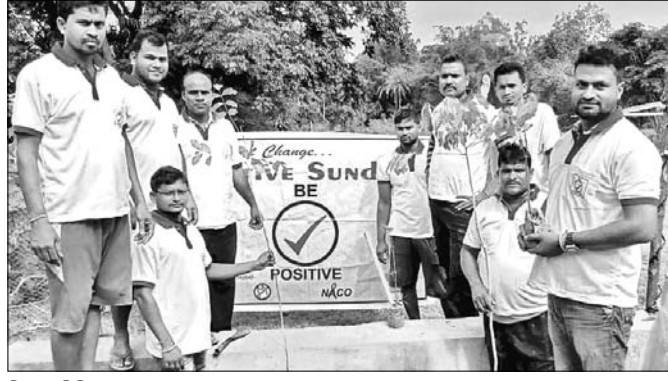
ବିଲ ପକ୍ଷିଚଳ ଗୁପ୍ତର ସଦସ୍ୟମାନେ।