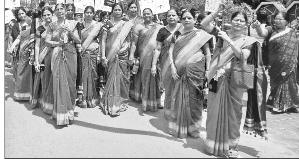
ମହିଳାମାନେ ସଚେତନତା ରାଲିରେ ଯାଉଛନ୍ତି।