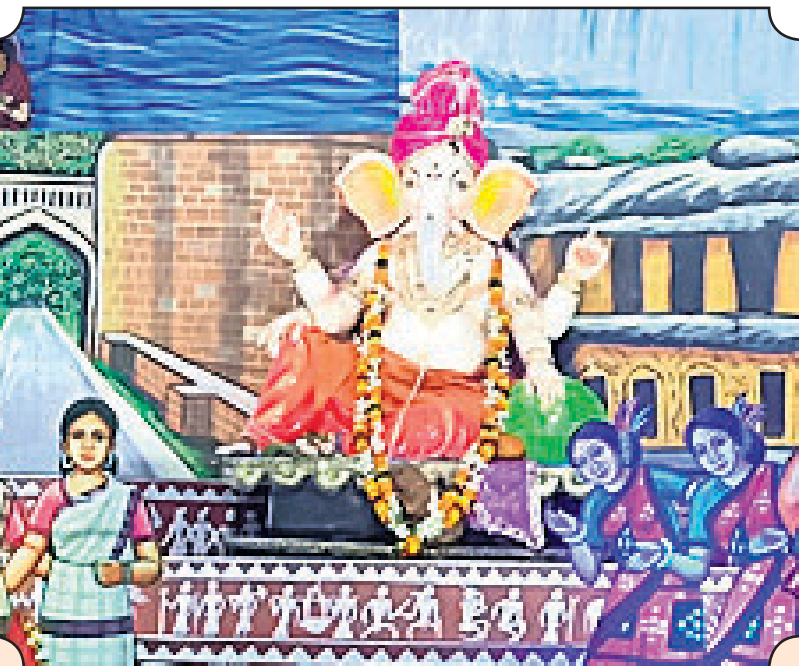
▲ ନିୟୁ ଲକ୍ଷ୍ମୀ ପୁନର୍ବିପାଳିତ