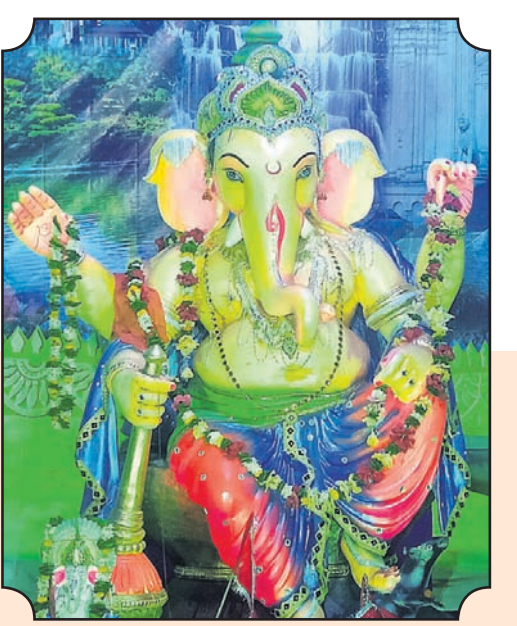
▲ କଳିଙ୍ଗ ମାର୍କେଟ