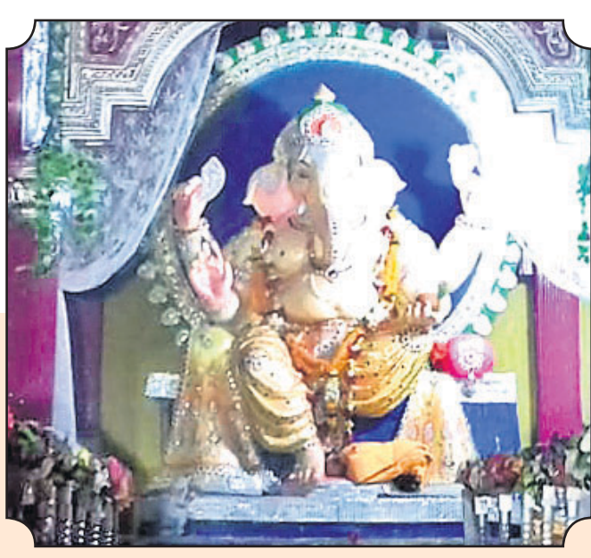
▲ ପାଟଣା ସାହି ଗଣେଶ ପୂଜା କମିଟି