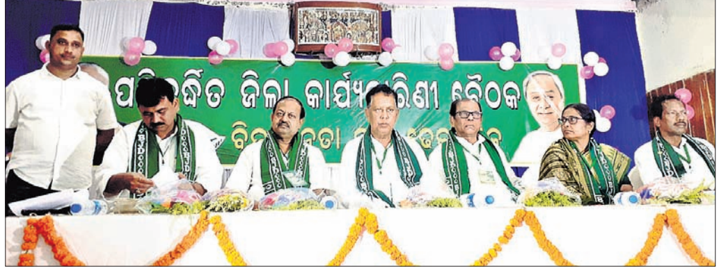
ବୈଠକରେ ମନ୍ତ୍ରୀ, ବିଧାୟକଙ୍କ ସମେତ ଅନ୍ୟମାନେ।