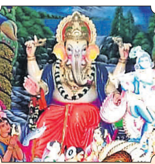
▲ ଚିତ୍ରକୃତ ବଜାର