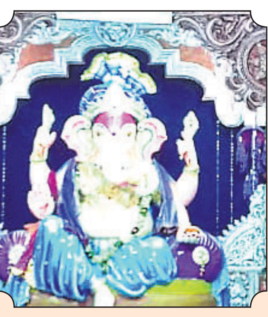
▲ ନୂଆ ବସ୍ତ୍ରାଣ