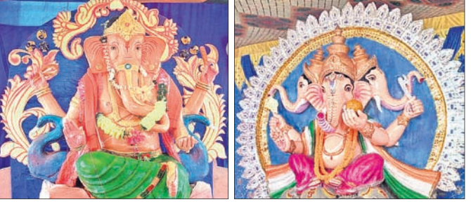
କୁନ୍ଦନାଳା, ରାଧାକୃଷ୍ଣ ଯୁବକ ସଂଘ କନ୍ଧପଡ଼ା ପୂଜା ମଣ୍ଡପ

ମାଧପୁର, ୩୧୯: ଆଠମାଲିକ ବ୍ଲକ୍ ମାଧପୁର ପଞ୍ଚାୟତ କୁନ୍ଦନାଳା ରାଧାକୃଷ୍ଣ ଯୁବକ ସଂଘ ତରଫରୁ ଗଣେଶ ପୂଜା ପାଳିତ ହୋଇଯାଇଛି। ଅପରାହ୍ଣ ୨ଟାରେ ଯଥାରୀତିରେ ପୂଜା କାର୍ଯ୍ୟ କରିଥିଲେ। ଏହାପରେ ସମସ୍ତ ସଦସ୍ୟ ପୁଷ୍ପାଞ୍ଜଳି ଦେଇ ମିଳିତ ଭାବେ ପ୍ରସାଦସେବନ କରିଥିଲେ। ମଙ୍ଗଳବାର ସକାଳେ ଗ୍ରାମର ଶତାଧିକ ଯୁବ ପିଲାଙ୍କୁ ଭୋଜନରେ ଆପ୍ୟାୟିତ କରାଯାଇଥିଲା। ସେହିପରି ଭୁଞ୍ଜନ, କମ୍ପଳା, ମାଧପୁର ଗଣେଶ ବଜାର, କନ୍ଧପଡ଼ା, ମାଧପୁର ଉଚ୍ଚ ବିଦ୍ୟାଳୟ, ମାଧପୁର ସରସ୍ଵତୀ ଶିଶୁମନ୍ଦିର, ମାଧପୁର ଗୋଡ଼ାଳ ସ୍କୁଲ ଆଦିରେ ଗଣେଶ ପୂଜା ପାଳିତ ହୋଇଛି।