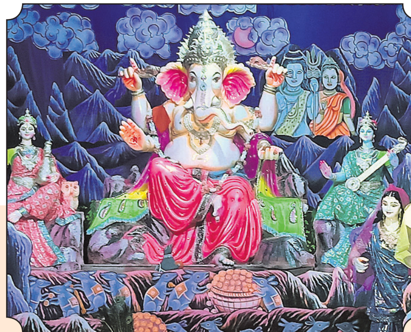
▲ ତାମ୍ବୁଳ ମାର୍କେଟ