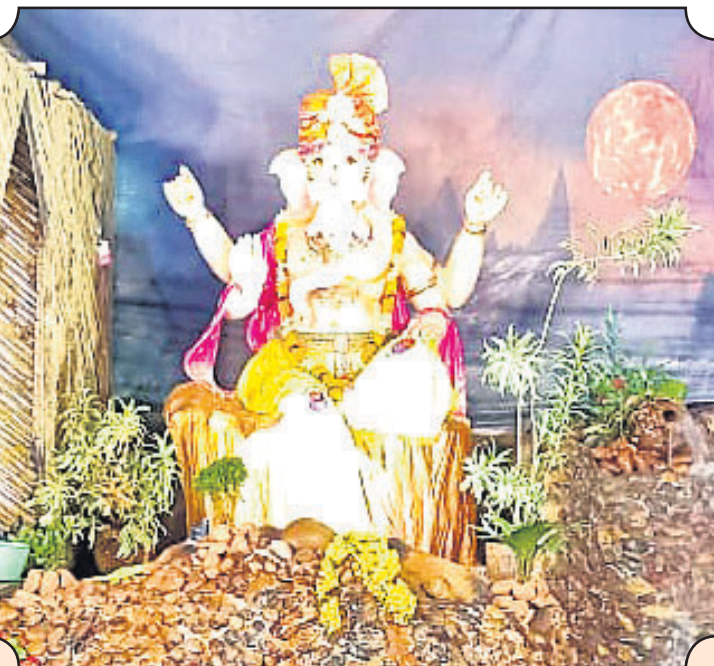
▲ ପୁନର୍ବିପାଳିତ ମାର୍କେଟ ହାଟତୋଟା