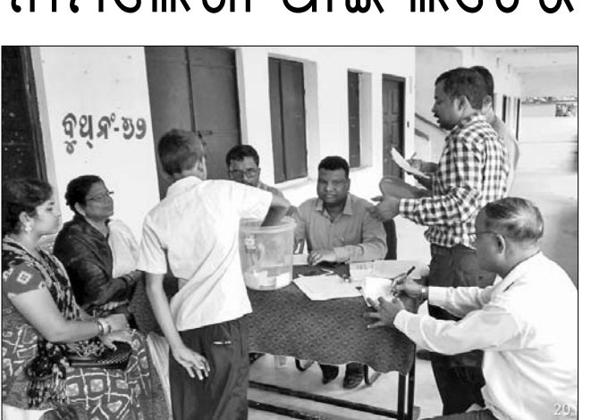
ଜଣେ ଛାତ୍ର କେନ୍ଦ୍ରୀୟ ବିଦ୍ୟାଳୟରେ ଆବେଦନ ପାଇଁ ଲଟେରି ଉଠାଇଛନ୍ତି।