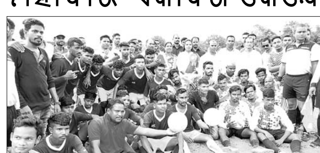
ଧୂତବଳ ଖେଳାଳିଙ୍କ ସହ ଏମ୍ପିଓ ବିଧାୟକ।