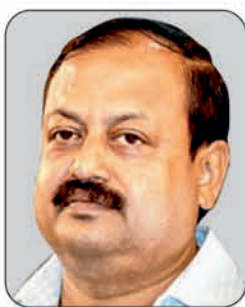
Shri Debi Prasad Mishra Hon'ble MLA, Badamba Constituency