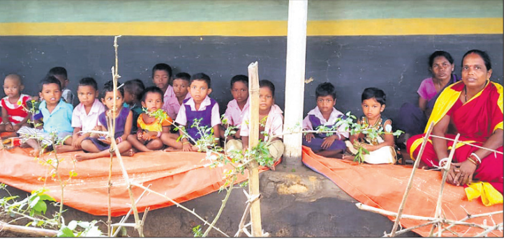
ଜଣେ ଗ୍ରାମବାସୀଙ୍କ ଘର ପଛପଟୁ ପିଣ୍ଡାରେ ଚାଳିଥିବା ପାଠପଠା।