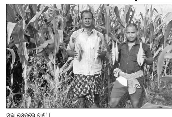
ମକା କ୍ଷେତରେ ଚାଷୀ।

ଚଳିତ ଋତୁରେ ଆବଶ୍ୟକ ଠାରୁ କମ୍ ବର୍ଷା ହୋଇଥିବା ବେଳେ ଏହାର ପ୍ରଭାବ ସାଧାରଣ ଚାଷ ଉପରେ ପ୍ରତିଫଳିତ ହୋଇଛି। ଅଭାବୀ ବର୍ଷା ଫଳରେ ଚମ୍ପୁଆ କୃଷି ଜିଲ୍ଲାରେ ମକା ଫସଲ ଆଶାକୁପେ ହୋଇପାରି ନ ଥିବା ଚାଷୀମାନେ ସୂଚନା ଦେଇଛନ୍ତି। ବିହନ ଲଗାଇବା ସମୟରୁ ଆବଶ୍ୟକ ବର୍ଷା ନ ହେବାରୁ ଚାଷରେ ବିଳମ୍ବ ହୋଇଥିଲା। ଯାହାର ପ୍ରଭାବ ଫସଲ ଅମଳରେ ଦେଖାଦେଇଛି।