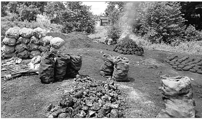
ଚୋରା କୋଇଲା ଜବାଭାଟି।

କେନ୍ଦୁଝର ଜିଲ୍ଲା ଯୋଡ଼ା ଖଣି ମଞ୍ଚଳର ବାଂଶପାଣି ରେଳ ସାଇଡ଼ିଂ ଠାରେ ଚୋରା କୋଇଲା କାରବାର ବେଧତଃ ଭାବେ ହେଉଥିବା ଦେଖିବାକୁ ମିଳିଛି। ବିଶ୍ଵସ୍ଥ ସୂତ୍ରରୁ ମିଳିଥିବା ସୂଚନାକୁ ଜଣାପଡ଼ିଛି ଯେ, ଯୋଡ଼ା ଚୌରପାଳିକା ଦ୍ଵାର୍ତ୍ତ ନଂ ୧୨ ବାଂଶପାଣି ଦ୍ଵାର ହଟିଂଠାରେ କେତେକ ବ୍ୟକ୍ତି କୋଇଲା ଗଢ଼ିତ ରଖି ଚୋରାଚାଲାଣ କରୁଥିବା ସ୍ଥାନୀୟ ଅଞ୍ଚଳବାସୀ ଅଭିଯୋଗ କରି ଯୋଡ଼ା ଥାନାରେ ଦସ୍ତଖତ ସମ୍ପର୍କିତ ଏକ ଲିଖିତ ଅଭିଯୋଗ କରିଛନ୍ତି। ଗ୍ରାମରେ ଥିବା ମହିଳା ସ୍ଵୟଂ ସହାୟକ ଗୋଷ୍ଠୀର ମହିଳା ଓ ସ୍ଥାନୀୟ ଅଞ୍ଚଳବାସୀ ତାଙ୍କ ଅଭିଯୋଗରେ କହିଛନ୍ତି ଯେ, ନିକଟରେ ଥିବା ବାଂଶପାଣି ରେଳ ସାଇଡ଼ିଂରେ ଦୈନିକ ଖ୍ରୀମତ ଲୋଡ଼ି ହୋଇଥାଏ। ଏଠାକୁ ଆସୁଥିବା କିଛି ରାକ୍ଷାକର ତବା ମଧ୍ୟରେ କୋଇଲା ବଳକା ରହିଥାଏ। ଖ୍ରୀମତ ଲୋଡ଼ି କରିବା ପୂର୍ବରୁ ଉକ୍ତ ତବାରେ ସଫେଇ କରାଯାଇଥାଏ। ସଫେଇ କରୁଥିବା ଶ୍ରମିକମାନେ ରେଳତବାରେ ଥିବା ବଳକା