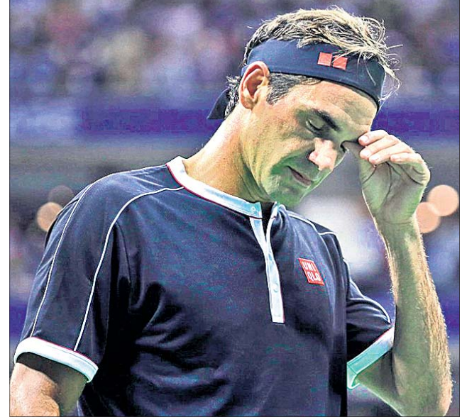
ପରାଜୟ ପରେ ମର୍ମାହତ ରୋଜର ଫେଡରର।

ରୁନାମେଣ୍ଟର ସର୍ବନିମ୍ନ ମାନ୍ୟତାପ୍ରାପ୍ତ ବୁଲଗେରିଆର ଗ୍ରିଗର ଦିନିଗ୍ରେଭାକ ନିକଟରୁ ପରାଜୟବରଣ କରିଛନ୍ତି।