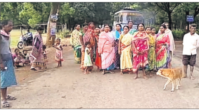
ଓବରସ୍ପେସ୍ ଲୋକେ ରାସ୍ତାରୋକୋ କରିଛନ୍ତି।

କରଞ୍ଜିଆ ଅଞ୍ଚଳରେ ହାତୀ ଆଠକ ଅନୁଭବ ଘଟଣାକୁ ନିମ୍ନରେ ଖବର ଦେଇଛୁ।