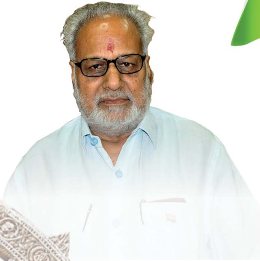
Chief Guest His Excellency Prof. Ganeshi Lal Governor of Odisha