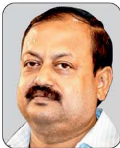
Shri Debi Prasad Mishra Hon'ble MLA, Badamba Constituency