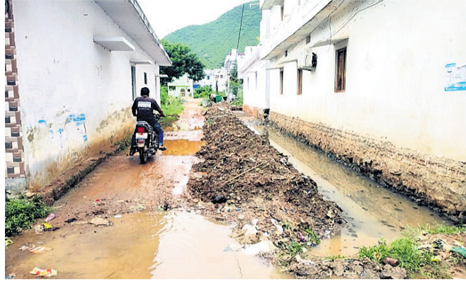
ଡ୍ରେନ୍ ନିର୍ମାଣ ହୋଇ ନଥିବାରୁ ଲୋକେ ଯିବାଆସିବା ସମସ୍ୟା ସୃଷ୍ଟି ହେଉଛି । ରହିଥିବାବେଳେ ଡ୍ରେନ୍ ନିର୍ମାଣ ହୋଇ ନ ଥିବା ଯୋଗୁ ବର୍ଷା ହେଲେ କୁଅମାନଙ୍କରେ ମଧ୍ୟ ଆବର୍ତ୍ତନା ପାଣି ନର୍ତ୍ତନା ପାଣି ଅନେକ ସମୟରେ