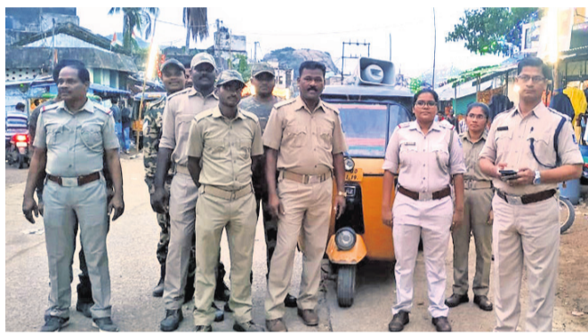
ପୋଲିସ ପକ୍ଷରୁ ଟ୍ରାଫିକ୍ ନିୟମ ସମ୍ପର୍କରେ ସଚେତନ କରାଯାଇଛି । ହେଲେ ଟ୍ରାଫିକ୍ ନିୟମ ଖୁଲାପ କରିବା ଲୋକଙ୍କଠାରୁ ଜରିମାନା ଆଦାୟ କରିବା ବଦଳରେ ସେମାନଙ୍କୁ ସଚେତନ କରାଯାଇଥିଲା । ଚକୋଲେଟ୍ ଓ ପ୍ରଚାରପତ୍ର ଦେଇ କରୁଥିବା ଲୋକଙ୍କଠାରୁ ଜରିମାନା ଆଦାୟ କରିବା ବଦଳରେ ସେମାନଙ୍କୁ ସଚେତନ କରାଯାଇଥିଲା ।

ଲୋକଙ୍କୁ ପ୍ରଥମେ ସଚେତନ କରି ଆଇନକୁ କାର୍ଯ୍ୟକାରୀ କରିବା ଆବଶ୍ୟକ । ଗଜପତି ଜିଲ୍ଲା ଗାରବନ୍ଧ ଥାନା ପକ୍ଷରୁ ଏହି ନୀତିରେ ଗାଡ଼ି ଚାଳକଙ୍କୁ ଟ୍ରାଫିକ୍ ନିୟମ ସମ୍ପର୍କରେ ସଚେତନ କରାଯାଉଥିବା ଦେଖିବାକୁ ମିଳିଛି । ପ୍ରଥମ ସମ୍ବହାର ପରେ ସଚେତନତା କାର୍ଯ୍ୟକ୍ରମ ପରେ ନିୟମକୁ କଢ଼ାକଢ଼ି କରାଯିବ ବୋଲି ଜଣାପଡ଼ିଛି । ଜିଲ୍ଲାର ଗାରବନ୍ଧ ପୋଲିସ ପକ୍ଷରୁ ରୁଧିବାର ନୂତନ ନିୟମ ଅନୁଯାୟୀ ବିଭିନ୍ନ ସ୍ଥାନରେ ଯାନବାହନ ଯାଞ୍ଚ କରାଯାଇଥିଲା ।