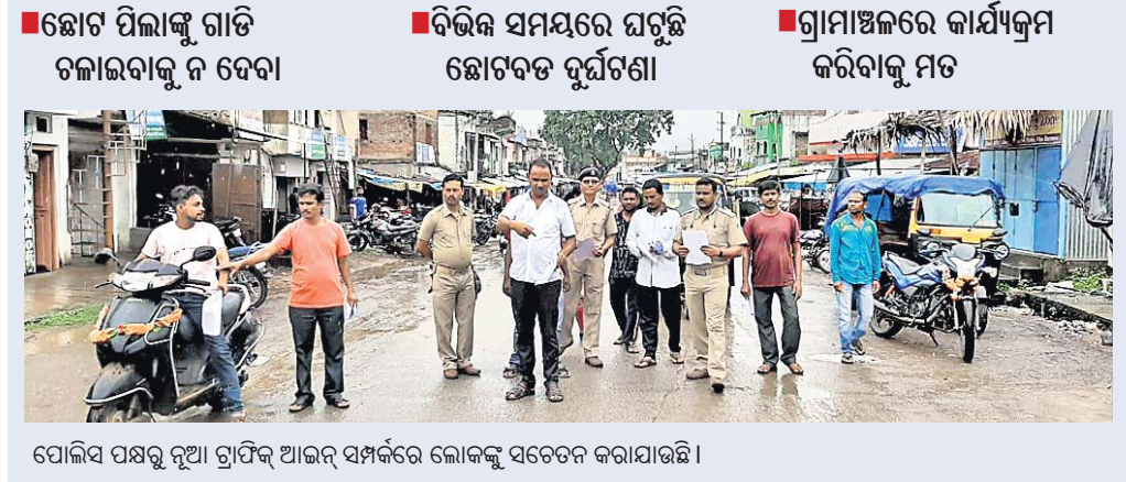
ପୋଲିସ ପକ୍ଷରୁ ନୂଆ ଗ୍ରାମିକ ଆଇନ୍ ସମ୍ପର୍କରେ ଲୋକଙ୍କୁ ସଚେତନ କରାଯାଇଛି।

କାଲିମେଳା, ୪୧୯(ଡି.ଏନ୍.ଏ.) ସେପ୍ଟେମ୍ବର ୧୧ରୁ ସମଗ୍ର ଦେଶରେ ନୂଆ ମୋଟରଯାନ ସଂଶୋଧନ ଆଇନକୁ କଡ଼ାକଡ଼ି ଭାବେ ଲାଗୁ କରାଯାଇଛି।