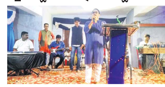
ଗଣେଶ ପୂଜା ଅବସରରେ ସାଂସ୍କୃତିକ କାର୍ଯ୍ୟକ୍ରମ ପରିବେଷଣ ହେଉଛି।