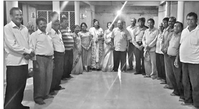
ପୂଜ୍ୟପୂଜା ପରିଷଦ ପକ୍ଷରୁ ଅନୁଷ୍ଠିତ ନୂଆଖାଇ ଭେଟଘାଟରେ ଉପସ୍ଥିତ ଅତିଥିଙ୍କ ସହ କର୍ମକର୍ମୀ ।

ରାଉରକେଲା ପୂଜ୍ୟପୂଜା ପରିଷଦ ପକ୍ଷରୁ ସାରନଗରୀ ସ୍ଥିତ ଗୁଣ୍ଡିଚା ମନ୍ଦିର ପରିସରରେ ନୂଆଖାଇ ଭେଟଘାଟ ପର୍ବ ଅନୁଷ୍ଠିତ ହୋଇଯାଇଛି ।