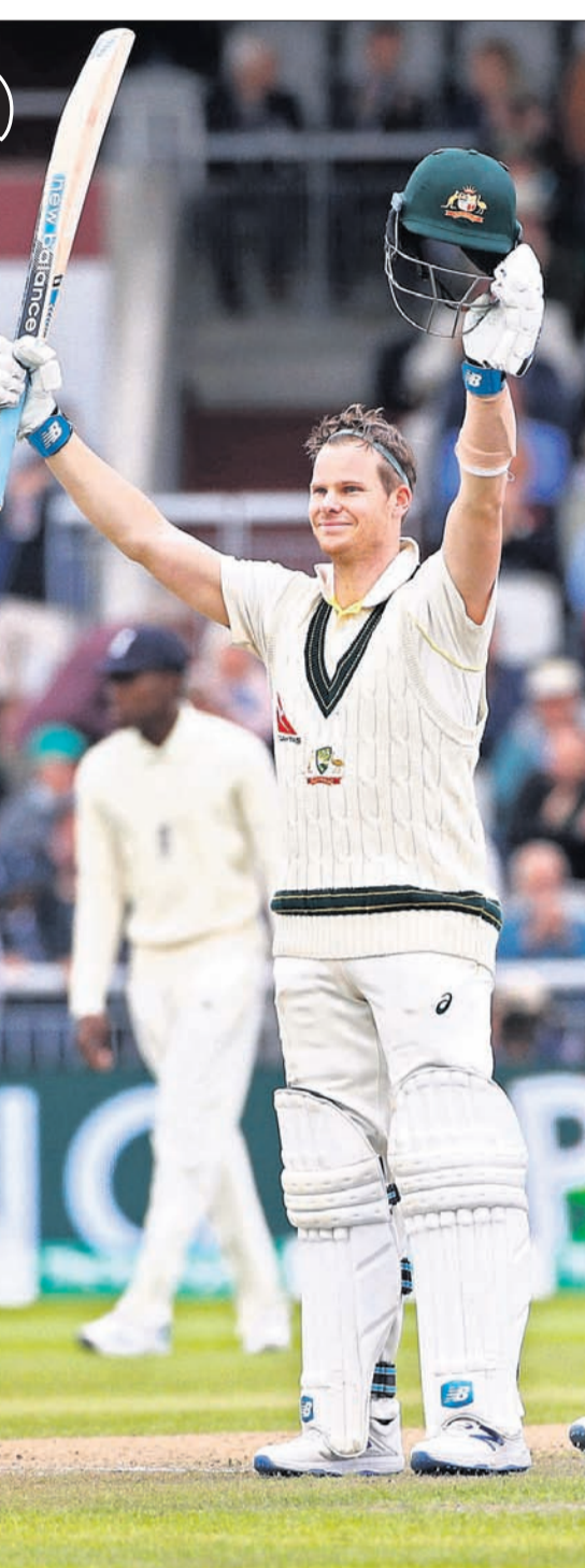
ଦ୍ୱିଶତକ ହାସଲକାରୀ ଷ୍ଟାର ସ୍ଲିପ୍

ମାଞ୍ଚେଷ୍ଟର, ୫୧୯ (ଏସପି) ଅଷ୍ଟ୍ରେଲିଆର ଷ୍ଟାର ବ୍ୟାଟ୍ସମ୍ୟାନ ଅଡ଼ଜିଟାୟ କ୍ରିକେଟକୁ ପ୍ରତ୍ୟାବର୍ତ୍ତନ ପରେ ଇଂଲଣ୍ଡ ବିପକ୍ଷ ଚଳିତ ଆଶେସ୍ ସିରିଜରେ ଚାକ୍ ପ୍ରଭାବୀ ବ୍ୟାଟିଂ କରି ରଖିଛନ୍ତି।