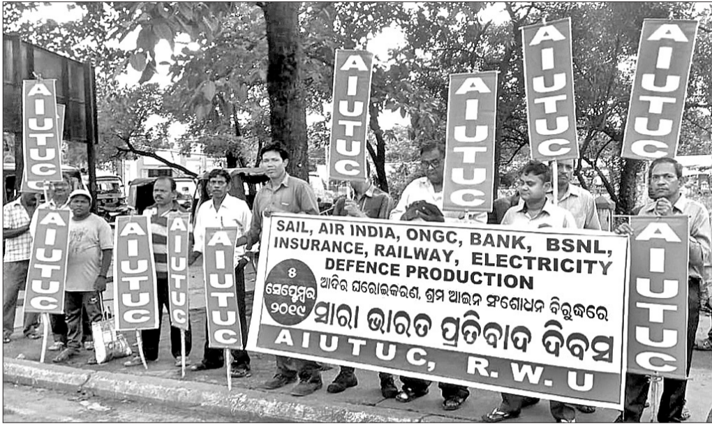
ବିଶ୍ୱା ଛକ ଠାରେ ଏଆଇୟୁଟିୟୁସି ପକ୍ଷରୁ ପ୍ରତିବାଦ ଆୟୋଜନ ।

ରାଷ୍ଟ୍ରାୟତ୍ତ ଉଦ୍ୟୋଗର ଯତ୍ନୋଦ୍ଧାରଣ ତଥା ଶ୍ରମ ଆଇନ ସଂଶୋଧନର ପ୍ରତିବାଦରେ ଏଆଇୟୁଟିୟୁସି ତାକରାରେ ରୁକ୍ମିଣୀ ୫ ସେପ୍ଟେମ୍ବରକୁ 'ସାରା ଭାରତ ପ୍ରତିବାଦ ଦିବସ' ଭାବେ ପାଳନ କରାଯାଇଛି ।