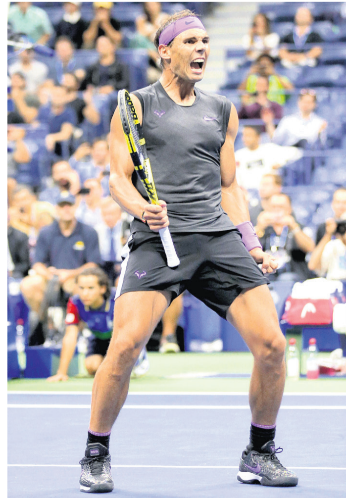
ବିଜୟ ହାସଲ ପରେ ରାଫାଲ ନାଟାଲଙ୍କ ସେଲିବ୍ରେଶନ।

ନ୍ୟୁୟାର୍କ, ୫।୯ (ଏଏସ୍‌ପି) ରାଫାଲ ନାଟାଲ ଚଳିତ ସୁଦ୍ଧା ଉପର ଗ୍ରାଣ୍ଡସ୍ଲାମ ଟେନିସ ପ୍ରତିଯୋଗିତାରେ ସେମିଫାଇନାଲରେ ପ୍ରବେଶ କରିଛନ୍ତି।