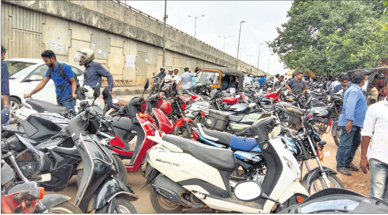
ଭୁବନେଶ୍ୱର ଆରଟିଓ -୧ କାର୍ଯ୍ୟାଳୟ ସମ୍ମୁଖରେ ବ୍ୟାପକ ଧରଣର ମଟର ସାଇକଲ ଓ ସ୍କୁଟର ମିଳୁଥିବା ଦୃଶ୍ୟ ଫାଇଲ୍ ଆରଟିଓର ଅଧିକାରୀଙ୍କ ଦ୍ୱାରା ଗ୍ରହଣ କରାଯାଇଛି ।