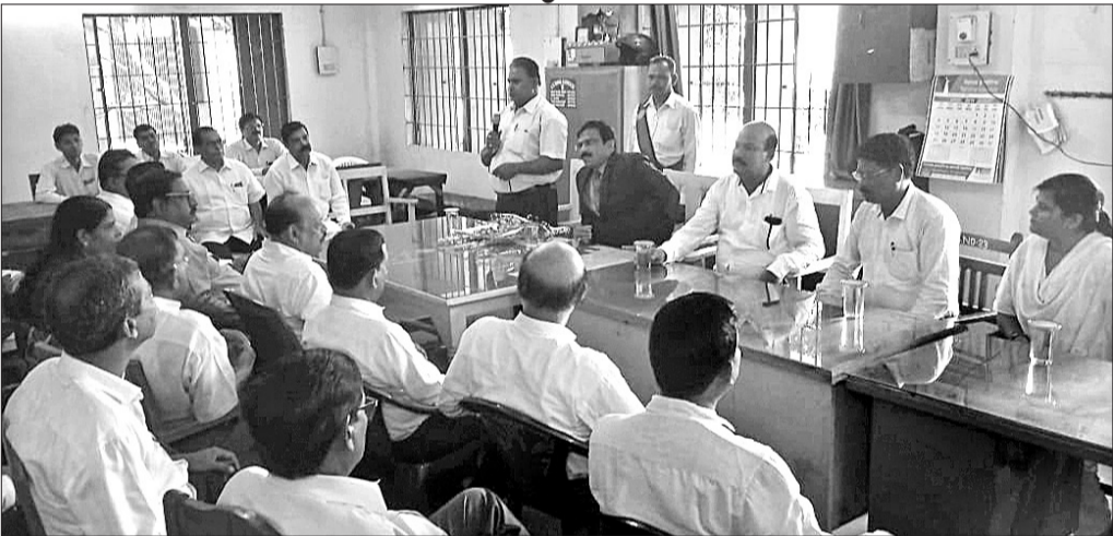
ସାଧାରଣ ପରିଷଦ ବୈଠକରେ ଉପସ୍ଥିତ ଓକିଲ ।

ଭିଜିଲାନ୍ସ ଚକ୍ର ନିର୍ଦ୍ଦେଶ ପରେ ଏସଡିଜେଏମ୍‌ଙ୍କ ବଦଳି ନେଇ ଦୀର୍ଘ ୪୪ ଦିନ ହେବ ରାଉରକେଲା ଓକିଲ ସଂଘ ପକ୍ଷରୁ କାରି ରହିଥିବା କାର୍ଯ୍ୟବନ୍ଦ ଆନ୍ଦୋଳନ ପ୍ରତ୍ୟାହତ ଘୋଷଣା କରାଯାଇଛି ।