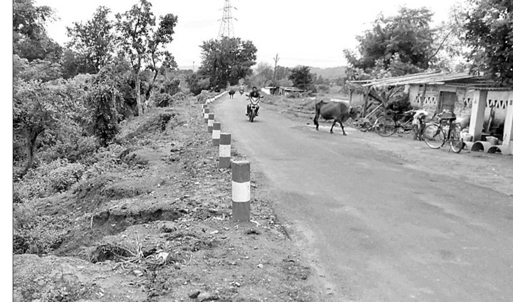
ନୂତନ ଭାବେ ନିର୍ମାଣ କରାଯାଇଥିବା ଚର୍ଚରା ହନୁମାନ ବାଟିକା ନୂଆ ରାସ୍ତା ।

ଲାଠିକତା ସମେତ ସମଗ୍ର ଦକ୍ଷିଣ ରାଉରକେଲାସାଧାକ ରାଉରକେଲା ଯାତାୟତ ରାସ୍ତା ହେକେଟ ରୋଡ଼ ସାଧାରଣ ଛକ ବନ୍ଦ ହେବାକୁ ସାହାଯ୍ୟ କରିବାକୁ ରାସ୍ତା ନିର୍ମାଣ କାର୍ଯ୍ୟ ଶେଷ ହୋଇଛି ।