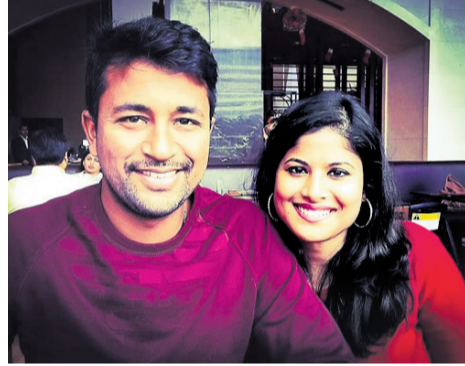
ସ୍ତ୍ରୀ କରବିକ ସହ ପ୍ରଞ୍ଚାନ ଓଝା

ମୁମ୍ବାଇ, ୫।୯-ଓଡ଼ିଆ କ୍ରିକେଟର ପ୍ରଞ୍ଚାନ ଓଝା ଗୁରୁବାର ୩୩ ବର୍ଷରେ ପଦାର୍ପଣ କରିଛନ୍ତି।