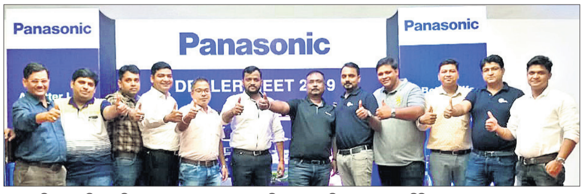
ପାନାସୋନିକ ପକ୍ଷରୁ ଡିଲର ସମ୍ମିଳନୀ ପୂରାଣ ଏକ ହୋଟେଲରେ ଅନୁଷ୍ଠିତ ହୋଇଯାଇଛି। ଏଥିରେ ରାଜ୍ୟର ବିଭିନ୍ନ ପ୍ରାନ୍ତରୁ କମ୍ପାନୀର ଅଂଶୀଦାର ତଥା ଡିଲରମାନେ ଯୋଗ ଦେଇଥିଲେ।