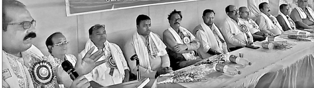
ରୁରୁଦିବସ ପାଳନ ଅବସରରେ ମହାସଭାରେ ଅତିଥିଙ୍କ ସହ ।