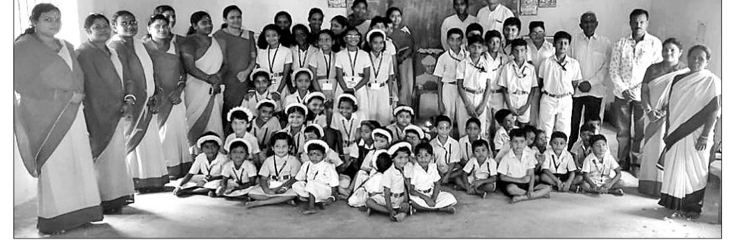
ଗୁରୁଦିବସରେ ଗୁରୁମା, ଗୁରୁଜୀ ଓ ଛାତ୍ରାଛାତ୍ରୀ।

ଉପରେ ଗୀତ ପରିବେଷଣ କରିଥିଲେ। ପରେ ଗୁରୁପୂଜନ କାର୍ଯ୍ୟକ୍ରମ ଅନୁଷ୍ଠିତ ହୋଇଥିଲା।