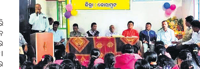
ଗୁରୁ ଦିବସ ସଭାରେ ଉପସ୍ଥିତ ଅତିଥି, ଶିକ୍ଷୟିତ୍ରୀ, ଶିକ୍ଷକ।