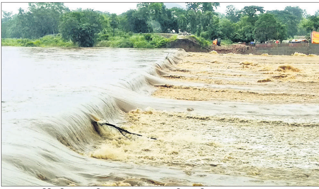
ଧରାକୋଟ: ଜାନବିଲି ଆନିକଟଠାରେ ରଞ୍ଜିକୁଲ୍ୟା ନଦୀରେ ବନ୍ୟା ଜଳ ପ୍ରବାହିତ ହେଉଛି।

ହିଞ୍ଜିଳିକାଟୁଠାରେ ଘୋଡ଼ାହାଡ଼ ନଦୀରେ ଜଳସ୍ତର ବୃଦ୍ଧି ପାଇଛି। ୯୯.୫୫ରେ ଗାୟତ୍ରୀ ନଗର, ଶ୍ୟାମଳାଳ ହୋଇଛି। କେତେକ ସ୍ଥାନରେ ପୌର ନଗର, ଜଗନ୍ନାଥ ବିହାରରେ ବର୍ଷା ଜଳ ପ୍ରଶାସନ ପକ୍ଷରୁ ପମ୍ପ ଦ୍ୱାରା ଜଳ ନିଷ୍କାସନ କରାଯାଇଛି। ଘୋଡ଼ାହାଡ଼ ଓ ରଞ୍ଜିକୁଲ୍ୟା