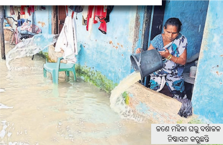
ଜଣେ ମହିଳା ଘରୁ ବର୍ଷାଜଳ ନିଷ୍କାସନ କରୁଛନ୍ତି