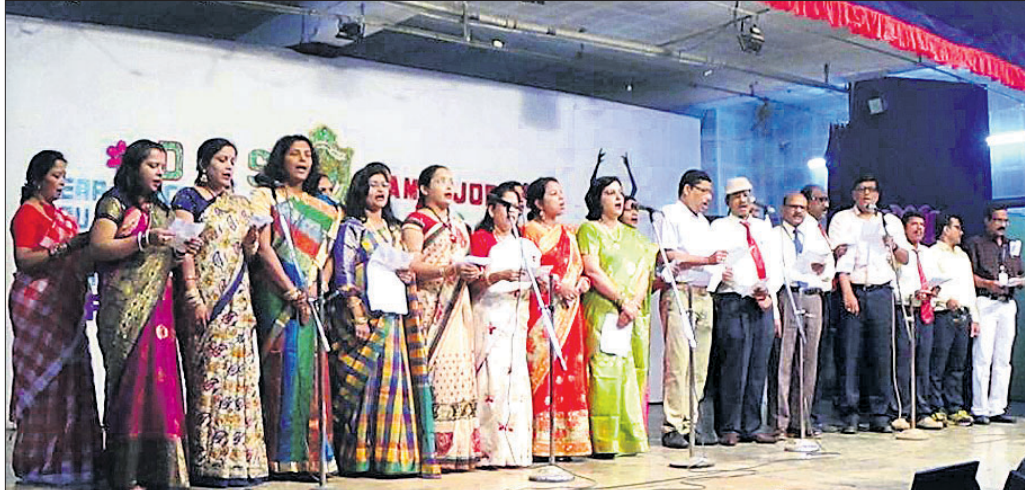
ଦୀପନଯୋଡ଼ି ନାଲିକୋ ଚାନ୍ଦନଶିଳ୍ପ ସ୍ଥିତ ଦିଲ୍ଲୀ ପବ୍ଲିକ୍ ସ୍କୁଲରେ ଗୁରୁବାର ଆୟୋଜିତ ଗୁରୁ ଦିବସ କାର୍ଯ୍ୟକ୍ରମ।