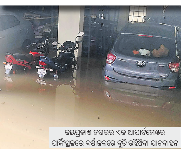
ଜୟପ୍ରକାଶ ନଗରର ଏକ ଆପାର୍ଟମେଣ୍ଟର ପାର୍କିଂସ୍ଥଳରେ ବର୍ଷାଜଳରେ ବୁଡ଼ି ରହିଥିବା ଯାନବାହନ