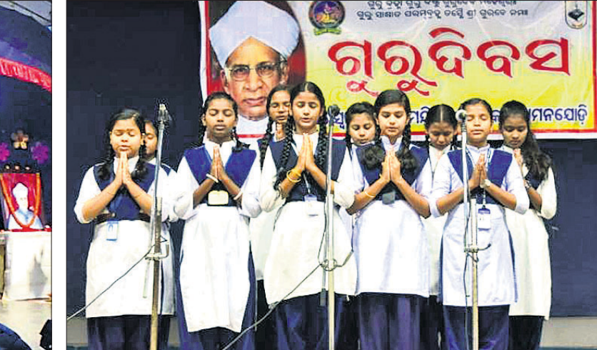
ଦୀପନଯୋଡ଼ି ସରସ୍ୱତୀ ଶିଶୁ ବିଦ୍ୟାଳୟରେ ଗୁରୁ ଦିବସ ଗାଉଛନ୍ତି ଛାତ୍ରୀ।