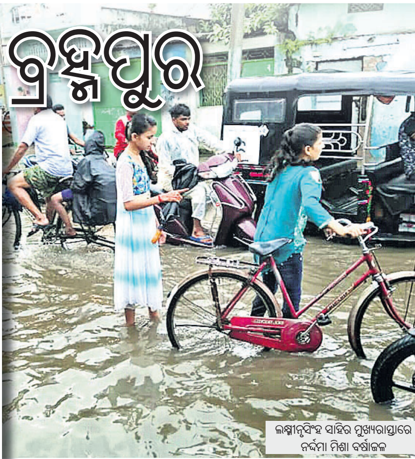
ଲକ୍ଷ୍ମୀନଗର ସାହିର ପୁଖ୍ୟରାସ୍ତାରେ ନର୍ଦ୍ଦମୀ ମିଶା ବର୍ଷାଜଳ

ପୁଖ୍ୟରାସ୍ତା, ଲୋତାପଡା ରୋଡ଼ ପାର୍ଶ୍ୱ ବ୍ୟାଙ୍କ କଲୋନୀ, ଅନନ୍ତନଗର ୫ମ ଗଳି, ଆଧ୍ୟାତ୍ମିକ ଗରିମାକର୍ତ୍ତା ଛକ ପାର୍ଶ୍ୱ ପୁଖ୍ୟରାସ୍ତା, ପ୍ରେମନଗର ରୋଡ଼, ଧର୍ମନଗର ପୁଖ୍ୟରାସ୍ତାରେ ପ୍ରାୟ ୨ ଘଣ୍ଟା ଉଚ୍ଚ ବର୍ଷାଜଳ ଦୀର୍ଘ ସମୟଧରି ଜମି ରହିଥିଲା। ଫଳରେ ଉପରୋକ୍ତ ରାସ୍ତାରେ ଯାତାୟାତ ବାଧାପ୍ରାପ୍ତ ହୋଇଥିଲା। ସେହିପରି