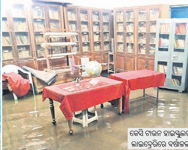
କେସି ଗଜନ ହାଇସ୍କୁଲର ଲାଭକ୍ରେଡିଟରେ ବର୍ଷାଜଳ