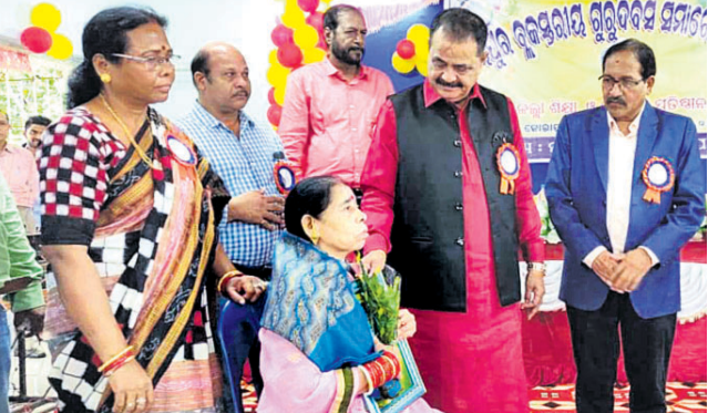
ଜଣେ ଶିକ୍ଷୟିତ୍ରୀଙ୍କୁ ସମ୍ବର୍ଦ୍ଧିତ କରୁଛନ୍ତି ବିଧାୟକ।