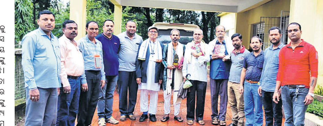
ସମ୍ମାନିତ ବ୍ୟକ୍ତିଗଣଙ୍କ ସହ ପ୍ରେସ କ୍ଲବ୍ ସଭ୍ୟମାନେ।

ସ୍ଥାନୀୟ ତାଳ ବଙ୍ଗଳାରେ ଗୁରୁ ଦିବସକୁ ସ୍ମରଣ ଭାବେ ପାଳିତ ବୋରିଗୁମ୍ମା ପ୍ରେସ କ୍ଲବ୍ ବିଭିନ୍ନ କ୍ଷେତ୍ରରେ ଉଲ୍ଲେଖନୀୟ ଅବଦାନ ପାଇଁ ତିନି ଜଣ ଗୁରୁଙ୍କୁ ଏଥିରେ ସମ୍ମାନିତ କରାଯାଇଛି।