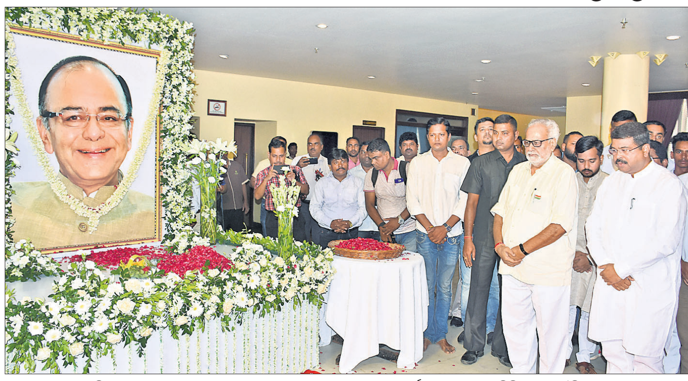
ଜେଲୋକ ଶ୍ରଦ୍ଧାଞ୍ଜଳି ସଭାରେ ରାଜ୍ୟପାଳ ପ୍ରତ୍ୟେକ ଗଣେଶୀ ଲାଲ, କେନ୍ଦ୍ରମନ୍ତ୍ରୀ ଧର୍ମେନ୍ଦ୍ର ପ୍ରଧାନ ଏବଂ ବିଭିନ୍ନ ରାଜନୈତିକ ଦଳର ନେତୃବୃନ୍ଦ ।

ପୂର୍ବତନ ଅର୍ଥମନ୍ତ୍ରୀ ତଥା ଭାଜପା ବରିଷ୍ଠ ନେତା ଜେଲୋକ ଶ୍ରଦ୍ଧାଞ୍ଜଳି ସଭାରେ ସାଫଳତା ସହ ଏକ ଘରୋଇ ହୋଟେଲରେ ସାଫଳତା ସହ ଏବଂ ସର୍ବଦଳୀୟ ଶ୍ରଦ୍ଧାଞ୍ଜଳି ସଭା ଅନୁଷ୍ଠିତ ହୋଇଛି । ଏହି ଅବସରରେ ରାଜ୍ୟପାଳ ଗଣେଶୀ ଲାଲ, କେନ୍ଦ୍ରମନ୍ତ୍ରୀ ଧର୍ମେନ୍ଦ୍ର ପ୍ରଧାନ, ସବୁ ରାଜନୈତିକ ଦଳ, ସାମାଜିକ ସଙ୍ଗଠନ, ସ୍ୱେଚ୍ଛାସେବୀ, ସମାଜସେବକ ସମେତ ବିଭିନ୍ନ ବରିଷ୍ଠ ବ୍ୟକ୍ତିଗଣଙ୍କ ଯୋଗଦେଇ ଜେଲୋକ ଶ୍ରଦ୍ଧାଞ୍ଜଳି ଅର୍ପଣ କରିଛନ୍ତି । ଏହି ଅବସରରେ ପ୍ରତ୍ୟେକ ଗଣେଶୀ ଲାଲ କହିଛନ୍ତି, କେତେ ଜଣ କୁହନ୍ତି ଶତ୍ରୁକଠାରୁ ସାଧାରଣ ଗୃହକୁ ଏବଂ କେତେଜଣ କୁହନ୍ତି ଶତ୍ରୁତା କାହିଁକି କରାଯାଇଛି । କିନ୍ତୁ ଜେଲୋକ ଅଜାତ ଶତ୍ରୁ ଥିଲେ । ସେ ଜଣେ ସ୍ଥିରଚିତ୍ତ, ଆତ୍ମ ବୁଦ୍ଧିମାନ ବ୍ୟକ୍ତି ଥିଲେ । ସେ ମୋର ପ୍ରିୟ ବନ୍ଧୁ ଥିଲେ । ଯେତେବେଳେ ପ୍ରତ୍ୟେକ ଥିଲେ ସେତେବେଳେ ସେ ବିଶ୍ୱାସୀୟ ଥିଲେ । ତାଙ୍କ ସହ ମିଶି ଭୋଜନ କରିବା ସ୍ମୃତିକୁ ମନେପକାଇ ରାଜ୍ୟପାଳ ତାଙ୍କ ଆତ୍ମାର ସଦ୍‌ଗତି କାମନା କରିଛନ୍ତି ।