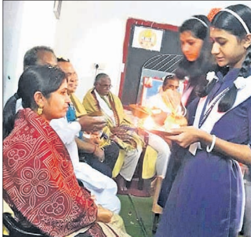
କୋରାପୁଟ ସରସ୍ୱତୀ ବିଦ୍ୟାଳୟରେ ଗୁରୁଙ୍କୁ ପୂଜା କରୁଛନ୍ତି ଛାତ୍ରୀ।