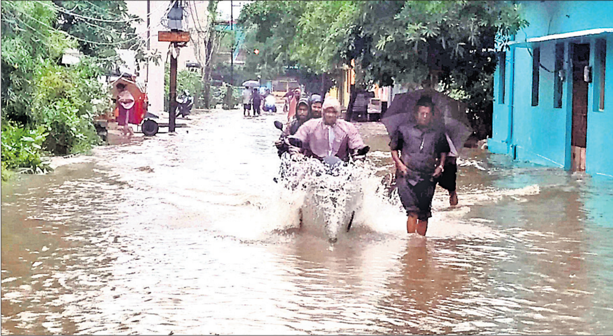
ବ୍ରହ୍ମପୁର ସହରରେ ଗୁରୁବାର ହୋଇଥିବା ଲଗାଣ ବର୍ଷାରେ ଗଜପତି ନଗର ମୁଖ୍ୟରାସ୍ତା ଉପରେ ପାଣି ।