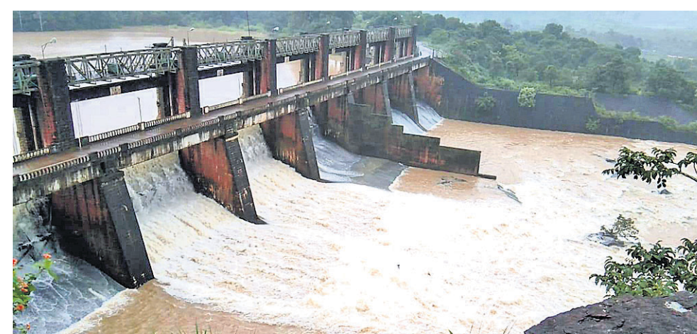
କୋରାପୁଟ ମୁଖ୍ୟ ଡ୍ୟାମର ୬ ଓ ୭ ନମ୍ବର ଗେଟ୍ ଖୋଲାଯାଇଛି।

କିଛିଦିନ ହେଲା ପ୍ରବଳ ବର୍ଷା ଲାଗି ରହିଥିବା ଯୋଗୁ କୋରାପୁଟ ଜିଲ୍ଲାର ବିଭିନ୍ନ ଜଳଭଣ୍ଡାରରେ ଜଳସ୍ତର ବୃଦ୍ଧି ପାଇଛି। ଫଳରେ ଗୁରୁବାର ପ୍ରଥମଥର ମାଛକୁଣ୍ଡ ପ୍ରକଳ୍ପର ଜଳାପତ୍ତନ ମୁଖ୍ୟତଃ ୨ଟି ଗେଟ୍ ଖୋଲିଲା।