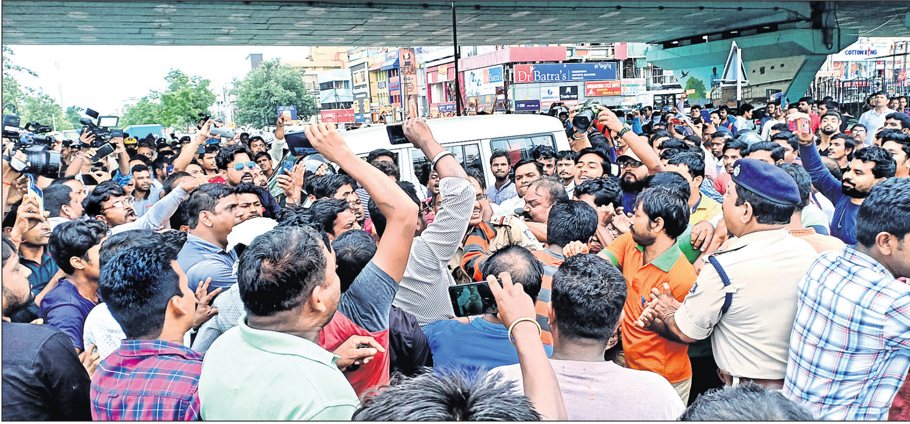
ଭୁବନେଶ୍ଵର ରାଜମହଲ ଛକରେ ଶନିବାର ପୋଲିସ ଭ୍ୟାନ୍ ଓ କର୍ମଚାରୀଙ୍କୁ ଘେରିବା ସହ ହୋଇଥିବା ମାରପିଟ୍।