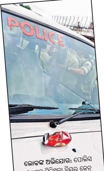
ଲୋକଙ୍କ ଅଭିଯୋଗ: ପୋଲିସ ଭ୍ୟାନ୍‌ରୁ ମିଳିଥିବା ବିୟର ବେନ୍ଦ୍