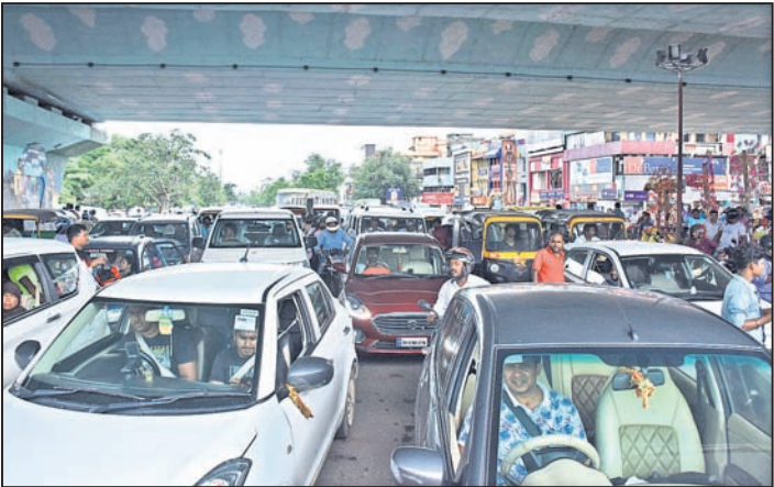
ସୃଷ୍ଟି ହୋଇଥିବା ଗ୍ରାହକ କାମ୍।