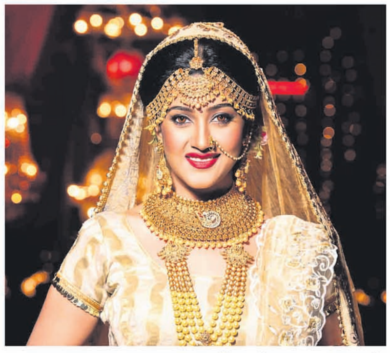
ଉଦ୍‌ଘାଟନୀ ସମାରୋହରେ ଯୋଗଦେଇ ସୋନମ କପୁର କହିଥିଲେ - “ମୁଁ ସର୍ବଦା ଡିଜାଇନିଂ ଥିବା ମଦିର, ସ୍ତ୍ରୀପତ୍ୟ, ଡିଜାଇନିଂ ଚୁକ୍ତ ଦେଖିବା ପାଇଁ ଡିଜାଇନିଂ କରିବାକୁ ଚାହୁଁଥିଲି ଏବଂ ଲାଲଚନ୍ଦ୍ର ଆଜି ମତେ ସେହି ସୁଯୋଗ ପ୍ରଦାନ କରିଛି । ମୁଁ ଅନେକ ଅଳଙ୍କାର ସୋଲ୍ୟୁସ୍ ଦେଖିଛି, ମାତ୍ର ଏଭଳି ସୋ’ଲ୍ୟୁସ୍ କେଉଁଠି ଦେଖିନଥିଲି । ଏଠାକାର ଅଳଙ୍କାର କାରିଗରୀ ବିଶ୍ୱସ୍ତରାୟ ।”