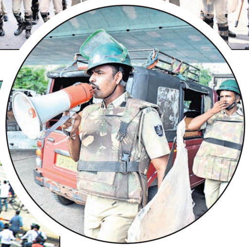
ସ୍ଥାନ ଛାଡ଼ି ଯିବାକୁ ପୋଲିସର ପୂରଣ।