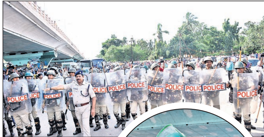
ପୂର୍ବଦିଗ ପୋଲିସ ପୋର୍ସ।