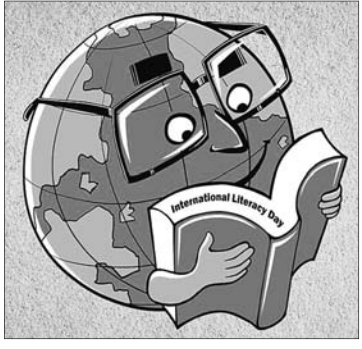
ଅବସରରେ ଆୟତ୍ତାଣୀ କରିବାର ଏକ ଦିନ ବୋଲି ମନେକରାଯାଏ।

ବିଶ୍ୱ ସାକ୍ଷରତା ଦିବସର ଘୋଷଣା ଥିଲା- 'ସାକ୍ଷରତା ଓ କୌଶଳ ବିକାଶ'।