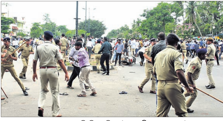
ଲୋକଙ୍କୁ ଗୋଡ଼ାଇ ପିଚୁଛି ପୋଲିସ । (ଫଟୋ ଫିଟର ପୃଷ୍ଠା-୧୪)

ଅପରାହ୍ଣ ପ୍ରାୟ ୧୨ଟା ୪୫ ହେବା ପରେ ରାଜମହଲ ଛକରେ କ୍ୟାପିଟାଲ ଥାନା ପୋଲିସ ପକ୍ଷରୁ ଗାଡ଼ି ଯାତ୍ରୀ ଚାଲିଥିଲା । ଏହି ସମୟରେ ଏକ ଘରୋଇ ଆୟୁଲ୍ୟାନ୍ନୁ ନୂତନଦେହ ନେଇ ରାଜମହଲକୁ ଶିଶୁ ଭବନ ଅଭିମୁଖେ ଯାଉଥିଲା । ଭ୍ରାଜିତର ସିଟ୍ ବେଲୁ ପିନ୍ଧି ନ ଥିବାରୁ ପୋଲିସ ଅଟକାଇଥିଲା । ବ୍ୟସ୍ତତା ମଧ୍ୟରେ ସିଟ୍ ବେଲୁ ବାନ୍ଧିବାକୁ ମନ ନ ଥିବା ଭ୍ରାଜିତର ଜଣକ କହିବା ସହ ଛାଡ଼ି ଦେବାକୁ କାନ୍ଦୁଟି ମନଟି ହୋଇଥିଲା । କିନ୍ତୁ ପୋଲିସ କିଛି ନ ଶୁଣି ଚାକ୍‌ଠାକୁ ୧୦୦୦ଟଙ୍କା ଜରିମାନା କାଟିଥିଲେ । ହେଲେ ଏହି ସମୟରେ ସେହିବାର