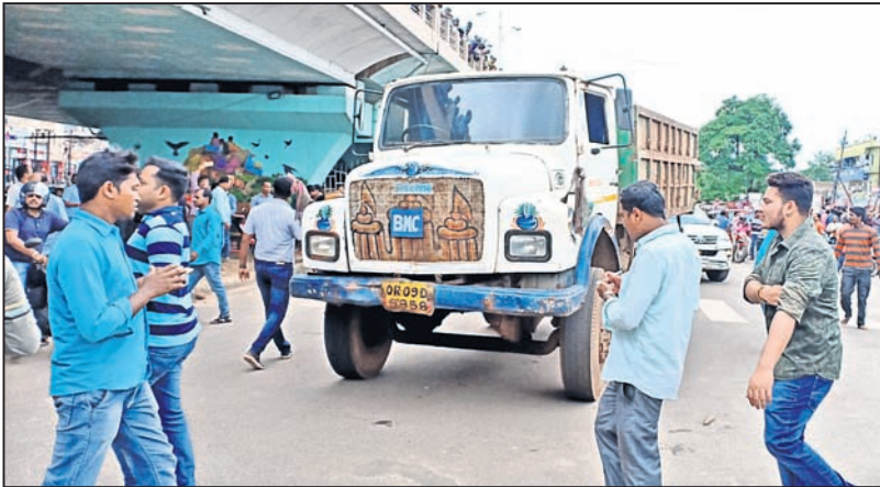
ବିଏମ୍‌ସି ଗାଡ଼ିକୁ କରିମାନା ଆଦାୟ କରିବା ଦାବିରେ ଲୋକେ ଚାହାଙ୍କୁ ଅଟକ ରଖିଛନ୍ତି।