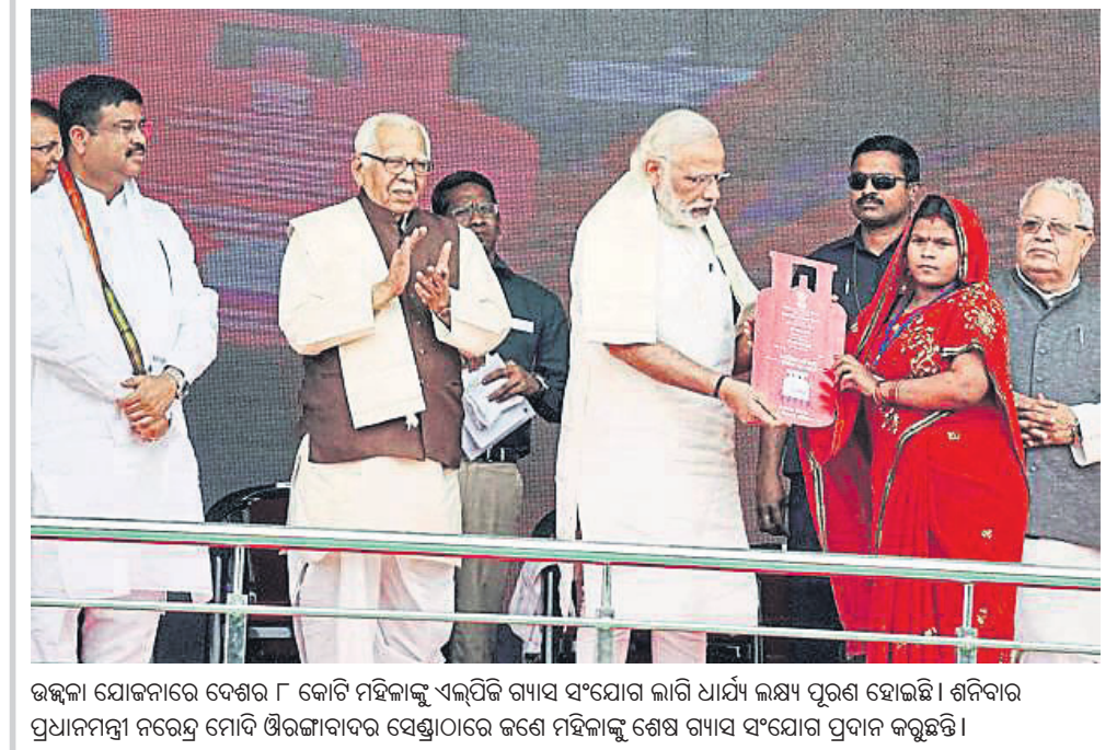
ଉତ୍କଳା ଯୋଜନାରେ ଦେଶର ୮ କୋଟି ମହିଳାଙ୍କୁ ଏଲିପ୍ଟିକ୍ ଗ୍ୟାସ୍ ସଂଯୋଗ ଲାଗି ଧାର୍ଯ୍ୟ ଲକ୍ଷ୍ୟ ପୂରଣ ହୋଇଛି। ଶନିବାର ପ୍ରଧାନମନ୍ତ୍ରୀ ନରେନ୍ଦ୍ର ମୋଦି ଓମ୍‌କାରୀଦାସ ସେଣ୍ଡାଠାରେ କଟକ ମହିଳାଙ୍କୁ ଶେଷ ଗ୍ୟାସ୍ ସଂଯୋଗ ପ୍ରଦାନ କରୁଛନ୍ତି।

୧୯୬୭ ଜାନୁଆରୀରେ ଚନ୍ଦ୍ରରେ ପହଞ୍ଚିବା ଅବଦାନରେ ଯୁଏସ୍‌ଏଫ୍‌ଆର ସଫଳ ହୋଇଥିଲା। ଏହାର ୫ ମାସ ପରେ ଆମେରିକାର ସର୍ଭେୟର-୧ ସଫଳାତ୍ମକ ହୋଇଥିଲା। ଏହା ପରେ ଆମେରିକାର ଆପୋଲୋ ୧୧ ମିଶନ ସବୁଠୁ ସଫଳ ହୋଇଥିଲା। ନାଲ୍‌ଆର୍ମ୍‌ସ୍ଟ୍ରାଙ୍ଗ କେବେବି ଆମେରିକାର ୩ ମହାକାଶଚାରୀ ଚନ୍ଦ୍ର ଅଭିଯାନରେ ଯାଇଥିଲେ।