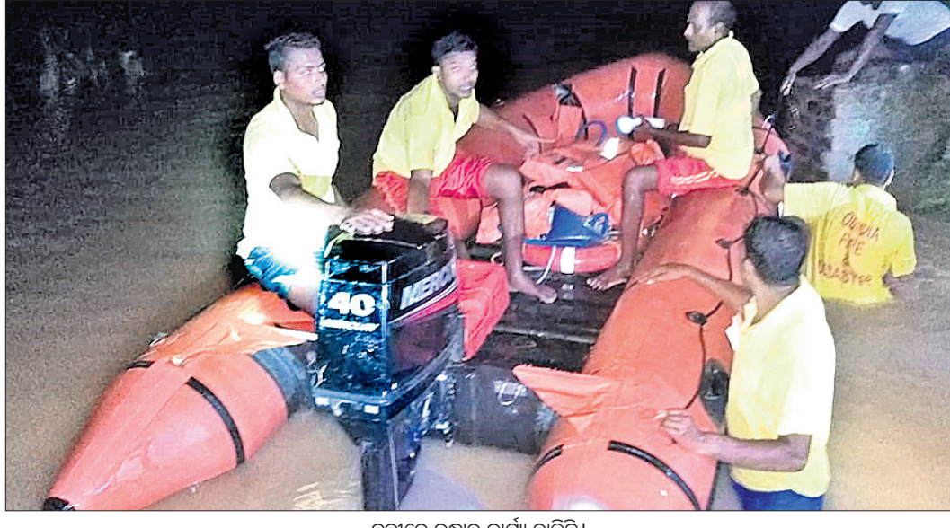
ନଦୀରେ ଉଦ୍ଧାର କାର୍ଯ୍ୟ ଚାଲିଛି।