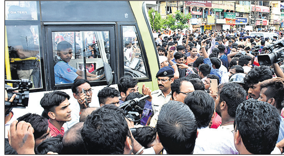
ଘଟଣାସ୍ଥଳରେ 'ମୋ ବସ'କୁ ଘେରି ରହିଥିବା ଲୋକମାନେ।