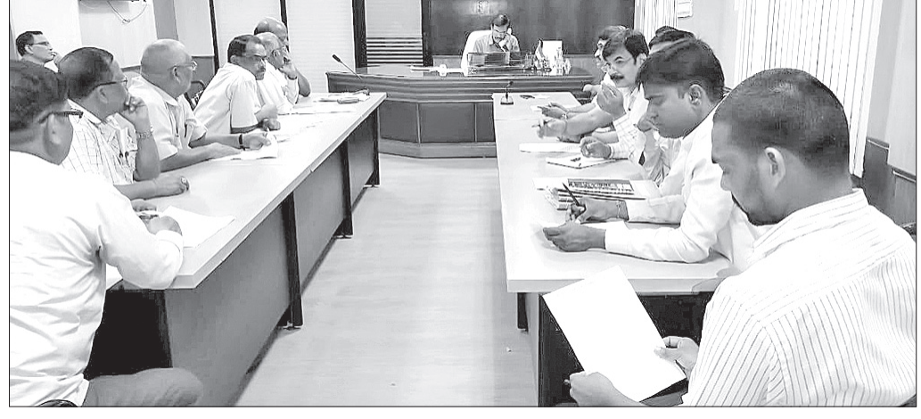
ଅନୁଗୋଳ ଅଫିସ, ୭୮୯: ଅନୁଗୋଳ କୋଶାଳ ପ୍ରକାଶନ ଘର ପାଇଁ ହୋଇଯାଇଛି।

ଅନୁଗୋଳ ଅଫିସ, ୭୮୯: ଅନୁଗୋଳ କୋଶାଳ ପ୍ରକାଶନ ଘର ୮୨୯ମ ପ୍ରକାଶନ ଘର ପାଇଁ ହୋଇଯାଇଛି।