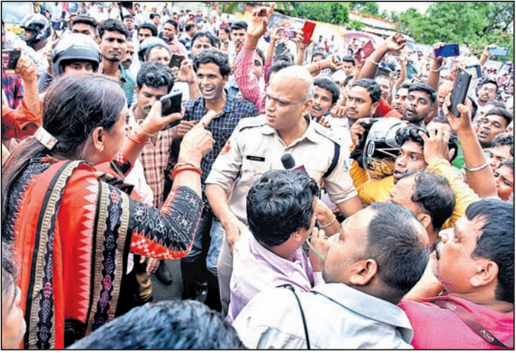
କରିମାନା ଆଦାୟ ପ୍ରତିରୋଧ କରି ପୋଲିସ ସହ ମୁହଁତକେ।