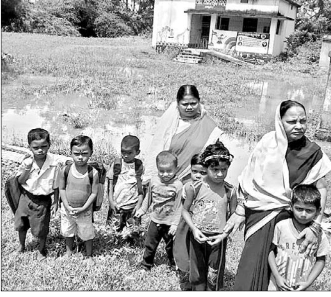
ଅଜ୍ଞାନତ୍ୱାତି ରାସ୍ତାରେ ପାଣି ଜମି ରହିଛି।