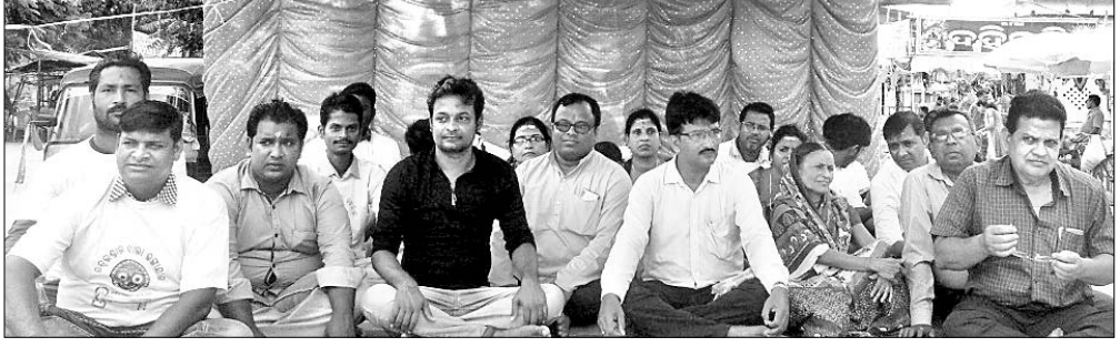
ଧାରଣାରେ ବସିଥିବା ସମିତିର କର୍ମକର୍ମୀ।