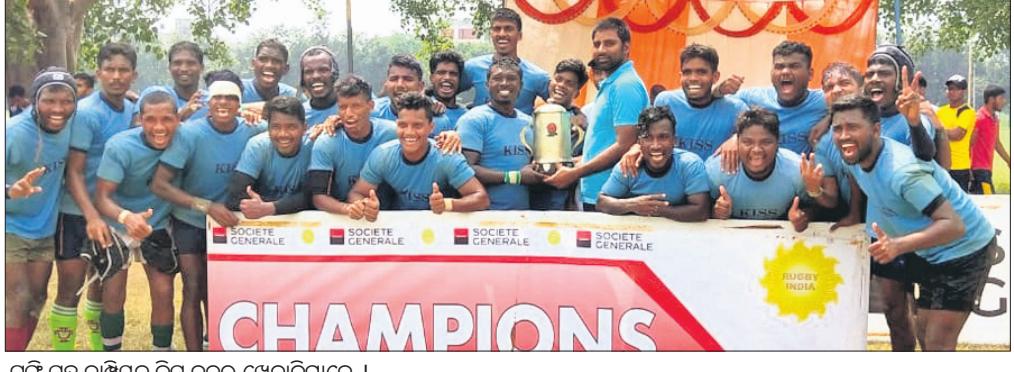
ଗ୍ରୁପ୍ ସହ ଚାମ୍ପିୟନ କିସ୍ ଦଳର ଖେଳାଳିମାନେ ।

ଭୁବନେଶ୍ୱର, ୮।୯ (କ୍ରୀଡ଼ା ପ୍ରତିନିଧି) ଚଣ୍ଡିଗଡ଼ର ପଞ୍ଜାବ ବିଶ୍ୱବିଦ୍ୟାଳୟ ପରିସରରେ ସର୍ବଭାରତୀୟ କାଲାଘାମ କପ୍ (ଡିଭିଜନ-୨) ରତ୍ନା ୧୫ଏସ ଚାମ୍ପିୟନଶିପ୍ ଅନୁଷ୍ଠିତ ହୋଇଯାଇଛି । ଚଣ୍ଡିଗଡ଼ ରତ୍ନା ପୁଟ୍ଟବଲ ଆସୋସିଏଶନ (ସି ଆର ଏଫ ଏ) ଆନୁକୂଲ୍ୟରେ ଆୟୋଜିତ ଏହି ପ୍ରତିଯୋଗିତାରେ କିସ୍ ଚାମ୍ପିୟନ ହୋଇଛି । ପ୍ରଥମ ମ୍ୟାଚରେ ଭୁବନେଶ୍ୱର ଦଳକୁ ୨-୦ ପଏଣ୍ଟରେ ହରାଇ ଅଭିଯାନ ଆରମ୍ଭ କରିଥିବା କିସ୍ ଦ୍ୱିତୀୟ ମ୍ୟାଚରେ ବାଲ୍ ପାଇ