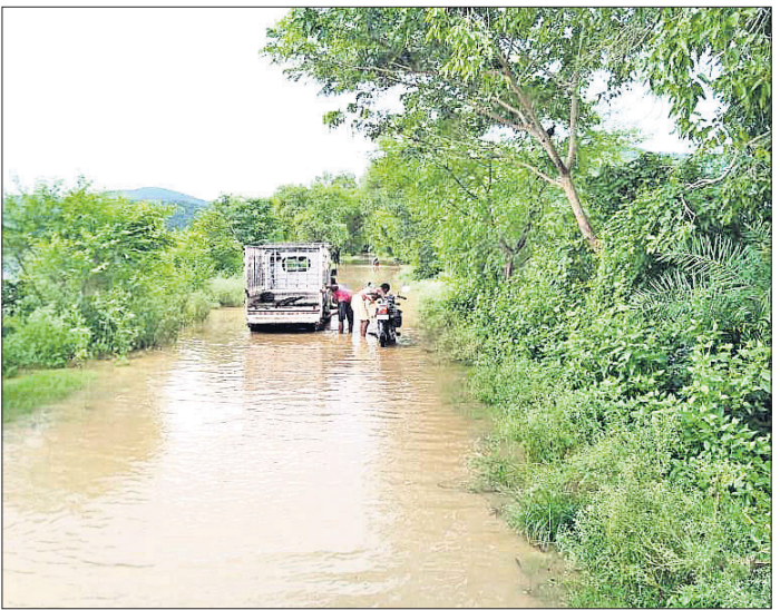
ରାସଙ୍ଗାଠାରେ ରାସ୍ତା ଉପରେ ପ୍ରବାହିତ ବନ୍ଦ୍ୟାଜଳ। ହେଉଥିବାକୁ ଜଳସ୍ତର ବଢ଼ିବାରେ ଲାଗିଛି। ବୁକ୍ ବଡ଼ମୂଳଠାରେ ଥିବା ଗେଟ୍ ସାଇଡ଼ରୁ ହାରାକୁଦ ନଦୀବନ୍ଧରୁ ଭିଜିଜନର ଗଣିଆ ମିଳିଥିବା ସୂଚନା ଅନୁଯାୟୀ, ରବିବାର ଏକପ୍ରକାର ବନ୍ଦ୍ୟା ଆଶଙ୍କା ଦେଖାଦେଇଛି।

ଗତ ୪ଦିନ ଧରି ଲଘୁତାପଜନିତ ଲଗାଣ ବର୍ଷା ଯୋଗୁ ମହାନଦୀର ଜଳସ୍ତର ବୃଦ୍ଧି ପାଇବାରେ ଲାଗିଛି। ତେବେ ଗତ ଶନିବାର ଅପରାହ୍ନରେ ମହାନଦୀରେ ବନ୍ଦ୍ୟାପାଣି ଆସି ନୟାଗଡ଼ ଜିଲ୍ଲା ଗଣିଆ ବୁକ୍ସର ଗଣିଆ-ବଡ଼ମୂଳ ପୂର୍ବ ରାସ୍ତାର ରାସଙ୍ଗା, କାପୁଆ, କଳାପାଟ ପୀଠ, ଛାମୁଣିଆ ନିକଟସ୍ଥ କଣ୍ଟାନାଳ, ବାଉନାଳିଆ, ମୁକୁଳିଗାଡ଼ିଆ, ମଙ୍ଗଳାସାଠାରେ ରାସ୍ତା ଉପରେ ୨ ଫୁଟର ବନ୍ଦ୍ୟାଜଳ ପ୍ରବାହିତ ହେଉଥିଲା। ରବିବାର ସକାଳେ ଜଳସ୍ତର ଧୀରେ ଧୀରେ କମିବାରେ ଲାଗିଥିଲା। ତେବେ ମଧ୍ୟାହ୍ନ ସମୟକୁ ପୁଣିଥରେ ବୃଦ୍ଧି ପାଇବାକୁ ଉପରୋକ୍ତ ସ୍ଥାନରେ ବନ୍ଦ୍ୟାଜଳ ପ୍ରବାହିତ ହେଉଥିବା ଦେଖାଯାଇଛି। ଲଗାଣ ବର୍ଷା ସାଙ୍ଗକୁ ହାରାକୁଦ ନଦୀବନ୍ଧରୁ ୨୦ଟି ଗେଟ୍ ଦେଇ ବନ୍ଦ୍ୟାଜଳ ପ୍ରବାହିତ