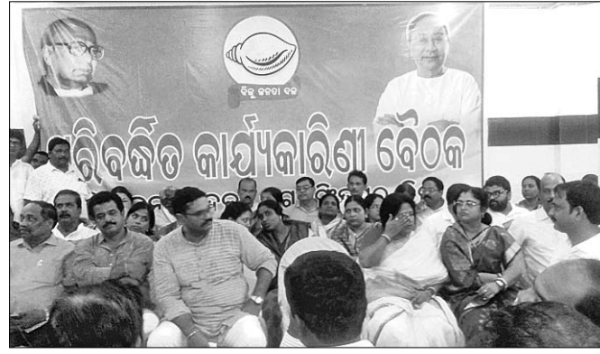
ବୈଠକରେ ଉପସ୍ଥିତ ବିଜେଡି ନେତା ଓ କର୍ମୀ।