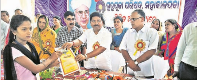
ବିଧାୟକ ଅତରୁ ସବ୍ୟସାଚୀ ନାୟକ ଜଣେ କୃତା ଛାତ୍ରୀଙ୍କୁ ପୁରସ୍କୃତ କରୁଛନ୍ତି ।