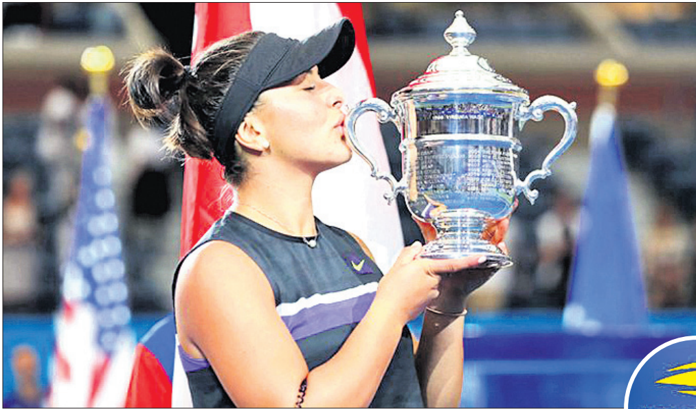
ସୁସ୍ୱ ଓପନ୍ ଫାଇନାଲ ବିଜୟିନୀ ବାସକା ଆଷ୍ଟ୍ରେସ୍ତୁ ଗ୍ରୀସ୍ତୁ କୁରୁନିୟାନ ଦେଉଛନ୍ତି ।

ନ୍ୟାସିକ୍, ୮।୯ (ପି.ଟି.): ସୁପ୍ରିମକୋର୍ଟ ନିୟୁତ୍ତ ପ୍ରଶାସକ ସମିତି (ସିଏସ) ରବିବାର ଭାରତୀୟ କ୍ରିକେଟ୍ କଣ୍ଠୋଳ ବୋର୍ଡ (ବିସିସିଆଇ)ର କାର୍ଯ୍ୟକାରୀ ସମ୍ପାଦକ ଅମିତାଭ ଚୌଧୁରୀଙ୍କୁ କାରଣଦର୍ଶୀ ଅନୁଷ୍ଠିତ ହୋଇଥିବା ଅନ୍ତର୍ଜାତୀୟ କ୍ରିକେଟ୍ ପରିଷଦ (ଆଇସିସି) ଓ ଏସିଆନ୍ କ୍ରିକେଟ୍ କାଉନ୍ସିଲ୍ (ଏସିସି) ଚେରରେ ଯୋଗଦେଇ ନ ଥିବାରୁ ଚୌଧୁରୀଙ୍କୁ ସିଏସ ପକ୍ଷରୁ ଏହି ନୋଟିସ ଜାରି ହୋଇଛି । ଏଥିପ୍ରତି ନିକଟରେ ସମ୍ପାଦକ ଭାବେ ଚୟନ କମିଟି ଚେରରେ ଆୟୋଜନ ଲାଗି ଅମିତାଭଙ୍କୁ ସିଏସ ପ୍ରତିବନ୍ଧିତ କରାଯାଇଥିଲା । ଏହାପରେ ସେ ଆଇସିସି ଓ ଏସିସି ନିକଟରେ ବିସିସିଆଇ ପ୍ରତିନିଧିତ୍ୱ ରହିଥିଲେ । ଆଗାମୀ ୭ଦିନ ମଧ୍ୟରେ ଚୌଧୁରୀଙ୍କୁ ନିକଟ ପକ୍ଷରୁ ବଦଳାଇ ଦିଆଯାଇଛି । ଆଇସିସି ଓ ଏସିସିର ଅଧିକ ଚେରରେ ତୁମ କେବଳ ଯୋଗ ଦେଇ ନାହିଁ ବରଂ ତୁମ ଉପଲବ୍ଧି ନେଇ ବିସିସିଆଇକୁ ଅନ୍ଧାରରେ ରଖିଥିଲେ । ଲଣ୍ଡନରେ ହୋଇଥିବା ଆଇସିସି ସମ୍ମିଳନୀରେ ତୁମର ଅନୁପସ୍ଥିତି ନେଇ ସିଏସ ଦୁଇଲକ୍ଷ ୧୪ରେ ଅବଗତ ହୋଇଥିଲା । ଏହି ଚେରରେ ତୁମ ଯୋଗଦେଇ ପାରିବ ନାହିଁ ବୋଲି କୁଲାଇ ୧୨ରେ ଆଇସିସିକୁ ମେଲ୍ କରିଥିଲେ । ଫଳରେ ବିସିସିଆଇ ଏହାର ପ୍ରତିନିଧି ପଠାଇବାରେ ବିଫଳ ହୋଇଥିଲା । ବୋଲି ଶ ସଦସ୍ୟ ବିଶିଷ୍ଟ ସିଏସ ନୋଟିସରେ ଏହା ଉଲ୍ଲେଖ ରହିଛି । ଏଠାରେ ଉଲ୍ଲେଖ ଯୋଗ୍ୟ, କୁଲାଇ ୧୪ରୁ ୨୦ ତାରିଖ ପର୍ଯ୍ୟନ୍ତ ଲଣ୍ଡନରେ ଆଇସିସି ଚେରରେ ଅନୁଷ୍ଠିତ ହୋଇଥିଲା । ସେହିଭଳି ସେପ୍ଟେମ୍ବର ୩ରେ ବ୍ୟାଙ୍କକ୍ରାରେ ଏସିସିର ବାଷ୍ପିକ ସାଧାରଣ ଚେରକ ବସିଥିଲା ।