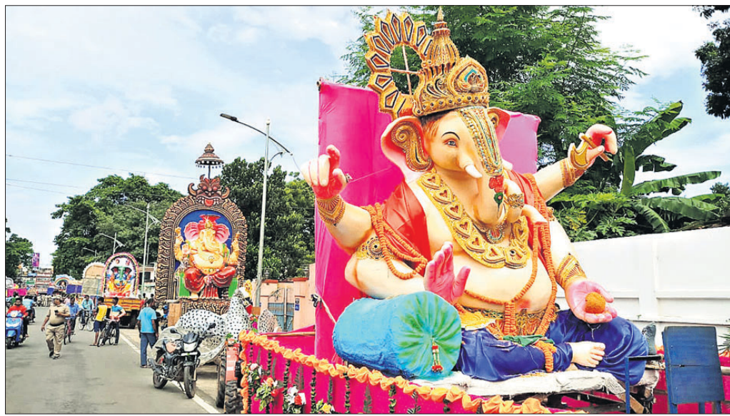
ମେଡ଼ବୁଡ଼ିକୁ ଶୋଭାଯାତ୍ରାରେ ବିସର୍ଜନ ନିମନ୍ତେ ନିଆଯାଇଛି ।

ବ୍ରାହ୍ମଣସୁଗାର ଜବତ, ୩ ଅଟକ ଡେକୋରା ଅର୍ପିତ, ୯୮୯- ଡେକୋରା ଅବକାରା ବିଭାଗ ଓ ଗାଉନ ଥାନା ପୋଲିସ୍ ପକ୍ଷରୁ ସୋମବାର ଅପରାହ୍ଣରେ ବୃତ୍ତାନ୍ତ କରାଯାଇ ଷ୍ଟାଡ଼ିୟମ ପଛ ପାଖରେ ଥିବା ବିକ୍ରି ନିକଟରୁ ବ୍ରାହ୍ମଣ ସୁଗାର ଜବତ କରାଯାଇଛି । ବ୍ରାହ୍ମଣ ସୁଗାର ନେତୃତ୍ୱ ୩ ଜଣ ସୁବକଳ୍ପ ଅଟକ ରଖି ପଚରାଉଚରା କାରି ରହିଛି । କୌଣସି ସୁତ୍ରରୁ ଖବରପାଇ ଅବକାରା ବିଭାଗ ଓ ପୋଲିସ୍ ମିଳିତ ଭାବେ ବୃତ୍ତାନ୍ତ କରିଥିଲା । ଏଥିପୂର୍ବରୁ ସହରର ରାମେଶ୍ୱରପୁର ଓଭରବ୍ରିଜ ନିକଟରୁ ଦୁଇଥର ବ୍ରାହ୍ମଣ ସୁଗାର ଜବତ କରାଯିବା ସହ ୩ ଜଣଙ୍କୁ ଗିରଫ କରାଯାଇଥିଲା ।