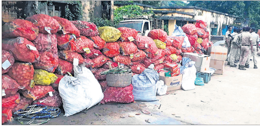
ଜବତ ହୋଇଥିବା ବାଣ ଓ ବାରୁଦକୁ ଆସିକା ଥାନା ପରିସରରେ ରଖାଯାଇଛି ।

ଆସିକା, ୯।୯ (ଡି.ଏ.ଏ.ଏ.) ଗଞ୍ଜାମ ଜିଲ୍ଲା ଆସିକା ଥାନା ନଳବନ୍ଧା ଗ୍ରାମରେ ବେଆଇନ ଭାବେ ଚାଲିଥିବା ୧ ବାଣ କାରଖାନା ଉପରେ ପୋଲିସ୍ ଯୋଗାବାର ଚଢ଼ାଉ କରିଥିଲା ।