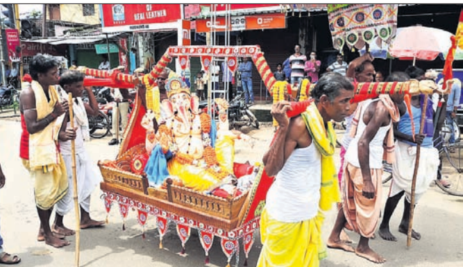
ଶୋଭାଯାତ୍ରାରେ ଗଜାନନ ।