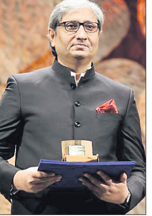
ମାନ୍ଦିଲା, ୯/୯

ଏନ୍‌ଡିଏଲି ଇଣ୍ଡିଆର ବରିଷ୍ଠ କାର୍ଯ୍ୟ ନିର୍ବାହୀ ସମ୍ପାଦକ ତଥା ବରିଷ୍ଠ ସାଧାରିକ ରବୀଶ କୁମାର (୪୪)ଙ୍କୁ ସୋମବାର ପିଲିପାଇକ୍‌ସ୍‌ର ରାଜଧାନୀ ମାନ୍ଦିଲାରେ ୨୦୧୯ର ସମ୍ମାନଜନକ ରାମୋନ୍ ମାର୍ଗସେସେ ପୁରସ୍କାର ପ୍ରଦାନ କରାଯାଇଛି। ଭାରତର ଜଣେ ସୁଦକ୍ଷ ଚିତ୍ରି ସାଧାରିକ ଭାବେ ସେ ବେଶ୍‌ ଜଣାଶୁଣା। ବିହାରର ଇନ୍ଦ୍ରପୁରୀର ଗ୍ରାମରେ ଜନ୍ମଗ୍ରହଣ କରିଥିବା ରବୀଶ କୁମାର ୧୯୯୨ରେ ଏନ୍‌ଡିଏଲିରେ ପ୍ରଥମେ ରିପୋର୍ଟର ଭାବେ ଯୋଗ ଦେଇଥିଲେ।