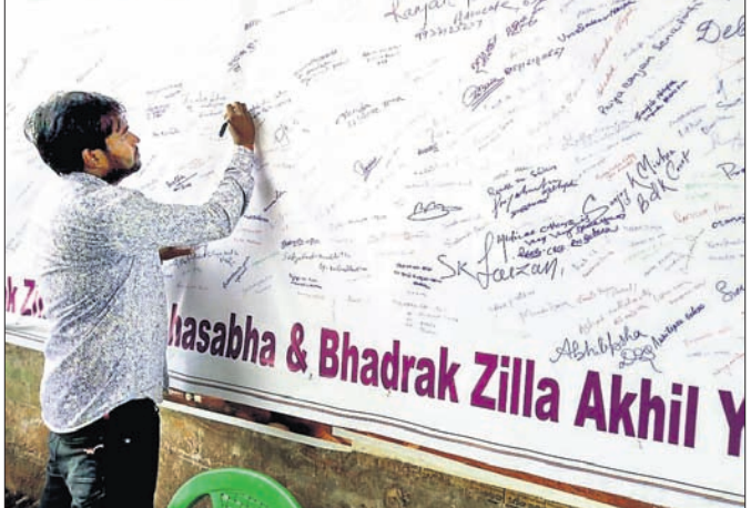
ଜଣେ ସମର୍ଥକ ଦସ୍ତଖତ କରୁଛନ୍ତି।

ଯୁବକ ଅଭିଯାନର ନେତୃତ୍ଵ ନେଇଛନ୍ତି ଅଧ୍ୟକ୍ଷ ୧୫ ତାରିଖରେ ରାଜ୍ୟର ଛକ, ୧୮ରେ ଚରମ୍ପା ରେଲୱେ ଷ୍ଟେଶନ ଏବଂ ୨୧ ତାରିଖରେ ଆରଡ଼ି ଛକଠାରେ ଦସ୍ତଖତ ଅଭିଯାନ କାର୍ଯ୍ୟକ୍ରମ କରାଯିବ ବୋଲି ସୂଚନା ଦିଆଯାଇଛି।