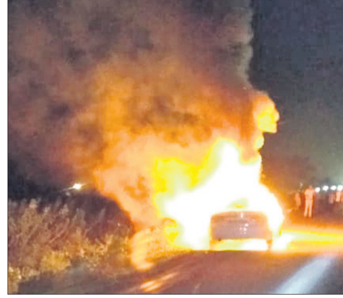
ଭଞ୍ଜାରିପୋଷରା ପୁରିପଡ଼ା ନିକଟ ରାସ୍ତାରେ ଜଳୁଥିବା କାର୍।