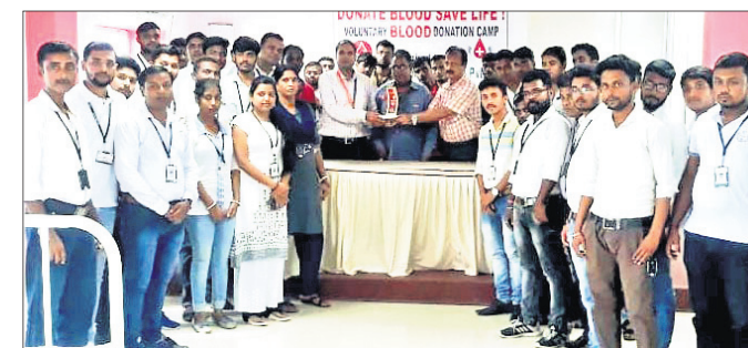
ଶିବିରରେ ଉପସ୍ଥିତ ପରିଚାଳନା କମିଟି ଓ ରକ୍ତଦାତା।

ବାଲେଶ୍ୱର ଜିଲା ସୋର ଥାନା ମାଣିପୁର ଗୁଲୁଆ ଗ୍ରାମରେ ଗୁରୁବାର ଏକ ନାଟକୀୟ ଘଟଣା ଘଟିଛି। ଫେସ୍‌ବୁକ୍ ପ୍ରେମ ସମ୍ପର୍କ ଘାପନ କରିଥିବା ଜଣେ ଯୁବକ ପ୍ରେମିକାଙ୍କୁ ଭେଟିବାକୁ ଆସିଥିବା ବେଳେ ଗ୍ରାମବାସୀଙ୍କ ଦ୍ୱାରା ଧରାପଡ଼ି ହଟହଟା ହୋଇଛନ୍ତି। ଶେଷରେ ଉଭୟଙ୍କୁ ରାତାରାତି ଗ୍ରାମବାସୀ ବିବାହ କରାଇଛନ୍ତି। ଏହି ଗ୍ରାମର ଜଣେ ଯୁବତୀଙ୍କ ସହ ବାହୁଡ଼ାଟଣା ଗ୍ରାମର ଜଣେ ଯୁବକଙ୍କ ଫେସ୍‌ବୁକ୍ ପ୍ରେମ ସମ୍ପର୍କ ଗଢି ଉଠିଥିଲା। ଗୁରୁବାର ରାତିରେ ପ୍ରେମିକାଙ୍କ ଘରେ କେହି ନ ଥିବା ବେଳେ ପ୍ରେମିକ ତାଙ୍କ ଘରକୁ ଆସିଥିଲେ। ଏହା ଜାଣି ପାରି ଗ୍ରାମବାସୀ ଉଚ୍ଚ ଯୁବକଙ୍କ ଅଟକ ରଖିଥିଲେ। ଏହାପରେ ଲୋକେ ଯୁବତୀଙ୍କ ମା'ଙ୍କୁ ଖବର ଦେଇଥିଲେ। ଯୁବତୀଙ୍କ ମା' ଘରେ ପହଞ୍ଚି ଘଟଣା ସମ୍ପର୍କରେ ଜାଣିଥିଲେ। ଏନେଇ ଗ୍ରାମବାସୀଙ୍କ ସହ ଆଲୋଚନା କରାଯାଇ ତୁରନ୍ତ ବିବାହ ସାମଗ୍ରୀ ଯୋଗାଡ଼ କରାଯାଇଥିଲା। ବିକଳିତ ରାତିରେ ବୈଦିକ ରୀତିରେ ଉଭୟଙ୍କୁ ବିବାହ ବନ୍ଧନରେ ଆବଦ୍ଧ କରାଯାଇଥିଲା। ବାହାଘର ପରେ ବରକନ୍ୟା ବରଘରକୁ ଫେରିଥିଲେ।