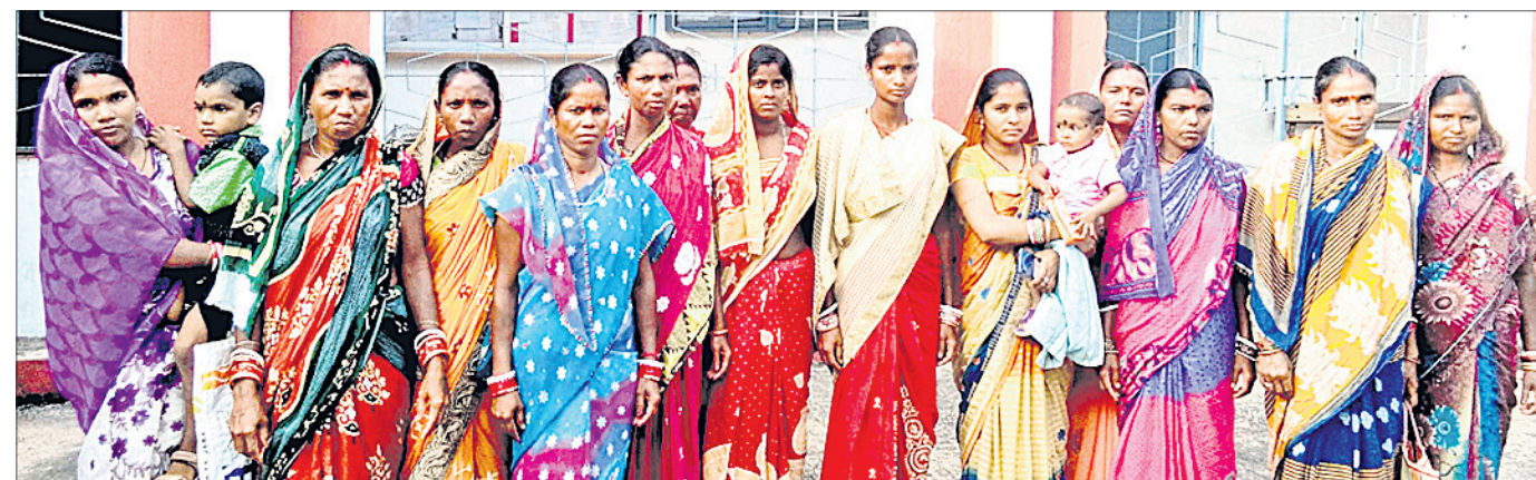
ଉପଜିଲାପାଳଙ୍କୁ ଭେଟିବାକୁ ଆସିଥିବା ବାବନ୍ଧ ଗ୍ରାମର ମହିଳାମାନେ।