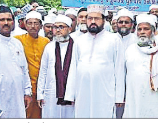
ପ୍ରତିବାଦ ଶୋଭାଯାତ୍ରାରେ ସାମିଲ ମୁସଲିମ କମିଟି କର୍ମଚାରୀ।

ଧାମନଗର, ୧୩୯ (ଡି.ଏନ.ଏ.): ଉତ୍ତରପ୍ରଦେଶର ଲକ୍ଷ୍ନୌରେ 'ଆୟୋଶା' ନାମରେ ଏକ ଚଳଚ୍ଚିତ୍ର ନିର୍ମାଣକୁ ବିରୋଧ କରି ଧାମନଗର ମୁସଲିମ କମିଟି ପ୍ରଫେଟ ମହମ୍ମଦଙ୍କ ଧର୍ମପତ୍ନୀ ହଜରତ ବିବି ଆୟୋଶା ସିଦିକା ନାମରେ ଏହି ଚଳଚ୍ଚିତ୍ର ହେଉଥିବା ବେଳେ ୩୬ ସେକେଣ୍ଡର ଏକ ଟ୍ରେଲର ରିଲିଜ୍ ହୋଇଛି। ଏଥିରେ ଆୟୋଶା ସିଦିକା ଚରିତ୍ରକୁ ସଂହାର କରାଯାଇଥିବା ଦୃଶ୍ୟ ଚଳଚ୍ଚିତ୍ରରେ ଦାହାରିବା ପରେ ସହାୟ ଡାକ୍ତା ବିରୋଧ କରାଯାଇଛି। ଏହି ଚଳଚ୍ଚିତ୍ରରେ ମୁସଲିମ ଧର୍ମକୁ ଅପମାନିତ କରାଯାଇଛି ବୋଲି ଅଭିଯୋଗ ହୋଇଛି। ଶୁକ୍ରବାର ମତାମତ