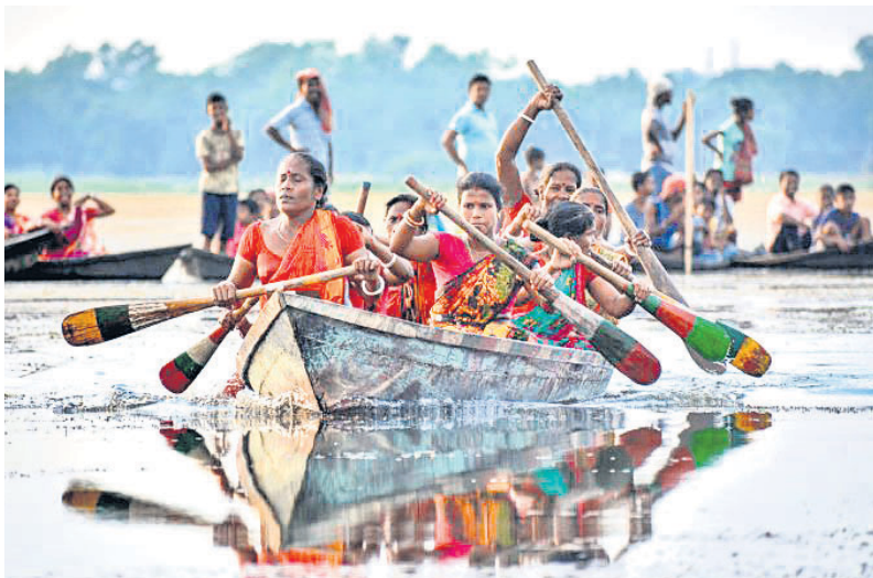
ତ୍ରିପୁରାର ମେଲାଇନ୍‌ରେ ପାରମ୍ପରିକ ବାର୍ଷିକ ନୌକା ପ୍ରତିଯୋଗିତାରେ ରୁଦ୍ର ସାଗର ହ୍ରଦରେ ବୋଟ୍ ଚଳାଇଛନ୍ତି ମହିଳା ନାବିକ।