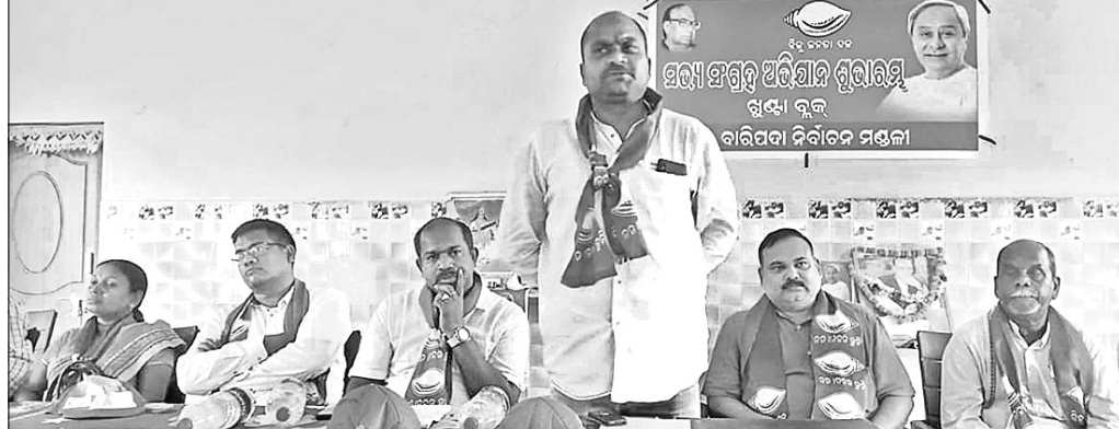
କାର୍ଯ୍ୟକ୍ରମରେ ଉପସ୍ଥିତ ବିଜେଡି ନେତୃବୃନ୍ଦ।

କାର୍ଯ୍ୟକ୍ରମରେ ଉପସ୍ଥିତ ବିଜେଡି ନେତୃବୃନ୍ଦ। ବାରିପଦା ଅଫିସ୍, ୧୫୮।