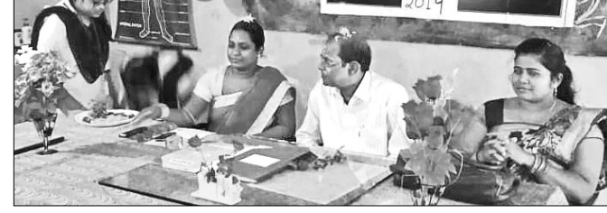
ଉତ୍ସବରେ ଉପସ୍ଥିତ ଅତିଥିମାନେ।

କର୍ମୀମାନେ କର୍ମୀଙ୍କୁ ଗୁରୁତ୍ୱ ଦିଆ ନ ଯିବା ଏବଂ ନିର୍ବାଚନ ବେଳେ ବିଭିନ୍ନ ପ୍ରତିଷ୍ଠିତ ଦେଖିଥିବା ନେତାଙ୍କ ଦେଖା ନ ମିଳିବା ଘଟଣା ନେଇ ବିଜେଡିର କର୍ମୀମାନେ ଅସନ୍ତୋଷ ବ୍ୟକ୍ତ କରୁଛନ୍ତି। ବାରିପଦା ନିର୍ବାଚନ ମଣ୍ଡଳୀ ଅଧୀନ ଖୁର୍ଦ୍ଧା ବ୍ଲକର ଭୋକାଗଡ଼ିଆଠାରେ ଅନୁଷ୍ଠିତ ହୋଇଥିବା ସଭ୍ୟ ସଂଗ୍ରହ କାର୍ଯ୍ୟକ୍ରମରେ କର୍ମୀମାନେ ଏଭଳି ଅଭିଯୋଗ କରି ହୋଇଛନ୍ତି।