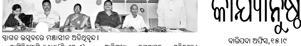
ସ୍ୱାଗତ ଉତ୍ସବରେ ମହାସାଧନ ଅତିଥିବୃନ୍ଦ।

ବାଲିଗିପୋଷି ଲକ୍ଷ୍ମୀକାନ୍ତ ମହାବିଦ୍ୟାଳୟର ସଂସ୍କୃତ ସମ୍ମାନ ବିଭାଗର ପ୍ରଥମ ବର୍ଷ ଛାତ୍ରାଛାତ୍ରୀଙ୍କୁ ଉଦ୍ଦେଶ୍ୟରେ ଏକ ସ୍ୱାଗତ ଉତ୍ସବ ସଭାପତି ତଥା ବିଭାଗୀୟ ପୁସ୍ତକ ପରଖରତ୍ନ ଦାଶଙ୍କ ଦ୍ୱାରା ଆୟୋଜିତ ହୋଇଯାଇଛି। ଏଥିରେ ପୁରାତନ ତଥା ନବୀନ ଛାତ୍ରାଛାତ୍ରୀମାନେ ନିଜେ ନିଜେ ଅଭିଭାଷଣ ରଚନା କରିଥିଲେ।