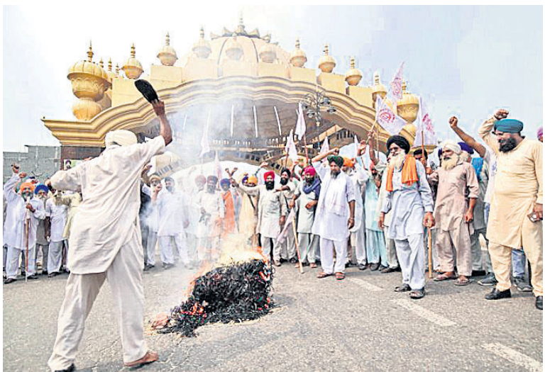
ଆଞ୍ଚଳିକ ବିପ୍ଳବ ଅର୍ଥନୈତିକ ସହଯୋଗିତା (ଆର୍ସିସିଏସି) ବୁଦ୍ଧିରେ ସାମିଲ ପାଇଁ କେନ୍ଦ୍ର ସରକାରଙ୍କ ନିଷ୍ପତ୍ତିକୁ ବିରୋଧ କରି ଅନୁତସରରେ କୃଷକମାନେ ଅନୁତସର-ଦିଲ୍ଲୀ ଜାତୀୟ ରାଜପଥ ଅବରୋଧ କରିଛନ୍ତି।