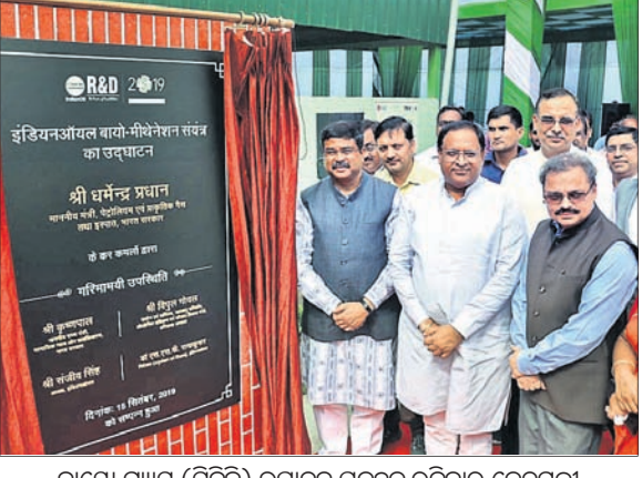
ବାୟୋ ଗ୍ୟାସ୍ (ସିବିଜି) ଉତ୍ସାଦନ ପ୍ରକଳ୍ପକୁ ରବିବାର କେନ୍ଦ୍ରମନ୍ତ୍ରୀ ଧର୍ମେନ୍ଦ୍ର ପ୍ରଧାନ ଶୁଭାରମ୍ଭ କରୁଛନ୍ତି।

ଛାତ୍ରାଭିଭୂତକ ପାଇଁ ମଧ୍ୟାହ୍ନ ଭୋଜନ ପ୍ରସ୍ତୁତ କରାଯାଉଛି। ଏହି ପ୍ରକଳ୍ପର ଶୁଭାରମ୍ଭ ପରେ ଧର୍ମେନ୍ଦ୍ର କହିଛନ୍ତି, ପ୍ରଧାନମନ୍ତ୍ରୀ ନରେନ୍ଦ୍ର ମୋଦିଙ୍କ ଦ୍ଵାରା ବର୍ଦ୍ଧ୍ୟବସ୍ତୁକୁ ଉଚ୍ଚ ସମ୍ପତ୍ତିରେ ପରିଣତ କରିବା ପାଇଁ ଆତ୍ମାଭିଯୋଗ ଆହ୍ଵାନର ଏହା ସଫଳ କ୍ରୟାବୃତ୍ତ। ଫରିଦାବାଦ୍ଵିତ ଏହି ପ୍ରକଳ୍ପ ଦୈନିକ ୫ ଟନ୍ ଜୈବ ବର୍ଦ୍ଧ୍ୟବସ୍ତୁକୁ ସିବିଜିରେ ପରିଣତ କରିବ। ଏହାଦ୍ଵାରା ଫରିଦାବାଦ୍ଵର ଜୈବ ବର୍ଦ୍ଧ୍ୟ ପରିଚାଳନା ଓ ଉର୍ଜା ଆବଶ୍ୟକତାକୁ ପୂରଣ କରିବା ପାଇଁ ସହାୟକ ହେବ। ଫରିଦାବାଦ୍ଵ ଗସ୍ତ ଅବସରରେ ଏଠାରେ ଥିବା ଇଣ୍ଡିଆନ୍ ଅଧିକାର ଆର ଆଣ୍ଡ ଡି ପ୍ରତିଷ୍ଠାନକୁ ବୁଲି ଦେଖିଛନ୍ତି। ଏଠାରେ ବିକଳ୍ପ ଉର୍ଜା ପ୍ରସ୍ତୁତି ବିଶେଷ ଭାବରେ ୨ଟି ଓ ୩ଟି ଇଥାନଲ, ହାଇଡ୍ରୋଜେନ୍ ମିଶ୍ରିତ ସିଏନ୍ଜି, ହାଇଡ୍ରୋଜେନ୍ କାର୍ବୋନିଡିଆ ଭବିଷ୍ୟତର ନିରନ୍ତର ଅକ୍ଷୟ ଉର୍ଜା ପାଇଁ କାମରେ ଏହି ପ୍ରତିଷ୍ଠାନ ନିୟୋଜିତ। ଆଇଓସିଏଲ୍ ଦ୍ଵାରା ଉର୍ଜା ଗବେଷଣା କେନ୍ଦ୍ର ମାଧ୍ୟମରେ ନୂତନ ଉର୍ଜାର ବିକଳ୍ପ ସହାନରେ ଏକ ନୂତନ କେନ୍ଦ୍ର ପ୍ରତିଷ୍ଠା ସହ ମୁବ ବିଜ୍ଞାନିକମାନଙ୍କ ନିୟୋଜନକୁ ଆଗକୁ ବଢ଼ାଉଥିବାରୁ ଧର୍ମେନ୍ଦ୍ର ଆଇଓସିଏଲ୍ ଅଧିକାରୀଙ୍କୁ ଧନ୍ୟବାଦ ଜଣାଇଛନ୍ତି।