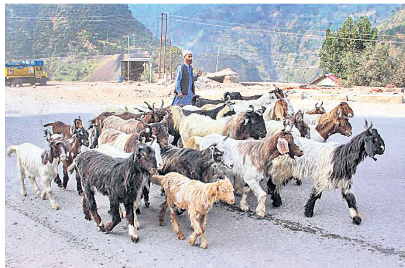
ରାମବନ୍ଦର କମ୍ପ୍ୟୁ-ଶ୍ରୀନଗର ରାଜପଥରେ ଗୁଜର ସମ୍ପ୍ରଦାୟର ଜଣେ ବ୍ୟକ୍ତି ଛେଳି ଚରାଉଛନ୍ତି।