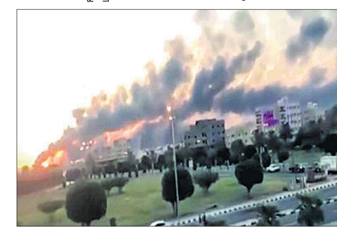
ସୌଦିଆରବର ଟେକ ପ୍ରକଳ୍ପ ଉପରେ ଶନିବାର ଟ୍ରୋନ୍ ଆକ୍ରମଣ ପରର ଦୃଶ୍ୟ।

କରୁଛନ୍ତି। ତାଙ୍କ ପାଇଁ ଖରାପ ସମୟ ଆରମ୍ଭ ହୋଇଯାଇଛି ବୋଲି ସେ ଭୁଲିଯାଉଥିବା ଏଥିରୁ ଜଣାପଡ଼ୁଛି। ମମତା ନିଜ ଭାଷା ଓ ବ୍ୟବହାରରେ ପରିବର୍ତ୍ତନ ଆଣନ୍ତୁ। ନ ହେଲେ ତେଲରେ ଥିବା କଂଗ୍ରେସ ନେତା ଚିନ୍ତାଧରମ୍ଭଙ୍କ ଭଳି ତାଙ୍କ ଅବସ୍ଥା ହେବ।