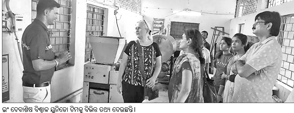
ଇଂ ଦେବାଶିଷ ବିଦ୍ୟାଳୟ ଯୁନିଟୋ ଟିମକୁ ବିଭିନ୍ନ ତଥ୍ୟ ଦେଖାଉଛି।

କର୍ମୀମାନେ କର୍ମୀଙ୍କୁ ଗୁରୁତ୍ୱ ଦିଆ ନ ଯିବା ଏବଂ ନିର୍ବାଚନ ବେଳେ ବିଭିନ୍ନ ପ୍ରତିଷ୍ଠିତ ଦେଖିଥିବା ନେତାଙ୍କ ଦେଖା ନ ମିଳିବା ଘଟଣା ନେଇ ବିଜେଡିର କର୍ମୀମାନେ ଅସନ୍ତୋଷ ବ୍ୟକ୍ତ କରୁଛନ୍ତି। ବାରିପଦା ନିର୍ବାଚନ ମଣ୍ଡଳୀ ଅଧୀନ ଖୁର୍ଦ୍ଧା ବ୍ଲକର ଭୋକାଗଡ଼ିଆଠାରେ ଅନୁଷ୍ଠିତ ହୋଇଥିବା ସଭ୍ୟ ସଂଗ୍ରହ କାର୍ଯ୍ୟକ୍ରମରେ କର୍ମୀମାନେ ଏଭଳି ଅଭିଯୋଗ କରି ହୋଇଛନ୍ତି।