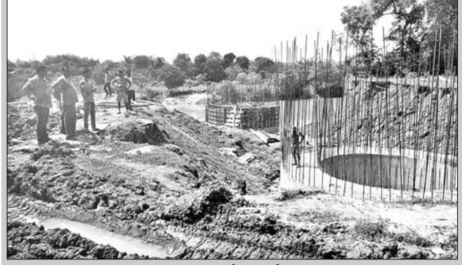
ବୁଢ଼ାବଳଙ୍ଗ ନଦୀରେ ବାଲିଥିବା ସେତୁର ନିର୍ମାଣ କାର୍ଯ୍ୟ।

ବୁଢ଼ାବଳଙ୍ଗ ନଦୀରେ ନିର୍ମାଣାଧୀନ ସେତୁରେ ନିର୍ମାଣକାରୀ କାର୍ଯ୍ୟକୁ ନେଇ ରବିବାର ଗ୍ରାମରେ ଅସନ୍ତୋଷ ପ୍ରକାଶ ପାଇଛି। କାରୁଅ ମିଶା ବାଲି, ଚିପ୍ପ ଓ ନଷ୍ଟ ହୋଇ ଯାଇଥିବା ସିମେଣ୍ଟରେ ଚାଲିଥିବା ଉଲ୍ଲେଖ କାର୍ଯ୍ୟକୁ ଅଞ୍ଚଳବାସୀ ବିରୋଧ କରିବା ସହ ନିର୍ମାଣ କାର୍ଯ୍ୟ ବନ୍ଦ କରିଛନ୍ତି। ଏଥିରେ ବିଭାଗୀୟ ଅଧିକାରୀଙ୍କୁ ଜଣାଇବା ପରେ ମଧ୍ୟ କୌଣସି ଅଧିକାରୀ ଘଟଣାସ୍ଥଳକୁ ଆସି ନ ଥିବାରୁ ଅସନ୍ତୋଷ ବଢ଼ିବାରେ ଲାଗିଛି।