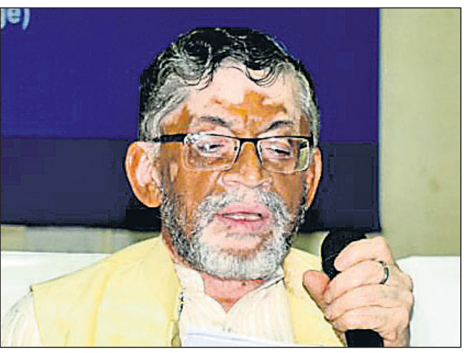
ଉତ୍ତରଭାରତ ଆସୁଛନ୍ତି, ସେମାନେ ଯୋଗ୍ୟତାର ଅଭାବ ଅନୁଭବ ପ୍ରାପ୍ତ। ଠାରେ ଆବଶ୍ୟକ କରୁଛନ୍ତି। ଦେଶରେ ଆର୍ଥିକ ମାନ୍ଦବ୍ୟା

ଲକ୍ଷ୍ନୌ, ୧୫।୯।(ପି.ଟି.) ଭାରତରେ ବେରୋଜଗାରୀ ହାର ୪ ଦଶନ୍ଧି ମଧ୍ୟରେ ସର୍ବାଧିକ ବୋଲି ସରକାରୀ ରିପୋର୍ଟ ପ୍ରକାଶ ପାଇଥିବାବେଳେ ଦେଶରେ ନିୟୁତ୍ତିର ଅଭାବ ନ ଥିବା କେନ୍ଦ୍ର ଶ୍ରମ ଓ ନିଯୋଜନ ମନ୍ତ୍ରୀ ସନ୍ତୋଷ ଗଙ୍ଗାଝାର କହିଛନ୍ତି। ପର୍ଯ୍ୟାପ୍ତ ନିୟୁତ୍ତି ସୁଯୋଗ ରହିଥିବାବେଳେ ଏଥିପାଇଁ ଉତ୍ତର ଭାରତୀୟଙ୍କ ଯୋଗ୍ୟତାର ଅଭାବ ଥିବା ସେ କହିବା ପରେ ଏହାକୁ ନେଇ ବିବାଦ ଦେଖାଦେଇଛି।