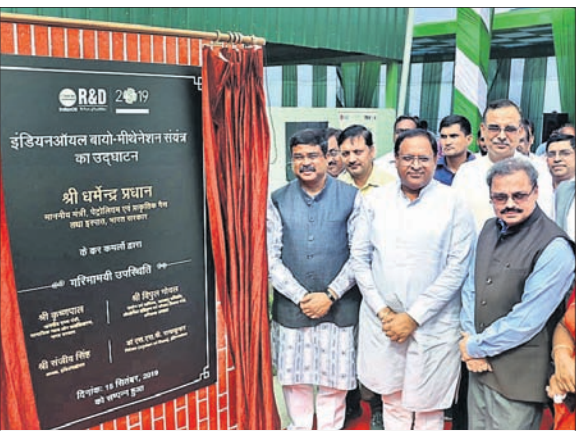
ବାୟୋ ଗ୍ୟାସ୍ (ସିବିଜି) ଉତ୍ସାହନ ପ୍ରକଳ୍ପକୁ ରବିବାର କେନ୍ଦ୍ରମନ୍ତ୍ରୀ ଧର୍ମେନ୍ଦ୍ର ପ୍ରଧାନ ଶୁଭାରମ୍ଭ କରୁଛନ୍ତି।