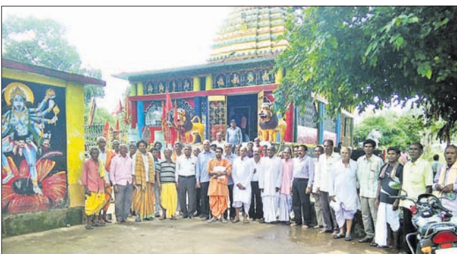
ଉପସ୍ଥିତ ମନ୍ଦିର ପରିଚାଳନା କମିଟି କର୍ମଚାରୀ ।

ଖଜୁରିପଡ଼ା ବୁକ ଅଧୀନ ବଲସୁମ୍ବୁରୀରେ ଥିବା ମା' ବରାକଦେବୀ ପୀଠ ପର୍ଯ୍ୟଟନସ୍ଥଳୀ ମନ୍ଦିର ପରିଚାଳନା କମିଟି ଦ୍ୱାରା ୧୦ ବର୍ଷ ପରେ ନୂତନ ଭାବେ ଗଠନ ହୋଇଥିଲା ।