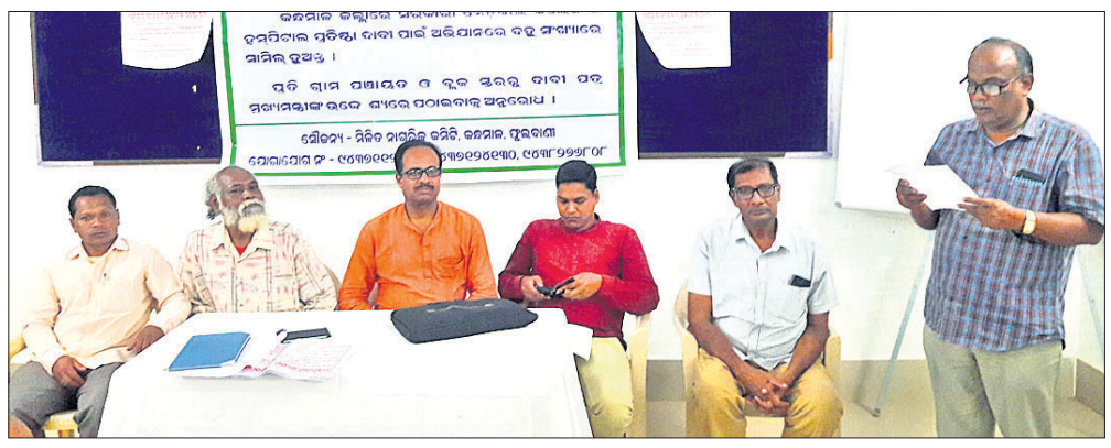
ବୈଠକରେ ଉପସ୍ଥିତ ମିଳିତ ନାଗରିକ କମିଟିର ସଦସ୍ୟ ଓ କର୍ମଚାରୀ ।

ବୈଠକରେ ଉପସ୍ଥିତ ମିଳିତ ନାଗରିକ କମିଟିର ସଦସ୍ୟ ଓ କର୍ମଚାରୀ । ବାରିଗବାଡ଼ି, ୧୫୮୯(ଡି.ଏନ.ଏ) ନ ଥିବାକୁ ଅଞ୍ଚଳବାସୀଙ୍କୁ ବ୍ରହ୍ମପୁର, କଟକ, ଭୁବନେଶ୍ୱର ଏବଂ ବୁର୍ଲା ମେଡିକାଲକୁ ଖର୍ଚ୍ଚାତ ହୋଇ ଯିବାକୁ ପଡୁଛି ।