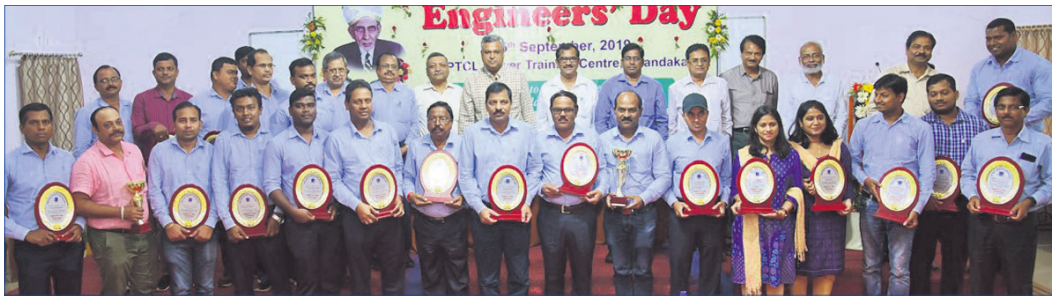
ଅତିଥିକ ଗହଣରେ ପୁରସ୍କୃତ ଇଞ୍ଜିନିୟରମାନେ।