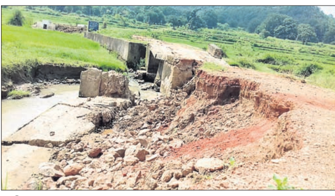
ଭାଙ୍ଗି ଯାଇଥିବା ପୋଲ ।

ଫିରିଙ୍ଗିଆ, ୧୫୮୯ ମରାମତି କରିବାକୁ ଦାବି ହେଉଛି । ଲଗାଣ ବର୍ଷରେ ମାଣ୍ଡିଆପଦର ରାସ୍ତା ଏକ ନାଲି ଉପରେ ଥିବା ଏହି ପୁରୁଣା ପୋଲ ଦବି ଯିବାକୁ ତାହାର ମଧ୍ୟଭାଗ ଏବଂ ପାର୍ଶ୍ୱ ଭାଙ୍ଗିଛି ।