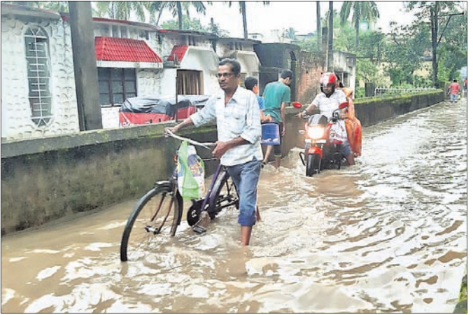
ବୈତରଣୀ କଲୋନୀ ରାସ୍ତା ପାଣିରେ ବୁଡ଼ିଛି।