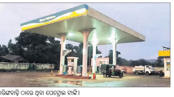
ବାରିଗବାଡ଼ି ଠାରେ ଥିବା ପେଟ୍ରୋଲ ଟାଙ୍କି ।