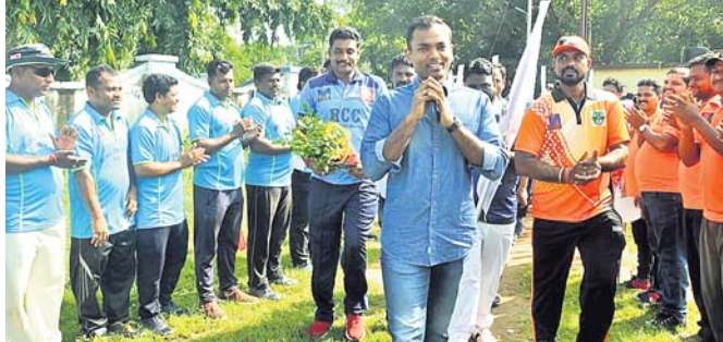
ଉଦ୍‌ଘାଟନା କାର୍ଯ୍ୟକ୍ରମରେ ଏସିଏକ୍ ସହ ଖେଳାଳିମାନେ ।