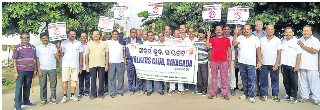
ଶୋଭାଯାତ୍ରାରେ ବାହାରିଥିବା ଓଡ଼ିଆ ଲୋକଙ୍କର ସହଯୋଗ ।

ରାୟଗଡ଼ା ଅଫିସ, ୧୫୯ (ଡି.ଏନ୍.ଏ.) ଓଡ଼ିଆ ଲୋକଙ୍କର ସହଯୋଗ ପାଇଁ ଶୋଭାଯାତ୍ରାରେ ବାହାରିଥିବା ଓଡ଼ିଆ ଲୋକଙ୍କର ସହଯୋଗ ।