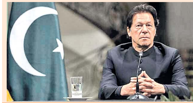
ଇମ୍ରାନ ଖାନ୍, ୧୫୫୯(ପି.ଟି.)

ଦୁଇଟି ଆଣବିକ ଅସ୍ତ୍ରସମ୍ପନ୍ନ ରାଷ୍ଟ୍ର ମୁକ୍ତ କଲେ ତାହାର ପରିଣାମ ଆଣବିକ ମୁକ୍ତ ହିଁ ହୋଇପାରେ। ଆତ୍ମସମର୍ପଣ ଓ ମୁକ୍ତ ମଧ୍ୟରୁ ଗୋଟିଏକୁ ବାଛିବାକୁ କୁହାଗଲେ ପାକିସ୍ତାନ ନିଜ ସ୍ୱାଧୀନତା ବଳାୟ ରଖିବା ପାଇଁ ଶେଷ ପର୍ଯ୍ୟନ୍ତ ମୁକ୍ତ କରିବାକୁ ପସନ୍ଦ କରିବ।