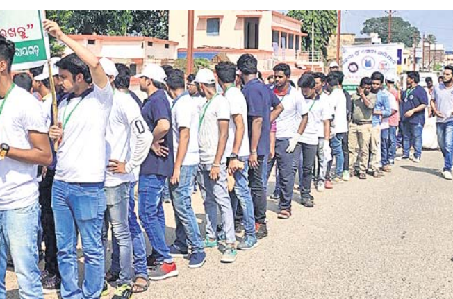
ସ୍ୱଚ୍ଛତା ନେଇ ବାହାରିଥିବା ଶୋଭାଯାତ୍ରା ।