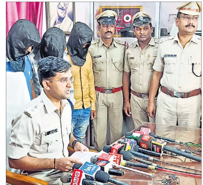
ଗିରଫ ବ୍ରାଉନସୁଗାର ବେପାରୀଙ୍କ ସମ୍ପର୍କରେ ଏସ୍‌ପି ସୂଚନା ଦେଇଛନ୍ତି।

୩୦ ଲକ୍ଷ ଟଙ୍କାର ବ୍ରାଉନସୁଗାର, ୯ ଲକ୍ଷ ୪୪ ହଜାର ୮୦ ଟଙ୍କା, ୨ ବାଇଲ୍ ଜବତ