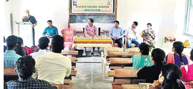
କାର୍ଯ୍ୟକ୍ରମରେ ମଞ୍ଚାସୀନ ଅତିଥି ।