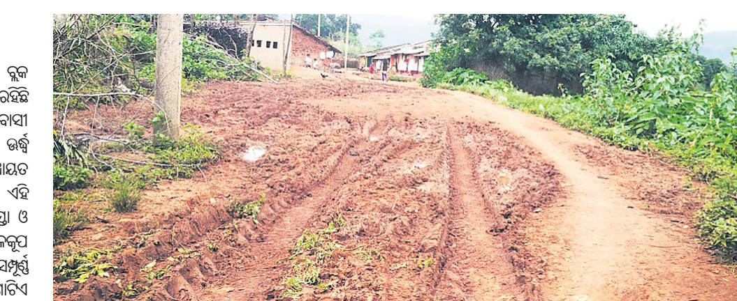
ଶୋଚନୀୟ ହୋଇ ପଡ଼ିଥିବା ରାସ୍ତା ।

ରାୟଗଡ଼ା ଜିଲ୍ଲା କାଶୀପୁର ବ୍ଲକ୍ ଗୁଡ଼ାବାସୀଙ୍କ ପକ୍ଷରୁ ଡେଙ୍ଗାଗୁଡ଼ା ଗ୍ରାମ । ଏହି ଗ୍ରାମ ଆଦିବାସୀ ବହୁଳ । ଏଠାରେ ପ୍ରାୟ ୪୦ରୁ ଉର୍ଦ୍ଧ୍ୱ ପରିବାର ବସବାସ କରନ୍ତି । ପଞ୍ଚାୟତ ସଦର ନିକଟରେ ରହିଥିବା ଏହି ଗ୍ରାମର ମୁଖ୍ୟ ସମସ୍ୟା ହେଲା ରାସ୍ତା ଓ ପାନୀୟଜଳ । ଏଠାରେ ଚୁକ୍ତି ନଳକୂପ ରହିଛି । ସେଥିମଧ୍ୟରୁ ଗୋଟିଏ ସମ୍ପୂର୍ଣ୍ଣ ଅଟକ ହୋଇପଡ଼ିଛି । ଯେଉଁ ଗୋଟିଏ ରହିଛି, ସେଥିରୁ ଦୂଷିତ ପାଣି ବାହାରୁଥିବାରୁ ଏହା ବ୍ୟବହାର ଉପଯୋଗୀ ହୋଇ ପାରୁନାହିଁ । ସେଥିରୁ ଟିକି ଟିକି ପୋକ ବାହାରୁଥିବା ଗ୍ରାମର ମହିଳାମାନେ କହିଛନ୍ତି । ଫଳରେ ଗ୍ରାମବାସୀ ପାଣି ପାଇଁ ଡେଇଁଛନ୍ତି । ସେହିପରି ଗାଁର ମୁଖ୍ୟ ରାସ୍ତା ଶୋଚନୀୟ ହୋଇପଡ଼ିଛି । ନିର୍ବାଚନ ବର୍ଷଦିନରେ ଏହି ରାସ୍ତା କାନ୍ଥୁଆ ହୋଇଯାଇ