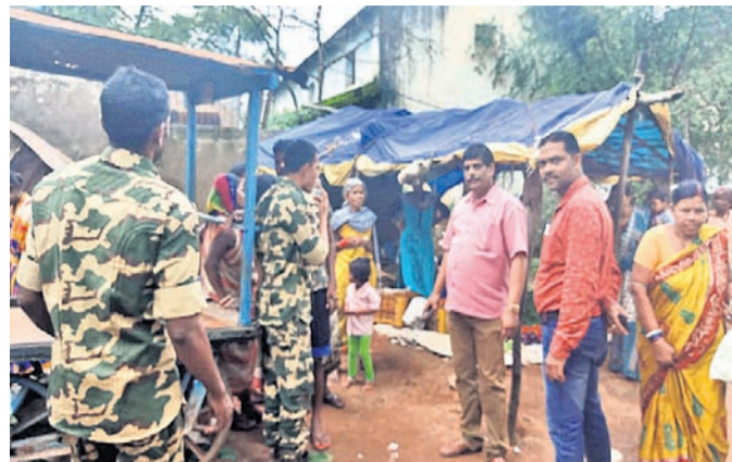
ଏକ ମାଂସ ଦୋକାନ ଉପରେ ଚଢ଼ାଉ କରାଯାଇଛି।

ନବରଙ୍ଗପୁର ଜିଲ୍ଲାପାଳଙ୍କ ନିର୍ଦ୍ଦେଶ କ୍ରମେ ପୌରାଞ୍ଚଳର ବିଭିନ୍ନ ସାହି ଗଳି ଓ ରାସ୍ତା କଡ଼ରେ ବିନା ଲାଇସେନ୍ସରେ ଖୋଲାଯାଇଥିବା ମାଂସ ଦୋକାନ ଉପରେ ରବିବାର ଚଢ଼ାଉ କରାଯାଇଛି। ୨୨ଟି ବେଆଇନ ଦୋକାନ ଚଢ଼େଇ କରାଯାଇ ସେଗୁଡ଼ିକୁ ବନ୍ଦ କରାଯାଇଛି। ଲାଇସେନ୍ସ ଆବେଦନ କରିବାକୁ ପ୍ରଶାସନ ପକ୍ଷରୁ ନିର୍ଦ୍ଦେଶ ଦିଆଯାଇଛି। ପ୍ରକାଶ ଯେ, ନବରଙ୍ଗପୁର ସହରରେ ବାହାର ରାଜ୍ୟରୁ କୁହୁଡ଼ା ଆଣିଯାଇ ସେମାନଙ୍କ ମାଂସ ବିକ୍ରି କରାଯାଉଛି।