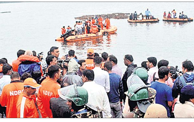
ଏନ୍ଡିଆରଏଫ୍ ଟିମ୍ ପକ୍ଷରୁ ଉଦ୍ଧାର କାର୍ଯ୍ୟ ଜାରି ରହିଛି।

ଅମରାବତୀ/ମାଲକାନଗିରି, ୧୫୫୯(ପି.ଟି./ଡି.ଏନ୍.ଏ.)