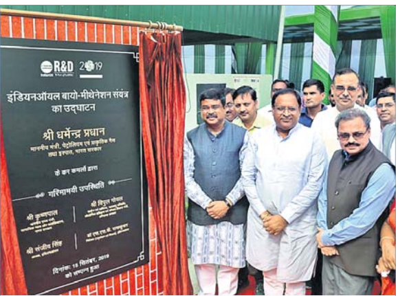
ବାୟୋ ଗ୍ୟାସ୍ (ସିବିଜି) ଉତ୍ପାଦନ ପ୍ରକଳ୍ପକୁ ରବିବାର କେନ୍ଦ୍ରମନ୍ତ୍ରୀ ଧର୍ମେନ୍ଦ୍ର ପ୍ରଧାନ ଶୁଭାରମ୍ଭ କରୁଛନ୍ତି । ଭୁବନେଶ୍ୱର, ୧୫/୯/୧୯(ବୁଧରୋ)

ଛାତ୍ରାଛାତ୍ରୀଙ୍କ ପାଇଁ ମଧ୍ୟାହ୍ନ ଭୋଜନ ପ୍ରସ୍ତୁତ କରାଯାଉଛି । ଏହି ପ୍ରକଳ୍ପର ଶୁଭାରମ୍ଭ ପରେ ଧର୍ମେନ୍ଦ୍ର କହିଛନ୍ତି, ପ୍ରଧାନମନ୍ତ୍ରୀ ନରେନ୍ଦ୍ର ମୋଦିଙ୍କ ଦ୍ୱାରା ବର୍ତ୍ତମାନ ଉତ୍ତମ ସମ୍ପର୍କରେ ପରିଣତ କରିବା ପାଇଁ ଆମେ ଆହ୍ୱାନ କରୁଛୁ । ଏହି ପ୍ରକଳ୍ପ ଦେଇ ୫ ଟନ ଡିଏଲ୍ ବର୍ତ୍ତମାନ ସିବିଜି ପରିଣତ କରିବ । ଏହାଦ୍ୱାରା ଫରିଦାବାଦ୍ ଜିଲ୍ଲା ବର୍ତ୍ତମାନ ପରିଚାଳନା ଓ ଉର୍ଜା ଆବଶ୍ୟକତାକୁ ପୂରଣ କରିବା ପାଇଁ ସହାୟକ ହେବ । ଫରିଦାବାଦ୍ ଗସ୍ତ ଅବସରରେ ଏଠାରେ ଥିବା ଇଞ୍ଜିଆର୍ ଅଧିକାରୀ