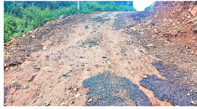
ରାସ୍ତାରୁ ପିଚୁ ଉଠିଯାଇଛି ।