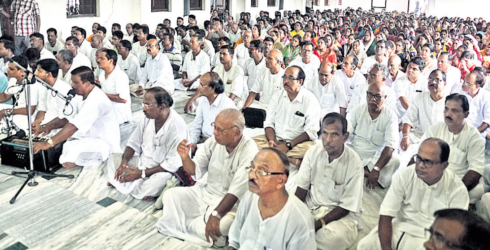
କଟକ ବନ୍ଧିବଜାରସ୍ଥିତ ସତ୍ସଂହ ବିହାରଠାରେ ସୋମବାର ଶ୍ରୀ ଶ୍ରୀ ଠାକୁର ଅନୁକୃତ ଚନ୍ଦ୍ରକ ଜନ୍ମ ମହୋତ୍ସବ ପାଳନ ଅବସରରେ ଅନୁଷ୍ଠିତ ସତ୍ସଂହ।