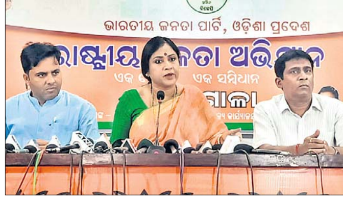
ରାଜ୍ୟ କାର୍ଯ୍ୟାଳୟ ଠାରେ ଅନୁଷ୍ଠିତ ଉଦ୍‌ଘାଟନୀ ସମ୍ମିଳନୀରେ ଭାଜପା ନେତୃମଣ୍ଡଳ।

ଏକ ସମ୍ମିଳନୀରେ ଭାଜପା ପକ୍ଷରୁ ଉଦ୍ୟମ ନେଇ ପଠିତା ଜଣକ ଠାକୁରାଣୀଙ୍କୁ ସହ ଅଭିଯୋଗ କରିବାକୁ ଆନୁରୋଧ କରାଯାଇଥିଲା। ଅଭିଯୋଗ ସେମାନଙ୍କୁ ମିଳି ମାମଲାରେ ଫୋନ୍ ମାଧ୍ୟମରେ କୋର୍ଟରେ ଗୋଟିଏ କୋର୍ଟିଭାଗ କରିଥିଲା। ସେହିଭଳି ଏହି ମାମଲାରେ ଠାକୁରାଣୀ ଓ ଶ୍ରୀମତୀ କୋର୍ଟେଜିରେ ଯାଇ ପାଇଥିଲେ ମଧ୍ୟ ସେମାନେ ପଳାନ୍ତ ନାନା ହଜିରା କରିଥିବା ସେମାନେ ପ୍ରକାଶ କରିଛନ୍ତି। ଏନେଇ ଏକସ୍ଥାଳୀକ ବେହେରା କହିଛନ୍ତି, ଠାକୁରାଣୀଙ୍କୁ ନାମରେ ଅଭିଯୋଗ ରହିଥିବାରୁ ଠାକୁରାଣୀଙ୍କୁ ସମ୍ମାନ ଦେବାକୁ ହେଲେ ବିଭାଗରୁ ସେ ତକଳ ପଡ଼ିଯାଇଥିଲା। ଆନୁରୋଧ ଅନୁଯାୟୀ ପହଞ୍ଚି ଠାକୁରାଣୀଙ୍କୁ ପରିବାର ସଦସ୍ୟ ଆକ୍ରମଣ କରିଥିଲା। ବିଭାଗରୁ ଉଦ୍ୟମ ଅଭିଯୋଗ ନେଇ ବିଭାଗରୁ ପହଞ୍ଚିଥିଲେ।