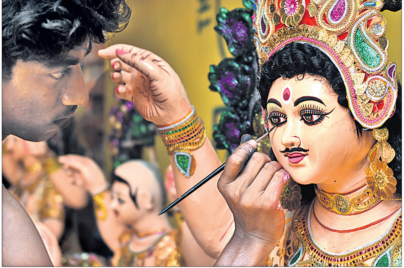
ଭୁବନେଶ୍ୱର ପଲ୍ଲୀଶାଳାରେ ଜଣେ ଶିଳ୍ପୀ ପ୍ରଭୁ ବିଶ୍ୱକର୍ମାଙ୍କ ମୁଣ୍ଡପ ମୂର୍ତ୍ତିରେ ଶେଷ ସ୍ପର୍ଶ ଦେଉଛନ୍ତି।

ଖୋର୍ଦ୍ଧା ଅଫିସ୍, ୧୬.୯(ବୁଧବେଳା): ରୁକ୍ ଅନ୍ତର୍ଗତ ରମ୍ଭାନାଥପୁର ଗ୍ରାମରେ ସୋମବାର ସାପ କାମୁଡ଼ାରେ ଜଣେ ଯୁବକଙ୍କ ମୃତ୍ୟୁ ହୋଇଛି। ସେ ହେଲେ ଏହି ଅଞ୍ଚଳର ସାପୁ(୨୯)। ସୁନ୍ଦରୀ ଅନୁଯାୟୀ, ଅଞ୍ଚଳ ଭାଗରେ କାମ କରୁଥିବାବେଳେ ତାଙ୍କୁ ସାପ କାମୁଡ଼ି ଦେଇଥିଲା। ପରିବାର ଲୋକେ ତାଙ୍କୁ ଗୁରୁତର ଅବସ୍ଥାରେ ଟାଣି ସ୍ୱାସ୍ଥ୍ୟକେନ୍ଦ୍ର ପରେ କ୍ୟାମ୍ପାଲ୍ ହସ୍ପିଟାଲକୁ ସ୍ଥାନାନ୍ତରିତ କରାଯାଇଥିଲା। ସେଠାରେ ଚିକିତ୍ସା ଚଳୁଥିବା ବେଳେ ସାପ କାମୁଡ଼ା ଯୋଗୁଁ ମୃତ୍ୟୁ ହୋଇଥିଲା। ମଙ୍ଗଳବାର ମୃତଦେହ ବ୍ୟବହାର କରାଯିବ ବୋଲି ପରିବାର ସ୍ମୃତକ୍ରମ କରାଯିବ।