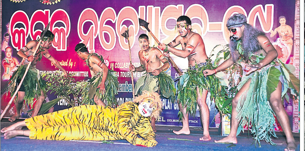
କଟକ ସନ୍ସାଇନ୍ ଗ୍ରାଉଣ୍ଡରେ ସାତସାହି କଟକ ନୃତ୍ୟୋତ୍ସବର ସୋମବାର ଚତୁର୍ଥ ସନ୍ଧ୍ୟାରେ ରେଭେନ୍ସା ଥିଏଟର ପକ୍ଷରୁ ପରିବେଷିତ ନାଟକ 'ହୁ ହା' ଏକ ଦୃଶ୍ୟ।

ଅନ୍ୟ ଅଫିସରଙ୍କ ସହିତ ଆଲୋଚନା କରିଥିଲେ। ଆସନ୍ତା ୨୫ ବୃତ୍ତୀ ଜାତୀୟ ରାଜପଥର ଲାଭଦୃଷ୍ଟିକ ଜଳିବ ବୋଲି ମୁଖ୍ୟଯନ୍ତ୍ରୀ କହିଥିଲେ। ସେହିପରି ଛକସ୍ଥିତ ଡାକବଙ୍ଗଳାରେ ସୋମବାର ଏମ୍ପି ମୁଖ୍ୟଯନ୍ତ୍ରୀ କହିଥିଲେ। ସେହିପରି ଛକସ୍ଥିତ ଡାକବଙ୍ଗଳାରେ ସୋମବାର ଏମ୍ପି ମୁଖ୍ୟଯନ୍ତ୍ରୀ କହିଥିଲେ।