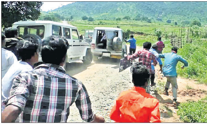
ଉଦ୍ଧୃତ ଲୋକେ ପୋଲିସ ଉପରେ ହେମାମୀତ କରୁଛନ୍ତି ।