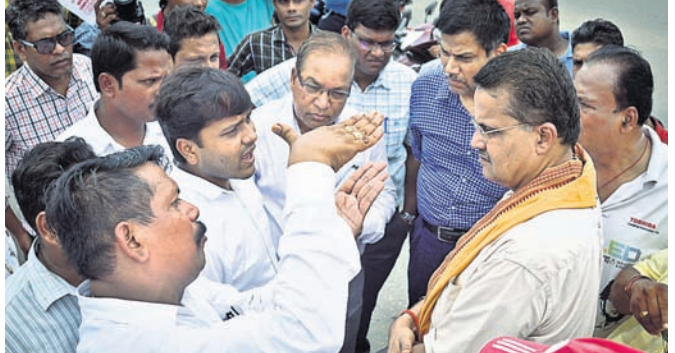
ରାସ୍ତାପାର୍ଶ୍ୱରେ ଉନ୍ନତୀକରଣ କାର୍ଯ୍ୟ ସମ୍ପର୍କରେ ରାଜପଥର ମୁଖ୍ୟଯନ୍ତ୍ରୀ ଓ ଅନ୍ୟ ଅଧିକାରୀଙ୍କ ସହ ଏମ୍ପି ଆଲୋଚନା କରୁଛନ୍ତି।