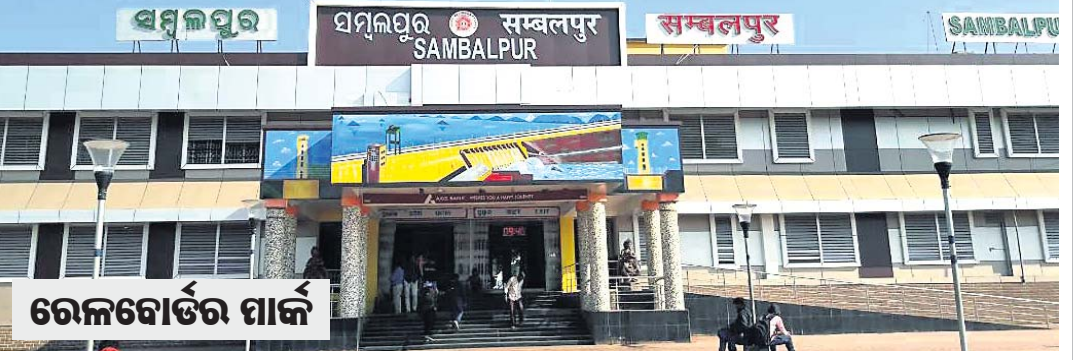
ଶୁଖିଲାଗଡ଼ କାର୍ଯ୍ୟ, ସମାପନପରେ, ସପ୍ତାହ ପୂର୍ଣ୍ଣ ଆଦି ୫ଟି ବିଭାଗ ନେଇ ମାକ୍ ଦିଆଯାଇଛି। ସମ୍ବଲପୁର ରେଳ ଡିଭିଜନ ଏପରିକି ମାସକୁ ଜୁନ ମାସ ପର୍ଯ୍ୟନ୍ତ ତୃତୀୟ ସ୍ଥାନରେ ରହିଥିଲା। ଜୁଲାଇ ମାସରେ ତାହା ଶ୍ରେଣୀ ଯାଇ ତୃତୀୟ ସ୍ଥାନକୁ ଚାଲିଯାଇଥିଲା। ହେଲେ ଅଗଷ୍ଟ ମାସରେ ପୁଣି ଉତ୍କଳ ସେବା ପୁରୁଣା ଆଦି ୫ଟି ବିଭାଗ ନେଇ ମାକ୍ ଦିଆଯାଇଛି। ସମ୍ବଲପୁର ରେଳ ଡିଭିଜନ ଏପରିକି ମାସକୁ ଜୁନ ମାସ ପର୍ଯ୍ୟନ୍ତ ତୃତୀୟ ସ୍ଥାନରେ ରହିଥିଲା। ଜୁଲାଇ ମାସରେ ତାହା ଶ୍ରେଣୀ ଯାଇ ତୃତୀୟ ସ୍ଥାନକୁ ଚାଲିଯାଇଥିଲା। ହେଲେ ଅଗଷ୍ଟ ମାସରେ ପୁଣି ଉତ୍କଳ ସେବା ପୁରୁଣା ଆଦି ୫ଟି ବିଭାଗ ନେଇ ମାକ୍ ଦିଆଯାଇଛି। ସମ୍ବଲପୁର ରେଳ ଡିଭିଜନ ଏପରିକି ମାସକୁ ଜୁନ ମାସ ପର୍ଯ୍ୟନ୍ତ ତୃତୀୟ ସ୍ଥାନରେ ରହିଥିଲା। ଜୁଲାଇ ମାସରେ ତାହା ଶ୍ରେଣୀ ଯାଇ ତୃତୀୟ ସ୍ଥାନକୁ ଚାଲିଯାଇଥିଲା।

ସମ୍ବଲପୁର, ୧୬.୯ (କ୍ୟୁରୋ) ରେଳ ବୋର୍ଡ୍ ୫ଟି ବିଭାଗ ଆଧାର କରି ବିଭିନ୍ନ ରେଳ ମଞ୍ଚକୁ ପାକ୍ ଦେଇଛି। ଏଥିରେ ସମ୍ବଲପୁର ରେଳମଞ୍ଚ ଦେଶରେ ପ୍ରଥମ ସ୍ଥାନ ଅଧିକାର କରିଛି। ବିଭିନ୍ନ ବିଭାଗ କାର୍ଯ୍ୟ ଦକ୍ଷତାକୁ ନେଇ ରେଳ ବୋର୍ଡ୍ ଏହି ଚୟନ କରିଛି। ଅଗଷ୍ଟ ମାସର ଡିସେମ୍ବର ଅନୁସାରେ ୮୦ ମାଇଲ୍ ୬୩.୦୨ ମାଇଲ୍ ରୁଁ ସମ୍ବଲପୁର ରେଳ ମଞ୍ଚକୁ ପ୍ରଥମ ସ୍ଥାନରେ ରହିବାକୁ ଯୋଗ୍ୟ ବିବେଚିତ ହୋଇଛି। ୨୩.୦୧ ମାଇଲ୍ ରୁଁ ଚଳାଚଳ ଡିଭିଜନ ଦ୍ୱିତୀୟ ସ୍ଥାନ ପାଇଥିବାବେଳେ ୨୨.୦୫ ମାଇଲ୍ ରୁଁ ରୁଞ୍ଜଲ ଡିଭିଜନ ତୃତୀୟ ସ୍ଥାନରେ ରହିଛି। ଦେଶରେ ୬୮ଟି ରେଳ ଡିଭିଜନ ରହିଛି। ସେଥିମଧ୍ୟରୁ ଯାତ୍ରାସେବା ଓ ସୁରକ୍ଷା, ରାଜସ୍ୱ ଆୟ, କର୍ମଚାରୀ ଓ ଅଧିକାରୀଙ୍କୁ