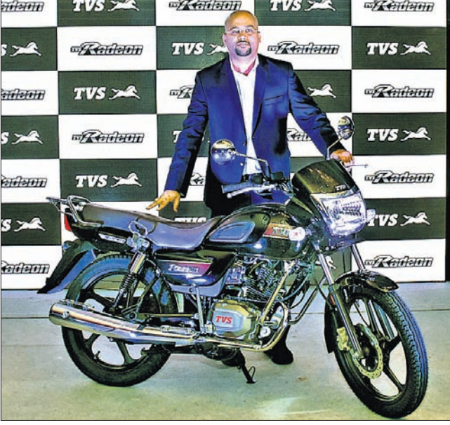
ଭୁବନେଶ୍ୱର, ୧୬-୯: ଏହାର ଲୋକପ୍ରିୟ ମତେଲ ରାତିଅନ୍‌ର ସ୍ୱତନ୍ତ୍ର ଏଡିଟିଗନ ବଜାରକୁ ଆସିଛି।

ଶୁଭାରମ୍ଭ ହୋଇଥିବା କମ୍ପାନୀ ପକ୍ଷରୁ ସୂଚନା ରହିଛି। ଏହା କ୍ରୋମ ରୁକ୍ ଏବଂ କ୍ରୋମ ବ୍ରାଉନ ରଙ୍ଗରେ ଉପଲବ୍ଧ।