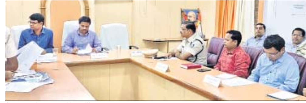
ଜିଲ୍ଲାପାଳ ଅଭିଯୋଗ ଶୁଣାଣି କରୁଛନ୍ତି।