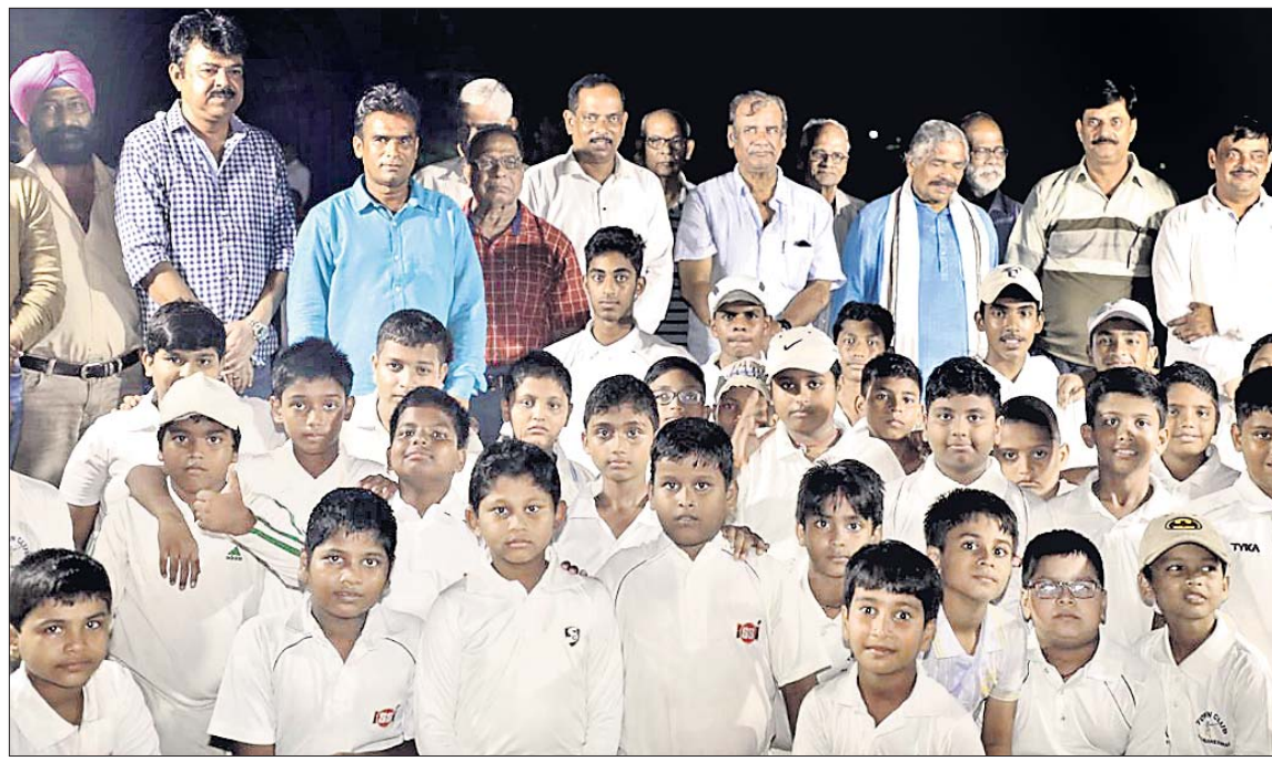
ପୁରୁଣା ଭୁବନେଶ୍ୱରସ୍ଥିତ ଟାଉନକୁକ୍ କ୍ରିକେଟ୍ ସ୍ଥିଲ ଡେଇଲପମେଣ୍ଟ କମ୍ପାନୀରେ ଅଂଶଗ୍ରହଣ କରିଥିବା କ୍ରିକେଟ୍ ପ୍ରତିଭାମାନେ ଅତିଥିକ ସହ।