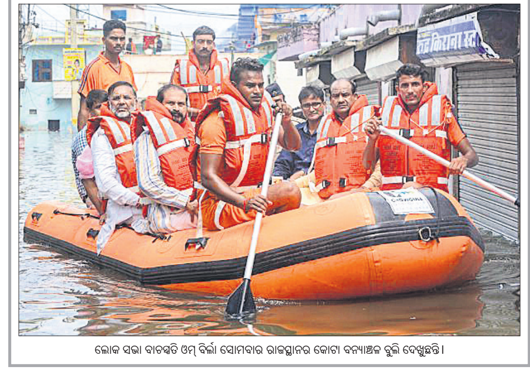
ଲୋକ ସଭା ବାଚସ୍ପତି ଓ ଏମ୍‌ଲିଆ ସୋମବାର ରାଜସ୍ଥାନର କୋଟା ବନ୍ୟାଞ୍ଚନ ବୁଲି ଦେଖୁଛନ୍ତି।