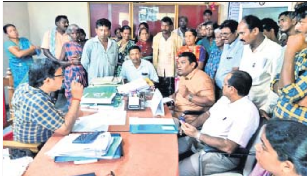
ବିତିଓକୁ ଅଭିଯୋଗ କରୁଛନ୍ତି ଗ୍ରାମବାସୀ।