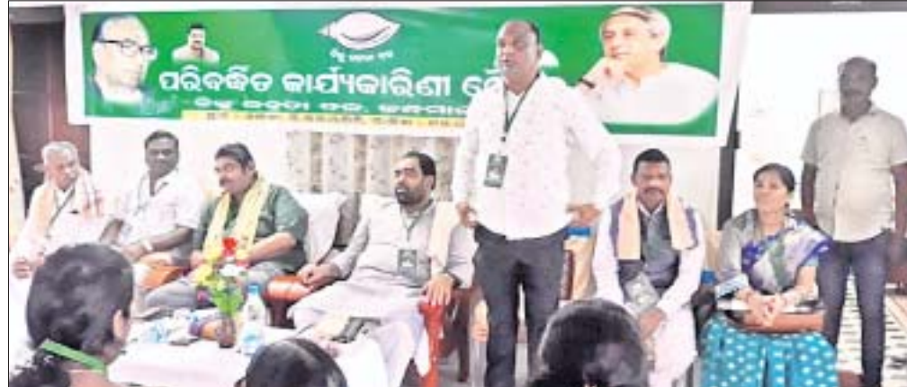
ବୈଠକରେ ଉପସ୍ଥିତ ମନ୍ତ୍ରୀ, ବିଧାୟକ ଓ ଅନ୍ୟମାନେ।