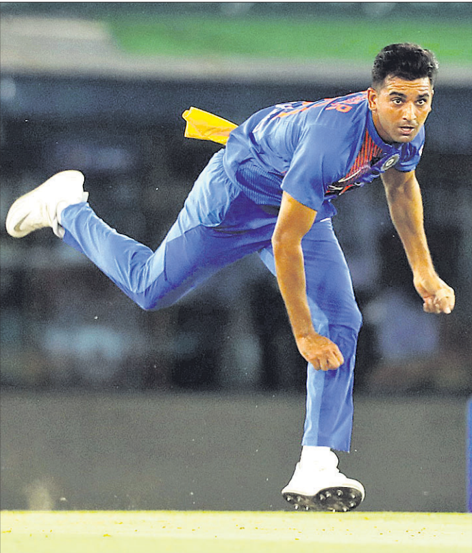
ବୋଲିଂ ଅବସରରେ ଦାପକ ଚହର । ଏକ ଆକର୍ଷଣୀୟ କ୍ୟାଚ୍ ନେଇଛନ୍ତି ବିରାଟ କୋହଲି ।

କ୍ୟାଚ୍ ବେଲ୍ ଆଉଟ ହୋଇଥିଲେ । ମିଲର ଗୋଟିଏ ହାତରେ ଏକ ଚମତ୍କାର କ୍ୟାଚ୍ ନେଇଥିଲେ । ବେପଲୁଆ ଖେଳ ପାଇଁ ବେଶ୍ ସମାଲୋଚିତ ହୋଇଥିବା ଯୁବ ଉଇକେଟକିପର ବ୍ୟାଟ୍ସମ୍ୟାନ ରିକ୍ସ ଭାଗେ ଭାରତ ୭ ଉଇକେଟରେ ଦକ୍ଷିଣ ଆଫ୍ରିକାକୁ ପରାସ୍ତ କରିଛି । ଭାରତ ୧-୦ରେ ଅଗ୍ରଣୀ ହାସଲ କରିଛି । ଚ୍ୟୁ କିଟି ଭାରତ ପାଇଁ କରିବାକୁ ନିଷ୍ଠୁରି ନେଇଥିଲେ । ପ୍ରଥମେ ବ୍ୟାଟିଂ କରି ଦକ୍ଷିଣ ଆଫ୍ରିକା ନିର୍ଦ୍ଧାରିତ ୨୦ ଓଭରରେ ୫ ଉଇକେଟ ହରାଇ ୧୪୯ ରନ କରିଥିଲା । କବାବରେ ଭାରତ ୧୯ ଓଭରରେ ୩ ଉଇକେଟ ହରାଇ ୧୫୧ ରନ ସଂଗ୍ରହ କରି ନେଇଥିଲା । ଅଧିନାୟକ ବିରାଟ କୋହଲି ୫୨ଟି ବଲର ସମ୍ମୁଖୀନ ହୋଇ ୪ ଟୋକା ଓ ୩ ଛକା ସହ ୭୨ ରନରେ ଅପରାଜିତ ରହି ବିଜୟରେ ପ୍ରମୁଖ ଭୂମିକା ଗ୍ରହଣ କରିବା ସହ ଯୁଗ୍ମରେ ଅର୍ଦ୍ଧ ଦି ମ୍ୟାଚ୍ ବିବେଚିତ ହୋଇଛନ୍ତି ।