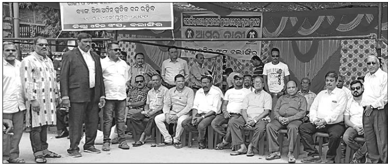
ଜିଲ୍ଲାପାଳ କାର୍ଯ୍ୟାଳୟ ସମ୍ମୁଖରେ ଅନୁଷ୍ଠିତ ଗଣଧାରଣା।

ବଲାଙ୍ଗୀର ଅଧିକାରୀ/ଚିଠିକାଗଡ଼, ୧୮୯ (ଡି.ଏନ୍.ଏ.)