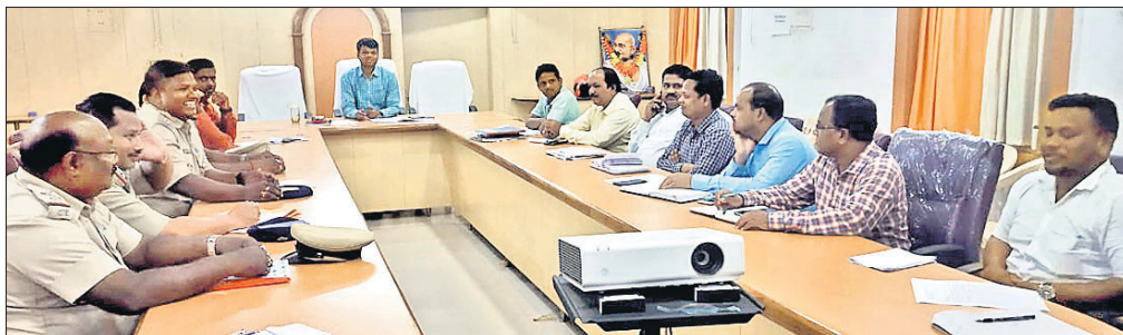
ବୈଠକରେ ଉପସ୍ଥିତ ଅଧିକାରୀ।

ଭଞ୍ଜନଗର ଉପଖଣ୍ଡରେ ଚୋରା ମଦ କାରବାର କମିବା ବଦଳରେ ଦିନକୁ ଦିନ ବୃଦ୍ଧି ପାଇବାରେ ଲାଗିଛି। ଭଞ୍ଜନଗର ସହରର କେତେକ ରାସ୍ତା ଉପରେ ଲୋକେ ଠିଆହୋଇ ମଦ ବିକ୍ରି କରୁଛନ୍ତି। ଯେଉଁ ରାସ୍ତା ଗୁଡ଼ିକରେ ଚୋରାମଦ ବିକ୍ରି ହେଉଛି ସମ୍ପୂର୍ଣ୍ଣ ରାସ୍ତାରେ ଲୋକେ ଯାତାୟାତ କରିବାକୁ ଉଚିତ ମଣ୍ଡନାହାନ୍ତି। ସହରର କିଛି ହୋଟେଲ ଓ ପାନ ଦୋକାନରେ ଖୋଲାଖୋଲି ଭାବେ ଚୋରା ବିଦେଶୀ ଓ ଦେଶୀ ମଦ କାରବାର ହେଉଛି। ଏଥିସହ ଗଞ୍ଜେଇକୁ ସିଗାରେଟ୍ରେ ଭର୍ତ୍ତି କରି ବିକ୍ରି କରାଯାଉଛି। ନିର୍ଦ୍ଦେଶ କିଛି ଔଷଧ ଦୋକାନରେ ମଧ୍ୟ ବେନିୟମ ଭାବେ ନକଲି ଔଷଧ ବିକ୍ରି ହେଉଛି। ଏହିଭଳି ବେନିୟମ କାର୍ଯ୍ୟ ଉପରେ ଏଣିକି କଡ଼ା ନଜର ରଖାଯିବ। ଏଥିସହ ମିଳିତ ଶୁଖିଲା କମିଟି ପକ୍ଷରୁ ଚଢ଼ାଉ ଜୋରଦାର କରାଯାଇ ଦୋଷୀ ବିଚାରରେ ଦୃଢ଼ କାର୍ଯ୍ୟାନୁଷ୍ଠାନ ନିଆଯିବ। ରୁଧିର ଅପରାହ୍ଣରେ ଭଞ୍ଜନଗର ଉପ ଜିଲ୍ଲାପାଳଙ୍କ କାର୍ଯ୍ୟକ୍ରମରେ ବେନିୟମ ବିନିତ ଶୁଖିଲା କମିଟି