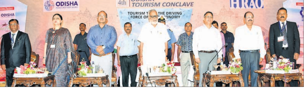
ଭୁବନେଶ୍ୱର, ୧୮/୯ (ବୁଧବୋ)