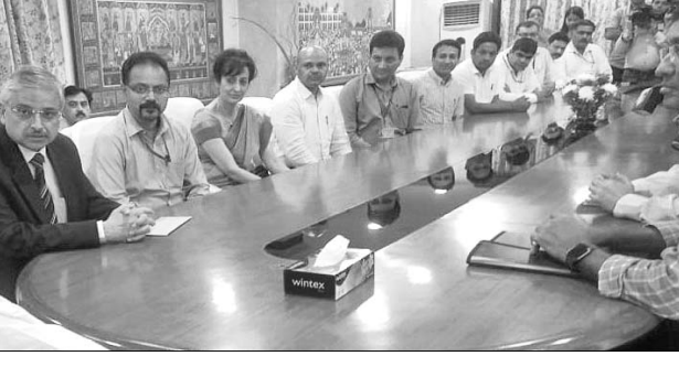
ଓଡ଼ିଶା ଭବନରେ ମୁଖ୍ୟମନ୍ତ୍ରୀ ନବୀନ ପଟ୍ଟନାୟକଙ୍କ ସମୀକ୍ଷା କରୁଛନ୍ତି।

ଭୁବନେଶ୍ୱର, ୧୮୯ (ବ୍ୟବସାୟ) ଯାଆନ୍ତେ ଜନତାଙ୍କ ପାଇଁ ରାଜ୍ୟ ସରକାର ଅନେକ କଲ୍ୟାଣକାରୀ ଯୋଜନା ପ୍ରଣୟନ କରିଛନ୍ତି। ଅଧିକାଂଶ ଯୋଜନାର ସହାୟତା ରାଶି ସିଧାସଳଖ ହିତାଧିକାରୀଙ୍କ ବ୍ୟାଙ୍କ ଆକାଉଣ୍ଟକୁ ଯାଉଛି।