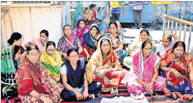
ପୁଣି ପାର୍ଶ୍ୱ ଗାଣ୍ଡୁଆ ଚଉରା ଛକରେ ଧାରଣାରେ ବସିଥିବା ମହିଳାମାନେ।