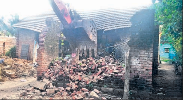
କେସିବି ସହାୟତାରେ ଘର ଭଙ୍ଗା ଯାଇଛି। କାମାକ୍ଷାନଗର, ୨୦୧୯ (ଡି.ଏନ.ଏ.)

ଦେଶାନ୍ତର ଜିଲ୍ଲା କାମାକ୍ଷାନଗର ଆନା ବଡ଼ପୁଆଁଳ ଗ୍ରାମ ନିକଟ ଦେଇ ଯାଇଥିବା ୫୩ନଂ. ଜାତୀୟ ରାଜପଥ ସମ୍ପ୍ରସାରଣବେଳେ ଶୁକ୍ରବାର ଅଭାବନାୟ ଘଟଣା ଘଟିଛି। କେସିବି ସହାୟତାରେ ଉଚ୍ଛେଦ କାର୍ଯ୍ୟ ଚାଲିଥିବାବେଳେ କାଢ ଭୁଞ୍ଜି ହୁଇ ପରିବାରର ୮ଜଣ ଆହତ ହୋଇଛନ୍ତି। ସେମାନଙ୍କ ମଧ୍ୟରୁ ୩ଜଣଙ୍କ ଅବସ୍ଥା ଗୁରୁତର ରହିଛି। ଦୁର୍ଘଟଣା ପରେ ଉତ୍ତମ ଲୋକେ ଲଙ୍କାକାଣ୍ଡ ପୋଡ଼ି ଦେଇଛନ୍ତି। ପରିସ୍ଥିତି ନିୟନ୍ତ୍ରଣ କରିବାକୁ ଘଟଣାସ୍ଥଳରେ ପହଞ୍ଚିଥିବା ପୋଲିସ ଗାଡ଼ିକୁ ମଧ୍ୟ ସେମାନେ