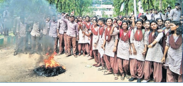
ଛାତ୍ରୀଛାତ୍ରୀମାନେ କଲେଜ ସମ୍ମୁଖରେ ଆନ୍ଦୋଳନ କରୁଛନ୍ତି।

ତାଳଚେର, ୨୦୧୯ (ନି.ପ୍ର.) ରି ଆଡମିଶନ ଫି ବୁଦ୍ଧି ପ୍ରତିବାଦରେ ଶୁକ୍ରବାର ତାଳଚେର ସ୍ୱୟଂଶାସିତ ମହାବିଦ୍ୟାଳୟରୁ ୨ ଛାତ୍ରୀଛାତ୍ରୀମାନେ ଆନ୍ଦୋଳନକୁ ଓହ୍ଲାଇଥିଲେ। ଫଳରେ ଦୀର୍ଘ ସମୟ ଧରି କଲେଜ ପରିସରରେ ଉତ୍ତେଜନା ପ୍ରକାଶ ପାଇଥିଲା। ଶନିବାର ରି ଆଡମିଶନ ଫି ୨୬ ଶହ ଟଙ୍କା ଥିଲା। ହେଲେ ଚଳିତବର୍ଷ କଲେଜ କର୍ତ୍ତୃପକ୍ଷ ଏଥିରେ ୧୩ ଶହ ଟଙ୍କା ବୁଦ୍ଧି କରିଛନ୍ତି, ଯାହାକୁ ନେଇ ଅଶାନ୍ତି ଦେଖା ଦେଇଥିଲା। ପୂର୍ବାହ୍ନରେ ଛାତ୍ରୀଛାତ୍ରୀମାନେ ଶ୍ରେଣୀ ବଜନ କରି