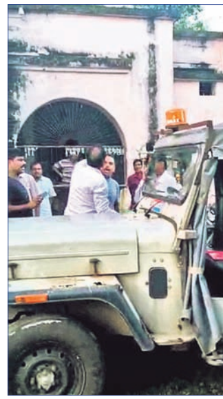
ଭାଇରାଲ୍ ହୋଇଥିବା ଭିଡ଼ିଓର ଦୃଶ୍ୟ ।

ନୟାଗଡ଼ ଜିଲ୍ଲା ଖଣ୍ଡପଡ଼ା କୋର୍ଟ ପରିସରରେ ରୁଜୁକାର ଜଣେ ଝରଦାତା ଓ ଜଣେ ଆଇନଜୀବୀଙ୍କ ମଧ୍ୟରେ ମୁହାଁମୁହିଁ ହୋଇଥିବା ଭିଡ଼ିଓ ଭାଇରାଲ୍ ହୋଇଛି । ଉକ୍ତ ଭିଡ଼ିଓରେ କୌଣସି ଏକ ଘଟଣାକୁ କେନ୍ଦ୍ର କରି ଆଇନଜୀବୀ ଓ ଝରଦାତାଙ୍କ ମଧ୍ୟରେ ଯୁକ୍ତିତର୍କ ହେଉଥିବା ଦେଖିବାକୁ ମିଳିଛି । ପରେ ସେମାନେ ଆକ୍ରମଣ ପ୍ରତିଆକ୍ରମଣ କରୁଥିବା ଦେଖାଯାଇଛି । ସେଠାରେ ଉପସ୍ଥିତ ଥିବା ଲୋକେ ଘଟଣାରେ ହସ୍ତକ୍ଷେପ କରିବାକୁ ଉତ୍ସାହ ଏଥିରୁ ନିବୃତ୍ତ ହୋଇଥିଲେ । ଏ ନେଇ ଖଣ୍ଡପଡ଼ା ଥାନାରେ ଉକ୍ତଘଟଣା ପସରୁ ଅଭିଯୋଗ କରାଯାଇଥିଲା । ଝରଦାତାଙ୍କ ଅଭିଯୋଗକ୍ରମେ ଥାନାରେ ୧୮୧/୧୯ରେ ମାମଲା ରୁଜୁ ହୋଇଥିବାବେଳେ ଆଇନଜୀବୀଙ୍କ ଅଭିଯୋଗକ୍ରମେ ୧୮୨/୧୯ରେ ମାମଲା ରୁଜୁ ହୋଇଛି । ସେହିପରି ସମ୍ପୃକ୍ତ ଝରଦାତାଙ୍କ ସ୍ତ୍ରୀ ଶୁକ୍ରବାର ଘଟଣାରେ ଆହତ ହୋଇଥିବା ଦେଖାଯାଇଛି ।