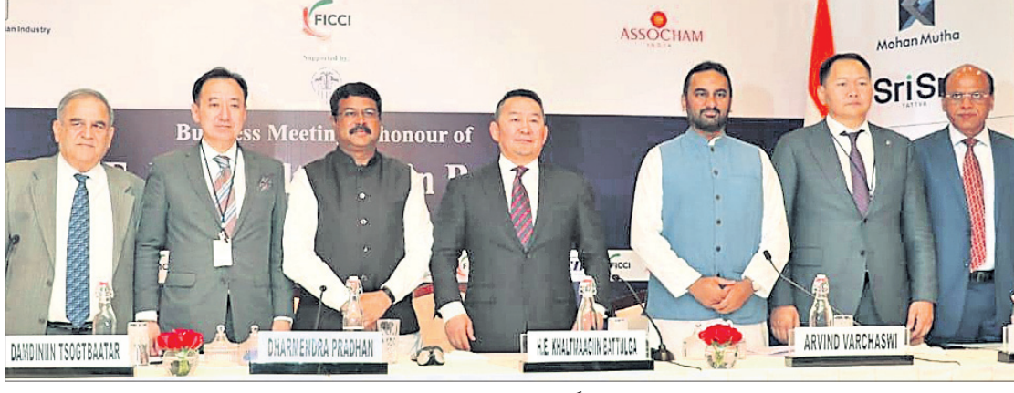
ମୁମ୍ବାଇରେ ଏପିଆଇସିଆଇ ପସରୁ ଆୟୋଜିତ ବୈଠକରେ କେନ୍ଦ୍ରମନ୍ତ୍ରୀ ଧର୍ମେନ୍ଦ୍ର ପ୍ରଧାନ ଓ ଅନ୍ୟମାନେ ।

ଭୁବନେଶ୍ୱର, ୨୦୧୯ (ବ୍ୟୁରୋ) ୨୦୧୮ରେ ପ୍ରଧାନମନ୍ତ୍ରୀ ନରେନ୍ଦ୍ର ମୋଦିଙ୍କ ମଙ୍ଗୋଲିଆ ଗସ୍ତ ପରେ ଭାରତ ଓ ମଙ୍ଗୋଲିଆ ମଧ୍ୟରେ ଦ୍ୱିପାକ୍ଷିକ ସମ୍ପର୍କ ଆହୁରି ମଜଭୁତ ହୋଇଛି । ଏହି ସମ୍ପର୍କ ଦୁଇ ଦେଶର ଅର୍ଥନୀତିକୁ ମଧ୍ୟ ଭବିଷ୍ୟତରେ ମଜଭୁତ କରିବ ବୋଲି ମୁମ୍ବାଇରେ ଏପିଆଇସିଆଇ ପସରୁ ଆୟୋଜିତ ବ୍ୟବସାୟିକ ବୈଠକରେ କେନ୍ଦ୍ରମନ୍ତ୍ରୀ ଧର୍ମେନ୍ଦ୍ର ପ୍ରଧାନ କହିଛନ୍ତି । ଉକ୍ତ ବୈଠକରେ ମଙ୍ଗୋଲିଆର ରାଷ୍ଟ୍ରପତି ଏ.ର ଖାଲ୍ମଗୁଜିୟା ବାଲୁଗ୍ସା ଉପସ୍ଥିତ ଥିଲେ ।