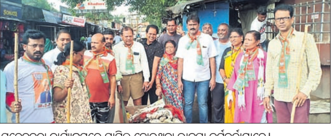
ସଚେତନତା କାର୍ଯ୍ୟକ୍ରମରେ ସାମିଲ ହୋଇଥିବା ଭାଜପା କର୍ମକର୍ମୀମାନେ।

ଅନୁଗୋଳ ଭାଜପା ପକ୍ଷରୁ ଶୁକ୍ରବାର ସ୍ୱଳ୍ପ ଭାରତ ଅଭିଯାନ କାର୍ଯ୍ୟକ୍ରମ ଅନୁଷ୍ଠିତ ହୋଇଯାଇଛି। ଏହି ଅବସରରେ ପୌରପାଳିକା କାର୍ଯ୍ୟାଳୟ ଠାରୁ ସ୍ଥାନୀୟ ବ୍ୟକ୍ଷେତ୍ର ପର୍ଯ୍ୟନ୍ତ ସଫେଇ କରାଯାଇଥିଲା। ଏଥିସହିତ 'ସ୍ୱଳ୍ପ ପରିବେଶ ସ୍ୱସ୍ଥ ପରିବେଶ' ବୋଲି ସହରବାସୀଙ୍କୁ ସଚେତନ କରାଯାଇଥିଲା। ସହରକୁ ଆବର୍ତ୍ତନା ମୁକ୍ତ ରଖିବା ସହ ପ୍ଲାଷ୍ଟିକ ଓ ପଲିଥିନ ବ୍ୟବହାରକୁ ସମ୍ପୂର୍ଣ୍ଣ ଭାବେ ବନ୍ଦ କରିବା ପାଇଁ ଭାଜପା କର୍ମୀମାନେ ଆହ୍ୱାନ ଦେଇଥିଲେ।