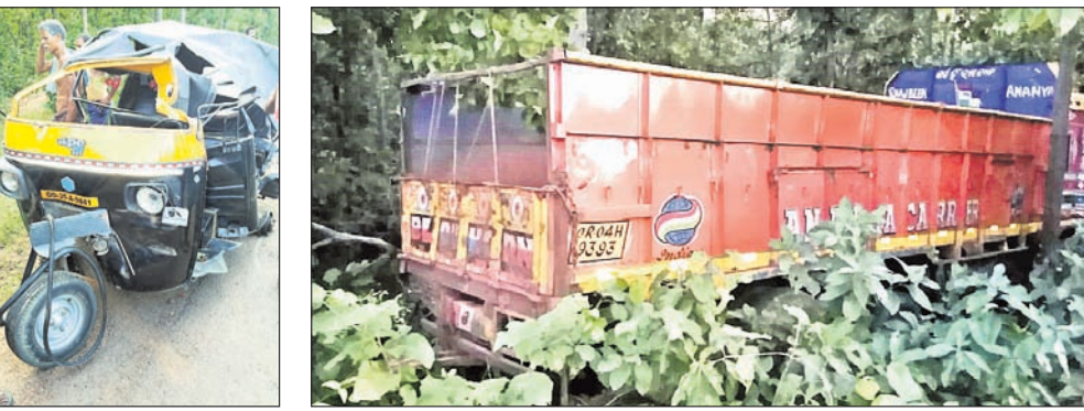
ଦୁର୍ଘଟଣାସ୍ଥଳ ଅଟେ ଏବଂ ଟ୍ରକ୍।

ଅନୁଗୋଳ ଜିଲ୍ଲା ୧୪୯ ନଂ ଜାତୀୟ ରାଜପଥର କଶିହା ବ୍ଲକ ସମଳ ଥାନା ରୁରୁକୁନା ପଞ୍ଚାୟତ ନାଇକାନାଳ ଛକଠାରେ ଶୁକ୍ରବାର ଅପରାହ୍ନରେ ଏକ ଟ୍ରକ୍ ଓ ଅଟୋ ମଧ୍ୟରେ ମୁହାଁମୁହିଁ ଧକ୍କା ହୋଇଛି। ଏଥିରେ ଅଟୋରେ ଥିବା ୨ ମହିଳାଙ୍କ ମୃତ୍ୟୁ ଘଟିଛି। ସେହିପରି ଅନ୍ୟ ଜଣେ ଗୁରୁତର ହୋଇଥିବାବେଳେ ଆଉ ୪ ଜଣ ଆହତ ହୋଇଛନ୍ତି। ମୃତ