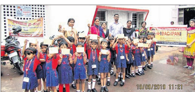
ଡାକଘର ପରିଦର୍ଶନରେ ଆସିଥିବା ବଚପନ ଛାତ୍ରାଛାତ୍ରୀମାନେ।

ଅନୁଗୋଳ ମିଶ୍ରପଡ଼ା ସ୍ଥିତ ବଚପନ ଘୃେ ଷ୍ଟୁଲର ଛାତ୍ରାଛାତ୍ରୀମାନେ ଅନୁଗୋଳ ମୁଖ୍ୟ ଡାକଘର ପରିଦର୍ଶନ କରିଥିଲେ। ଜୁନି ଜୁନି ପିଲାମାନେ ସେମାନଙ୍କ ମା ଓ ବାପାଙ୍କ ପାଖକୁ ପୋଷ୍ଟ କାର୍ଡରେ ଦୁର୍ଗାପୂଜା ଅଭିନନ୍ଦନ ଜଣାଇ ଡାକବାକ୍ସରେ ପକାଇଥିଲେ। ଡାକଘର କର୍ମଚାରୀମାନେ ତାଙ୍କ ଘରେ ଚିଠି ଓ ଟଙ୍କା କିପରି ପ୍ରୋଗ କରାଯାଏ ସେ ସମ୍ବନ୍ଧରେ ଜୁନି ଜୁନି ପିଲାମାନଙ୍କୁ ଅବଗତ କରାଇଥିଲେ। ଏହି କାର୍ଯ୍ୟକ୍ରମରେ ମୁଖ୍ୟ ଡାକଘର