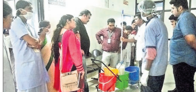
ମେଡିକାଲ ପରିଦର୍ଶନ କରୁଛନ୍ତି କାୟାକଳ୍ପ ଟିମ୍ ସଦସ୍ୟ।