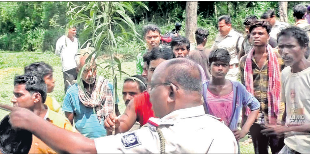
ଲୋକେ ପ୍ରକଳ୍ପ ନିର୍ମାଣସ୍ଥଳରେ ପ୍ରତିବାଦ କରୁଛନ୍ତି।

ଭଦ୍ରକ ଜିଲ୍ଲା ଚାନ୍ଦବାଲି ଏନ୍.ଏସ୍.ଏ. ଅନ୍ତର୍ଗତ ନୟାହାଟ ଗାଁରେ ଗ୍ରାମ୍ୟ ପାନୀୟଜଳ ଯୋଗାଣ ବିଭାଗର ପ୍ରସ୍ତାବିତ ମେଟା ପାନୀୟ ଜଳ ପ୍ରକଳ୍ପ ନିର୍ମାଣ ପାଇଁ ଗ୍ଲାନ ନିରୁପଣକୁ ନେଇ ଗ୍ଲାନୀୟ ଲୋକେ ବିରୋଧ କରିଛନ୍ତି।