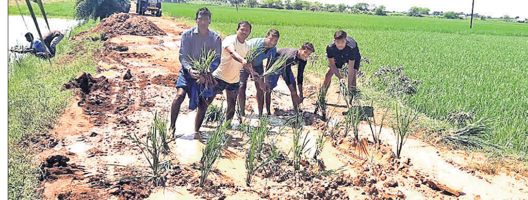
ବରକୋଣା ମୁଖ୍ୟ ରାସ୍ତାରେ କେତେକ ଗ୍ରାମବାସୀ ଧାନ ଚଳି ରୋଇଛନ୍ତି।

ଭଦ୍ରକ ଜିଲ୍ଲା ବନ୍ତ ବ୍ଲକ୍ ବସନ୍ତିଆ ପଞ୍ଚାୟତ ବରକୋଣା ମୁଖ୍ୟରାସ୍ତା ମରାମତି ଆବେଦନ ଶୋଭାଯାତ୍ରା ହୋଇପଡ଼ିଛି।