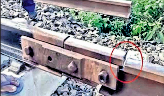
ରେଳ ଧାରଣାରେ ହୋଇଥିବା ଘଟଣା।

ପାଇବାରୁ ପରିବାର ଲୋକେ ଗୁଜ୍ରାବାର ସହାୟତା ଆଶା କର୍ମୀ ଓ ଆମ୍ବୁଲାଟୁକୁ ଡକାଇଥିଲେ। ଏ.କି.ମି. ଦୂର ପହଞ୍ଚିବା ପରେ ସ୍ଵାସ୍ଥ୍ୟକେନ୍ଦ୍ରକୁ ଆମ୍ବୁଲାଟୁ ଆସିଥିଲେ ମଧ୍ୟ ରାସ୍ତା ଖାଲଖାମାରେ ଭର୍ତ୍ତି ହୋଇଥିବାରୁ ଏହା ଗାଁ ମୁଖ୍ୟ ଧାସୀ ଆସି ନ ପାରି ଦେଉ ଜି.ମି. ଦୂରରେ ଅଟକି ରହିଥିଲା।