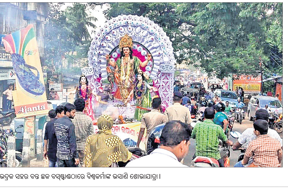
ଭଦ୍ରକ ସଦର ବଡ଼ ଛକ ବସଷ୍ଟାଣ୍ଡଠାରେ ବିଶ୍ଵକର୍ମାଙ୍କ ଭସାଣି ଶୋଭାଯାତ୍ରା।