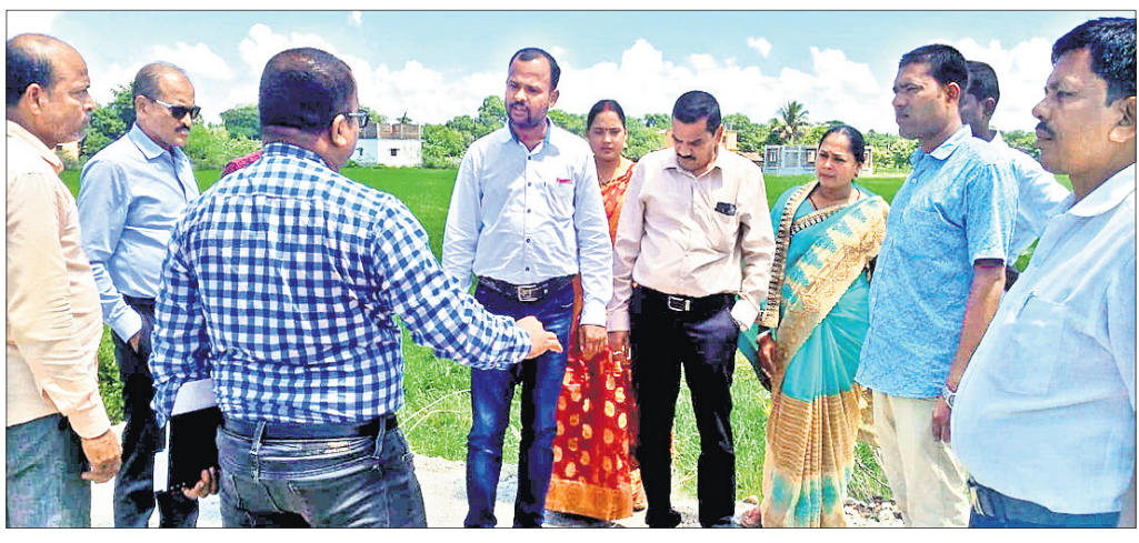
ସ୍ଵାସ୍ଥ୍ୟ କମିଟି ସଦସ୍ୟମାନେ ବନ୍ୟା ପ୍ରତିରୋଧକ ବନ୍ଧ ନିର୍ମାଣ କାର୍ଯ୍ୟ ତଦାରଖ କରୁଛନ୍ତି।

ହାଟଡିହା, ୨୦୧୯ (ଡି.ଏନ.ଏ.): ପରେ କେନ୍ଦୁଝର ଜିଲ୍ଲା ପରିଷଦ ଥାର୍ଟ ସ୍ଵାସ୍ଥ୍ୟ କମିଟି ସଦସ୍ୟମାନେ ଗୁଜ୍ରାବାର ଆସି ରାସ୍ତା ଅବସ୍ଥାର ତଦାରଖ କରିଛନ୍ତି।