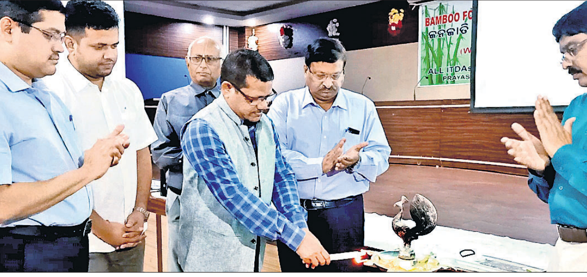
ଅତିଥିମାନେ କାର୍ଯ୍ୟକ୍ରମ ଉଦଘାଟନ କରୁଛନ୍ତି ।

ବାରିପଦା ଅଫିସ୍, ୨୦୧୯ ଓଡ଼ିଶା ବାଉଁଶ ଉତ୍ପାଦନ ସଂସ୍ଥା (ଓବିଟିଏ) ପକ୍ଷରୁ ମୟୂରଭଞ୍ଜ ଜିଲାର ସମସ୍ତ ୪ଟି ସମ୍ପୃକ୍ତ ଆଦିବାସୀ ଉତ୍ପାଦନ ସଂସ୍ଥା ଆନୁଷ୍ଠାନିକ ଭାବରେ ବାଉଁଶ ଚାଷ ଓ ଉତ୍ପାଦନ ବୃଦ୍ଧି ସମ୍ପର୍କିତ ଏକ ଜିଲ୍ଲାସ୍ତରୀୟ କର୍ମଶାଳା ଅନୁଷ୍ଠିତ ହୋଇଯାଇଛି ।