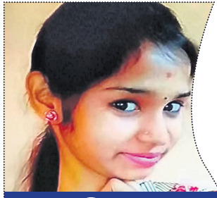
ନାହାରିକା ହତ୍ୟା ମାମଲା

କାଳିଆ, ୨୦୧୯: ଭାଜପା ବିଭାଗୀୟ ନିର୍ବାଚନମଣ୍ଡଳ ମହିଳା ମୋର୍ଚ୍ଚା ପକ୍ଷରୁ ବିଭିନ୍ନ ପ୍ରଧାନମନ୍ତ୍ରୀ ନରେନ୍ଦ୍ର ମୋଦିଙ୍କ ଜନ୍ମ ଦିବସ ପାଳନ ଅବସରରେ ସେବା ସପ୍ତାହ କାର୍ଯ୍ୟକ୍ରମ ଅନୁଷ୍ଠିତ ହୋଇଛି।