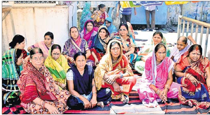
ପଶ୍ଚିମ ପାର୍ଶ୍ୱ ଗାଈଆ ଚଉରା ଛକରେ ଧାରଣାରେ ବସିଥିବା ମହିଳାମାନେ।