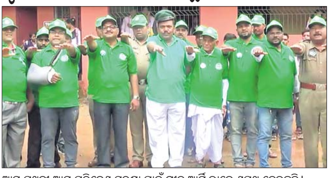
ଆମ ପୃଥିବୀ ଆମ ପରିବେଶ ସୁରକ୍ଷା ପାଇଁ ଗ୍ରୀନ ଆର୍ମି ଭାବେ ଶପଥ ନେଉଛନ୍ତି।