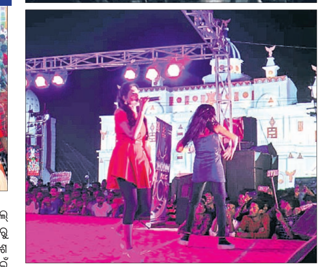
ବିଭିନ୍ନ ପୂଜା କମିଟି ପକ୍ଷରୁ ଆୟୋଜିତ ସାଂସ୍କୃତିକ କାର୍ଯ୍ୟକ୍ରମ।