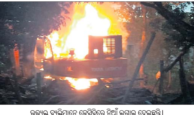
ଉଭୟ ଲୋକେ ଲଙ୍କାକାଣ୍ଡ ଘଟଣାଛଡ଼ି ଘଟଣା ପରେ ଉଭୟ ଲୋକେ ଏକ କେସିବିଜୁ ପୋଡ଼ି ଦେଇଛନ୍ତି।

ଦେଶାନ୍ତଳ ଜିଲ୍ଲା କାମାକ୍ଷାନଗର ଥାନା ବଡ଼ପୁଅଲ ଗ୍ରାମ ନିକଟ ଦେଇ ଯାଇଥିବା ୫୩ମ୍. କାଟାୟ ରାଜପଥ ସମ୍ପ୍ରଦାନବେଳେ ଶୁକ୍ରବାର ଅଭାବପାଇଁ ଘଟଣା ଘଟିଛି। କେହି ସହାୟତାରେ ଉଦ୍ଧୃତ କାର୍ଯ୍ୟ ଚାଲିଥିବାବେଳେ କାନ୍ଧ ଭୁବୁଡ଼ି ଦୁଇ ପରିବାରର ୮ଜଣ ଆହତ ହୋଇଛନ୍ତି। ସେମାନଙ୍କ ମଧ୍ୟରୁ ୩ଜଣଙ୍କ ଅବସ୍ଥା ଗୁରୁତର ରହିଛି। ଦୁର୍ଘଟଣା ପରେ ଉଭୟ ଲୋକେ ଲଙ୍କାକାଣ୍ଡ ଘଟଣାଛଡ଼ି ଘଟଣା ପରେ ଉଭୟ ଲୋକେ ଏକ କେସିବିଜୁ ପୋଡ଼ି ଦେଇଛନ୍ତି। ପରିସ୍ଥିତି ନିୟନ୍ତ୍ରଣ କରିବାକୁ ଘଟଣାସ୍ଥଳରେ ପହଞ୍ଚିଥିବା ପୋଲିସ୍ ଗାଡ଼ିକୁ ମଧ୍ୟ ସେମାନେ ଭଙ୍ଗାଗୁଡ଼ା କରିଥିଲେ। ଖବର ଲେଖାଯିବା ସୁଦ୍ଧା ଗ୍ରାମରେ ଉତ୍ତେଜନା ଲାଗି ରହିଛି। ଆହତଙ୍କୁ କ୍ଷତିପୂରଣ ଦେବା ପ୍ରଶ୍ନରୁ ସମସ୍ତ ଚିକିତ୍ସା ନିର୍ଦ୍ଧାରଣ କରାଯାଇଥିଲା।