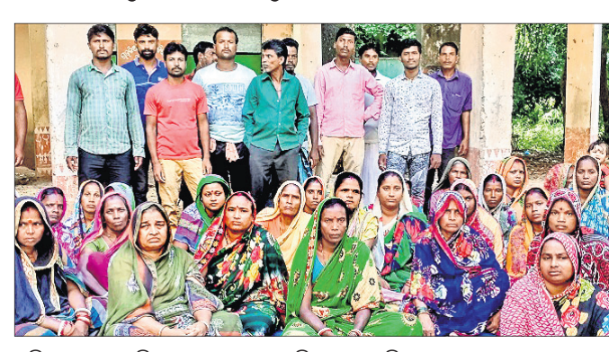
ଅଭିଭାବକମାନେ ବିଦ୍ୟାଳୟ ସମ୍ମୁଖରେ ପ୍ରତିବାଦ କରୁଛନ୍ତି।

ଏରସମା ବ୍ଲକ୍ ଆନ୍ଦୋଳନ ପଞ୍ଚାୟତସ୍ଥିତ ଚାଉଳିଆ ପ୍ରାଥମିକ ବିଦ୍ୟାଳୟର ଜଣେ ଶିକ୍ଷକଙ୍କ ବଦଳି ପ୍ରତିବାଦରେ ଗ୍ରାମବାସୀ ତାଲା ବଦ ଆନ୍ଦୋଳନ କରିଛନ୍ତି।