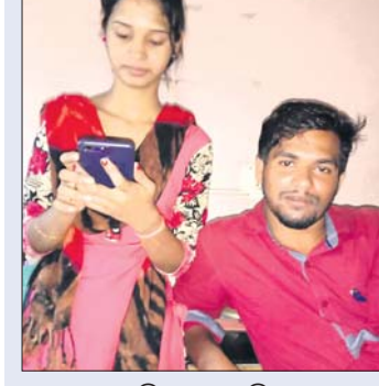
ନାହାରିକାଙ୍କ ସହ କିଶୋର।