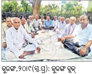
କୂଳଙ୍ଗ, ୨୦୧୯ (ସ.ପ୍ର.): କୂଳଙ୍ଗ ବ୍ଲକ୍ ପକ୍ଷପାଳସ୍ଥିତ ବ୍ଲକ୍‌ସ୍ତରୀୟ ୧୦ ପରିସରରେ ଓଡ଼ିଶା ରାଜ୍ୟ ଅବସରପ୍ରାପ୍ତ ନିର୍ବାଚକ ସଂଘର ୧୯୯୮ ମସିହାଠାରୁ ଚଳିଆ ଉତ୍ସାହ ଓ ଚଳିଆ ସୁଧା ପ୍ରଦାନ କରୁଥିବାବେଳେ ଓଡ଼ିଶା ସରକାର ତାହା କଳ୍ପନାତ୍ମକ ଭାବେ ନିରାକରଣ କରିଛନ୍ତି।