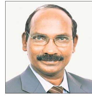
ଇସ୍ରୋ ଅଧ୍ୟକ୍ଷ ଡ. କେ. ଶିବନ।