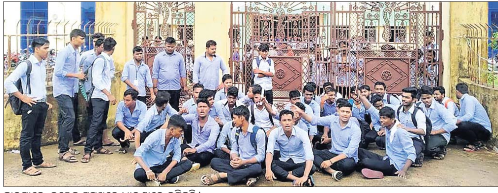
ଛାତ୍ରମାନେ କଲେଜ ସମ୍ମୁଖରେ ଧାରଣାରେ ବସିଛନ୍ତି।

ନୟାଗଡ଼ ଜିଲ୍ଲା ସଦର ବ୍ଲକ ଲୀଠିପତ୍ରା ଡିଗ୍ରୀ କଲେଜରେ ଲୀଠି ରହି ଅବ୍ୟବସ୍ଥା। ବିଭିନ୍ନ ସମୟରେ ଏ ନେଇ ଛାତ୍ରଛାତ୍ରୀମାନେ କର୍ତ୍ତୃପକ୍ଷଙ୍କୁ ଜଣାଇଥିଲେ ମଧ୍ୟ କୌଣସି ଫୁର୍ତ୍ତାକ ମିଳୁ ନ ଥିଲା।