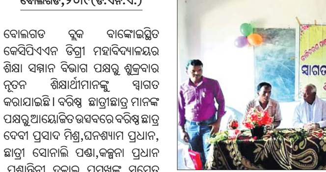
ସ୍ୱାଗତ ଉତ୍ସବରେ ମହାସାଧନ ଅତିଥିମାନେ।

ବୋଲଗଡ଼ ବ୍ଲକ ବାଙ୍କୋଇସ୍ଥିତ କେସିଏଏନ ଡିଗ୍ରୀ ମହାବିଦ୍ୟାଳୟର ଶିକ୍ଷା ସମ୍ମାନ ବିଭାଗ ପକ୍ଷରୁ ଶୁକ୍ରବାର ନୂତନ ଶିକ୍ଷାର୍ଥୀମାନଙ୍କୁ ସ୍ୱାଗତ କରାଯାଇଛି।