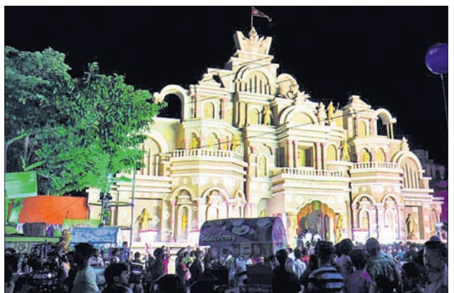
ଏକ ପୂଜା କମିଟି ପକ୍ଷରୁ ହୋଇଥିବା ତୋରଣ।

କୂଳଙ୍ଗ, ୨୦୧୯ (ସ.ପ୍ର.): କୂଳଙ୍ଗ ସୂଚନା କେନ୍ଦ୍ର ପରିସରରେ ଉତ୍କଳ ମହିଳା ସମିତି ପକ୍ଷରୁ ୨ୟ ଜିଲ୍ଲାସ୍ତରୀୟ ସମ୍ମିଳନୀ ଅନୁଷ୍ଠିତ ହୋଇଛି।