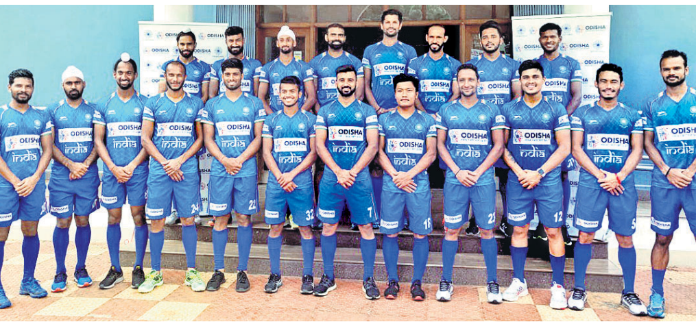
ବେଲଜିୟମ ରୁଁ ପାଇଁ ମନୋନୀତ ଭାରତୀୟ ପୁରୁଷ ହକି ଦଳ ।

ମଧ୍ୟ ଦଳରେ ସ୍ଥାନ ପାଇଛନ୍ତି । ଦଳର ଅନ୍ୟ ରୋଲକପର ହେଲେ କ୍ରିଷ୍ଣନ ବାହାଦୁର ପାଠକ । “ ଦଳରେ ସ୍ଥାନ