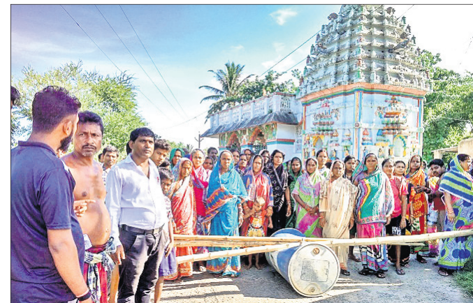
ରାସ୍ତାରୋକୋ କରିଥିବା ଉତ୍ତମ ଗ୍ରାମବାସୀ।

ପରିବାର ଲୋକଙ୍କୁ ଚାରା ବନାଇଥିଲା ପୋଲିସ୍ କିଶୋରଙ୍କୁ ଧରିବା ପାଇଁ ପୋଲିସ୍ ତାଙ୍କ ପରିବାର ଲୋକଙ୍କୁ ଚାରା ବନାଇଥିଲା। ତାଙ୍କ ମା, ବାପା ଓ ସାନଭାଇଙ୍କୁ ପୃଥକ ଭାବେ ଡାକି ପଚରାଉଚୁରା କରି ଛାଡ଼ିଦେଇଥିଲା।