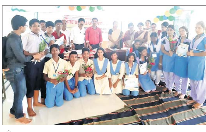
ଅତିଥିମାନଙ୍କ ଗହଣରେ କୃତୀ ଛାତ୍ରାଛାତ୍ରୀମାନେ।

ଜିଲା ଶିକ୍ଷା କାର୍ଯ୍ୟକ୍ରମର ସମ୍ମିଳନୀ କକ୍ଷରେ ଶୁକ୍ରବାର ଜିଲାସ୍ତରୀୟ ବିଜ୍ଞାନ ସେମିନାର (ଆଲୋଚନାଚକ୍ର) ଓ ଜିଲାସ୍ତରୀୟ ରୋଲ୍ ପ୍ଲେ ପ୍ରତିଯୋଗିତା ଅନୁଷ୍ଠିତ ହୋଇଯାଇଛି।