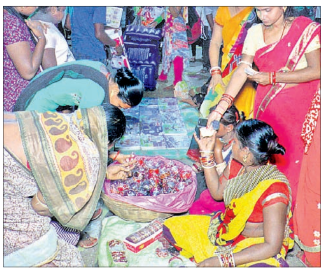
ମହିଳାମାନେ ବୁଡ଼ି କିଣୁଛନ୍ତି।