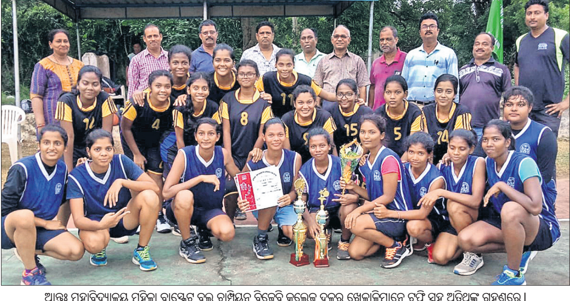
ଆନ୍ତର୍ଯ୍ୟାମୀ ମହିଳା ଦଳର ଚାମ୍ପିୟନ ବିଜେବି କଲେଜ ଦଳର ଖେଳାଳିମାନେ ଟ୍ରଫି ସହ ଅତିଥିଙ୍କୁ ଗହଣରେ।

ଏହି ବିଜୟ ଦକ୍ଷିଣ ଆଫ୍ରିକା ଆମ ଦକ୍ଷିଣାପଶ୍ଚିମ ଦଳକୁ ପ୍ରଦାନ କରିବ। ଓପନର ଲିଜେଲି ଲି ଦ୍ୱିଟା ଅଭ୍ୟାସ ମ୍ୟାଚରେ ୬୫ ରନର ଦ୍ରୁତ ପାଳି ଖେଳିଥିଲେ। ଏହାପରେ ମିଗ୍ନେନ ଦୁ ପ୍ରିଭ ଅପରାଜିତ ୪୦ ରନ କରି ଦଳକୁ ବଡ଼ ସ୍ୱେଚ୍ଛା ପ୍ରଦାନ କରିଥିଲେ।