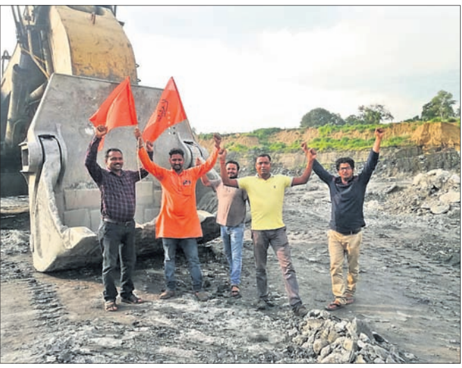
ବିଏମ୍‌ଏସ୍ ଯୁନିୟନର କର୍ମଚାରୀମାନେ ଖଣି ଭିତରେ କର୍ମଚାରୀମାନେ ପିକେଟ୍ କରି ମେଶିନ ବନ୍ଦ କରୁଛନ୍ତି।

କେନ୍ଦ୍ର ସରକାର ଦେଶର ବୃହତ୍ ରାଷ୍ଟ୍ରାୟତ୍ତ ଉଦ୍ୟୋଗ କୋଲ୍ ଇଣ୍ଡିଆରେ ଶତପ୍ରତିଶତ ପ୍ରତ୍ୟକ୍ଷ ପୁଞ୍ଜିନିବେଶ ପାଇଁ କ୍ୟାବିନେଟ୍‌ରେ ମଞ୍ଜୁରୀ ପାଇଛନ୍ତି। ଏହା ଜଣାପଡିବା ପରେ କୋଲ୍ ଇଣ୍ଡିଆରେ କାର୍ଯ୍ୟକାରୀ ଟ୍ରେଡ୍‌ୟୁନିୟନଗୁଡ଼ିକ କେନ୍ଦ୍ର ସରକାରଙ୍କ ଏଭଳି ନିଷ୍ପତ୍ତିକୁ କଡ଼ା ବିରୋଧ କରିଛନ୍ତି। ଏବେଲେ ଟ୍ରେଡ୍‌ୟୁନିୟନଗୁଡ଼ିକ ମିଳିତଭାବେ ମଙ୍ଗଳବାର ଦିନିକିଆ କାର୍ଯ୍ୟବନ୍ଦ ଆନ୍ଦୋଳନ ଭାବରେ ଦେଇଛନ୍ତି। ଏଥିମଧ୍ୟରୁ ଭାରତୀୟ ମଜବୁତ ସଂଘ(ବିଏମ୍‌ଏସ୍) ୨୩।୯ ୨୭ତାରିଖ ପର୍ଯ୍ୟନ୍ତ କାର୍ଯ୍ୟବନ୍ଦ ଆନ୍ଦୋଳନ ଡାକରା ଦେଇଛି। ଏହି ପରିପ୍ରେକ୍ଷାରେ ପୂର୍ବସୂଚନା ମୁତାବକ ବିଏମ୍‌ଏସ୍ ତରଫରୁ ସୋମବାର କାର୍ଯ୍ୟବନ୍ଦ ଆନ୍ଦୋଳନ ଆରମ୍ଭ ହୋଇଛି। ବିଏମ୍‌ଏସ୍‌ର ନେତୃତ୍ୱ ଓ କର୍ମଚାରୀମାନେ ସକାଳ ୬ଟାରୁ ବେଲପାହାଡ଼ ଓ ଲକ୍ଷ୍ମଣପୁର ଖୋଲାପୁର୍ ହ କୋଲ୍‌ଖଣି ଖଣି ଅଞ୍ଚଳକୁ ଯାଇ ପିକେଟ୍ କରି ବିଭିନ୍ନ ସାଇଟ୍, କାର୍ଯ୍ୟାଳୟ ଆଦି ବନ୍ଦ କରିଥିଲେ। ଏଥିମଧ୍ୟରେ ଡିଜିଟାଲ୍‌ଗୁଡ଼ା, ଉତ୍ପତ୍ତା, ଯୁକ୍ତି-ଏଲ୍‌ଏସ୍, ବିଓସିଏମ୍ ୬/୭୩୯ ଏମ୍‌ଜିଆର୍ ପକ୍ଷରେ କୋଲ୍‌ଖଣି ଆଦି ବନ୍ଦ ରହିଛି। ଟ୍ରେଡ୍‌ୟୁନିୟନ ଯାଇ ନ ପାରି ବିଭିନ୍ନ ରେଲ୍‌ସ୍‌ଟେସିନ୍‌ରେ ଛିଡ଼ା ହୋଇ ରହିଛି। ଉତ୍ପତ୍ତା ରେଲ୍‌ସ୍‌ଟେସିନ୍‌ରେ