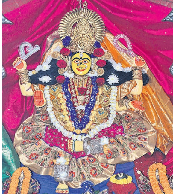
ମା' କଟକ ଚଣ୍ଡାଳ ଭୁବନେଶ୍ୱରୀ ଦେବୀ।