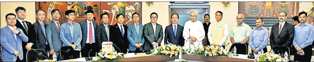
କୋରିଆର ଭବନଠାରେ ମୁଖ୍ୟମନ୍ତ୍ରୀ ନବୀନ ପଟ୍ଟନାୟକଙ୍କ ସହ ଆଲୋଚନା କରିବାକୁ ଆସିଥିବା କୋରିଆ ରାଷ୍ଟ୍ରଦୂତ ଏବଂ ପ୍ରତିନିଧିମଣ୍ଡଳୀ।

ଭୁବନେଶ୍ୱର, ୨୩୯ (ବୁଧବେ) ଇଲେକ୍ଟ୍ରୋନିକ୍, ପେଟ୍ରୋଲିୟମ, କେମିକାଲ ଓ ପେଟ୍ରୋକେମିକାଲ୍ସ, ବୟନ ଶିଳ୍ପ, ପର୍ଯ୍ୟଟନ, ଖାଦ୍ୟ ପ୍ରକ୍ରିୟାକରଣ ଆଦି ୬ଟି କ୍ଷେତ୍ରରେ ଓଡ଼ିଶାରେ ବ୍ୟାପକ ସୁଯୋଗ ରହିଛି। ରାଜ୍ୟ ସରକାର ଏଭଳି ଶିଳ୍ପ ପାଇଁ ଏକ ବ୍ୟବସାୟିକ ପରିବେଶ, ଶିଳ୍ପ ଭିତ୍ତିଭୂମି ଏବଂ ଦକ୍ଷ ମାନବସମ୍ପଦ ଯୋଗାଇ ଦେବେ। ଏସବୁ କ୍ଷେତ୍ରରେ ପୁଞ୍ଜି ବିନିଯୋଗ କରିବାକୁ କୋରିଆ ବ୍ୟବସାୟୀ ପ୍ରତିନିଧିମଣ୍ଡଳୀଙ୍କୁ ମୁଖ୍ୟମନ୍ତ୍ରୀ ନବୀନ ପଟ୍ଟନାୟକ ପ୍ରସ୍ତାବ ଦେଇଛନ୍ତି। ସୋମବାର କୋରିଆର ଭବନ ଠାରେ କୋରିଆ ରାଷ୍ଟ୍ରଦୂତ ସିନ ବଙ୍ଗ କିଲ ଏବଂ ତାଙ୍କ ସହ ଆସିଥିବା ୯ ଜଣିଆ କୋରିଆ