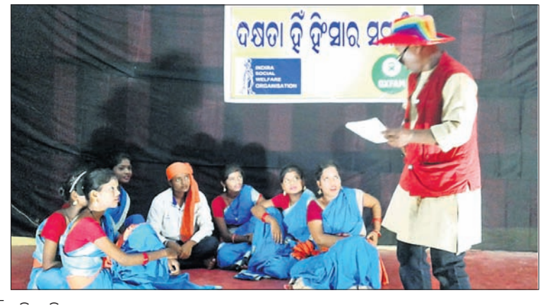
ପରିବେଷିତ ନାଟକର ଏକ ଦୃଶ୍ୟ।