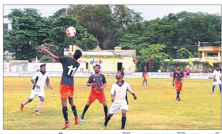
ଦେଶାନ୍ତରୀଣ ଅଧିକାରୀ, ୨୩୧୯

ଦେଶାନ୍ତରୀଣ କ୍ରୀଡ଼ା ସଂଘ ପକ୍ଷରୁ ସ୍ଥାନୀୟ ସ୍ତରରେ ଆୟୋଜିତ ହେଉଥିବା ପ୍ରଥମ ସର୍ବଭାରତୀୟ ଆମନ୍ତ୍ରଣ ଫୁଟବଲ ପ୍ରତିଯୋଗିତାର ଯୋଜନା ଅନୁଷ୍ଠିତ ମ୍ୟାଚରେ ରାଇଜିଂ ସ୍ପୋର୍ଟସ୍ କଟକ ଏ-ଗ୍ରୁପ୍‌ରେ ଭଞ୍ଜନଗର ଦଳକୁ ୧-୦ ଗୋଲରେ ପରାସ୍ତ