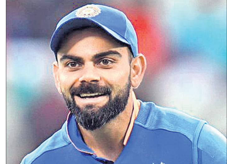
ବିରାଟ କୋହଲି ହେଲେ ଆମେ ଟପ୍ ଉପରେ ନିର୍ଭର କରିବୁ ନାହିଁ। ସବୁବେଳେ ଟପ୍ ଡିଟିବା ସମ୍ଭବ ହୋଇ ନାଏ।

ବେଞ୍ଚାଲୁ, ୨୩।୯ (ପି.ଟି.): ଆସନ୍ତାବର୍ଷ ଅଷ୍ଟ୍ରେଲିଆରେ ଟି୨୦ ବିଶ୍ୱକପ ଆୟୋଜନ ହେବାକୁ ଯାଉଥିବା ବେଳେ ଭାରତୀୟ ଅଧିନାୟକ ବିରାଟ କୋହଲି ଏକ ସମ୍ବଳିତ ଟିମ୍ ଗଠନ କରିଛନ୍ତି।