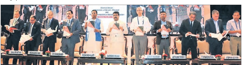
ନୂଆଦିଲ୍ଲୀଠାରେ ଇସ୍ପାତ ଶିଳ୍ପ ପକ୍ଷରୁ ଆୟୋଜିତ 'ଚିତ୍ତନ ଶିବିର' କର୍ମଶାଳାରେ ଉପସ୍ଥିତ ଅତିଥିମୁଦ୍ ।

ଭାରତର ପୂର୍ଣ୍ଣ ପିଛା ଇସ୍ପାତ ବ୍ୟବହାର ଆଗାମୀ ଦିନରେ ବୃତ୍ତଗତରେ ଅଧିକୃଷ୍ଟ ହେବାକୁ ଯାଉଛି । ଏହି ପୃଷ୍ଠଭୂମିରେ ଦେଶର ଇସ୍ପାତ ଶିଳ୍ପ ପାଇଁ ଏକ ବଡ଼ ପ୍ରୟୋଗ ସୃଷ୍ଟି କରିବା ଯୋଗ୍ୟ । ଏହା ପୂର୍ବରୁ ସେ ବୈଷୟିକ ଶିକ୍ଷା ଓ ତାଲିମ ନିର୍ଦ୍ଦେଶକ ଭାବେ ନିଯୁକ୍ତ ହୋଇଥିଲେ । ଏହା ପୂର୍ବରୁ ସେ କଟକ ଓ ଖୋର୍ଦ୍ଧା ଜିଲ୍ଲାପାଳ ଭାବେ ମଧ୍ୟ ଦାୟିତ୍ୱ ଗ୍ରହଣ କରିଛନ୍ତି । ଜଣେ ଭଲ ପ୍ରଶାସକ ଭାବେ ତାଙ୍କର ଖ୍ୟାତି ରହିଛି ।