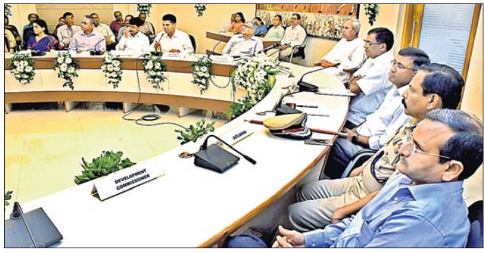
ଭିଡ଼ିଓ କନଫରେନ୍ସରେ ମୁଖ୍ୟମନ୍ତ୍ରୀ ଓ ଅନ୍ୟମାନେ।

ସରକାରୀ ହସ୍ପିଟାଲରେ ଦଲାଇ ଏବଂ ମଧ୍ୟସ୍ଥ ପାଠ୍ୟପୁସ୍ତକ ବୁକିଂ ନେଇ ଗଭୀର ଭବନରେ ବ୍ୟକ୍ତ କରିଛନ୍ତି ମୁଖ୍ୟମନ୍ତ୍ରୀ ନବୀନ ପଟ୍ଟନାୟକ।