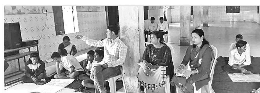
୨୧ ଛାତ୍ରଛାତ୍ରୀଙ୍କୁ ନେଇ ବିଜ୍ଞାନ ଆଲୋଚନାଚକ୍ର ଚାଲିଛି।

ଦାରିଙ୍ଗବାଡ଼ିଠାରେ ରୁକ୍ମପ୍ରସାରଣ ବିଜ୍ଞାନ ଆଲୋଚନାଚକ୍ର ପ୍ରହସନ ପାଲଟିଛି। କେବଳ ଏହି କାର୍ଯ୍ୟକ୍ରମ ରୁହେଁ ସ୍କୁଲ ଓ ଗଣଶିକ୍ଷା ବିଭାଗ ଦ୍ୱାରା କରାଯାଉଥିବା ବିଭିନ୍ନ କାର୍ଯ୍ୟକ୍ରମରେ ବହୁ ମେଧାବୀ ଛାତ୍ରଛାତ୍ରୀ ଯୋଗ ଦେଇ ପାରୁନାହାନ୍ତି।