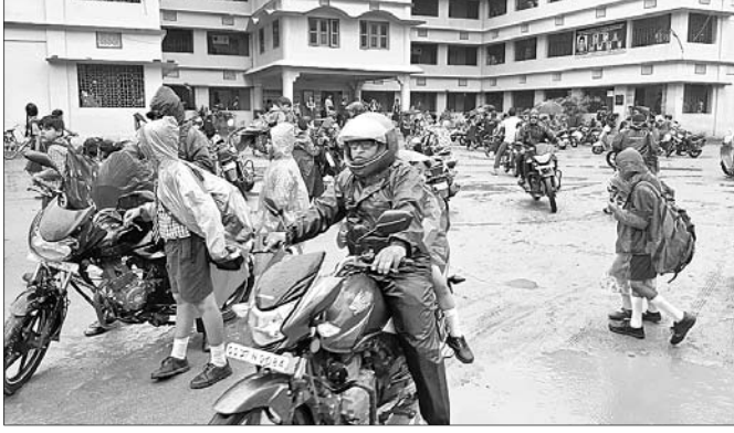
ଛାତ୍ରାଛାତ୍ରୀମାନେ ସ୍କୁଲକୁ ଯାଇ ଫେରି ଆସୁଛନ୍ତି ।

ବର୍ଷା ବିପ୍ଳାବ: ସ୍କୁଲ ଛୁଟି ବିଳମ୍ବ ନିଷ୍ପତ୍ତି ଯୋଗୁ ହଇରାଣ ପ୍ରକୃତର ଅପତ୍ୟ, ୨୫୮୯