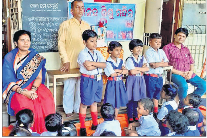
କାର୍ଯ୍ୟକ୍ରମରେ ମଞ୍ଚାସୀନ ବ୍ୟକ୍ତି ବିଶେଷ ।

ପିଲାମାନଙ୍କୁ ପାଠ୍ୟପୁସ୍ତକ ଓ ମିଷ୍ଟାନ୍ନ ବଣ୍ଟନ କରାଯାଇଥିଲା । ଉତ୍ସବ ପାଳନ ଉପଲକ୍ଷେ ମହାରାଜା କୃଷ୍ଣଚନ୍ଦ୍ର ଗଜପତି (ଏମ୍.କେ.ସି.କି) ଭେଷଜ ମହାବିଦ୍ୟାଳୟ ଓ ଚିକିତ୍ସାଳୟର ୧୨୦୦ ରୋଗୀଙ୍କୁ ଖାଦ୍ୟ ବଣ୍ଟନ କରାଯାଇଥିଲା ।