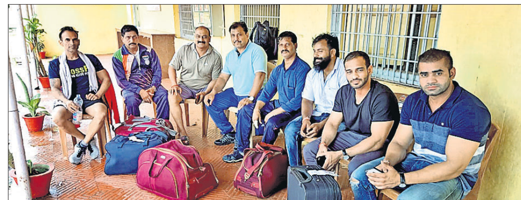
ବ୍ରହ୍ମପୁରରେ ପହଞ୍ଚିଥିବା ଦିଲ୍ଲୀର ଖେଳାଳିମାନେ ।

ବ୍ରହ୍ମପୁର ଅପ୍ଟିସ୍, ୨୫।୯ ଡାକ ବିଭାଗର ୩୫ତମ ସର୍ବଭାରତୀୟ ଭାରୋତ୍ତୋଳନ, ଶକ୍ତି ଉତ୍ତୋଳନ ଏବଂ ସୁନ୍ଦର ସ୍ଵାସ୍ଥ୍ୟ ପ୍ରତିଯୋଗିତା ଗୁରୁବାରରୁ ବ୍ରହ୍ମପୁରରେ ଆରମ୍ଭ ହେବାକୁ ଯାଉଛି ।