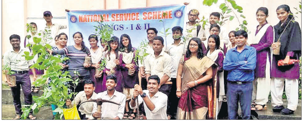
ଛାତ୍ରଛାତ୍ରୀମାନେ ଚାରାରୋପଣ କରୁଛନ୍ତି ।

ବ୍ରହ୍ମପୁର ଅପ୍ଟିସ୍, ୨୫।୯: ଗଞ୍ଜାମ ଓଜିଲ ସଂଘ ସାଧାରଣ ପରିଷଦ ବୈଠକ ରୂପାୟନା ଅନୁଷ୍ଠିତ ହୋଇଥିଲା ।