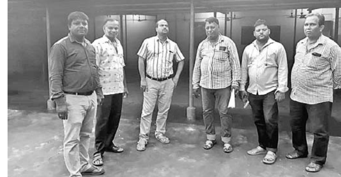
କଳିଙ୍ଗ ବିଶ୍ୱାସ ଭବନରେ ତହସିଲଦାର ଓ ଅନ୍ୟମାନେ ଅନୁଧ୍ୟାନ କରୁଛନ୍ତି।

ଶେରଗଡ଼, ୨୫.୯(ଡି.ଏନ.ଏ.): ଶେରଗଡ଼ ତହସିଲ ପକ୍ଷରୁ ଆୟତ୍ତା ୨୯ରେ 'ମୋ ଗାଁରେ ତହସିଲ' କାର୍ଯ୍ୟକ୍ରମ ଆରମ୍ଭ ହେବ।