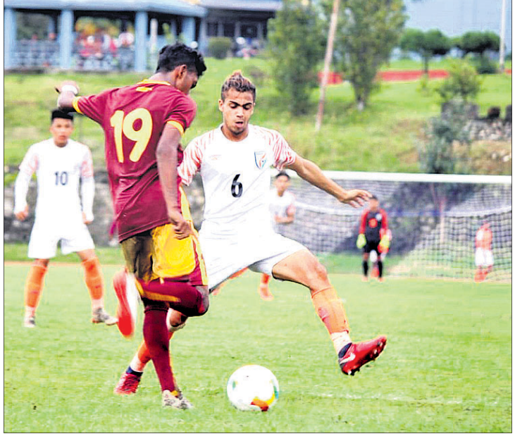
ଭାରତ ଓ ଶ୍ରୀଲଙ୍କା ମଧ୍ୟରେ ଅନୁଷ୍ଠିତ ମ୍ୟାଚ୍।