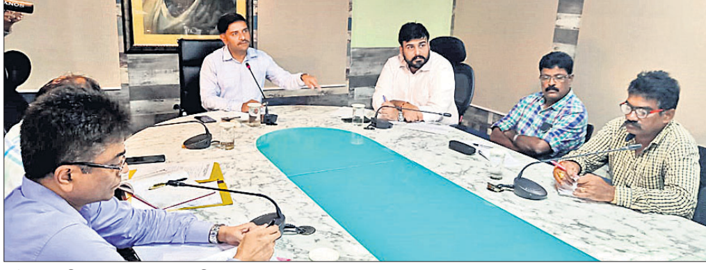
ବୈଠକରେ ଜିଲାପାଳ ସୂଚନା ଦେଉଛନ୍ତି ।

ବ୍ରହ୍ମପୁର ଉପକଣ୍ଠ ହଳଦିଆପଦର ବସ୍ତୁତ୍ରାଣ ଅଭିଯାନର ୨ ତାରିଖଠାରୁ କାର୍ଯ୍ୟକ୍ଷମ ହେବ । ଏଥିପାଇଁ ଆବଶ୍ୟକୀୟ ବ୍ୟବସ୍ଥା କାର୍ଯ୍ୟକ୍ରମ ଆରମ୍ଭ କରାଯାଇଛି ।