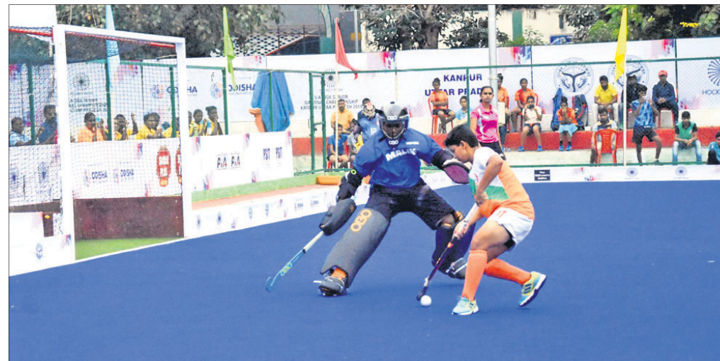
ଓଡ଼ିଶା ଓ ମହାରାଷ୍ଟ୍ର ମଧ୍ୟରେ ଅନୁଷ୍ଠିତ ସେମିଫାଇନାଲରେ ଓଡ଼ିଶା ଦଳର ଖେଳାଳିମାନେ।

ଭୁବନେଶ୍ଵର, ୨୫।୯ (ସ୍ଵାଗତ୍ ସ୍ଵାଗତ୍) ଭାରତୀୟ ଦେଶ କାନୁରୁରୁ ଗ୍ରୀନ ପାର୍କ ଷ୍ଟାଡ଼ିୟମରେ ଚାଲିଥିବା ୪ର୍ଥ ହକି ଇଣ୍ଡିଆ ୫-୩-ସାଇଡ୍ ମହିଳା ହକି ଚୁମ୍ବିତମଣ୍ଡଳ ଓଡ଼ିଶା ଦଳ ସେମିଫାଇନାଲରେ ପ୍ରବେଶ କରିଛି।