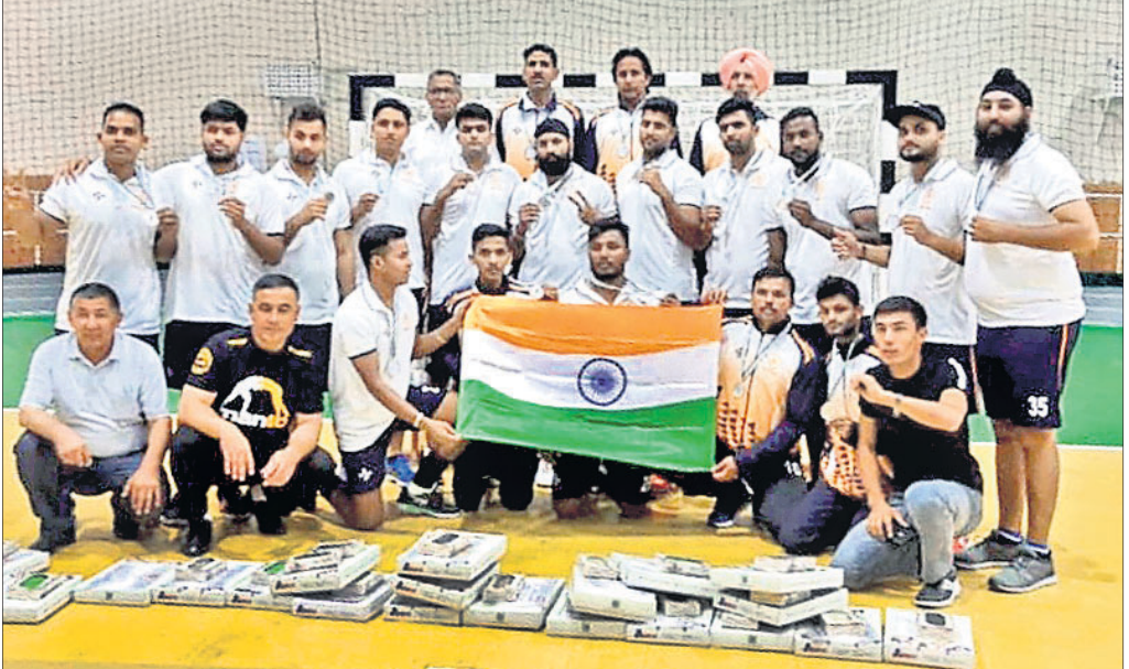
ରତନୀଅପ୍ ଭାରତୀୟ ହାଣ୍ଡବଲ ଦଳର ଖେଳାଳିମାନେ।

ଭୁବନେଶ୍ଵର, ୨୫।୯ (ସ୍ଵାଗତ୍ ସ୍ଵାଗତ୍) ଭଜବେଦିକ୍ରୀଡ଼ା ରାଜଧାନୀ ଚାଷିମାନଙ୍କୁ ପ୍ରତିରୋଧ କରିବା ପାଇଁ ୨୫ ତାରିଖ ପର୍ଯ୍ୟନ୍ତ ଅନୁଷ୍ଠିତ ୨୮ତମ ଇଣ୍ଡିପେଣ୍ଡେଣ୍ଟ କ୍ୟୁ ହାଣ୍ଡବଲ ଚାମ୍ପିୟନସିପରେ ଭାରତୀୟ ଦଳ ରତନୀଅପ୍ ହୋଇ ରୌପ୍ୟ ପଦକ ହାସଲ କରିଛି।