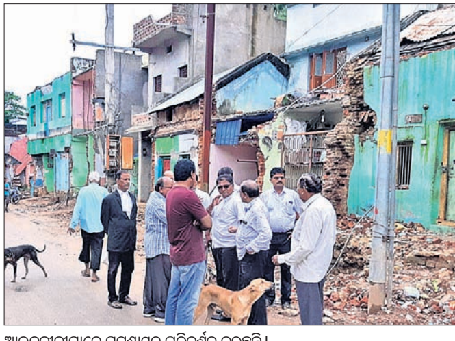
ଆଇନକାରୀମାନେ ଘରଗାଢ଼ୁଳ ପରିବର୍ତ୍ତନ କରୁଛନ୍ତି ।

ମଝିରେ ମଝିରେ ବର୍ଷା ଲାଗି ରହିଥିବା ଯୋଗୁ ପୁନରୁଦ୍ଧାର କାର୍ଯ୍ୟ ମଧ୍ୟ ଆରମ୍ଭ ହୋଇପାରେନାହିଁ ।