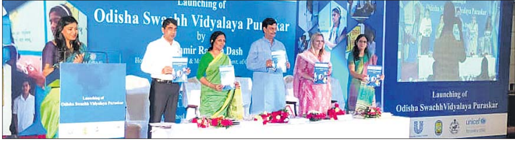
ସ୍ୱଚ୍ଛ ବିଦ୍ୟାଳୟ ଅଭିଯାନର ଶୁଭାରମ୍ଭ ଅବସରରେ ଗଣଶିକ୍ଷା ମନ୍ତ୍ରୀ ସମୀର ରଞ୍ଜନ ଦାଶ ଏବଂ ଅନ୍ୟମାନେ।