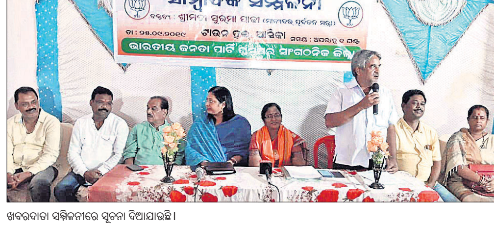
ଖବରଦାତା ସମ୍ମିଳନୀରେ ସୂଚନା ଦିଆଯାଇଛି ।

ଏହାଛଡ଼ା ଜଙ୍ଗଲଗୁଡ଼ିକ ୩୦୦ ଓ ୩୫୦-ଏ ଉଚ୍ଛ୍ରେଦ ପରେ ବହୁବର୍ଷ ଧରି ଦେଶର ସାମଗ୍ରିକ ବ୍ୟବସ୍ଥା ଠାରୁ ଦୂରରେ ରହିଥିବା କାରଣରୁ ଏହା ଅନ୍ୟତମ ଭାବେ ସମସ୍ତଙ୍କୁ ଗୁଣିବା ପାଇଁ ଏକ ଆତିହାସିକ ପଦକ୍ଷେପ ଗ୍ରହଣ କରାଯାଇଛି ।