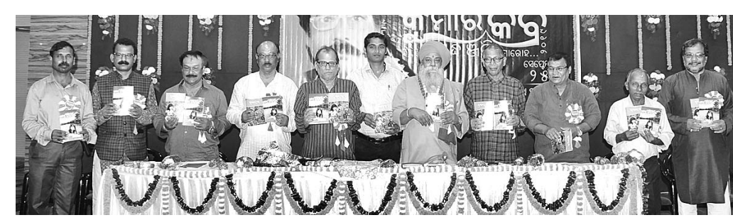
ଅତିଥିମାନେ ପୁସ୍ତକ ଲୋକାର୍ପଣ କରୁଛନ୍ତି।