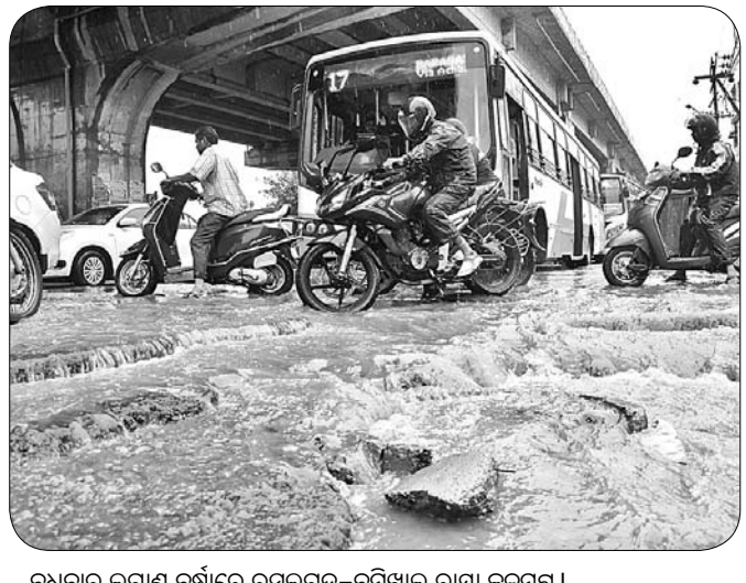
ବୁଧବାର ଲଗାଣ ବର୍ଷାରେ ରସୁଲଗଡ଼-ବିନିଆଳ ରାସ୍ତା ଜଳମଗ୍ନ।

ପଶ୍ଚିମ କୋଣାର୍କ ବଙ୍ଗୋପସାଗର ଉପକୂଳରେ ଏକ ପୁଣିବଳୟ ସୃଷ୍ଟି ହୋଇଛି। ଏହା ପ୍ରଭାବରେ ରାଜ୍ୟର ବିଭିନ୍ନ ଅଞ୍ଚଳରେ ବୁଡ଼ିବନ ହେବ ଲଗାଣ ବର୍ଷା ଭାରି ରହିଛି। ତେବେ ଭୁବନେଶ୍ୱରରେ ବୁଡ଼ିବନ ପ୍ରବଳ ବର୍ଷା ଅସାଧାରଣ ପରିସ୍ଥିତି ସୃଷ୍ଟି କରିଛି। ଏହାର ଫଳିତରୂପେ ଆରମ୍ଭ କରି ମୁଖ୍ୟ ରାସ୍ତାଗୁଡ଼ିକରେ ବର୍ଷା ଓ ଡ୍ରୋନ୍ ପାଣି ମାଡ଼ି ରହିଥିବାରୁ ଯାତାୟତ ବାଧାପ୍ରାପ୍ତ ହୋଇଛି। ଏହି ପରିସ୍ଥିତି ଭୁବନେଶ୍ୱର ମହାନଗର ନିଗମ (ବିଏମସି)ର ଡ୍ରେନେଜ ବ୍ୟବସ୍ଥା ଓ ସ୍ମାର୍ଟସିଟିର ବାସ୍ତୁବାକ୍ ପଦାରେ ପକାଇ ଦେଇଛି।