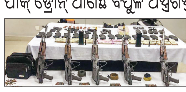
୪ ଖଲିସ୍ତାନୀ ଆତଙ୍କବାଦୀ ଗିରଫ

ସେ ଏହାକୁ ତାଙ୍କ ସ୍ୱପ୍ନ ମିଶନ ବୋଲି କହିଛନ୍ତି। ଏହି ଅବସରରେ ସାରା ବିଶ୍ୱରୁ ଅଭିନନ୍ଦନ ସୂଅ ଛୁଟିଛି। ଭାରତର ପ୍ରଧାନମନ୍ତ୍ରୀ ନରେନ୍ଦ୍ର ମୋଦି ଶେଖ୍ ମହମ୍ମଦ ବିନ୍ କାୟେଦ୍‌ଙ୍କ ଦୂରଦୃଷ୍ଟିକୁ ପ୍ରଶଂସା କରିବା ସହ ମନ୍ସୁରିଙ୍କ ସଫଳ ଯାତ୍ରା କାମନା କରିଛନ୍ତି।