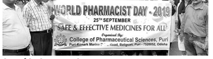
ବିଶ୍ୱ ଫାର୍ମାସିଷ୍ଟ ଦିବସରେ ବାହାରିଥିବା ସଚେତନତା ଶୋଭାଯାତ୍ରା।