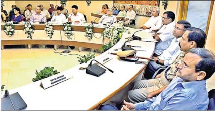
ଭିଡିଓ କନଫରେନ୍ସରେ ଯୁଦ୍ଧମନ୍ତ୍ରୀ ଓ ଅନ୍ୟମାନେ।

ଭୁବନେଶ୍ୱର, ୨୫.୯ (ବୁଧବାର) ସରକାରୀ ହସ୍ପିଟାଲରେ ଦଲାଲ ଏବଂ ମଧ୍ୟସ୍ତରୀୟ ପାଠ୍ୟପୁସ୍ତକ ବିକଳ ନେଇ ଗଭୀର ଭବନେଶ୍ୱର ବ୍ୟକ୍ତି କରୁଛନ୍ତି ଯୁଦ୍ଧମନ୍ତ୍ରୀ ନବୀନ ପଟ୍ଟନାୟକ। ସ୍ୱାସ୍ଥ୍ୟକେନ୍ଦ୍ରକୁ ମଧ୍ୟସ୍ତରୀୟ କବଳକୁ ମୁକ୍ତ ରଖିବାକୁ ଯୁଦ୍ଧମନ୍ତ୍ରୀ ସମସ୍ତ ଜିଲାର ଏସପିଙ୍କୁ କଡ଼ା ନିର୍ଦ୍ଦେଶ ଦେଇଛନ୍ତି। ଅକ୍ଟୋବର ୨ରେ ରାଜ୍ୟ ସରକାର ‘ମୋ ସରକାର’ କାର୍ଯ୍ୟକ୍ରମ ଶୁଭାରମ୍ଭ କରିବାକୁ ଯାଉଛନ୍ତି। ଏଥିପୂର୍ବରୁ ବୁଧବାର ଯୁଦ୍ଧମନ୍ତ୍ରୀ ଜିଲ୍ଲାପାଳ, ଏସପି, ଜିଲ୍ଲା ଯୁଦ୍ଧମନ୍ତ୍ରୀଙ୍କୁ ଏବଂ ଡାକ୍ତରମାନଙ୍କ ସହ ଭିଡିଓ କନଫରେନ୍ସ କରି ଆଲୋଚନା କରିଛନ୍ତି। ୧୫ଦିନ ମଧ୍ୟରେ ହସ୍ପିଟାଲଗୁଡ଼ିକୁ ମଧ୍ୟସ୍ତରୀୟ ମୁକ୍ତ କରି ଜଣାଇବାକୁ ସେ ଏସପିମାନଙ୍କୁ ନିର୍ଦ୍ଦେଶ ଦେଇଛନ୍ତି। ରାଜ୍ୟର ସ୍ୱାସ୍ଥ୍ୟ ସେବା ସମ୍ପର୍କରେ ସୂଚନା ଦେଇ ଯୁଦ୍ଧମନ୍ତ୍ରୀ କହିଛନ୍ତି, ୨୦୦୦ ମସିହାରେ ରାଜ୍ୟର ସ୍ୱାସ୍ଥ୍ୟ ବଜେଟ ୫୧୪ କୋଟି ଟଙ୍କା ଥିଲା। ଏହା ଏବେ ଏହା ୬ ହଜାର କୋଟି ଟଙ୍କାରେ ପହଞ୍ଚିଲାଣି। ସେହିପରି ସରକାରୀ ମେଡିକାଲ କଲେଜ