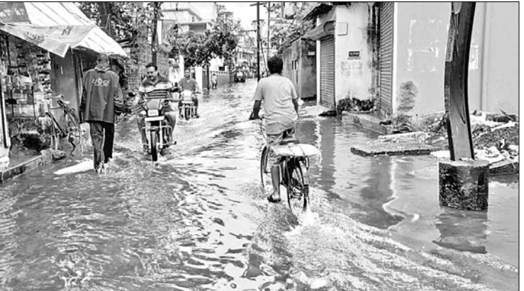
ପିଠାପୁର ଅଞ୍ଚଳ ରାସ୍ତାରେ ଜମି ରହିଥିବା ବର୍ଷା ଜଳ।