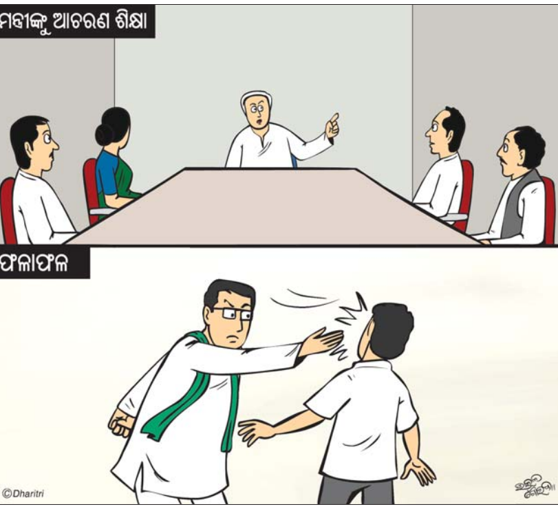
ମହାକୁ ଆଚରଣ ଶିକ୍ଷା

ଏକ ମାଛଖିଆ ଚିମ୍ ପଠାଯାଇଛି ମଙ୍ଗଳବାର ଏହି ଚିମ୍ ନିମାପଡ଼ାର ବିଭିନ୍ନ ଅଞ୍ଚଳକୁ ଛେନାଝିଲିର ଉତ୍ପାଦନ ଏବଂ ଉତ୍ତମ ସମ୍ପର୍କରେ ପତାରି ରୁଟିଥିଲେ। ନିମାପଡ଼ା ବଜାରରେ ଥିବା ମିଠା ବୋକାନୀଙ୍କ ସହ ଆଲୋଚନା କରିବା ସହ ସେମାନଙ୍କଠାରୁ ଛେନାଝିଲିର ମୂଳ ପ୍ରଯୁକ୍ତ ପ୍ରଣାଳୀ ସମ୍ପର୍କରେ ପତାରି ରୁଟିଥିଲେ। ଏହି ଚିମ୍ ରାଜ୍ୟ ସରକାରଙ୍କ ନିକଟରେ ରିପୋର୍ଟ ଦାଖଲ କରିବା ପରେ ଜିଆଇ ଟ୍ୟାଗ୍ ଆବେଦନ ପାଇଁ ପ୍ରକ୍ରିୟା ଆରମ୍ଭ ହେବ ବୋଲି ସୂଚନା ମିଳିଛି।