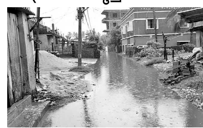
ନିମାପଡ଼ା ଏନ୍‌ଏସିରେ ବର୍ଷାଜଳ ଜମି କୃତ୍ରିମ ବନ୍ୟା ସୃଷ୍ଟି ହୋଇଛି।