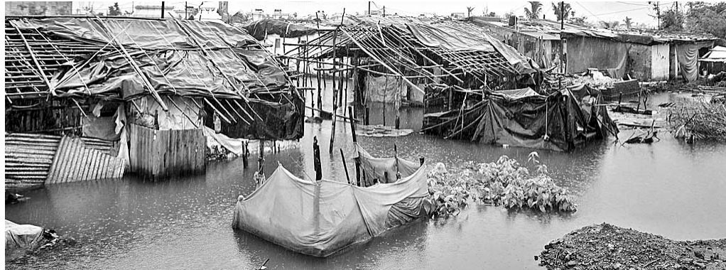
ବର୍ଷା ଯୋଗୁ ପୁରୀର ଧୋବାଖାଲ ବସ୍ତି ଜଳମଗ୍ନ ହୋଇଛି।