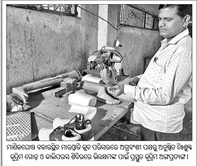
ମାଣିକଘୋଷ ବଜାରସ୍ଥିତ ମାରଘାଟି କୁବ ପରିସରରେ ଅଗ୍ରବଂଶୀ ପକ୍ଷରୁ ଅନୁଷ୍ଠିତ ନିଶ୍ଚଳ କୃତ୍ରିମ ଗୋଡ଼ ଓ କାଳିପରସ ଶିବିରରେ ଭିକ୍ଷାମଳ ପାଇଁ ପ୍ରସ୍ତୁତ କୃତ୍ରିମ ଅଙ୍ଗପ୍ରାଙ୍ଗଳ।