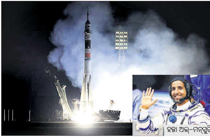
ଆଇଏସ୍‌ଏସ୍ ଅଭିଯୋଗ ପ୍ରଥମ ଯାତ୍ରା ମନ୍ସୁରି

ଦୁବାଇ, ୨୫୯ (ଏସ୍‌ଏସ୍): ସଂଯୁକ୍ତ ଆରବ ଏମିରେଟ୍ସ (ୟୁଏଇ) ରୁସୁଦ୍ଧ ଉପଗ୍ରହ ଲାନ୍ଚର ଯୁଏଇ-୫୦୦୦ (ଆଇଏସ୍‌ଏସ୍)କୁ ଦେଶର ପ୍ରଥମ ମହାକାଶ ଯାତ୍ରା ହଜା ଅଲ୍-ମନ୍ସୁରିଙ୍କୁ ପଠାଇ ଇତିହାସ ରଚିଛି। କାକାଖାଣ୍ଡାନର ବୈକୋନୁରୁ ଯୋଯୁଇ-ଏଫ୍‌ଇ ରକେଟ୍‌ରେ ୩୫ ବର୍ଷୀୟ ମନ୍ସୁରିଙ୍କ ସହ ରୁଷିଆର ଓଲେଫ୍ ଟ୍ରୋପୋଜକ ଏବଂ ନାସା ମହାକାଶଚାରୀ ଜେସିକା ମିର୍ ଆଇଏସ୍‌ଏସ୍ ଅଭିଯୋଗ ଯାତ୍ରା ଆରମ୍ଭ କରିବାବେଳେ ଯୁଏଇର ମହମ୍ମଦ ବିନ୍ ରଶିଦ୍ ସେଫ୍‌ରରେ ବହୁସଂଖ୍ୟକ ଲୋକ ଉପସ୍ଥିତ ରହି ଜାତୀୟ ପତାକା ଧରି ଉତ୍ସବ ପାଳନ କରିଛନ୍ତି। ବାୟୁସେନାର ପୂର୍ବତନ ପାଇଲଟ ମନ୍ସୁରିଙ୍କୁ ଯୁଏଇ ଜଣେ ଜାତୀୟ ହିରୋ ଭାବେ ଅଭିହିତ କରିଛି। ମନ୍ସୁରି