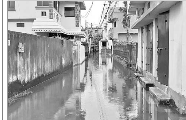
ଲାଗଣା ବର୍ଷାରେ କଳାଶୁବ ହୋଇଥିବା କଟକ ବିହାରୀୟାର ଚାରିଶା ଦିହାର।

ପୁଲନଖରୀ, ୨୫।୯(ଡି.ଏନ୍.ଏ): କଟକ-ଭୁବନେଶ୍ୱର ୧୬ତମ ଜାତୀୟ ରାଜପଥର ବମ୍ବିକ୍ସ ନିକଟରେ ଏକ କୁକୁଡ଼ା ବୋହେଇ ପିକ୍‌ଅପ ଭ୍ୟାନ ବୁଧବାର ଭାରସାମ୍ୟ ହରାଇ ରାସ୍ତାରେ ଓଲଟି ପଡ଼ିଥିଲା। ଫଳରେ ଚାଳକ ଓ ହେଲପର ଆହତ ହୋଇଥିଲେ। ସ୍ଥାନୀୟ ଲୋକେ ଆହତବ୍ୟକ୍ତିଙ୍କୁ ଗାଡ଼ି ଭିତରୁ ବାହାର କରି ଚିକିତ୍ସା ପାଇଁ କଟକ ବଡ଼ ଡାକ୍ତରଖାନାକୁ ପଠାଇଥିଲେ। ସୂଚନା ଅନୁଯାୟୀ, ବୁଧବାର ବର୍ଷା ହେଉଥିବାବେଳେ ଏକ ଗାଡ଼ି ପିକ୍‌ଅପ ଭ୍ୟାନ(ଓଆର ୦୨ଏଏଏ ୯୯୦୬)କୁ ଓଭରସେକ୍ସ କରୁଥିବାବେଳେ ଚାଳକ ଜଣକ ହଠାତ୍ ଟ୍ରେକ୍ ମାରିଥିଲେ। ଫଳରେ ଭାରସାମ୍ୟ ହରାଇ ଭ୍ୟାନ ଓଲଟି ପଡ଼ିଥିଲା। ଖବରପାଇ କଟକ ସଦର ପୋଲିସ୍ ଘଟଣାସ୍ଥଳରେ ପହଞ୍ଚି କ୍ଲେନ୍ ସାହାଯ୍ୟରେ ପିକ୍‌ଅପ ଭ୍ୟାନକୁ ରାସ୍ତାରୁ ହରାଇଥିଲା।