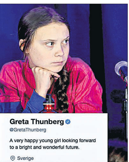
Greta Thunberg A very happy young girl looking forward to a bright and wonderful future.

ଆମେରିକା ରାଷ୍ଟ୍ରପତି ଡୋନାଲ୍ଡ୍ ତ୍ରୁଟ୍‌ଙ୍କ ଚୁକ୍ତିଚର ଜବାବ ରଖିଛନ୍ତି ସ୍ଵିଡେନ୍‌ର ପରିବେଶ କର୍ମୀ ଗ୍ରେଟା ଅନ୍‌ବର୍ଗ। ସେ ତାଙ୍କ ଚୁକ୍ତିଚର ବାୟୋକୁ ବଦଳାଇଦେଇଛନ୍ତି। ଜାତିସଂଘ ଜଳବାୟୁ କାର୍ଯ୍ୟାଳୟର ସମିତିରେ ଗ୍ରେଟା ଦେଇଥିବା ଭାଷଣର ଭିଡିଓକୁ ତ୍ରୁଟ୍‌ ଚୁକ୍ତିଚର କରିବା ସହ ଏହା ଉପରେ ବ୍ୟଙ୍ଗାତ୍ମକ ମନ୍ତବ୍ୟ ଦେଇଥିଲେ। ସେ ଗ୍ରେଟାଙ୍କୁ ସୁଖୀ ଝିଅ ବୋଲି ଲେଖିଥିଲେ। ତ୍ରୁଟ୍‌ଙ୍କ ଏହି ଚୁକ୍ତିଚର ବିଭିନ୍ନ ମହଲରେ ସମାଲୋଚନା କରାଯାଇଛି। ଗ୍ରେଟା ତାଙ୍କ ଚୁକ୍ତିଚର ବାୟୋକୁ 'ଏ ଭେରି ହାପି ଗର୍ଲ ଲୁକିଙ୍ଗ ଫରଭ୍ରାଉଟ୍ ଟୁ ଏ ବ୍ରାଇଟ୍ ଆଣ୍ଡ ଫୁଣ୍ଡରଫୁଲ୍ ଫ୍ୟୁଚର୍'ରେ ପରିବର୍ତ୍ତନ କରିଛନ୍ତି।