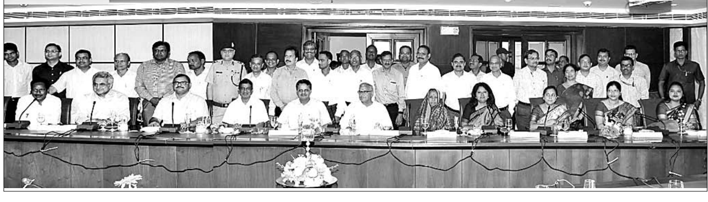
ବୈଠକରେ ଉପସ୍ଥିତ ଏମ୍ପି ଓ ରେଳ ବିଭାଗର ଅଧିକାରୀ।