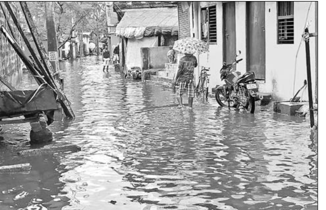
ଗମାତିହା ଅଞ୍ଚଳ ରାସ୍ତାରେ ବର୍ଷା ଜଳ।