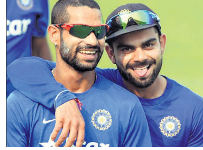
ଶିଖର ଧାଓନ ଓ ବିରାଟ କୋହଲି

ଅନ୍ତର୍ଜାତୀୟ କ୍ରିକେଟ୍ କାର୍ଡିନାଲ (ଆଇସିସି) ଟି୨୦ ର୍ୟାଙ୍କିଙ୍ଗ୍ରେ ଭାରତୀୟ ଚାମ୍ପିୟନ ରୋହିତ ଶର୍ମା ଗୋଟିଏ ସ୍ଥାନ ଉପରକୁ ଉଠି ବ୍ୟାଟିଂ ତାଲିକାର ଅଷ୍ଟମ ସ୍ଥାନରେ ରହିଛନ୍ତି।