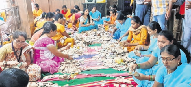
ଟଙ୍କା ଗଣା ଚାଲିଛି ।