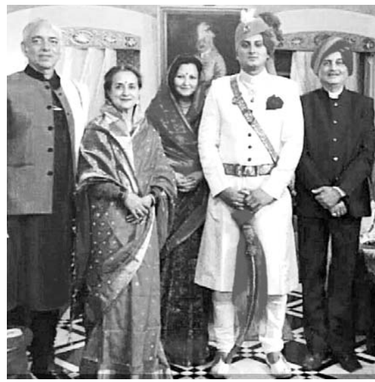
ସୋସିଆଲ ମିଡ଼ିଆରେ ଭାଇରାଲ ହୋଇଥିବା ଫଟୋ ।

ପୁରୀ ଅଧିକ, ୨୬: ପୁରୀର ନୂଆ ଯୁବରାଜ ଏକ ଗୁପ୍ତ ଫଟୋ ଚଳେ ଏମିତି ଲେଖାଯାଇ ଏହାକୁ ସୋସିଆଲ ମିଡ଼ିଆରେ ଭାଇରାଲ କରାଯାଇଛି ।