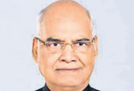
ପହଞ୍ଚିବେ। ସେଠାରେ ତାଙ୍କୁ ରାଜ୍ୟପାଳ, ମୁଖ୍ୟମନ୍ତ୍ରୀଙ୍କ ସମେତ ଅନ୍ୟ ମାନ୍ୟଗଣ୍ୟ ପୁଷ୍ପା-୪

କାର୍ଯ୍ୟକ୍ରମ ରହିଛି। ତେବେ ପୂର୍ବ ନିର୍ଦ୍ଧାରିତ ଗସ୍ତ କାର୍ଯ୍ୟକ୍ରମରେ ସାମାନ୍ୟ ପରିବର୍ତ୍ତନ କରାଯାଇଛି। ରାଷ୍ଟ୍ରପତି ସନ୍ଧ୍ୟା ୬ଟା ୩୦ ପରିବର୍ତ୍ତେ ଅପରାହ୍ଣ ୨ଟା ୩୦ରେ ବିଜୁ ପଟ୍ଟନାୟକ ବିମାନ ବନ୍ଦରରେ