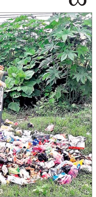
ବାଇପାଠାଠାରୁ ନହଳା ବାଇପାଠା ରାସ୍ତା କଡ଼ରେ ପରିବା ଦୋକାନୀମାନେ ପଚାଷତା ପରିବା ଓ ଅନ୍ୟାନ୍ୟ ବର୍ଷାବସ୍ତୁ କୁଚ୍ଛା, ଛେଳି କାଟାଳିମାନେ ଏବଂ ଚୋରବା ଛକଠାରେ ମାଛ ବ୍ୟବସାୟୀ ମାଛ କାଟି ଏବଂ ବିଭିନ୍ନ ଅବରକାରୀ ପରିମଳ ବ୍ୟବସ୍ଥା କାର୍ଯ୍ୟ ଠିକ୍ ଭାବେ ଚାଲି ନ ଥିବାରୁ ୪ ମାସ ହେବ ବିଲ୍ ବନ୍ଦ କରାଯାଇଛି । ୩୦ ତାରିଖ ମଧ୍ୟରେ ସହରର ସମସ୍ତ ଅଳିଆ ଆବର୍ଜନା ଓ ଉତ୍ପାଦନଗୁଡ଼ିକୁ ସଫା କରିବାକୁ ନିର୍ଦ୍ଦେଶ ଦିଆଯାଇଛି ବୋଲି କହିଛନ୍ତି ।

ପରିମଳ ବ୍ୟବସ୍ଥା କାର୍ଯ୍ୟ ଠିକ୍ ଭାବେ ଚାଲି ନ ଥିବାରୁ ୪ ମାସ ହେବ ବିଲ୍ ବନ୍ଦ କରାଯାଇଛି । ୩୦ ତାରିଖ ମଧ୍ୟରେ ସହରର ସମସ୍ତ ଅଳିଆ ଆବର୍ଜନା ଓ ଉତ୍ପାଦନଗୁଡ଼ିକୁ ସଫା କରିବାକୁ ନିର୍ଦ୍ଦେଶ ଦିଆଯାଇଛି ବୋଲି କହିଛନ୍ତି ।