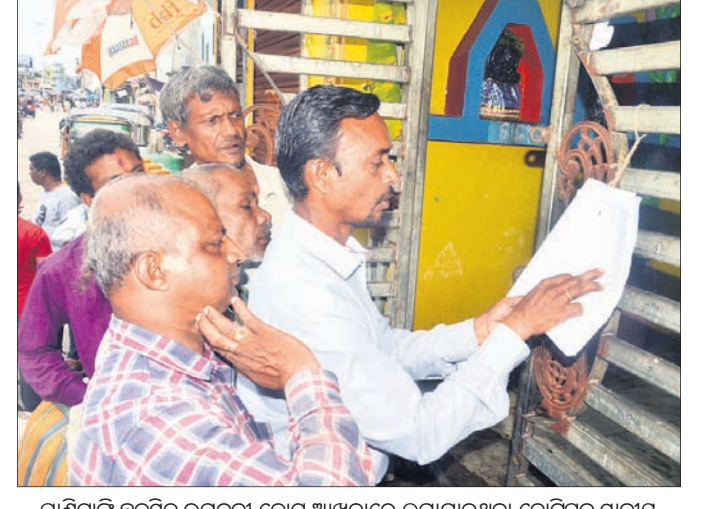
ପାର୍ଶ୍ୱଚାଳିତ ଛକପ୍ରତି ଭଗବତୀ କୋଟ ଆଖପାଖରେ ଲଗାଯାଇଥିବା ନୋଟିସ୍‌କୁ ସ୍ଥାନୀୟ ବାସିନ୍ଦା ଦେଖୁଛନ୍ତି ।

ମଠ, ମନ୍ଦିର ଏବଂ ଘରୋଇ ଲୋକଙ୍କ ଜମି ରହିଛି । ସାମାଜିକ ପ୍ରଭାବ ନିର୍ଦ୍ଧାରଣ ସର୍ବୋଚ୍ଚ ପାଇଁ ୫ଟି ଟିମ୍ ଗଠନ କରାଯାଇଛି । ପ୍ରତ୍ୟେକ ଟିମ୍ ସହିତ ସେମାନଙ୍କ ଟେକ୍ନିକାଲ କର୍ମଚାରୀ ଥିବେ ।