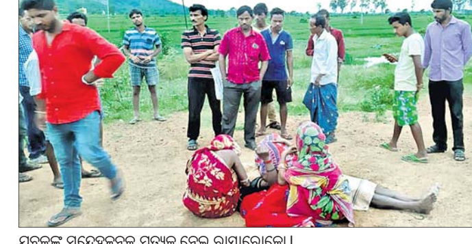
ଯୁବକଙ୍କ ସନ୍ଧ୍ୟାରେକୋ ମୃତ୍ୟୁ ନେଇ ରାସ୍ତାରେକୋ ।

ଲୋକଙ୍କୁ ବୁଝାଖୁଣି କରିଥିଲେ । ଏଥିପାଇଁ ମୁତବେହ ଜବତ କରି ବ୍ୟବହାର ପାଇଁ ଠାଉଛନ୍ତି ।