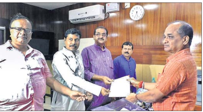
ସିଦ୍ଧାନ୍ତ କାର୍ଯ୍ୟାଳୟରେ ଅଧିକାରୀଙ୍କୁ ଅଭିଯୋଗପତ୍ର ପ୍ରଦାନ କରୁଛନ୍ତି ଭାଜପା ପ୍ରତିନିଧି ।