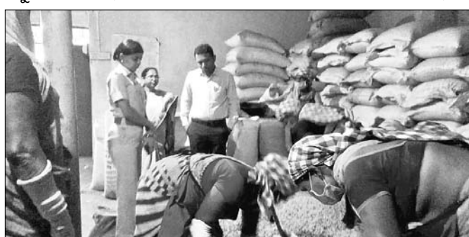
ଛତୁଆ ପ୍ରସ୍ତୁତି ଯାଞ୍ଚ କରାଯାଇଛି ।