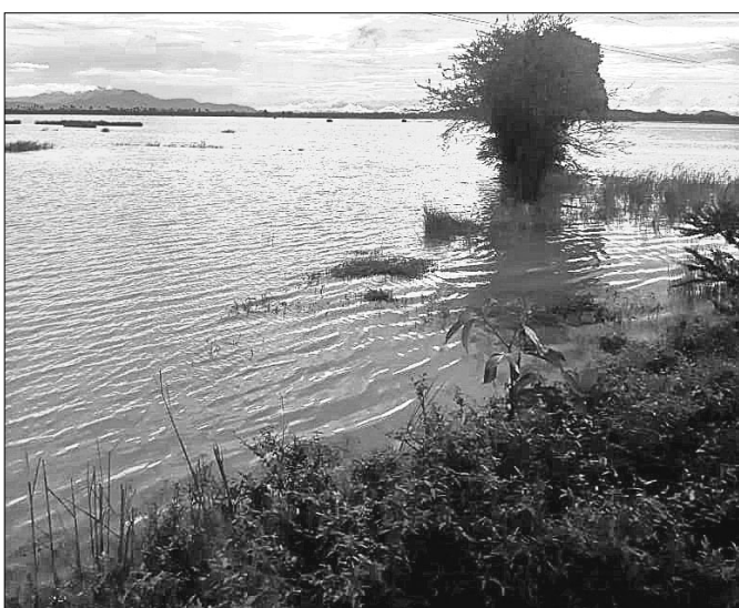
ବୁକର ଗଞ୍ଜଳା ନିକଟ ଚାଷଜମିରେ ପାଣି ଜମି ରହିଛି ।

ଚଳିତବର୍ଷ ବିଭିନ୍ନ ସମୟରେ ପ୍ରବଳ ବର୍ଷା ହୋଇ ବ୍ୟାପକ ଅଞ୍ଚଳ ଜଳମଗ୍ନ ହୋଇଛି। ବର୍ଷାଜଳ ନଦୀରେ ଠିକ ଭାବରେ ନିଷ୍ଠାସନ ନ ହେବାରୁ ହିଞ୍ଜିଳିକାଣ୍ଡ ବୁକର ବିଭିନ୍ନ ପଞ୍ଚାୟତରେ ବନ୍ୟା ପରିସ୍ଥିତି ସୃଷ୍ଟି ହୋଇଛି। ଫଳରେ ବୁକର ଗଞ୍ଜଳା, ବେଲଗାଁ, ଧୋବାଡ଼ି, ସାହାପୁର, ପୁଟିଆପଦର, ନନ୍ଦିକ, ରାକବ, ଶାସନଆମଗାଁ, ଶିକିରି, ସାବୁ ସମେତ ସ୍ଥାନୀୟ ଯୁନିଟ୍‌ପାଲଟି ଅଞ୍ଚଳର ବ୍ୟାପକ ଚାଷ ଜମି ପ୍ରଭାବିତ ହୋଇଛି। ଚାଷ ଜମିକୁ ଜମି ମାଫିଆ ମାନେ କବଜା କରି ପୁଟ କରିବା ଏବଂ ଏଥିପାଇଁ ବିଭିନ୍ନ ସ୍ଥାନରେ କେନାଲ ଓ ନାଳକୁ ବନ୍ଦ କରିବା ନେଇ ଉଦ୍‌ବେଗ ପ୍ରକାଶ ପାଇଛି। ପୂର୍ଣ୍ଣ ବିଭାଗ ଓ ଜଳସେଚନ ବିଭାଗ