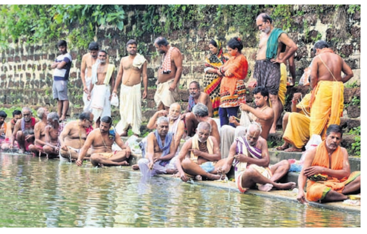
ମହାକନ୍ୟା ଉପଲକ୍ଷେ ଶ୍ରଦ୍ଧାଳୁମାନେ ମାର୍ଗଣ୍ଡ ପୁଷ୍ପଗଣାରେ ତିଳତର୍ପଣ ଓ ପିଣ୍ଡଦାନ କରୁଛନ୍ତି ।