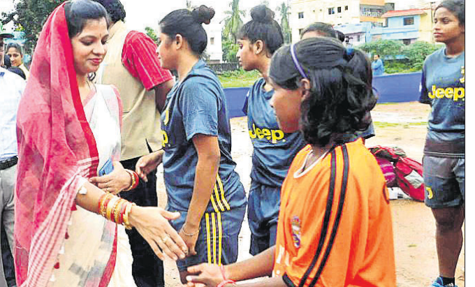
ଉଦ୍ଘାଟନା ଅବସରରେ ଅତିଥି ଖେଳାଳିଙ୍କ ସହ ପରିଚିତ ହେଉଛନ୍ତି ।