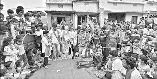
ଆଲୋଚନାରେ ଅହିଂସା ନାଟକ ମଞ୍ଚଣ।