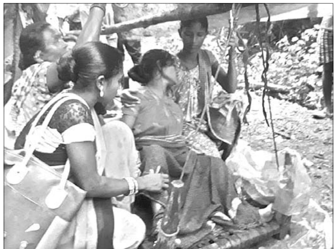
କେଶ ଗର୍ଭବତୀଙ୍କୁ ଖଟିଆରେ ବୋହି ନିଆଯାଇଛି।

ସରକାର ଉପାଦାନ ଅଞ୍ଚଳରେ ସ୍ୱାସ୍ଥ୍ୟସେବା ପହଞ୍ଚାଇବାକୁ ବହୁ ଯୋଜନା କରି କୋଟି କୋଟି ଟଙ୍କା ଖର୍ଚ୍ଚ କରୁଛନ୍ତି। ମାତ୍ର ଭଲ ରାସ୍ତା ନ ଥିବାରୁ ଆଜି ବି ବହୁ ଆଦିବାସୀ ଅଞ୍ଚଳରେ ରୋଗୀ ବୋଲିରେ ବୁଢ଼ା ହୋଇ ମେଡିକାଲ ଆସୁଛନ୍ତି। ଏପରି ଏକ ଘଟଣା ଶନିବାର କେଶମାଳ ଜିଲ୍ଲା କୋଟଗଡ଼ ଜୁନ ଅଞ୍ଚଳରେ ଦେଖିବାକୁ ମିଳିଛି। ପ୍ରକାଶ ଯେ, କୋଟଗଡ଼ ଜୁନ ସାରକୂଳ ପଞ୍ଚାୟତର ଏକ ଗ୍ରାମ ହେଉଛି ପାଟାଲିପଦର। ସଦରମହକୁମାରୁ ଏହା ୧୩ କିମି ଦୂର। ଗତ ଲଗାଣ ବର୍ଷରେ ପାଟାଲିପଦର ଯାଇଥିବା ରାସ୍ତା ବିଭିନ୍ନ ସ୍ଥାନରେ ଧୋଇଯିବା ସହ ମାଟି ଅତଡ଼ା ଧରି ରାସ୍ତାରେ ପଡ଼ିରହିଛି। ଫଳରେ ଯାତାୟତରେ ବହୁ ଅସୁବିଧା ହେଉଛି। ବର୍ଷା ଛାଡ଼ିବାର ଅନେକ ଦିନ