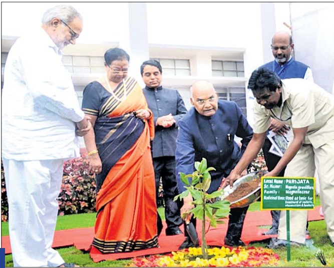
ରାଜଭବନ ପରିସରରେ ରାଷ୍ଟ୍ରପତି ରାମନାଥ କୋବିନ୍ଦ ଗଛ ଲଗାଇଛନ୍ତି ।

ଭୁବନେଶ୍ୱର ଓଡ଼ିଆ ଗ୍ରହରେ ଆସିଥିବା ରାଷ୍ଟ୍ରପତି ରାମନାଥ କୋବିନ୍ଦ ଶନିବାର ଅପରାହ୍ନ ୪ଟା ୨୦ରେ ସ୍ୱତନ୍ତ୍ର ବିମାନରେ ଦିଲ୍ଲୀ ଫେରିଯାଇଛନ୍ତି । ସକାଳେ ରାଷ୍ଟ୍ରପତି ଗୋପାଳପୁର ଆର୍ମି ଏୟାର ଡିପୋରୁ କଲେଜର ପାଠିଆଖଣ୍ଡ ସେରିମନିରେ ଯୋଗଦେଇଥିଲେ । ସେଠାରୁ ହେଲିକପ୍ଟର ଯୋଗେ ତାଙ୍କ ଧର୍ମପୂଜାକ ସହ ଆସି ପୂର୍ଣ୍ଣହ ୧୧ଟା ୪୦ରେ ଭୁବନେଶ୍ୱର ବିଜୁ ପଟ୍ଟନାୟକ ବିମାନବନ୍ଦରରେ ପହଞ୍ଚିଥିଲେ । ଏହାପରେ ସେମାନଙ୍କୁ କଡ଼ା ସୁରକ୍ଷା ବଳୟରେ କାରକେନ୍ଦ୍ରରେ ରାଜଭବନକୁ