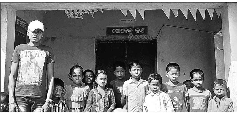
ସ୍କୁଲର ବିଦ୍ୟାଳୟ ସମ୍ମୁଖରେ ଛାତ୍ରଛାତ୍ରୀଙ୍କ ସହ ସ୍ଥାନୀୟ ମୁଦକ।

ଶିକ୍ଷାର ବିକାଶ ପାଇଁ ସରକାର ଗାଁ ଗାଁରେ ବିଦ୍ୟାଳୟ ଖୋଲିଛନ୍ତି। ସ୍କୁଲରେ ଶିକ୍ଷୟିତ୍ରୀ ଶିକ୍ଷକ ନିଯୁକ୍ତି କରିବା ଏବଂ ବିଦ୍ୟାଳୟ ପ୍ରତି ପିଲାଙ୍କୁ ଆକୃଷ୍ଟ ପାଇଁ ବିଭିନ୍ନ ଯୋଜନା କରି କୋଟି କୋଟି ଟଙ୍କା ଖର୍ଚ୍ଚ ହେଉଛି। ସ୍କୁଲରେ ସକାଳ ୯ଟାରୁ ସାଢ଼େ ୪ଟା ପର୍ଯ୍ୟନ୍ତ ଶିକ୍ଷୟିତ୍ରୀ ଶିକ୍ଷକ ଉପସ୍ଥିତ ରହିବା ପାଇଁ କଡ଼ା ନିର୍ଦ୍ଦେଶ ମଧ୍ୟ ଜାରି କରାଯାଇଛି। କିନ୍ତୁ କେତେକ ସ୍ଥାନରେ ସରକାରୀ ନିର୍ଦ୍ଦେଶକୁ ବେଖାତିର କରାଯାଉଛି। ମଧ୍ୟାହ୍ନଭୋଜନ ପରେ ବିଦ୍ୟାଳୟରେ ଡୁଲୁଛି ତାଲା। ଏହା ଦେଖିବାକୁ ମିଳିଛି ମୋହନା ବୁକ୍ ସ୍କୁଲର ସରକାରୀ ପ୍ରାଥମିକ ବିଦ୍ୟାଳୟରେ। ମୋହନା ବୁକ୍ ସ୍କୁଲ ୨୫ କିମି ଦୂର ଏହି ବିଦ୍ୟାଳୟ। ଶୁକ୍ରବାର ସାଢ଼େ ୨ଟାରେ ଉକ୍ତ ବିଦ୍ୟାଳୟର ଶ୍ରେଣୀ ଗୃହରେ ତାଲା ଝୁଲୁଥିବା ଦେଖିବାକୁ ମିଳିଥିଲା। ସ୍କୁଲରେ କୌଣସି ଶିକ୍ଷୟିତ୍ରୀ, ଶିକ୍ଷକ ନଥିବା ବେଳେ ପଢ଼ିବା ସମୟରେ