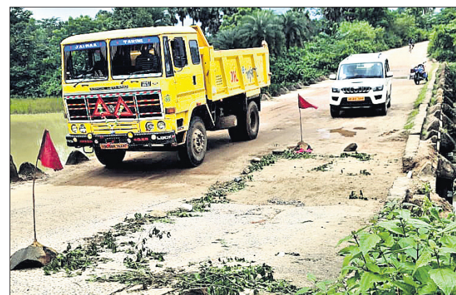
ବିପଦସଙ୍କୁଳ ଅବସ୍ଥାରେ ମହିଷାସୁରୀ ପୋଲ।