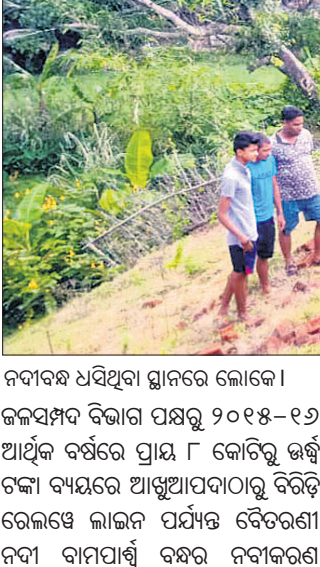
ନଦୀବନ୍ଧ ଧର୍ଯ୍ୟବଳା ସ୍ଥାନରେ ଲୋକେ।

ଭଦ୍ରକ ଜିଲ୍ଲା ଉଦ୍ଧାରପୋଖରୀ ବ୍ଲକ୍ ଆଖିଆପଦା-ବିରିଡ଼ି ବୈତରଣୀ ନଦୀବନ୍ଧର ଯଶୋବିହାରୀ କେନାସାହି ଗାଁ ପାଖ ବନ୍ଧ ଲାଗାଣ ବର୍ଷାରେ ଧରିବା ଆରମ୍ଭ କରିଛି।