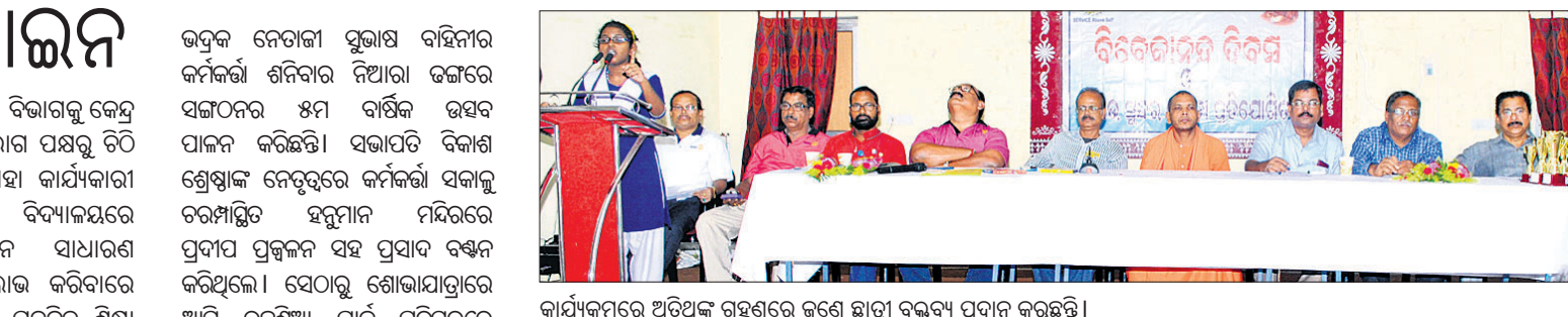
କାର୍ଯ୍ୟକ୍ରମରେ ଅତିଥିଙ୍କ ଗହଣରେ ଜଣେ ଛାତ୍ରୀ ବକ୍ତବ୍ୟ ପ୍ରଦାନ କରୁଛନ୍ତି।

ଭଦ୍ରକ ଅଫିସ୍, ୨୮.୮.୧୯: ଭଦ୍ରକ ଚରଣ ମହାବିଦ୍ୟାଳୟରୁ ଦ୍ରବ୍ୟ ଓ ସେବା କର ସମ୍ପର୍କିତ ପାଠଚକ୍ର ଅନୁଷ୍ଠିତ ହୋଇଯାଇଛି।