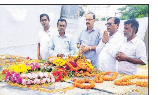
ଶହାଦ ପାଠରେ ମାଲ୍ୟାପର୍ଣ୍ଣ କରାଯାଇଛି।