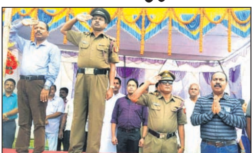
ପତାକା ଉତ୍ତୋଳନ ବେଳେ ଅତିଥି ଓ ଅନ୍ୟମାନେ।