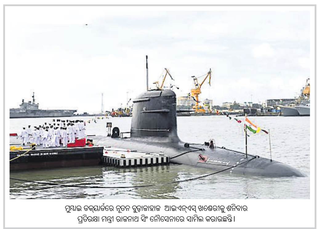
ମୂଲ୍ୟାତ୍ମକ ଚକ୍ରଧାରରେ ନୂତନ ବୁଡ଼ାଜାହାଜ ଆଇଏଏଏଏ ଖଣ୍ଡେରାଜୁ ଶନିବାର ପ୍ରତିରକ୍ଷା ମନ୍ତ୍ରୀ ରାଜନାଥ ସିଂ ମୋସେନରେ ସାମିଲ କରାଗଲେ ।

ଶାନ୍ତିପୂର୍ଣ୍ଣ ଓ ଉପଯୁକ୍ତଭାବେ ସମାଧାନ ହେବା ଉଚିତ । କଣ୍ଠାର ସ୍ଥିତିରେ ପରିବର୍ତ୍ତନ ଲାଗି ଏକପାଖିଆ କୌଣସି କାର୍ଯ୍ୟାନୁଷ୍ଠାନ ନିଆଯିବା ଉଚିତ ରୁହେଁ ବୋଲି ବେଝି କହିଥିଲା । ଶନିବାର ଭାରତ ଏହାର ପ୍ରତିବାଦ କରିଛି । କଣ୍ଠାର ଭାରତର ଅବିଚ୍ଛେଦ୍ୟ ଅଙ୍ଗ ହୋଇଥିବାରୁ ଏହାର ସାର୍ବଭୌମତ୍ଵକୁ ସବୁ ଦେଶ ସମ୍ମାନ ଦେବା ଉଚିତ ବୋଲି ନୂଆଦିଲ୍ଲୀ କହିଛି ।