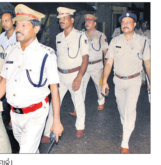
ପୋଲିସ୍ ଦଳ ପାର୍ଯ୍ୟଟନ ପାଇଁ ଉତ୍ସାହୀ।