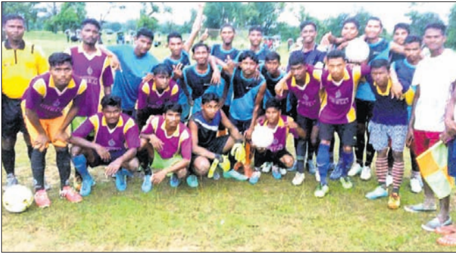
ବିଜୟୀ ଦଳର ଖେଳାଳିମାନେ ।

କସ୍ତିପଦା, ୨୮।୯(ଡି.ଏନ୍.ଏ.) ପାରିବାକୁ ଗ୍ରାଭବେକରର ସହାୟତା ନିଆଯାଇଥିଲା । ଏଥିରେ ୪-୩ ଗୋଲ୍ରେ ରଜତନଗର ଦଳ ଚାମ୍ପିୟନ ହୋଇଥିଲା ।