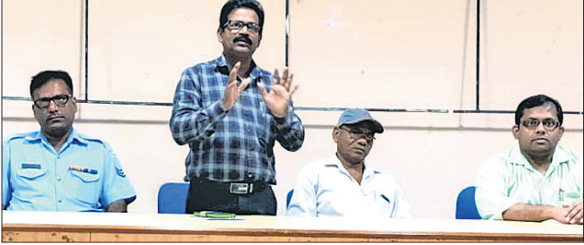
କର୍ମଶାଳାରେ ଉପସ୍ଥିତ ଅତିଥିଗଣ ।

ଭାରତୀୟ ବାୟୁସେନା ଭୁବନେଶ୍ୱର ପକ୍ଷରୁ ବାରିପଦା ମହାବିଦ୍ୟାଳୟ ଓ ଏମ୍ପିସି ସ୍ୱୟଂଶାସିତ ମହାବିଦ୍ୟାଳୟ ସମ୍ମିଳନୀ କକ୍ଷରେ କ୍ୟାରିୟର କାଉନସେଲିଂ କର୍ମଶାଳା ଅନୁଷ୍ଠିତ ହୋଇଯାଇଛି ।