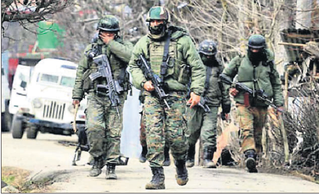
ଜଣ୍ଟି, ୨୮।୯ (ପି.ଟି.)