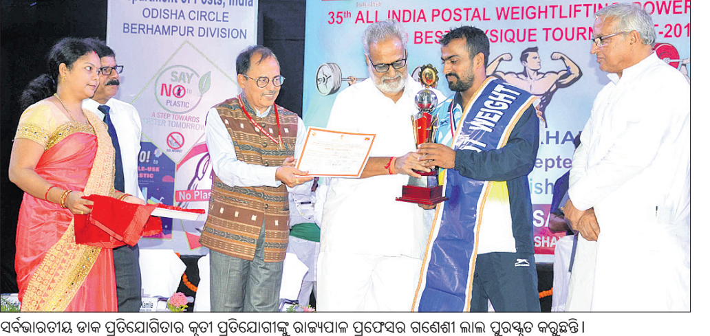
ସର୍ବଭାରତୀୟ ଡାକ ପ୍ରତିଯୋଗିତାର କୃତୀ ପ୍ରତିଯୋଗୀଙ୍କୁ ରାଜ୍ୟପାଳ ପ୍ରଫେସର ଗଣେଶୀ ଲାଲ ପୁରସ୍କୃତ କରୁଛନ୍ତି।

ଦେଇଥିଲେ ଓ ଭାରତ ପ୍ରଥମାର୍ଦ୍ଧ ମ୍ୟାଚ୍ ୨-୧ରେ ଅଗ୍ରଣୀ ହୋଇଥିଲା। ତୃତୀୟ କ୍ୱାର୍ଟରରେ ଭାରତ ଦଳର ପ୍ରଦର୍ଶନ କରିଥିଲା। ୩୫ତମ ମିନିଟ୍‌ରେ ଫରଫ୍‌ୱାର୍ଡ ରମନଦୀପ ସିଂ ଭାରତ ପାଇଁ ତୃତୀୟ ଗୋଲ ଘୋର କରିଥିଲେ। ଏହାପରେ ୪୧ତମ ମିନିଟ୍‌ରେ ଭ୍ରାଗ ଫୁଲର ହରମନପ୍ରୀତ ସିଂ ଏକ ପେନାଲ୍ଟି କର୍ନରକୁ ଗୋଲରେ ପରିଣତ କରି ଭାରତକୁ ୪-୧ ଗୋଲରେ ଅଗ୍ରଣୀ କରାଇଥିଲେ। ଅତିମ କ୍ୱାର୍ଟରରେ ଭାରତ ପଛକୁ ଫେରି ଚାଲି ନ ଥିଲା। ଏହାପରେ ତୃତୀୟ କ୍ୱାର୍ଟରରେ ଏସ୍‌ଜି ସୁନୀଲ ଏକ ସୁନ୍ଦର ଗୋଲ