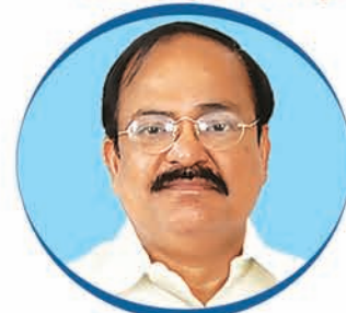
Shri M. Venkaiah Naidu Hon'ble Vice President of India