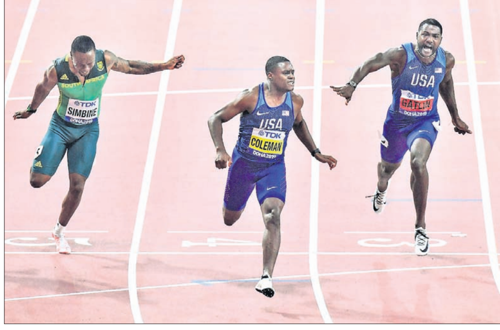
ଦୋହା: ପୁରୁଷ ୧୦୦ ମିଟର ରେସ୍ ଅବସରରେ ଆମେରିକା କ୍ରମିଆନ କୋଲମେନ (ମଝି) ।

କହିଛନ୍ତି। କେତେଟି ବିଶେଷତା ତ୍ରୁଣ୍ଡ କାରଣରୁ ତାଙ୍କ ବିରୋଧରେ ମାମଲା ଘୋଷଣା ହେବା ପରେ କୋଲମେନ ଦୋହାରେ ଦୈନିକ ସୁଯୋଗ ହାସଲ କରିଥିଲେ। ବୋଲ୍‌କ୍ ଉତ୍ତରାଧିକାରୀ ରୂପେ କୋଲମେନଙ୍କୁ ବିବେଚନା କରାଯାଉଥିବାରୁ ଜନସନ ଏହାକୁ ଗ୍ରହଣ କରିନାହାନ୍ତି। କୌଣସି ପ୍ରକାର ଚୋପି ମାମଲାରେ ପ୍ରତ୍ୟକ୍ଷ ବା ପରୋକ୍ଷଭାବେ କଡିତଥିବା ଆଥଲେଟିକ୍ସ ପ୍ରଶଂସକ ଗ୍ରହଣ କରିବେ ନାହିଁ ବୋଲି ଜନସନ ବିବିଧିକୁ ସମାପନ କରିବା ଅବସରରେ କହିଥିଲେ। ତେବେ ପ୍ରଦର୍ଶନ ମାଧ୍ୟମରେ ସୁଁ ନିଜକୁ ପ୍ରମାଣିତ କରିବି ଓ ଜଳ ତଥା ପ୍ରଶଂସକମାନେ ମଧ୍ୟ ପ୍ରଦର୍ଶନ ଭିତ୍ତିରେ ମୋ ପ୍ରତିଭାକୁ ସ୍ୱୀକାର କରିବେ ବୋଲି କୋଲମେନ କହିଛନ୍ତି।