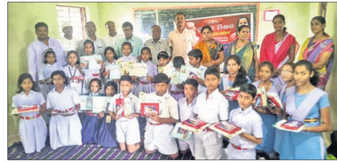
ପ୍ରତିଯୋଗିତାରେ ଭାଗ ନେଇଥିବା ଛାତ୍ରାଛାତ୍ରୀଙ୍କ ସହ ଶିକ୍ଷୟିତ୍ରୀ ଶିକ୍ଷକ ଓ ଅନ୍ୟମାନେ ।

ଅନୁଗୋଳ ପ୍ରଜ୍ଞାନ ମିଶନ ପକ୍ଷରୁ ଗୀତା ଆବୃତ୍ତି ପ୍ରତିଯୋଗିତା ଛେଡ଼ିପଦା ସରସ୍ୱତୀ ଶିଶୁ ମନ୍ଦିରଠାରେ ଅନୁଷ୍ଠିତ ହୋଇଯାଇଛି । ଅବସରପ୍ରାପ୍ତ ସଂସ୍କୃତ ହୋଇଯାଇଛି । ଅବସରପ୍ରାପ୍ତ ସଂସ୍କୃତ ହୋଇଯାଇଛି । ଅବସରପ୍ରାପ୍ତ ସଂସ୍କୃତ ହୋଇଯାଇଛି ।