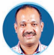
Shri Jyoti Prakash Panigrahi Hon'ble Minister of Tourism & Odia Language, Literature & Culture, Govt. of Odisha