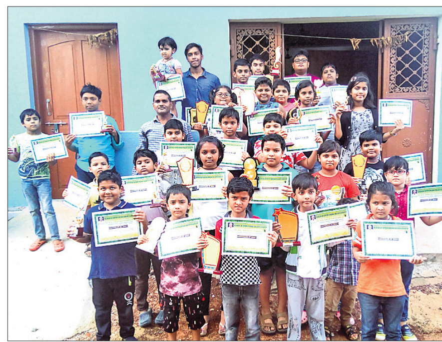
ଭୁବନେଶ୍ୱର: ରବିବାର ଅନୁଷ୍ଠିତ ସ୍କୁଲ ଓପନ ଚେସ୍ କୃତୀ ପ୍ରତିଯୋଗୀମାନେ ପୁରସ୍କାର ସହ

କ୍ରିକେଟରେ ବିଜୟ ଲକ୍ଷ୍ୟର ପିଛା କରୁଥିବାବେଳେ ଅଧିନାୟକଙ୍କ ସର୍ବାଧିକ ବ୍ୟକ୍ତିଗତ ଷ୍ଟ୍ରାଇକ୍ସ ୧୦୧୫, ଇଂଲଣ୍ଡ ବିପକ୍ଷରେ ୯୦ ଓ ଫ୍ଲୋଇଡ଼ିଂର ବିଜ୍ଞ ରେଲ (୨୦୦୯, ଅଷ୍ଟ୍ରେଲିଆ ବିପକ୍ଷରେ ୮୮) ରହିଛନ୍ତି।