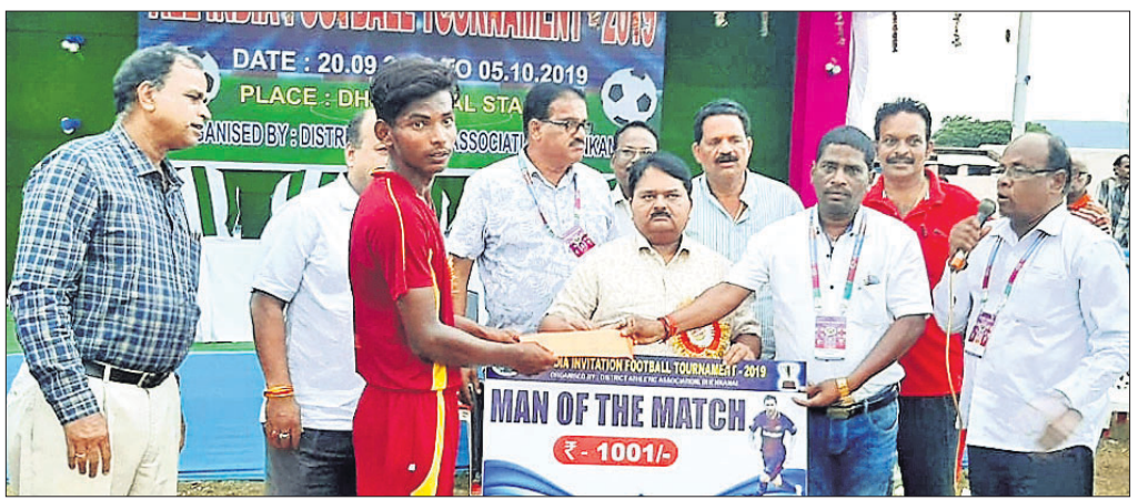
ଶ୍ରେଷ୍ଠ ପ୍ରତିଯୋଗୀଙ୍କୁ ମ୍ୟାଚ ଅଫ୍ ଦି ମ୍ୟାଚ ପୁରସ୍କାର ପ୍ରଦାନ କରାଯାଇଛି।