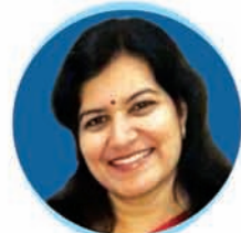
Smt. Aparajita Sarangi Hon'ble Member of Parliament (L.S.), Bhubaneswar