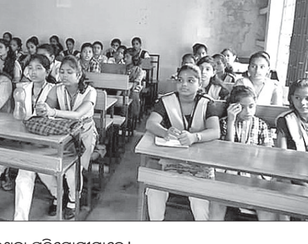
ପ୍ରତିଯୋଗିତାରେ ଭାଗ ନେଇଥିବା ପ୍ରତିଯୋଗୀମାନେ।