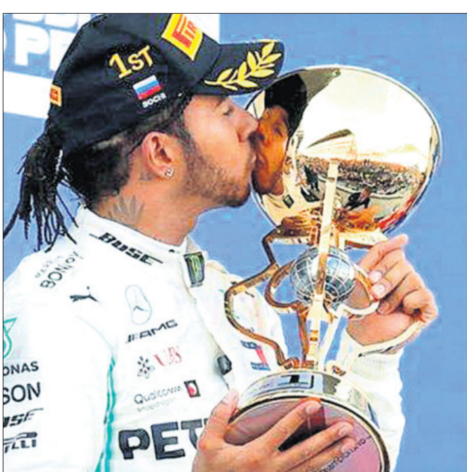
ଗ୍ରାଁ ପ୍ରିକୁ ଜିତିବାର ପରେ ହାମିଲଟନ୍

ମର୍ସିଡିଜ୍ ଡ୍ରାଇଭର ଲୁଇସ ହାମିଲଟନ୍ ରବିବାର ଅନୁଷ୍ଠିତ ରୁଷିଆନ ଗ୍ରାଁ ପ୍ରି ଫର୍ମୁଲା ଓନ୍ ମୋଟର ରେସିଂରେ ପ୍ରଥମ ସ୍ଥାନ ଅଧିକାର କରିଛନ୍ତି।