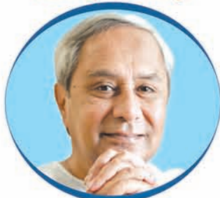
Shri Naveen Patnaik Hon'ble Chief Minister of Odisha