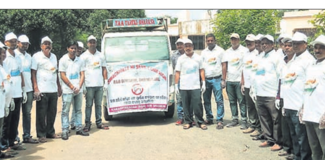
ସଫେଇ କାର୍ଯ୍ୟକ୍ରମରେ ସାମିଲ ହୋଇଥିବା ପୂର୍ବ ବିଭାଗ କର୍ମଚାରୀ ଏବଂ ଅନ୍ୟମାନେ