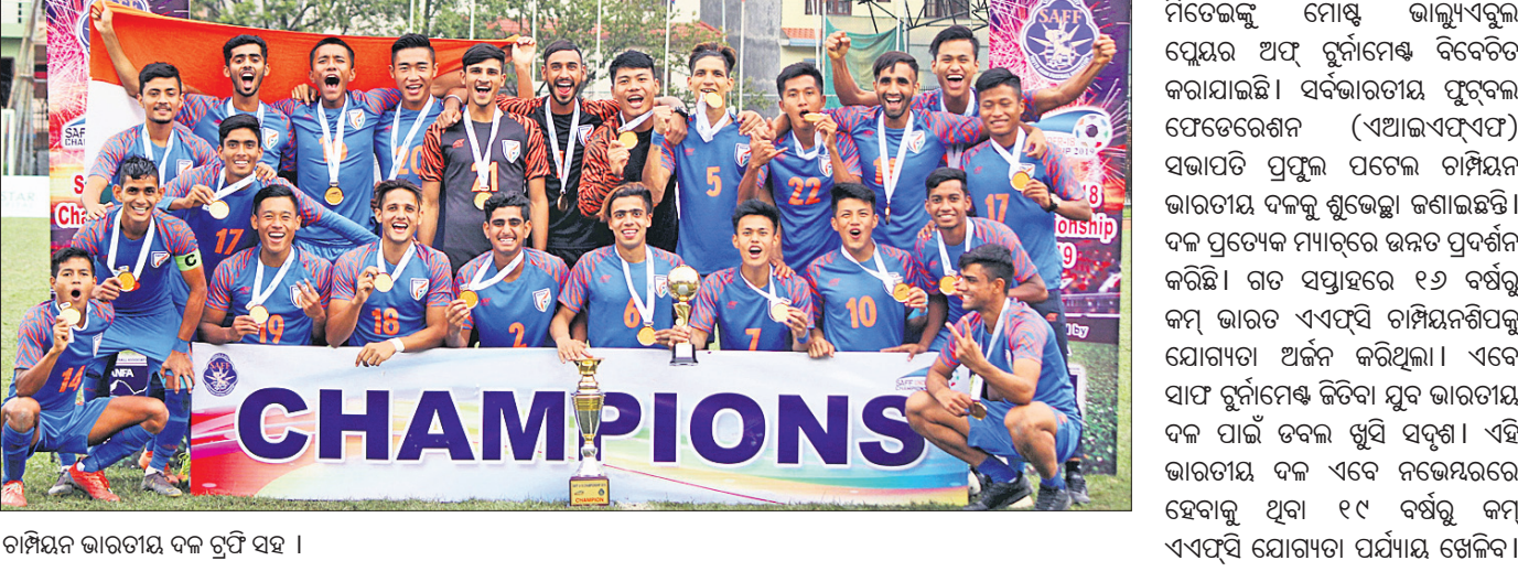
ଚାମ୍ପିୟନ ଭାରତୀୟ ଦଳ ତ୍ରୁପ୍ତି ସହ ।