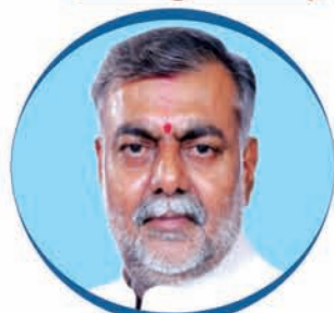
Shri Prahlad Singh Patel Hon'ble Minister of State (Ind.) for Culture and Tourism, Govt. of India