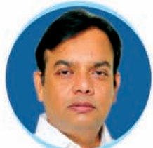
Shri S. K. Rout Hon'ble MLA, Bhubaneswar North