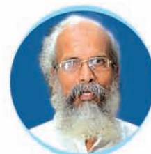
Shri P. C. Sarangi Hon'ble Minister of State for Animal Husbandry, Dairying & Fisheries and MSME, Govt. of India