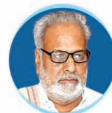
Prof. Ganeshi Lal Hon'ble Governor of Odisha