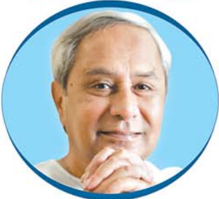
Shri Naveen Patnaik Hon'ble Chief Minister of Odisha