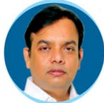
Shri S. K. Rout Hon'ble MLA, Bhubaneswar North