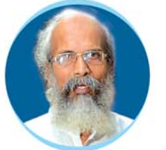
Shri P. C. Sarangi Hon'ble Minister of State for Animal Husbandry, Dairying & Fisheries and MSME, Govt. of India