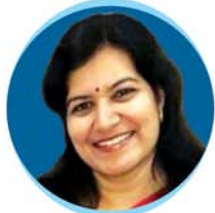
Smt. Aparajita Sarangi Hon'ble Member of Parliament (L.S.), Bhubaneswar