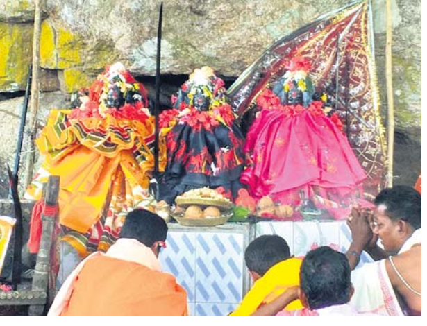
ପୂଜାର୍ଚ୍ଚନା କରାଯାଇଛି। ଦେବାଙ୍କୁ ଆବାହନ କରି ସ୍ୱତନ୍ତ୍ରତା ପୂଜାପାଠ କରିଥାନ୍ତି । ଇଷ୍ଟଦେବାଙ୍କ ଭାବେ ମୁନ୍ଦର ବ୍ୟବହୃତ ଅସ୍ତ୍ରଶସ୍ତ୍ରକୁ ସ୍ୱତନ୍ତ୍ର ଗୁପ୍ତ ପୂଜା ହୋଇଥାଏ ।

ଉମରକୋଟ ବ୍ଲକ୍ ଐତିହାସିକ ପୋଡ଼ାଗଡ଼ ପୀଠରେ ପ୍ରାକ୍ ଦଶହରା ମହାସମାରୋହରେ ପାଳିତ ହୋଇଯାଇଛି । ଦୁର୍ଗାମନ୍ଦିର, ଭଙ୍ଗରାମ ମନ୍ଦିର, ଭୈରବ ମନ୍ଦିର, ଚାଉଁରଥା ମନ୍ଦିର, ଗାଦିମା ମନ୍ଦିର ଓ ମଙ୍ଗଳା ମନ୍ଦିରରେ ଏହି ନବରାତ୍ରୀ ପାଳିତ ହେଉଛି । ଏହି ଉତ୍ସବରେ ୯୩ଟି ଗ୍ରାମର ପୂଜକ ଓ ଭକ୍ତଙ୍କ ସମେତ ପଡୋଶୀ ଛତିଶଗଡ ଭାଙ୍ଗ୍ୟର ଶ୍ରଦ୍ଧାଳୁମାନେ ଯୋଗ ଦେଇଥାନ୍ତି । ଏହାର ସ୍ୱତନ୍ତ୍ରତା ଏହା ଯେ ନଳଦଂଶ ରାଜାମାନେ ନିଜ ପିତୃପୁତୁଷ୍ପକ ଶ୍ରାଦ୍ଧ ଦେବା ସହିତ ମା' ଦୁର୍ଗା ଓ ତାଙ୍କର ଇଷ୍ଟ