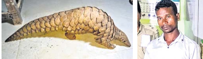
ଉଦ୍ଧାର ବକ୍ରକାପ୍ତା ଏବଂ ଗିରଫ ଅଭିଯୁକ୍ତ ।