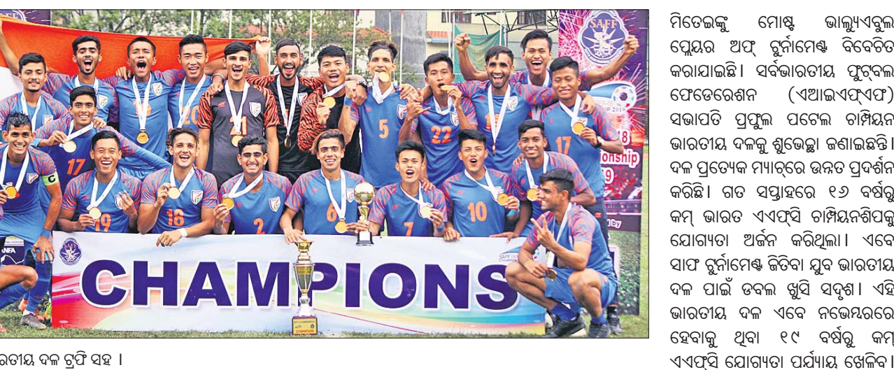
ଚାମ୍ପିୟନ ଭାରତୀୟ ଦଳ ଗ୍ରୁପ୍ ସହ ।