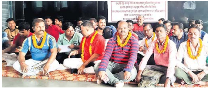
ଯୁବ ବିକାଶ ପରିଷଦର ସଦସ୍ୟମାନେ ଅନଶନରେ ବସିଛନ୍ତି ।

ଜୁନାଗଡ଼-ଭୁବନେଶ୍ୱର ଏକ୍ସପ୍ରେସ ଗତିପଥ ପରିବର୍ତ୍ତନ ପ୍ରସ୍ତାବକୁ ବିରୋଧ କରାଯାଇଛି । ଏହାର ପ୍ରତିବାଦରେ ରାୟଗଡ଼ା ଯୁବ ବିକାଶ ପରିଷଦ ତରଫରୁ ରାୟଗଡ଼ା ଷ୍ଟେଶନ ପରିସରରେ ରବିବାର ୧୨ ଘଣ୍ଟା ଅନଶନ କରାଯାଇଛି ।