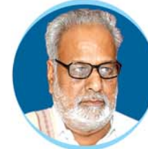
Prof. Ganeshi Lal Hon'ble Governor of Odisha