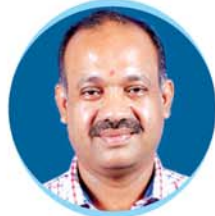
Shri Jyoti Prakash Panigrahi Hon'ble Minister of Tourism & Odia Language, Literature & Culture, Govt. of Odisha