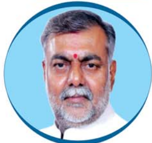
Shri Prahlad Singh Patel Hon'ble Minister of State (Ind.) for Culture and Tourism, Govt. of India