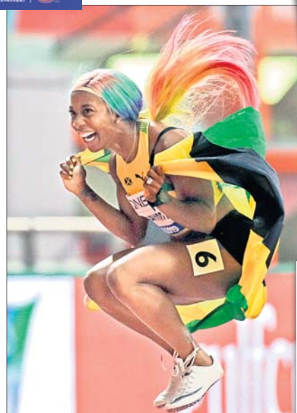
ମହିଳା ୧୦୦ ମିଟରରେ ସ୍ୱର୍ଣ୍ଣ ଜିତିଥିବା ଜାମାଇକାର ଶେଲି ଆନ୍ ପ୍ରାସର ପ୍ରାୟତ୍ତ।