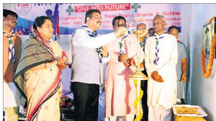
ସୁବିକଳା କାର୍ଯ୍ୟକ୍ରମରେ କେନ୍ଦ୍ରମନ୍ତ୍ରୀ ଧର୍ମେନ୍ଦ୍ର ପ୍ରଧାନ ଓ ଅନ୍ୟମାନେ।

୨୦୩୦ ବୁଦ୍ଧି ଭାରତକୁ ବିଶ୍ୱରେ ୧ନମ୍ବର ଦେଶ ବନାଇବା ପାଇଁ ଲକ୍ଷ୍ୟ ରଖାଯାଇଥିବା ବେଳେ ଏ ଦିଗରେ ସୁବିକଳାକୁ କାମ କରିବାର ଆବଶ୍ୟକତା ରହିଛି। ସୋପାନର ସୁବିକଳାରେ ଭାରତ ସ୍ୱାଗତ ଏବଂ ଗାଜ୍‌ବେ ରାଷ୍ଟ୍ରୀୟ ପୁସ୍ତାଳୀୟ ତରଫରୁ ରୋଭର୍ସ ଓ ରୋଷ୍‌ସିଏ ପାଇଁ ଆୟୋଜିତ ହେଉଥିବା ସୁବିକଳା କାର୍ଯ୍ୟକ୍ରମରେ ଯୋଗଦେଇ କେନ୍ଦ୍ରମନ୍ତ୍ରୀ ଧର୍ମେନ୍ଦ୍ର ପ୍ରଧାନ ଏହା କହିଛନ୍ତି। ଏହି ଅବସରରେ ଧର୍ମେନ୍ଦ୍ର କହିଛନ୍ତି ଯେ, ବର୍ତ୍ତମାନ ପ୍ରତି କ୍ଷଣରେ ଲୋକମାନେ ଭବିଷ୍ୟତ କଥା ଚିନ୍ତା କରୁଛନ୍ତି। ସୁବିକଳାରେ ଏବେ ଭବିଷ୍ୟତକୁ ଦେଖି ଗୁଆ ଭାରତ ଗରିବର କଳ୍ପନା କରିବା ଦରକାର। ସୁବିକଳା ଭାରତକୁ ବିଶ୍ୱର ଅଗ୍ରଣୀ ଦେଶଭାବେ ବନାଇବା ଦିଗରେ ଚିନ୍ତା କରିବାର ଆବଶ୍ୟକତା ରହିଛି। ବିଦେଶ ବିଶ୍ୱପୁଞ୍ଜ ସମୟରେ କାମଚାଳନ ହିରୋସାମା ଓ ନାଗାସାକି ଭଳି ଦୁର୍ଭିଦି ବତ ସହର ଧୂସ୍ୱବିଧୁସ୍ତ ହୋଇପାରିବ। ସେହି ସମୟରୁ ଏପର୍ଯ୍ୟନ୍ତ କାମଚାଳନ ଦିଗ ଦୃଢ଼ ଲକ୍ଷ୍ୟଶୀଳ ଓ ନିଷ୍ଠାବଳ କାରଣରୁ ଏବେ ବିକଶିତ ରାଷ୍ଟ୍ରଭାବେ