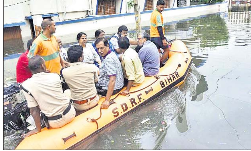
ବିହାର ଉପମୁଖ୍ୟମନ୍ତ୍ରୀ ସୁଶୀଳ କୁମାର ମୋଦି ଓ ତାଙ୍କ ପରିବାର ସଦସ୍ୟଙ୍କୁ ଉଦ୍ଧାର କରାଯାଇଛି।

ବିହାର ଓ ଉତ୍ତରପ୍ରଦେଶରେ ବର୍ଷାକଳିତ ମୃତ୍ୟୁସଂଖ୍ୟା ୧୩୪ରେ ପହଞ୍ଚିଛି। ଲଗାଣ ବର୍ଷା ଯୋଗୁ ବୁଲ ରାଜ୍ୟରେ ବନ୍ୟା ଦେଖାଦେବାକୁ ଛୁଟି ଗମ୍ଭୀର ରୂପ ଧାରଣ କରିଛି। ଅନେକ ଲୋକ ପାଣିଯୋଗରେ ରହିଥିବାବେଳେ ବର୍ଷା କିଛିଦିନ ଲାଗି ରହିବ ବୋଲି ପାଣିପାଗ ବିଭାଗ ତେଜାବନା ଦେଇଛି। ବିହାର ଉପମୁଖ୍ୟମନ୍ତ୍ରୀ ସୁଶୀଳ କୁମାର ମୋଦି ଓ ତାଙ୍କ ପରିବାର ସେମାନଙ୍କ ପାଟନା ବାସଭବନରେ ଜଳବନ୍ଦୀ ରହିଥିବାବେଳେ ସେମାନଙ୍କ ସେମାନଙ୍କୁ ଏନ୍‌ଡିଆର୍‌ଏଫ୍ ଟିମ୍ ବୋର୍ ସହାୟତାରେ ଉଦ୍ଧାର କରିଛି। ବିହାର ସରକାର ବାୟୁସେନା ହେଲିକପ୍ଟରରେ ପ୍ରପାଡ଼ିତଙ୍କୁ ରିଲିଫ୍ ଯୋଗାଇବା ଲାଗି ପ୍ରୟାସ ଆରମ୍ଭ କରିଛନ୍ତି।