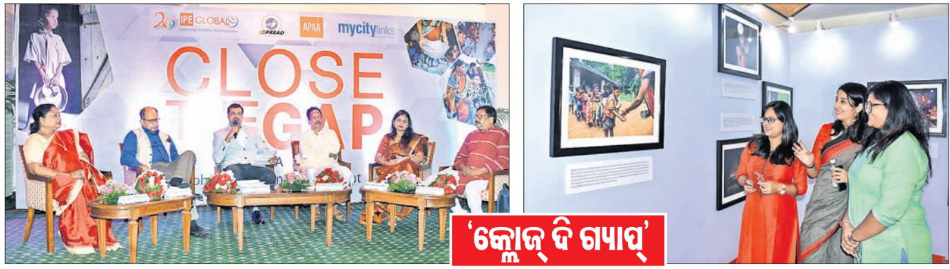
କାର୍ଯ୍ୟକ୍ରମରେ ଉପସ୍ଥିତ ଅତିଥି