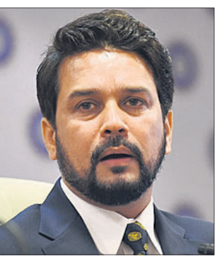
କରୁଥିବା କୌଣସି ସଂସ୍କାର ରୁକ୍ଷପୂର୍ଣ୍ଣ ଭୂମିକା ରହିଥାଏ ବୋଲି ଅନୁରାଗ କହିଛନ୍ତି।

ପଞ୍ଜାବ ମହାରାଷ୍ଟ୍ର ସମବାୟ (ପିଏମ୍‌ସି) ବ୍ୟାଙ୍କରେ ହୋଇଥିବା ବଡ଼ ଧରଣର ଠକେଇ ବ୍ୟାଙ୍କ ଶିଳ୍ପର ଆଖି ଖୋଲିଛି।