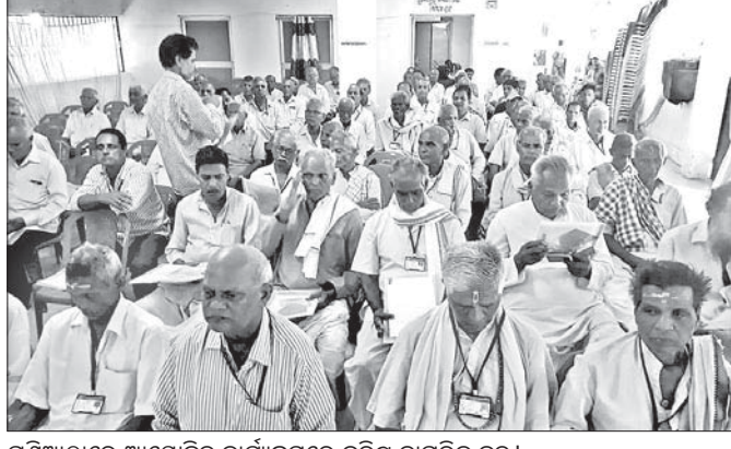
ଗଣିଆଠାରେ ଆୟୋଜିତ କାର୍ଯ୍ୟକ୍ରମରେ ବରିଷ୍ଠ ନାଗରିକ ବୃନ୍ଦ ।

ଗଣିଆ, ୧୧୧୦(ଡି.ଏନ.ଏ.) ସାମାଜିକ ସୁରକ୍ଷା ଓ ଭିକ୍ଷାମୁକ୍ତ ସମାଜର ପ୍ରତିଷ୍ଠା ପାଇଁ ବରିଷ୍ଠ ନାଗରିକମାନେ ସମାଜର ପ୍ରକୃତ ମାର୍ଗଦର୍ଶକ ।