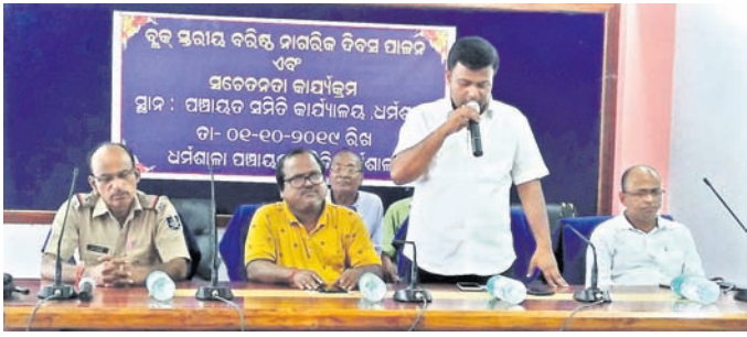
ଭୁବନେଶ୍ୱର, ବରିଷ୍ଠ ନାଗରିକ ଦିବସରେ ଯୋଗ ଦେଇଥିବା ଅତିଥି ।

ଧର୍ମଶାଳା, ୧୧୦(ଡି.ଏନ୍.ଏ.) ଧର୍ମଶାଳା ରୁକ୍ମ ପାଣିଗ୍ରାହୀଙ୍କୁ ପଞ୍ଜୀକୃତ କରିବା ପାଇଁ ଉଦ୍ଦେଶ୍ୟରେ ଯୋଗାଯୋଗ କରାଯାଇଛି ।