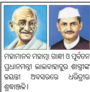
ମହାତ୍ମା ଗାନ୍ଧୀ ଓ ପୂର୍ବତନ ପ୍ରଧାନମନ୍ତ୍ରୀ ଲାଲବାହାଦୂର ଶାସ୍ତ୍ରୀଙ୍କ କନ୍ୟା ଅବସରରେ ଧରତ୍ରୀର ଶ୍ରଦ୍ଧାଞ୍ଜଳି।

ପ୍ରତିଦିନ ୧୦ ଲୋକଙ୍କ ମତାମତ ନେବେ ମୁଖ୍ୟମନ୍ତ୍ରୀ