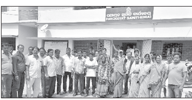
ରୁକ୍ମ କାର୍ଯ୍ୟାଳୟରୁ ଦସ୍ତଖତ ଯାଞ୍ଚ ପାଇଁ ଆସିଥିବା ଓଡ଼ିଆ ସଭ୍ୟଙ୍କ ଓ ଅନ୍ୟମାନେ ।

କୋରୋଇ, ୧୧୦(ସ.ପ୍ର.) କୋରୋଇ ରୁକ୍ମ ଅନ୍ତର୍ଗତ ତନ୍ତ୍ରୀ ପଞ୍ଚାୟତ ସରପଞ୍ଚଙ୍କ ବିରୋଧରେ ୯ ଜଣ ଓଡ଼ିଆ ସଭ୍ୟଙ୍କ ଉପକଳାପାଳକ ନିକଟରେ ଅନାସ୍ଥା ପ୍ରସ୍ତାବ ଆଣିଥିଲେ ।