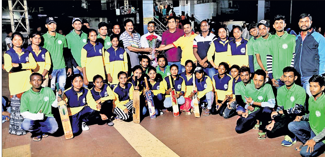
ଜାତୀୟ କ୍ରୀଡ଼ା ରେନିସ୍ ବଲ୍ କ୍ରିକେଟ୍ ପାଇଁ ମନୋନୀତ ଓଡ଼ିଶା ଦଳ ।

ଭୁବନେଶ୍ୱର, ୧୮୧୦(କ୍ରୀଡ଼ା ପ୍ରତିନିଧି) ମହାରାଷ୍ଟ୍ର ନାଗପୁରରେ ୨୭ତମ ଜାତୀୟ କ୍ରୀଡ଼ା ରେନିସ୍ ବଲ୍ କ୍ରିକେଟ୍ ପ୍ରତିଯୋଗିତା ଚଳିତମାସ ୨ ରୁ ୫ ତାରିଖ ପର୍ଯ୍ୟନ୍ତ ଅନୁଷ୍ଠିତ ହେବ।