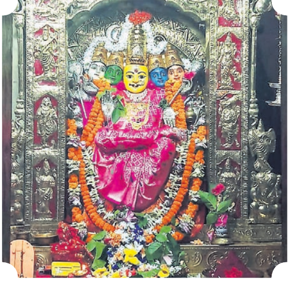
ଦେଶାନ୍ତର ସହର କୁଦଳି ଗାନ୍ଧୀନଗର ମା' କନକପୁରୀଙ୍କ ପୀଠରେ ନବରାତ୍ର ପୂଜା ଉତ୍ସବ ଅବସରରେ ମଙ୍ଗଳବାର ଠାକୁରାଣୀଙ୍କ ଗାୟତ୍ରୀ ବେଶ।