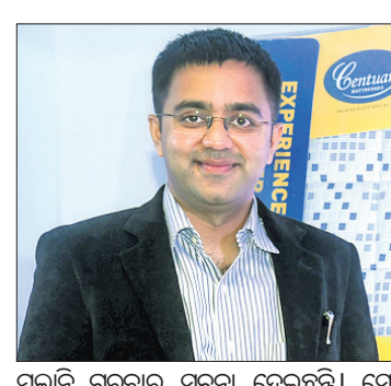
ମଲାନୀ ଟ୍ରଷ୍ଟର ସୁନିର୍ଦ୍ଧା ଦେଇଛନ୍ତି। ସେ କହିଛନ୍ତି, ଏହି ଯୁନିଟରେ ୫୫ କୋଟି ଟଙ୍କା ପୂଞ୍ଜି ନିବେଶ ହେବ। ୧୫ ମାସ ମଧ୍ୟରେ

ଭୁବନେଶ୍ଵର, ୩-୧୦ (ସ୍ଵାଭା) ଶ୍ରୀ ମଲାନୀ ଟ୍ରଷ୍ଟ ପକ୍ଷରୁ ପ୍ରସ୍ତାବିତ ଫୋର୍ମ୍ ସୁନିର୍ଦ୍ଧା ଖୋର୍ଦ୍ଧା ନିକଟସ୍ଥ କମ୍ପାଉଣ୍ଡରେ ସ୍ଥାପନ କରାଯିବ।