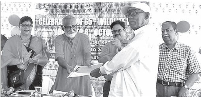
କପିଳାସ ଚିଡ଼ିଆଖାନାରେ ବନ୍ୟପ୍ରାଣୀ ସପ୍ତାହ ପାଳନ କରାଯାଇଛି ।