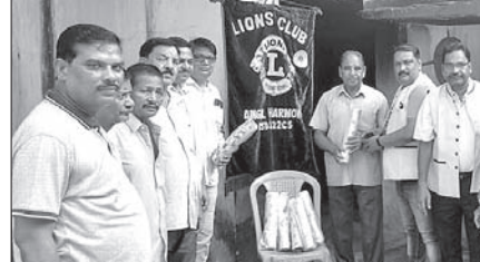
ପ୍ରଦାନ କରାଯିବ ବୋଲି କୁଳ ପକ୍ଷରୁ କୁଳ ଚନ୍ଦ୍ରପୁର ଉତ୍କଳ ମନ୍ଦିରକୁ ୨୫୫ଟି ପୁସ୍ତକ ଉପକ୍ରମିତ ହୋଇଛି । ପ୍ଲାଷ୍ଟିକ ଛିନିଷକୁ ବିକଳ ବର୍ଗନ କରାଯିବ ଯେ ନେଇ ଲୋକମାନଙ୍କୁ ସଚେତନତା କରାଯାଇଥିଲା । ପ୍ରଥମ ପର୍ଯ୍ୟାୟରେ କୁଳ ଚନ୍ଦ୍ରପୁର ଉତ୍କଳ ମନ୍ଦିରକୁ ୨୫୫ଟି ପୁସ୍ତକ ଉପକ୍ରମିତ ହୋଇଛି ।

ପ୍ରାଥମିକ କୁଳ ଅନୁବୋଧ ହାରୋମନି ପକ୍ଷରୁ ବର୍ଷାପାଇଁ କୁଳ କୁଳାଡ଼ି ଶିବ ମନ୍ଦିର ଓ ଅଲେଖ ମନ୍ଦିରରେ ପ୍ଲାଷ୍ଟିକ ପୁସ୍ତକ ଅଭିଯାନ ଆରମ୍ଭ ହୋଇଛି । ପ୍ଲାଷ୍ଟିକ ଛିନିଷକୁ ବିକଳ ବର୍ଗନ କରାଯିବ ଯେ ନେଇ ଲୋକମାନଙ୍କୁ ସଚେତନତା କରାଯାଇଥିଲା । ପ୍ରଥମ ପର୍ଯ୍ୟାୟରେ କୁଳ ଚନ୍ଦ୍ରପୁର ଉତ୍କଳ ମନ୍ଦିରକୁ ୨୫୫ଟି ପୁସ୍ତକ ଉପକ୍ରମିତ ହୋଇଛି । ପ୍ଲାଷ୍ଟିକ ଛିନିଷକୁ ବିକଳ ବର୍ଗନ କରାଯିବ ଯେ ନେଇ ଲୋକମାନଙ୍କୁ ସଚେତନତା କରାଯାଇଥିଲା । ପ୍ରଥମ ପର୍ଯ୍ୟାୟରେ କୁଳ ଚନ୍ଦ୍ରପୁର ଉତ୍କଳ ମନ୍ଦିରକୁ ୨୫୫ଟି ପୁସ୍ତକ ଉପକ୍ରମିତ ହୋଇଛି । ପ୍ଲାଷ୍ଟିକ ଛିନିଷକୁ ବିକଳ ବର୍ଗନ କରାଯିବ ଯେ ନେଇ ଲୋକମାନଙ୍କୁ ସଚେତନତା କରାଯାଇଥିଲା । ପ୍ରଥମ ପର୍ଯ୍ୟାୟରେ କୁଳ ଚନ୍ଦ୍ରପୁର ଉତ୍କଳ ମନ୍ଦିରକୁ ୨୫୫ଟି ପୁସ୍ତକ ଉପକ୍ରମିତ ହୋଇଛି । ପ୍ଲାଷ୍ଟିକ ଛିନିଷକୁ ବିକଳ ବର୍ଗନ କରାଯିବ ଯେ ନେଇ ଲୋକମାନଙ୍କୁ ସଚେତନତା କରାଯାଇଥିଲା ।