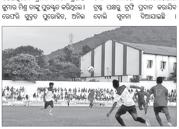
ଗୁରୁବାର ଅନୁଷ୍ଠିତ ବିତୀୟ ସେମି ଫାଇନାଲ ମ୍ୟାଚର ଏକ ଦୃଶ୍ୟ ।