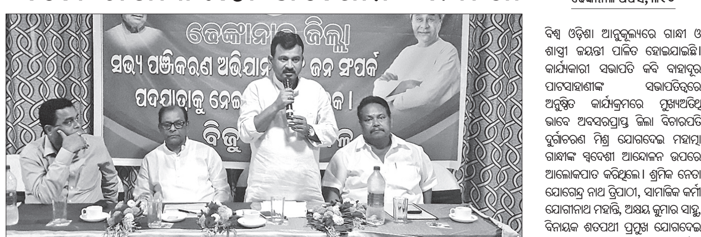
ବିଜେଡି ସଭ୍ୟ ପଞ୍ଜୀକରଣ ଅଭିଯାନର ସମାପ୍ତ ବୈଠକ ।