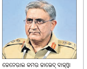
କେନେରାଲ କମର ଶାଭେଦ୍ ବାଜୁଝି