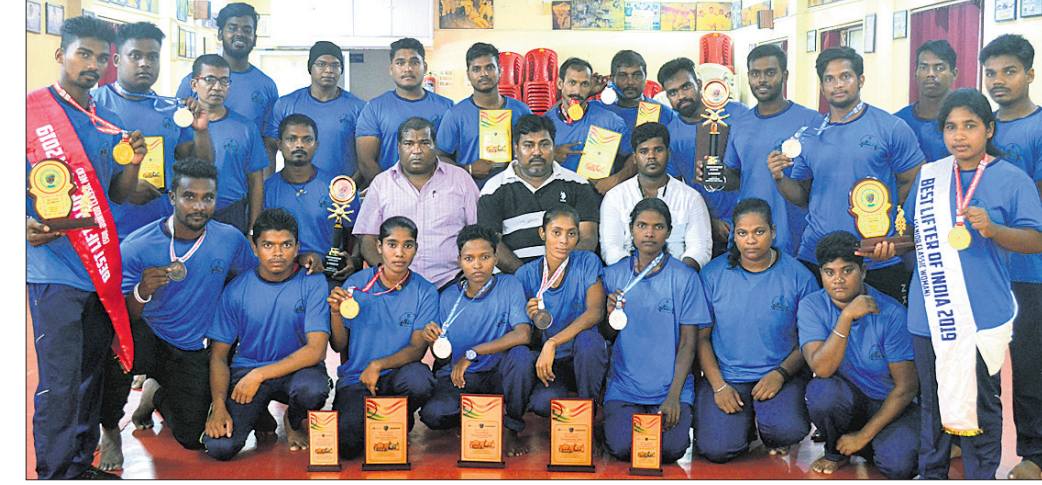
ଜାତୀୟ କ୍ଲବ୍ ଶକ୍ତି ଉଦ୍‌ଘାଟନରେ କୃତିତ୍ୱ ଅର୍ଜନ କରିଥିବା ଓଡ଼ିଶା ପ୍ରତିଯୋଗୀମାନେ କର୍ମକର୍ତ୍ତାଙ୍କ ସହ ।