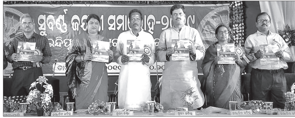
ଇନ୍ଦିପୁର ହାରସ୍ତୁଳ ସୁବର୍ଣ୍ଣ ଜୟନ୍ତୀ ଉତ୍ସବ ପାଳନ କରାଯାଇଛି ।