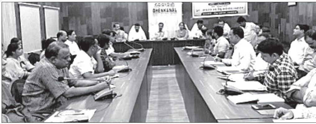
ଯୋଲିସ-ମାଜିଷ୍ଟ୍ରେଟ୍ ସମନ୍ବୟ ବୈଠକ ।

ଦେଶାନ୍ତରାଳ ଜିଲ୍ଲା କାର୍ଯ୍ୟାଳୟ ସମ୍ମିଳନୀ କକ୍ଷରେ ଗୁରୁବାର ଅପରାହ୍ନରେ ଜିଲ୍ଲାପ୍ରଧାନ ଯୋଲିସ-ମାଜିଷ୍ଟ୍ରେଟ୍ ସମନ୍ବୟ ବୈଠକ ଅନୁଷ୍ଠିତ ହୋଇଯାଇଛି ।