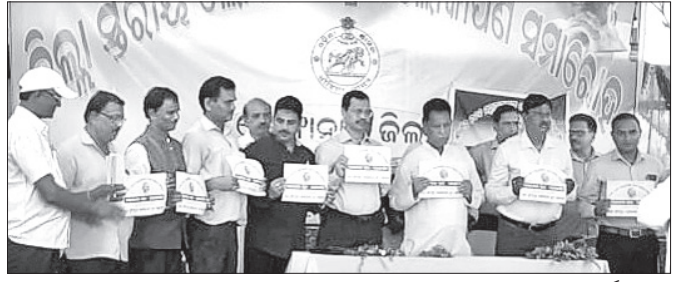
ରାୟନୃସିଂହପୁର ଗ୍ରାମକୁ ଲୋକକଳା ଗ୍ରାମ ଘୋଷଣା ଅବସରରେ ଆୟୋଜିତ କାର୍ଯ୍ୟକ୍ରମ ।